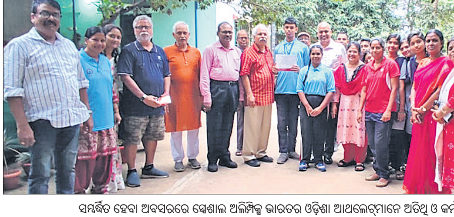
ସମ୍ବର୍ଦ୍ଧିତ ହେବା ଅବସରରେ ସ୍ୱେଚ୍ଛାଳ ଅଲିମ୍ପିକ୍ସ ଭାରତର ଓଡ଼ିଶା ଆଧୁନିକ ସମ୍ବର୍ଦ୍ଧିତ ଅତିଥି ଓ କର୍ମଚାରୀଙ୍କ ଗହଣରେ।

ଅଲିମ୍ପିକ୍ସ କୃତୀ ଆଧୁନିକ ସମ୍ବର୍ଦ୍ଧିତ ଯୋଜନା ଅଟେ ଯାହା ଓଡ଼ିଶାରେ ଅଲିମ୍ପିକ୍ସ ଖେଳାଇବା ପାଇଁ ଉତ୍ସାହ ଦେଖାଇଛି। ଏହା ଏକ ଉପସ୍ଥାପନା ଯୋଜନା ଅଟେ ଯାହା ଓଡ଼ିଶାରେ ଅଲିମ୍ପିକ୍ସ ଖେଳାଇବା ପାଇଁ ଉତ୍ସାହ ଦେଖାଇଛି।