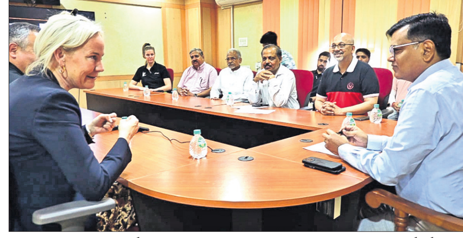
ଟିଟି ଖେଳାଳିଙ୍କୁ ନୂତନ ପଦକ୍ଷେପରେ ପ୍ରଶିକ୍ଷଣ ଦିଆଯିବ।

ଟିଟି ଖେଳାଳିଙ୍କୁ ନୂତନ ପଦକ୍ଷେପରେ ପ୍ରଶିକ୍ଷଣ ଦିଆଯିବ। ଏହା ଏକ ଉପସ୍ଥାପନା ଯୋଜନା ଅଟେ ଯାହା ଟିଟି ଖେଳାଳିଙ୍କୁ ନୂତନ ପଦକ୍ଷେପରେ ପ୍ରଶିକ୍ଷଣ ଦିଆଯିବ।