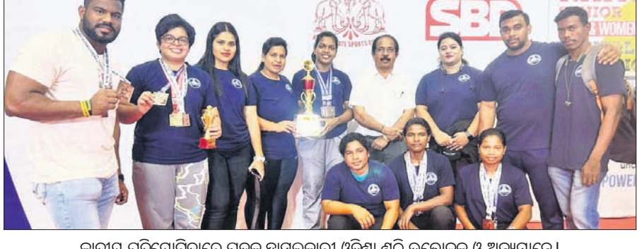
ଜାତୀୟ ପ୍ରତିଯୋଗିତାରେ ପଦକ ହାସଲକାରୀ ଓଡ଼ିଶା ଶକ୍ତି ଉତ୍ତୋଳକ ଓ ଅନ୍ୟମାନେ।

କେନ୍ଦ୍ରୀୟ ଶକ୍ତି ଉତ୍ତୋଳନରେ ଓଡ଼ିଶାକୁ ୫ ପଦକ ମିଳିଛି। ଓଡ଼ିଶା ପ୍ରତିନିଧିଙ୍କ ଦ୍ୱାରା ପ୍ରଥମ ଶ୍ରେଣୀରେ ଖେଳିବା ପାଇଁ ଉତ୍ସାହ ଦେଖାଇଛନ୍ତି।