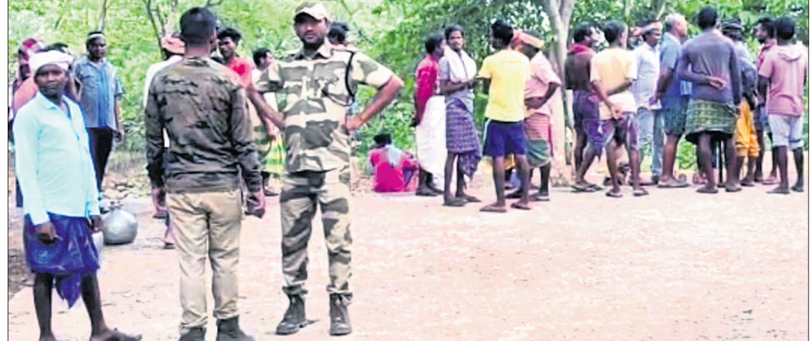
ଉଦ୍ୟୋଗୀ ଗ୍ରାମବାସୀ ହୋଇଛି କଲୁକ୍ତି।

ଗ୍ରାମବାସୀ ଅଟକ ରଖିଥିଲେ। ପୁରତ ଲୋଧା ସମ୍ପ୍ରଦାୟ ପରିବାରକୁ ଶିଳିପିପାଳରୁ ଉଦ୍ଧୃତ କରିବା ଜିଦ୍ରେ ଅତି ବସିଥିଲେ।