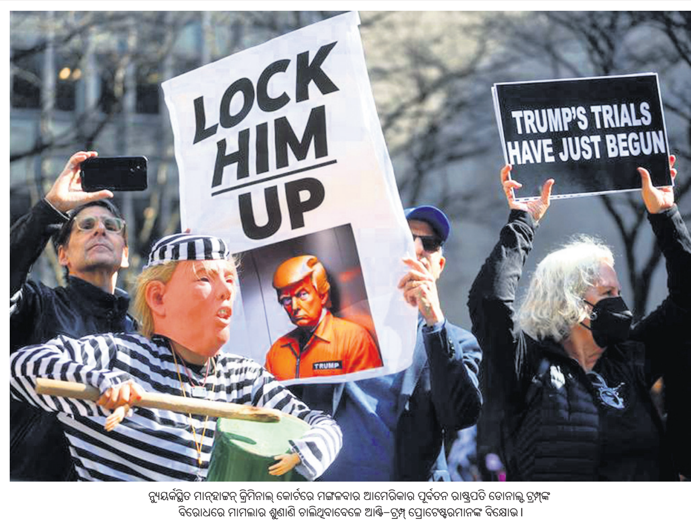
ଦୁଇକର୍ମରେ ମାନ୍ଦହାଜର୍ କ୍ରିମିନାଲ କୋର୍ଟରେ ମଙ୍ଗଳବାର ଆମେରିକାର ପୂର୍ବତନ ରାଷ୍ଟ୍ରପତି ତୋନାଲ୍ ଟ୍ରମ୍ପଙ୍କ ବିରୋଧରେ ମାମଲାର ଶୁଣାଣି ଚାଲିଥିବାବେଳେ ଆର୍ବି-ଟ୍ରମ୍ପ ପ୍ରେଚେସ୍ଟରମାନଙ୍କ ବିରୋଧରେ ।