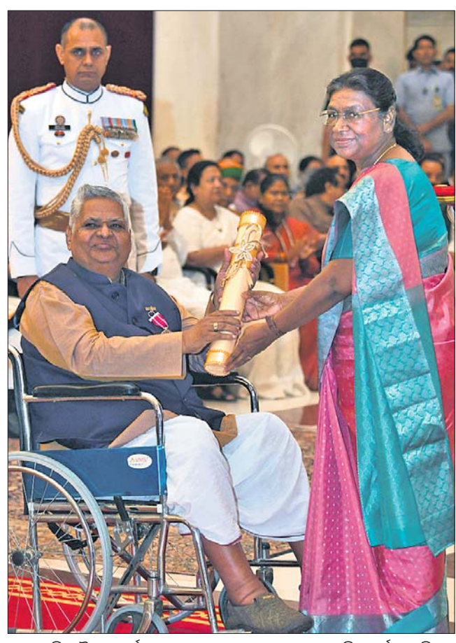
ରାଷ୍ଟ୍ରପତି ଡ୍ରୌପଦୀ ମୁର୍ମୁଙ୍କଠାରୁ ପଦ୍ମଶ୍ରୀ ପୁରସ୍କାର ଗ୍ରହଣ କରୁଛନ୍ତି ଅନ୍ତର୍ଯ୍ୟାମୀ ମିଶ୍ର।