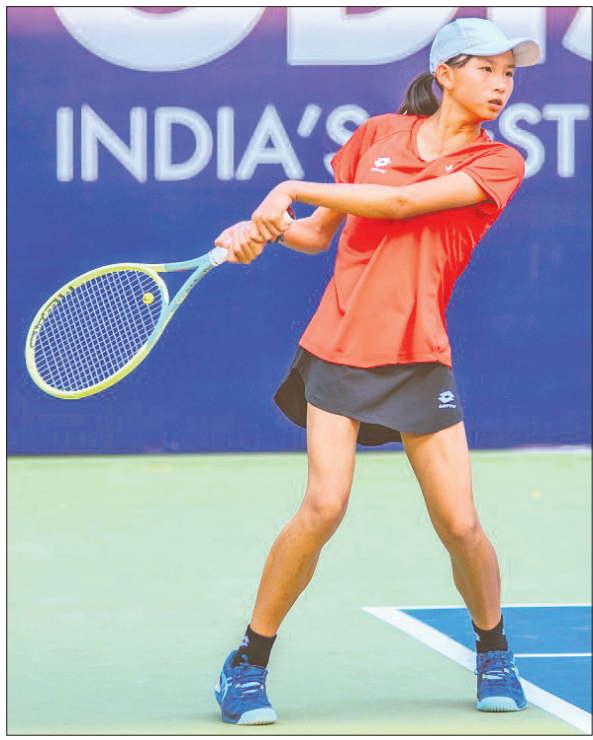
ଚେନିସ ଖେଳିବା ଅବସରରେ ଜଣେ ପ୍ରତିଯୋଗୀ।

୨-୫, ୬-୯, ୧୦-୧୩ ବର୍ଷର ପିଲାଙ୍କୁ ଚେନିସ ଖେଳାଇବା ପାଇଁ ଉତ୍ସାହ ଦେଖାଇଛନ୍ତି। ସେହିପରି କୋର୍ଟ-୫ରେ ଅନୁଷ୍ଠିତ ଏକ ମ୍ୟାଚରେ ହରିଥା ପ୍ରତିନିଧିଙ୍କ ଦ୍ୱାରା ପ୍ରଥମ ଶ୍ରେଣୀରେ ଖେଳିବା ପାଇଁ ଉତ୍ସାହ ଦେଖାଇଛନ୍ତି।