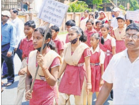
ଛାତ୍ରଛାତ୍ରୀଙ୍କୁ ସ୍ଵାଗତ ସହର ପରିକ୍ରମା କରାଯାଇଛି।

ବାଲେଶ୍ଵର ସହର ଏଡ଼ିଏମ୍ ହଲ୍‌ରେ ପଢ଼ିବ ସରକାରୀ ଉଚ୍ଚ ବିଦ୍ୟାଳୟରେ ଛାତ୍ରଛାତ୍ରୀଙ୍କୁ ଇଂରାଜୀ ମାଧ୍ୟମ ବିଦ୍ୟାଳୟ ଓ ଘରୋଇ ସ୍କୁଲ ଭଳି ଶିକ୍ଷା ଦିଆଯାଉଛି। ତେଣୁ ଅଭିଭାବକ ଓ ଛାତ୍ରଛାତ୍ରୀମାନେ ସମ୍ପୂର୍ଣ୍ଣ ମାଗଣାରେ ସରକାରୀ ବିଦ୍ୟାଳୟକୁ ଚିନ୍ତା କରି ପଢ଼ିବାକୁ ଆଗ୍ରହ ପ୍ରକାଶ କରୁଛନ୍ତି। ବୁଧବାର ଏହି ବାର୍ତ୍ତା ନେଇ ପଢ଼ିବ ହାଲ୍‌ସ୍କୁଲର ଛାତ୍ରଛାତ୍ରୀମାନେ ବିଦ୍ୟାଳୟର ଶିକ୍ଷକମାନଙ୍କ ତତ୍ପରତାରେ ପାଳନ କରିଛନ୍ତି ପ୍ରବେଶ ଉପରାଜ୍ୟ ସରକାରଙ୍କ ବିଦ୍ୟାଳୟ ଓ ଗଣ ଶିକ୍ଷା ବିଭାଗ ଏବଂ ୫-ଟି ସଚିବକ ମିଳିତ ଯୋଜନାରେ ସରକାରୀ ସ୍କୁଲକୁ ଚିନ୍ତା ରୂପାନ୍ତରଣ ଯୋଜନା ଜିଲ୍ଲାରେ ଆରମ୍ଭ ହେବା ପରେ ସ୍କୁଲକୁ ଲୋକଙ୍କୁ କାୟାକଳରେ ବ୍ୟାପକ ପରିବର୍ତ୍ତନ ଘଟିଛି। ଏହି ପରିପ୍ରସାରେ ପଢ଼ିବ ସ୍କୁଲର ଛାତ୍ରଛାତ୍ରୀମାନେ ସହର ପରିକ୍ରମା କରି ସରକାରୀ ବିଦ୍ୟାଳୟରେ ନାମ ଲେଖାଇବାକୁ ସ୍ଵାଗତ ଦେଇଥିଲେ।