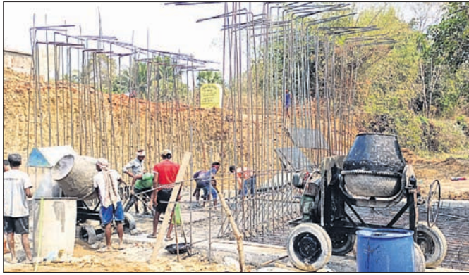
ପୋଲ ନିର୍ମାଣ କାର୍ଯ୍ୟ ଚାଲିଛି।

ଭଦ୍ରକ ଜିଲ୍ଲା ଧାମନଗର ବ୍ଲକ୍ ଅଧୀନ ଭଗବାନପୁର ପଞ୍ଚାୟତ ପରିସର ଗ୍ରାମ ଦେଇ ଯାଇଥିବା ‘ଯ’ ନଦୀ ଉପରେ ଥିବା କାନ୍ଥର ପୋଲ ଦୀର୍ଘବର୍ଷ ହେଲା ବିପଦସଙ୍କୁଳ ଅବସ୍ଥାରେ ଥିଲା। ଗ୍ରାମ୍ୟ ଉନ୍ନୟନ ବିଭାଗ ଅଧୀନରେ ଥିବା ପଲିଟିକି ଛକ ପୁଞ୍ଜୀରାପୁରଠାରୁ ଚନ୍ଦନେଶ୍ୱର ଗ୍ରାମ ପର୍ଯ୍ୟନ୍ତ ୩ କି.ମି. ରାସ୍ତା ପଲିଟିକି ଗ୍ରାମ ମଧ୍ୟବର୍ତ୍ତୀ ଅଞ୍ଚଳରେ ଥିବା ଦିଆଁ ବଜାର ନିକଟରେ ଏହି ନଦୀ ଉପରେ ପ୍ରାୟ ୨୫୦୦ ଚର୍ଚ୍ଚ ଉର୍ଦ୍ଧ୍ୱ ପୁରୁଣା ପୋଲ ଥିଲା। ରକ୍ଷଣାବେକ୍ଷଣ ଅଭାବରୁ ଅନେକାଂଶରେ ଫାଟ ସୃଷ୍ଟି ଖୁଣ୍ଟ ନଷ୍ଟ ସହ ପୋଲର ଉଚ୍ଚତାପୂର୍ଣ୍ଣରେ ଗାଡ଼ିଖାଲ ସବୁ ନଷ୍ଟ ହୋଇଯାଇଥିଲା। ୧୨ଗୋଟି ଗୋରୁକୁ ମରାତପୁର ଗୋ ଶାଳାକୁ ପଠାଇ ଦିଆଯାଇଛି।