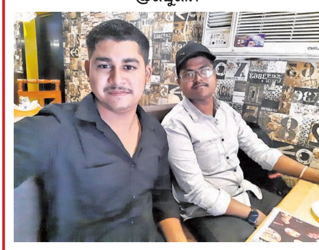
ସେଲ୍‌ଫି ସହ ନିଜର ନାମ ଓ ମୋବାଇଲ୍ ନମ୍ବର ଉଲ୍ଲେଖ କରନ୍ତୁ।