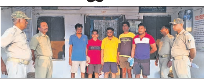
ଆନନ୍ଦପୁର, ୫୪୪ (ସ.ପ୍ର.)