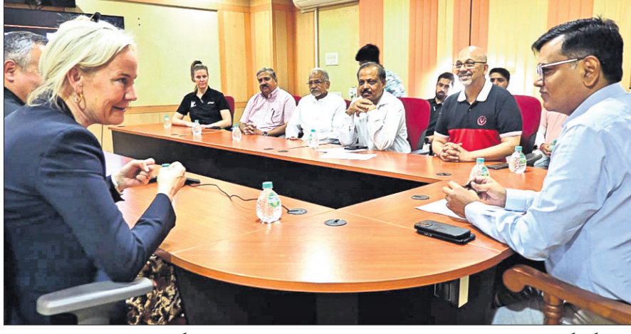
ବୈଠକରେ ଉପସ୍ଥିତ ଅତିର୍ଜାତୀୟ ଚେନ୍ନୁଲ ଚେନିସ ଫେଡେରେସନ ଓ ରାଜ୍ୟ ଆସୋସିଏସନ କର୍ମକର୍ମୀ।