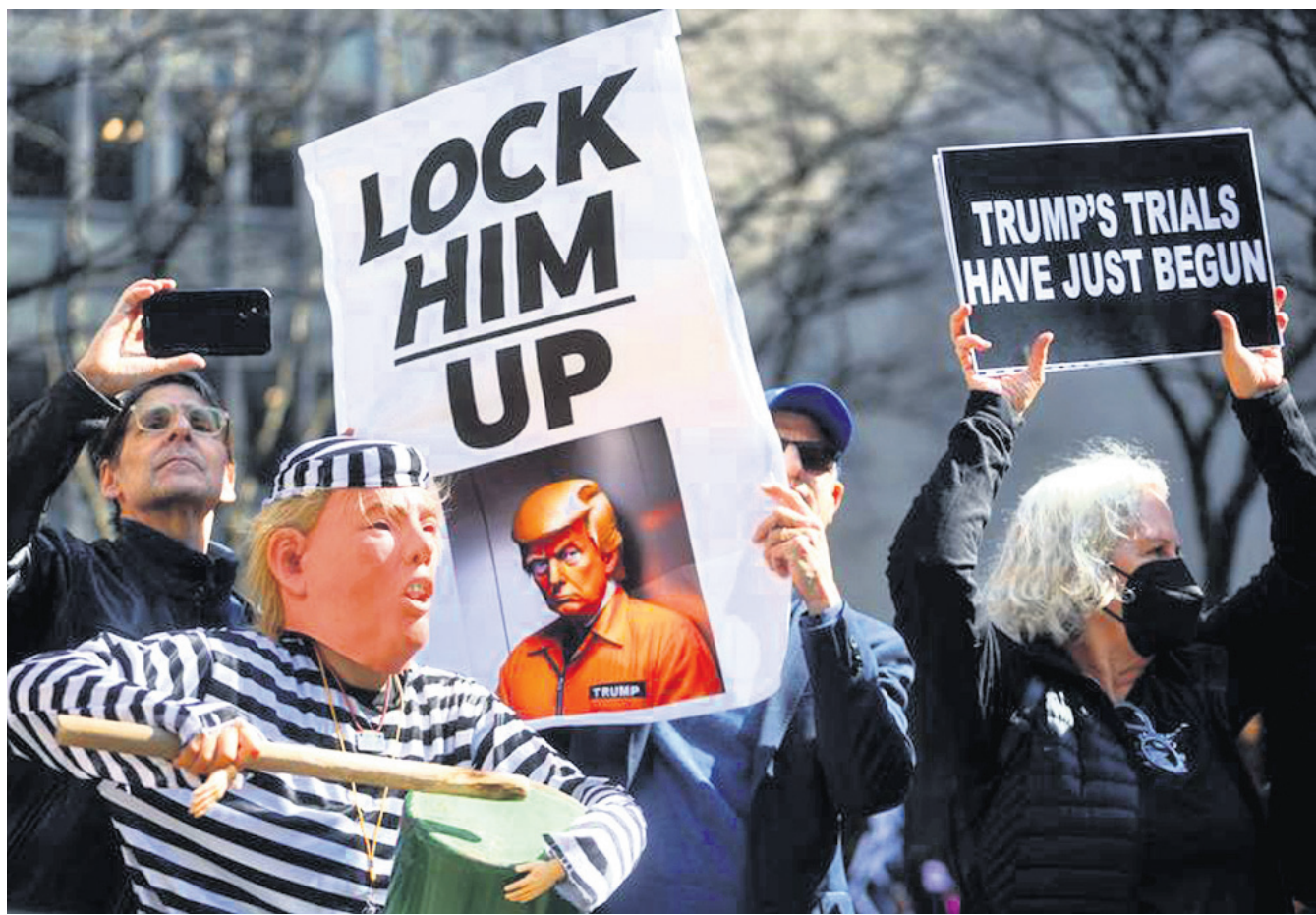
ରୁୟାକର୍ମିତ ମାନ୍ଦହାଜର୍ କ୍ରିମିନାଲ କୋର୍ଟରେ ମଙ୍ଗଳବାର ଆମେରିକାର ପୂର୍ବତନ ରାଷ୍ଟ୍ରପତି ତୋନାଲ୍ ଟ୍ରମ୍ପଙ୍କ ବିରୋଧରେ ମାମଲାର ଶୁଣାଣି ଚାଲିଥିବାବେଳେ ଆଜି-ତ୍ରମ୍ପ୍ ପ୍ରେଚେଷ୍ଟରମାନଙ୍କ ବିରୋଧେ ।