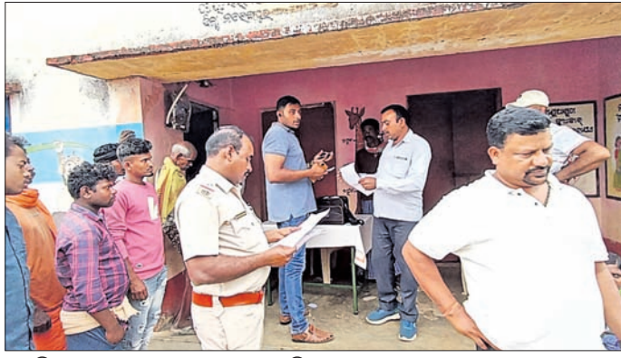
ପୋଲିସ୍ ଘଟଣାସ୍ଥଳରେ ପହଞ୍ଚି ତଦନ୍ତ କରୁଛି ।