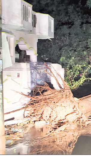
ଝଡ଼ବର୍ଷାରେ ଉପୁଡ଼ି ପଡ଼ିଥିବା ଗଛ ।