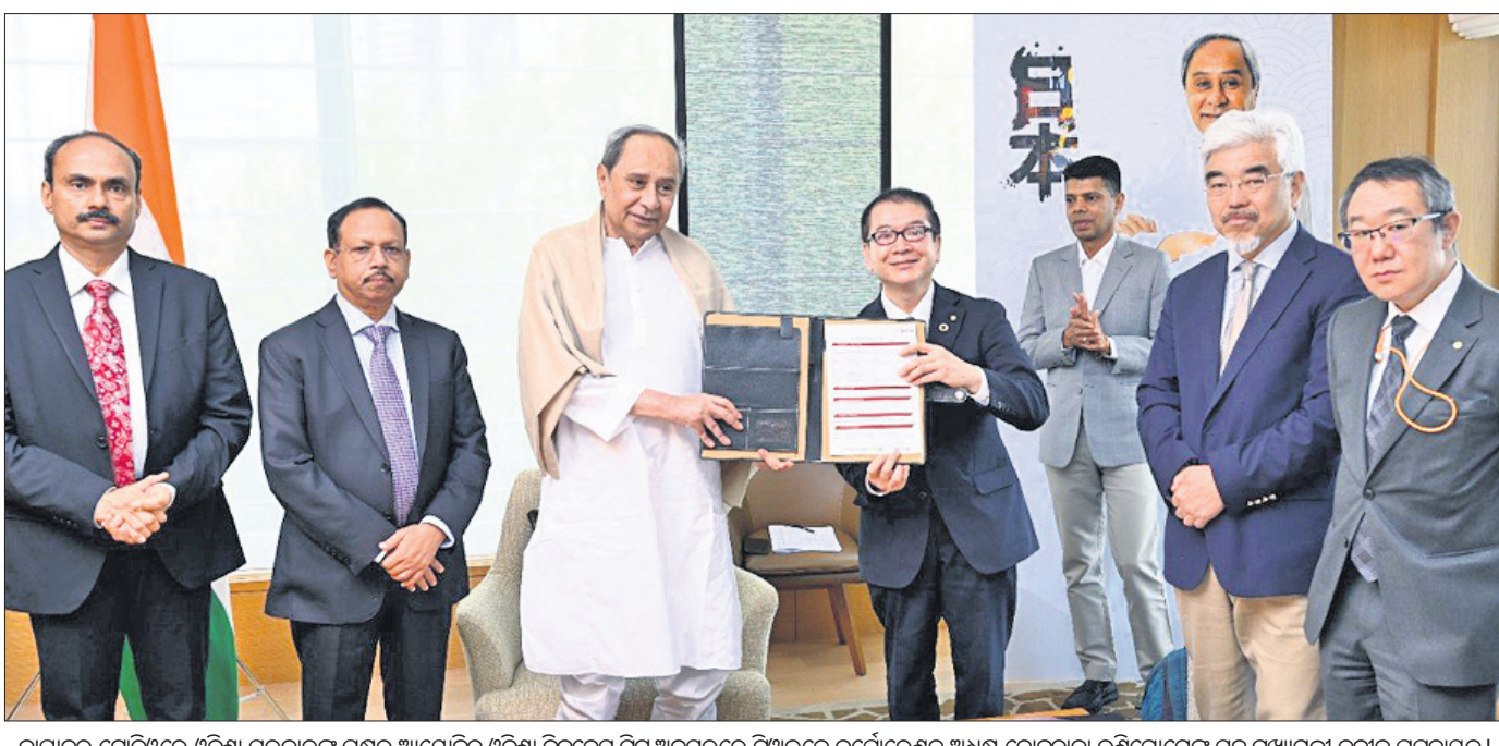
ଜାପାନର ଟୋକିଓରେ ଓଡ଼ିଶା ସରକାରଙ୍କ ପକ୍ଷରୁ ଆୟୋଜିତ ଓଡ଼ିଶା ବିକ୍ଷେପ ନିର୍ମ ଅବସରରେ ଉଦ୍ଘାଟନ କର୍ମରେ ଉପସ୍ଥିତ ଓଡ଼ିଶା ଆସ, ନିବେଶ କର