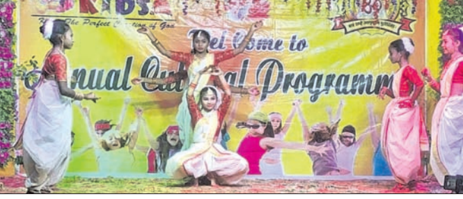
ଛାତ୍ରମାନେ ନୃତ୍ୟ ପରିବେଷଣ କରୁଛନ୍ତି ।