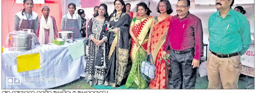
ଫୁଡ଼ ଫେୟାର୍ରେ ଉପସ୍ଥିତ ଅଧ୍ୟାପିକା ଓ ଅଧ୍ୟାପକମାନେ ।