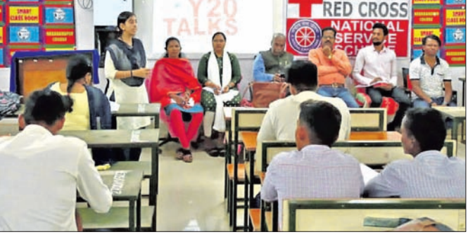
କାର୍ଯ୍ୟକ୍ରମରେ ଜଣେ ଛାତ୍ରୀ ନିଜ ମତ ଦେଇଛନ୍ତି ।