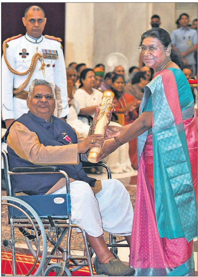
ରାଷ୍ଟ୍ରପତି ଦ୍ରୌପଦୀ ମୁର୍ମୁଙ୍କଠାରୁ ପଦ୍ମଶ୍ରୀ ପୁରସ୍କାର ଗ୍ରହଣ କରୁଛନ୍ତି ଅନ୍ତର୍ଯ୍ୟାମୀ ମିଶ୍ର।