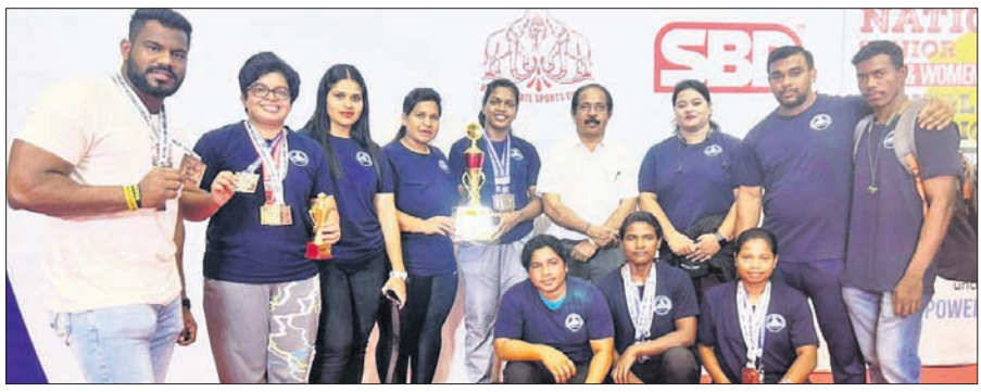
ଜାତୀୟ ପ୍ରତିଯୋଗିତାରେ ପଦକ ହାସଲକାରୀ ଓଡ଼ିଶା ଶକ୍ତି ଉତ୍ସାହକ ଓ ଅନ୍ୟମାନେ।

କେନ୍ଦ୍ରୀୟ ଶକ୍ତି ଉତ୍ସାହରେ ଓଡ଼ିଶାକୁ ମୋଟ ୫ଟି ପଦକ ମିଳିଛି। ଓଡ଼ିଶା ମହିଳା ଦଳ ଓଭରଆଉଟ୍ ରନ୍ରେ ଅପସାରିତ ହୋଇଛି।