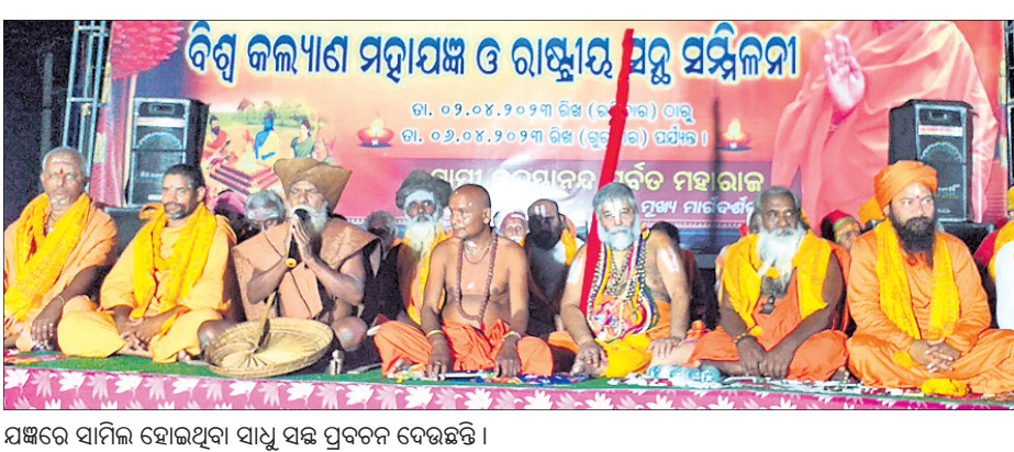
ସଞ୍ଚରେ ସାମିଲ ହୋଇଥିବା ସାଧୁ ସହ ପ୍ରବଚନ ଦେଉଛନ୍ତି।

ଲୋକେ ଏକତ୍ରିତ ହୋଇ ଧର୍ମ ଆଲୋଚନା କରୁଛନ୍ତି। ସାଧୁମାନଙ୍କ ସହ ବାର୍ତ୍ତାଳାପ କରି ସଂସାରରୁ ମୋହମାୟା ବନ୍ଧନରୁ ମୁକ୍ତିଲାଭ କରିବା ଲାଭ କରୁଛନ୍ତି। ପଞ୍ଚତନ୍ତ୍ର ମନ୍ତ୍ର ଧ୍ୟାନରେ ଯଜ୍ଞସ୍ଥଳ ପ୍ରକଳ୍ପିତ ହୋଇଉଠୁଛି। ପ୍ରତିଦିନ ଭଲ ରୁଧିରା ମା' ବିଶ୍ୱରୂପାଙ୍କ ନିକଟରେ ପାରମ୍ପାରିକ ପୂଜା କରାଯାଇ ଯଜ୍ଞ କାର୍ଯ୍ୟ ଆରମ୍ଭ କରାଯାଇ ଥିଲା। ମା' ବିଶ୍ୱରୂପାଙ୍କ ନିକଟରେ ଜଳୁଥିବା ଅଖଣ୍ଡ ଦୀପର ତେଜ ଦିନକୁ ଦିନ ବଢ଼ିବାରେ ଲାଗୁଛି। ଦୀପ ଶିଖାର ପ୍ରଖରତା ସମସ୍ତଙ୍କ ଧ୍ୟାନ ଆକର୍ଷଣ କରୁଛି। ମା' ପ୍ରତିମୂର୍ତ୍ତି ସ୍ଥାପିତ ସ୍ଥାନରେ ଶ୍ରଦ୍ଧାଳୁଙ୍କ ମନରେ ସ୍ୱତଃସ୍ପୃହର ଭକ୍ତି ଭାବ ଗାତ୍ର କରୁଛି। ହୋମସଞ୍ଚର ଦ୍ୱିତୀୟ ଦିନରେ ଯଜ୍ଞସ୍ଥଳରେ ୧୦,୦୦୦ ଉର୍ବ୍ଧ୍ୱ ଘୃତ ଆହୂତି ପ୍ରଦାନ କରାଯାଇ ସାରିଲାଣି। ସକାଳ ଓ ସନ୍ଧ୍ୟା ସମୟରେ ଭଜନ, ସକାର୍ତ୍ତ ପରିବେଷଣ, ମା'ଙ୍କ ନିକଟରେ ସକଳା ଧୂପ ଓ ସନ୍ଧ୍ୟା ଆଳିତ ଉତ୍ସବରେ ଭକ୍ତ ଭିଡ଼ ପରିଲକ୍ଷିତ ହେଉଛି। ଶ୍ରଦ୍ଧାଳୁ ମା'ଙ୍କ ଦର୍ଶନ ସକାଶେ ଛୁଟି ଆସୁଛନ୍ତି। ବିରଜାପୁତ୍ର ସ୍ୱାମୀ ଉପସ୍ଥାନରେ ପର୍ବତ ମହାରାଜଙ୍କ ନିର୍ଦ୍ଦେଶ ଓ ଯଜ୍ଞ ପରିଚାଳନା ସକାଶେ ଗଠନ କରାଯାଇଥିବା ଆଞ୍ଚଳିକ କମିଟି କରି ନାହାନ୍ତି। ସର୍ବଦା ବାବା ଛିଡା ହୋଇ ରହୁଛନ୍ତି। ରାତ୍ରୀ ସମୟରେ ବାବା ଠିଆ ହେବା ପୂର୍ତ୍ତାରେ ଶୟନ କରିଥାଆନ୍ତି। ଏହି ବାବାଙ୍କ ସଂପର୍କରେ ଜାଣିବା ପାଇଁ ଭକ୍ତଙ୍କ ମଧ୍ୟରେ ଲଜ୍ଜିତା ବଢ଼ି ଯାଉଛି। ଶ୍ରଦ୍ଧାଳୁ ବାବାଙ୍କଠାରୁ ଆଶୀର୍ବାଦ ଲାଭ କରୁଥିବା ଲକ୍ଷ୍ୟ କରାଯାଇଛି। ସାଧୁଙ୍କ ଗ୍ରାମରେ