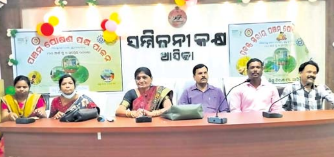
କାର୍ଯ୍ୟକ୍ରମରେ ମଞ୍ଚାସୀନ ଅତିଥି ।

କାର୍ଯ୍ୟକ୍ରମରେ ମଞ୍ଚାସୀନ ଅତିଥି । ଆସିକା, ୫୪୪(ଡି.ଏନ୍.ଏ.) କାର୍ଯ୍ୟକ୍ରମରେ ଶିଶୁର ସୁନ୍ଦର ସ୍ୱାସ୍ଥ୍ୟ ଓ ରୋଗମୁକ୍ତ ରଖିବା ପାଇଁ ସେମାନଙ୍କ ଲାଗି ଉତ୍ତମ ଖାଦ୍ୟ ଉପରେ ଗୁରୁତ୍ୱ ଦିଆଯାଇଥିଲା। ବିଶେଷ କରି ମାଣ୍ଡିଆ ଜାତୀୟ ଖାଦ୍ୟର ବ୍ୟବହାର ସମ୍ପର୍କରେ ଆଲୋଚନା ହୋଇଥିଲା। ଏତଦ୍ ଭାବେ ମହାପାତ୍ରଙ୍କ ଅଧକ୍ଷତାରେ ଅନୁଷ୍ଠିତ କାର୍ଯ୍ୟକ୍ରମରେ ସହକାରୀ ଗୋଷ୍ଠୀ ଶିକ୍ଷା ଅଧିକାରୀ, ମେଡିକାଲ ଅଫିସର, ପୋଷଣ ସଂଯୋଜକ ପ୍ରମୁଖ ଯୋଗ ଦେଇଥିଲେ।