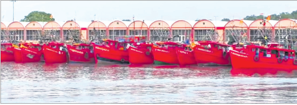
ପାରାଦୀପ ମାଛଧରା ବନ୍ଦରେ ଲାଗିଥିବା ବୁଲର।

■ ଏବେଠାରୁ ୯୦ ପ୍ରତିଶତ ବୋଟ ବନ୍ଦ ହୋଇଗଲାଣି ■ ଏପ୍ରିଲ ୧୫ରୁ ଜୁନ ୧୪ ପର୍ଯ୍ୟନ୍ତ ୨ ମାସ ସାମୁଦ୍ରିକ କଟକଣା ■ ଦେଶର ପୂର୍ବ, ପଶ୍ଚିମ ଉପକୂଳରେ କଟକଣା ପାଇଁ ରାଷ୍ଟ୍ରପତିଙ୍କ ନିର୍ଦ୍ଦେଶ