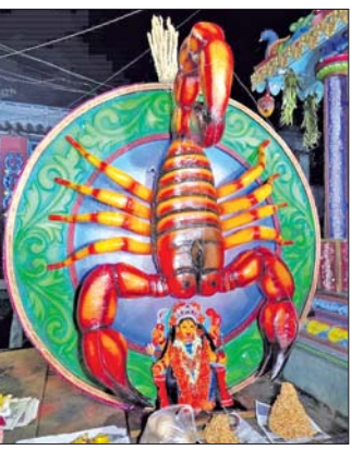
ସପ୍ତଦେଶ ଦେଇଥିଲେ। ଆଦେଶ ଅନୁଯାୟୀ କଟିକା ସାହିରେ ପ୍ରଥମେ ଆରମ୍ଭ କରାଯାଇ ମା'ଙ୍କୁ ଶୀତଳ ପଣା ଦିଆଯାଇଥିଲା। ପରେ ଏହି ପୂଜା ପାଳନ କରାଗଲା।