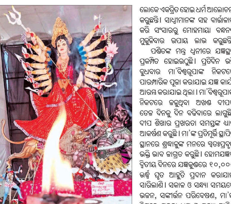
ମା' ବିଶ୍ୱରୂପାଙ୍କ ମୁଖ୍ୟ ମୂର୍ତ୍ତି।

ରଘୁଲତ୍ତର ବ୍ଲକ୍ ନରୁଆବର ଓ ଶ୍ରୀବତ୍ସପୁର ପଞ୍ଚାୟତର ସାମାଜିକବାଣୀ ଅଞ୍ଚଳ ଶ୍ରୀମତୀ ନବାପଠାରେ ଚାଲିଥିବା ମା' ବିରଜା ବିଶ୍ୱରୂପା ବିଶ୍ୱକଲ୍ୟାଣ ମହାଯଜ୍ଞ ଓ ରାଷ୍ଟ୍ରୀୟ ସାଧୁସହ ସମ୍ମିଳନୀ ବୃଦ୍ଧ ଦିବସରେ ପହଞ୍ଚିଛି। ସାଧୁସହନଙ୍କ ସାମାଜିକ ଗ୍ରହଣ ପାଇଁ ଶ୍ରଦ୍ଧାଳୁଙ୍କ ଭିଡ଼ ପରିଲକ୍ଷିତ ହେଉଛି। ଯଜ୍ଞ ପଡ଼ିଆରେ ପ୍ରତିଷ୍ଠା କରାଯାଇଥିବା ସାଧୁସହ ଗ୍ରାମରେ ସାଧୁ ସନ୍ଧ୍ୟା ଆସନ୍ତା କରୁଛନ୍ତି। ଭକ୍ତ ସାଧୁସନ୍ଧ୍ୟାସାଳ ଚରଣ ସର୍ଗ କରି ଆଶୀର୍ବାଦ ଲାଭ କରିବା ସହ