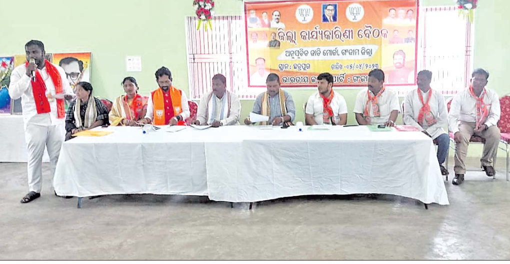
ବୈଠକରେ ଭାଗପା ନେତୃମଣ୍ଡଳୀ ।