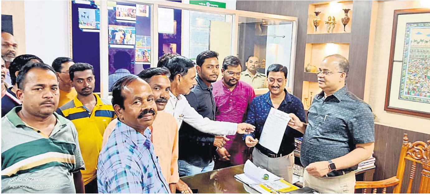
ମଧୁବେଶ୍ୟ ସମାଜ ପକ୍ଷରୁ ଜିଲାପାଳଙ୍କୁ ଦାବିପତ୍ର ପ୍ରଦାନ କରାଯାଇଛି ।