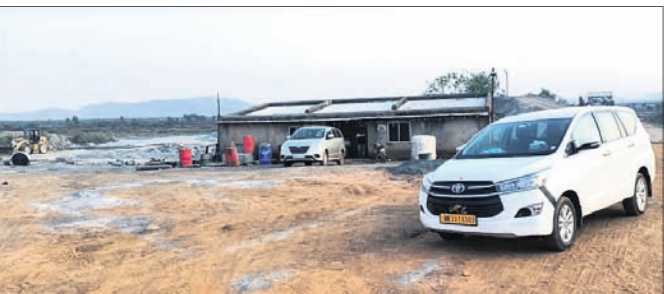
ଆୟକର ବିଭାଗ ପକ୍ଷରୁ ଏକ କ୍ରଶରରେ ଯାଞ୍ଚ ଚାଲିଛି।

ଧର୍ମଶାଳା/ଚକ୍ରକୋଧରା, ୫୫ (ଡି.ଏନ.ଏ.): କଳାପଥର କେଳେକାରାକୁ ନେଇ ଚର୍ଚ୍ଚାରେ ଥିବା ଧର୍ମଶାଳା ତହସିଲ ଅଞ୍ଚଳର ୫ କ୍ରଶର ଓ ଗୋଟିଏ ପେଟ୍ରୋଲ ପମ୍ପ ଉପରେ ୩ ଦିନ ଧରି ଚଢ଼ାଉ ଜାରି ରହିଛି। ଏହି କ୍ରଶର ମାଲିକଙ୍କ ବିଭିନ୍ନ ସ୍ଥାନରେ ଥିବା କାର୍ଯ୍ୟାଳୟଗୁଡ଼ିକରେ ଏକକାଳୀନ ଆୟକର ବିଭାଗ ପକ୍ଷରୁ ଚଢ଼ାଉ କରାଯାଇଛି। ନୂତନ ଆର୍ଥିକ ବର୍ଷର ପ୍ରଥମ ସପ୍ତାହରେ ଏଭଳି ଚଢ଼ାଉ ଚର୍ଚ୍ଚାର ବିଷୟ ହୋଇଛି। ରାହାଡ଼ପୁରରେ ଥିବା ପଞ୍ଚାବୀ କ୍ରଶର ଓ କେବିପିଏସ୍ କ୍ରଶର, ଅମିତ ସ୍ତୋନ କ୍ରଶର, ବକରଜା ସ୍ତୋନ କ୍ରଶର, ବିହାରଖଣ୍ଡର ଏସଏନ କ୍ରଶର ଉପରେ ଚଢ଼ାଉ ହୋଇଛି। ବିଭିନ୍ନ ସ୍ଥାନରେ କ୍ରଶରପତ୍ର ଯାଞ୍ଚ ଜାରି ରହିଛି। ଆୟକର ଚଢ଼ାଉ ଖବର ପ୍ରଚାର ହେବା ପରେ ଅନ୍ୟ କେତେକ କ୍ରଶର କାର୍ଯ୍ୟାଳୟ ଖାଲି ହୋଇଯାଇଥିବାବେଳେ ପଥର ବ୍ୟବସାୟ ସ୍ୱାଭାବିକ ଚାଲିଥିବା ଦେଖିବାକୁ ମିଳିଛି।