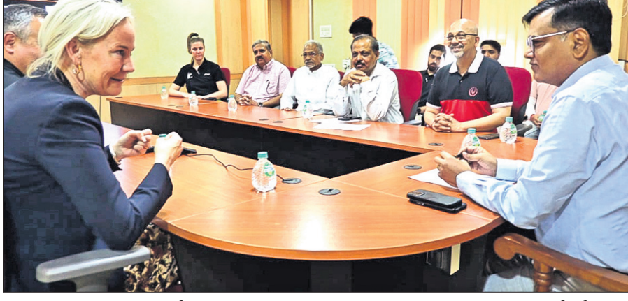
ଟିଟି ଖେଳାଳିଙ୍କୁ ନୂତନ ପଦକ୍ଷେପରେ ପ୍ରଶିକ୍ଷଣ ଦିଆଯିବ।