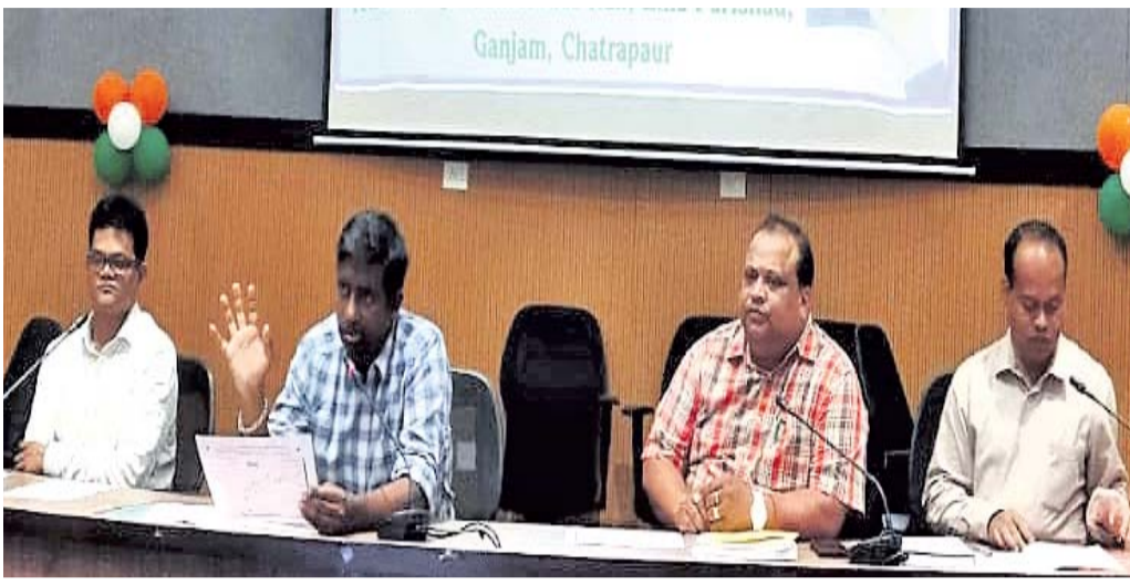
ତାଲିମ କାର୍ଯ୍ୟକ୍ରମରେ ଜିଲ୍ଲାପାଳ ଓ ଅନ୍ୟମାନେ ।

ଏକମାତ୍ର ଓ ସୁପରଭାଇକରଙ୍କ ଦ୍ୱାରା ସଂଗ୍ରହ ହୋଇଥିବା ତଥ୍ୟ, ଆଇସିଆର୍. ଫର୍ମର ବ୍ୟବହାର, ଠିକ୍ କୋଡ୍ ସହିତ ଆଇସିଆର୍. ସର୍ତ୍ତେ ଫର୍ମ ପୂରଣ କରିବା ବିଷୟରେ ତାଲିମ ଦେଇଥିଲେ ।