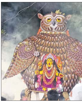
ମୁହାଁରେ ତିଆରି କରାଯାଇଥିବା ମା'ଙ୍କ ପ୍ରତିମା।

ପାରଳାଖେମୁଣ୍ଡିର ଗଣପର୍ବ ଗଜାମୁହାଁ ବସନ୍ତର ମଲୟ ସାଙ୍ଗକୁ ଶଙ୍ଖ, ଛୁଲୁଛୁଲି, ଧ୍ୱନି ଲୋକଙ୍କ ମନରେ ଭରିବଏ ଏକ ଅଲଗା ରତ୍ନୋଦାନ। ବାହାରେ ରହୁଥିବା ପାରଳା ବାସିନ୍ଦାମାନେ ମଧ୍ୟ ଏହି ପର୍ବରେ ବହୁ ସଂଖ୍ୟାରେ ଆସି ସାମିଲ ହୋଇଥାନ୍ତି। ଶତାଧିକ କାଳରୁ ପାଳିତ ହୋଇଆସୁଥିବା ଏହି ପର୍ବରେ ଗୁଡ଼ ପାଗ ହୋଇଥିବା ଲିଆର ଏକ ବିରାଟ ମୁହାଁରେ ମା'ଙ୍କ ପ୍ରତିମାକୁ ସ୍ଥାପନ କରି ପୂଜା କରାଯାଏ।