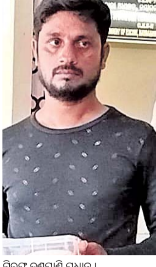
ରିଟ୍ ଦଣ୍ଡପାଣି ପ୍ରଧାନ ।

ନୟାଗଡ଼ ଅଧିକ, ୫୪: ନୟାଗଡ଼ ଅଧିକାରୀ ବିଭାଗର ଫୁଲ୍‌ସ୍ମାର୍ଟ ଇଟାମାଟି ଫ୍ୟାକ୍ଟରୀର ନିକଟରେ ବ୍ରାଉନ ସୁଗାର ଜବତ କରାଯାଇଛି ।