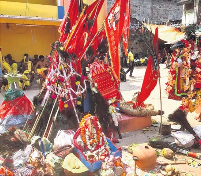
ଯାତ୍ରାସ୍ଥଳରେ ମା' ଦଣ୍ଡକାଳୀଙ୍କ ପୂଜାର୍ଚ୍ଚନା ।

ଦିଗପହଣ୍ଡି, ୫୪୪(ଡି.ଏନ୍.ଏ.) ଦିଗପହଣ୍ଡି ବ୍ଲକ ଅନ୍ତର୍ଗତ ପାଦିଗୁଡ଼ା ଗାଁରେ ମା' ଦଣ୍ଡକାଳୀଙ୍କ ପଞ୍ଚୁଦଣ୍ଡ ମହାମିଳନ ପୂଜା ମହୋତ୍ସବ ଉଦ୍‌ଯାପିତ ହୋଇଯାଇଛି। ପାଦିଗୁଡ଼ା ଗ୍ରାମବାସୀଙ୍କ