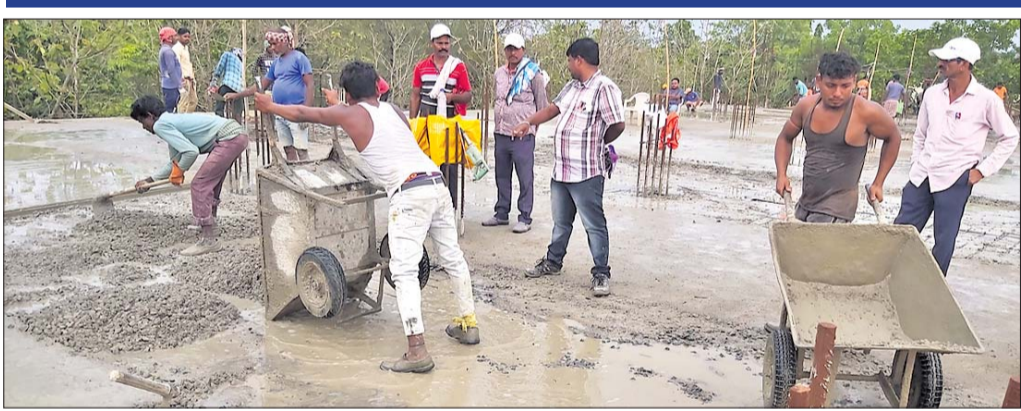
ବର୍ଷା ପାଣି ଗଚ୍ଛିତ ଥିବା ବେଳେ ଛାତ ପଡ଼ୁଛି ।

ପାଣିକୁ ବାହାର କରାଯାଇ ନ ଯାଇ ଗାଁ ଉପରେ ହିଁ ପୂର୍ଣ୍ଣ ଛାତ ପକାଯାଇଥିଲା । ଛାତ ପଡ଼ୁଥିବା ସମୟରେ ସମ୍ପର୍କରେ ପୂର୍ଣ୍ଣ ବର୍ଷା ହୋଇଥିଲା ।