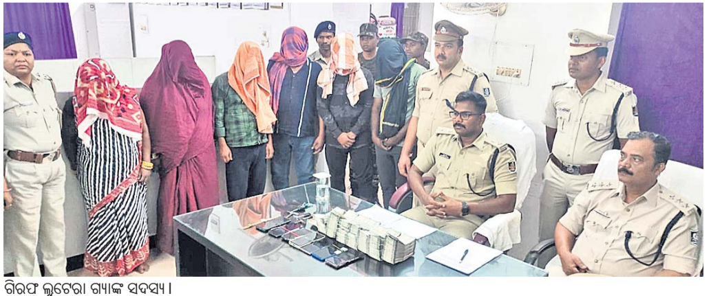
ଗିରଫ ଲୁଟଚୋରୀ ଗ୍ୟାଙ୍ଗ ସଦସ୍ୟ ।

ଫୁଲବାଣୀ ସହର ଆକ୍ରିସ ବ୍ୟାଙ୍କ ପାଖରୁ ୧୭ ଲକ୍ଷ ୫୦ ହଜାର ଟଙ୍କା ଲୁଟ ଘଟଣାରେ କର୍ମଚାରୀ ଜିଲ୍ଲା ପୋଲିସ କମିସନେଟି ସହଯୋଗରେ ଲୁଟଚୋରୀ ଗ୍ୟାଙ୍ଗର ୬ ଜଣକୁ ଗିରଫ କରାଯାଇଛି ।