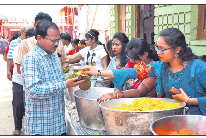
ଭକ୍ତଙ୍କୁ ପ୍ରସାଦ ଭାବେ ମହାଭୋଗ ପ୍ରଦାନ କରାଯାଉଛି।

ମହାସ୍ନାନ ପାଇଁ ଭୋଗ ୪ଟା ୧୮ ମିନିଟରେ ମାଁଙ୍କ ପହତ ଭାଙ୍ଗିବା ପରେ ସ୍ଵତନ୍ତ୍ର ପୂଜା ଆରମ୍ଭ ହୋଇଥିଲା। ପରେ ସକାଳ ୫ଟା ୧୦ ମିନିଟରୁ ଜଳାଭିଷେକ ଆରମ୍ଭ ହୋଇଥିଲା। ଜଳାଭିଷେକ ତଥା ମହାସ୍ନାନପାଇଁ ଭକ୍ତଙ୍କ ଲାସ୍ୟାଧି ଦେଖିବାକୁ ମିଳିଥିଲା। ପରେ ମାଁଙ୍କଠାରେ ମହାଭୋଗ