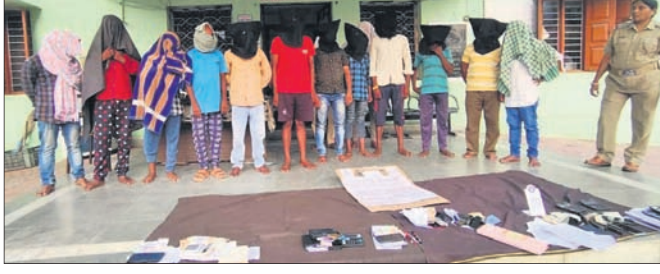
ଗିରଫ ଅଭିଯୁକ୍ତଙ୍କୁ ପୋଲିସ୍ ହାଜର କରିଛି।