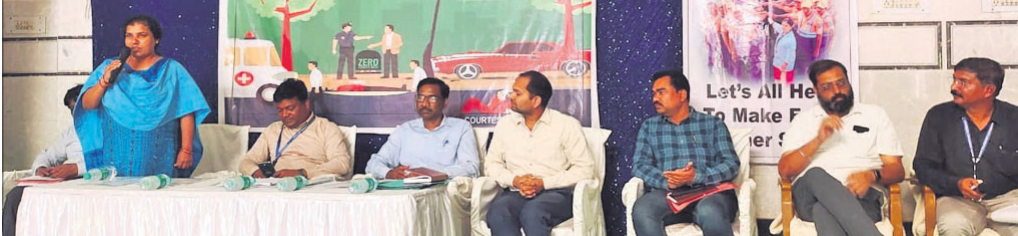
ସଚେତନତା ବୈଠକରେ ମଞ୍ଚାସୀନ ଅତିଥିମାନେ।