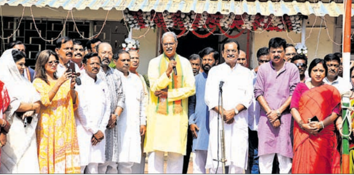
ଭାଜପା ରାଜ୍ୟ କାର୍ଯ୍ୟାଳୟରେ ପାଳିତ ୪୪ତମ ପ୍ରତିଷ୍ଠା ଦିବସରେ ଉପସ୍ଥିତ ଦଳୀୟ ନେତୃବୃନ୍ଦ