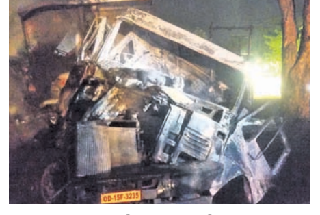
ଜଳିଯାଇଥିବା ଗାଡ଼ି। ବ୍ରଜରାଜନଗର, ୬/୪