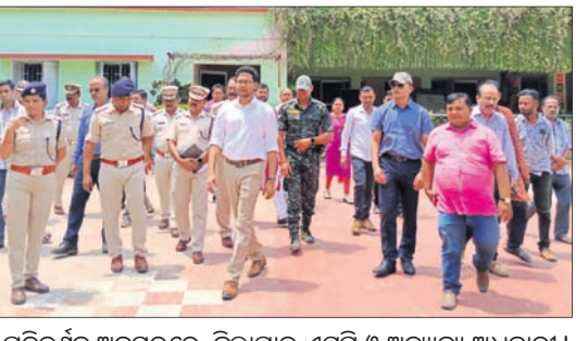
ସ୍କୁଲ ପରିବର୍ତ୍ତନ ଅବସରରେ ଜିଲ୍ଲାପାଳ, ଏସ୍ପି ଓ ଅନ୍ୟାନ୍ୟ ଅଧିକାରୀ।