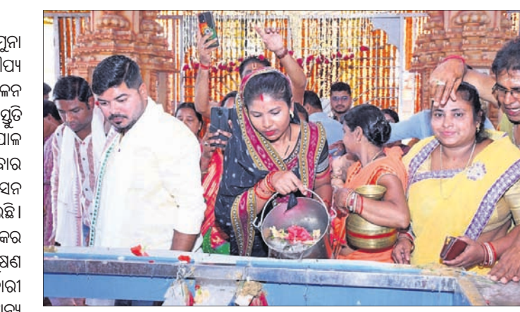
ସମଲେଶ୍ଵରୀଙ୍କ ମହାସ୍ନାନ କାର୍ଯ୍ୟକ୍ରମରେ ଶ୍ରଦ୍ଧାଳୁଙ୍କୁ ଦେଖିବା।