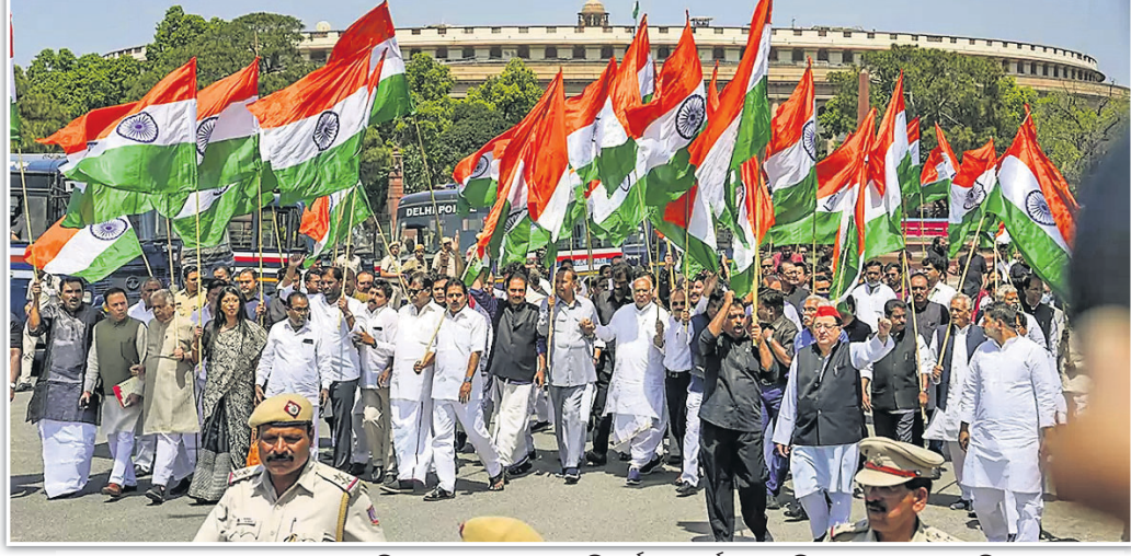
କଂଗ୍ରେସ ଅଧ୍ୟକ୍ଷ ତଥା ରାଜ୍ୟ ସଭାର ବିରୋଧୀ ଦଳ ନେତା ମଲ୍ଲିକାର୍ଜୁନ ଖାର୍ଯ୍ୟେଙ୍କ ସହ ବିରୋଧୀ ଦଳର ଏମ୍ପିମାନେ ବଜେଟ ଅଧିବେଶନର ଶେଷ ଦିବସରେ ଗୁରୁବାର ପାଳିଆମେଣ୍ଟକୁ ବିଜୟ ଚୌକକୁ 'ତ୍ରିରଙ୍ଗା ଯାତ୍ରା'ରେ ସାମିଲ ହୋଇଛନ୍ତି।

ବିରୋଧୀ ଏକତାକୁ ଆଗେଇ ନେବା ଲାଗି ଏଥିରେ କଂଗ୍ରେସ ଅଧ୍ୟକ୍ଷ ମଲ୍ଲିକାର୍ଜୁନ ଖାର୍ଯ୍ୟେ ଓ ଅନ୍ୟ ନେତାମାନେ ସଂକଳ୍ପ ନେଇଥିଲେ।