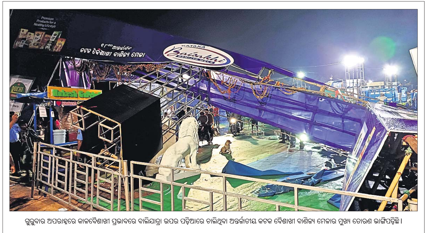
ଗୁରୁବାର ଅପହରଣରେ କାଳବୈଶାଖୀ ପ୍ରଭାବରେ ବାଲିଆପାଳ ଉପର ପଡ଼ିଆରେ ଚାଳିଥିବା ଅର୍ଦ୍ଧଶତାବ୍ଦୀ କଳା ବିଶାଳ ମେଳାର ପୁଖ୍ୟ ଚୋରଣ ଭାଙ୍ଗିପଡ଼ିଛି।