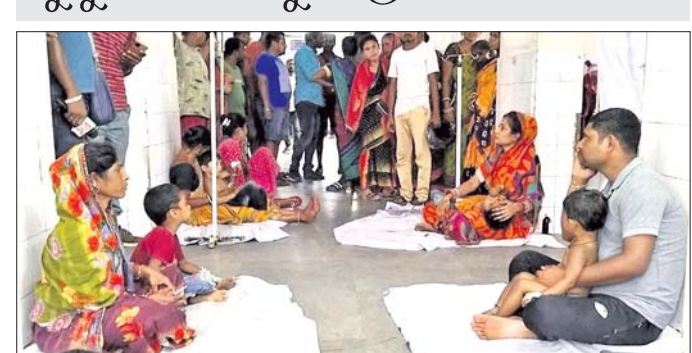
ଭଦ୍ରକ ଜିଲ୍ଲା ମୁଖ୍ୟ ଚିକିତ୍ସାଳୟରେ ଚିକିତ୍ସାଧୀନ ଶିଶୁ ଓ ସେମାନଙ୍କ ମା' ବାପା।