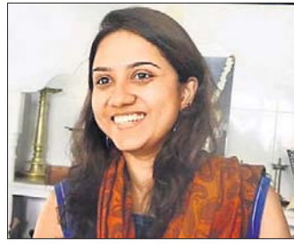
ଆବୋଲି ସୁନାଳ ନରଝୋଶ