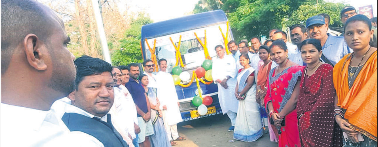
ଅଭିଯୁକ୍ତମାନେ ପଶସ୍ୟୁତକୁ ବସ୍ ସେବାକୁ ଶୁଭାଚରଣ କରୁଛନ୍ତି।