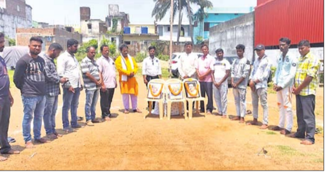
ଉପସ୍ଥିତ ଭାଜପା କାର୍ଯ୍ୟକର୍ମୀ ।