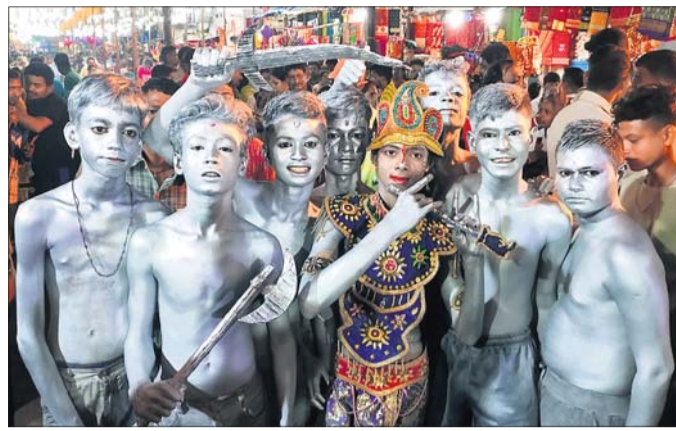
ଠାକୁରାଣୀ ଯାତ୍ରାର ଘଟ ଦିନରେ ମାନସିକଧାରୀଙ୍କ ବିଭିନ୍ନ ବେଶ।

ବ୍ରହ୍ମପୁର ବୁଢ଼ୀ ଠାକୁରାଣୀ ଯାତ୍ରା ଚତୁର୍ଥ ଦିନରେ ଘଟ ପରିକ୍ରମା ଆରମ୍ଭ ହୋଇଛି। ସନ୍ଧ୍ୟାରେ ପୂଜ୍ୟ ଘଟ ସମେତ ୮ ପାର୍ଶ୍ୱ ଘଟକୁ ଅସ୍ଥାୟୀ ମଣ୍ଡପରେ ପୂଜାର୍ଚ୍ଚନା କରାଯାଇଥିଲା। ପାର୍ଶ୍ୱ ଘଟ ମଧ୍ୟରେ ବ୍ରାହ୍ମୀ, ମାହେଶ୍ୱରୀ, କୁମାରୀ, ବୈଷ୍ଣବୀ, ବରାହୀ, ଇନ୍ଦ୍ରାଣୀ, ମହାଲକ୍ଷ୍ମୀ ଓ ଶିବାୟାଙ୍କ ପୂଜା କରାଯାଇଥିଲା। ଘଟ ଛିଡ଼ା କରିବା ପାଇଁ ବିଭିନ୍ନ ରଙ୍ଗରେ ସଜାଯାଇଥିବା ବୁଢ଼ୀ ଠାକୁରାଣୀଙ୍କ ଘଟ ଚତୁର୍ଦ୍ଧା ଦିଗକୁ ଘୁମାଇ ଦିଆଯାଇଛି।