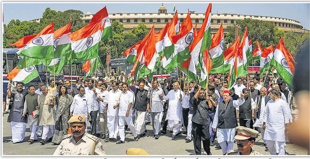
କଂଗ୍ରେସ ଅଧ୍ୟକ୍ଷ ତଥା ରାଜ୍ୟ ସଭାର ବିରୋଧୀ ଦଳ ନେତା ମଲ୍ଲିକାର୍ଜୁନ ଖାର୍ଯ୍ୟେଙ୍କ ସହ ବିରୋଧୀ ଦଳର ଏମ୍ପିମାନେ ବଜେଟ ଅଧିବେଶନର ଶେଷ ଦିବସରେ ଗୁରୁବାର ପାଳିଆମେଣ୍ଟକୁ ବିଜୟ ଚୌକକୁ 'ତ୍ରିରଙ୍ଗା ଯାତ୍ରା'ରେ ସାମିଲ ହୋଇଛନ୍ତି।

ବିରୋଧୀ ଏକତାକୁ ଆଗେଇ ନେବା ଲାଗି ଏଥିରେ କଂଗ୍ରେସ ଅଧ୍ୟକ୍ଷ ମଲ୍ଲିକାର୍ଜୁନ ଖାର୍ଯ୍ୟେ ନେତାମାନେ ସଂକଳ୍ପ ନେଇଥିଲେ।