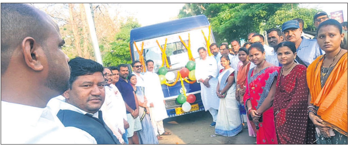
ଅଭିଯୁକ୍ତମାନେ ପଶସ୍ତ୍ରକୁ ବସ୍ ସେବାରେ ଶୁଭାରମ୍ଭ କରୁଛନ୍ତି।