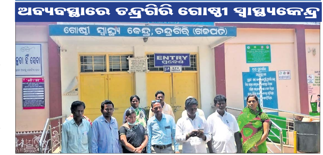
ଗୋଷ୍ଠୀ ସ୍ୱାସ୍ଥ୍ୟକେନ୍ଦ୍ର ସମ୍ମୁଖରେ ଜନପ୍ରତିନିଧିମାନେ ଧାରଣା ଦେଇଛନ୍ତି ।

ଗଜପତି ଜିଲ୍ଲା ମୋହନ ବ୍ଲକ ଅନ୍ତର୍ଗତ ଚନ୍ଦ୍ରବିରି ଗୋଷ୍ଠୀ ସ୍ୱାସ୍ଥ୍ୟକେନ୍ଦ୍ରରେ ଲାଗିରହିଛି ଅନେକ ସମସ୍ୟା । ରୋଗୀ କଲ୍ୟାଣ ସମିତିର ଚକା ହେଉଥିବା ନେଇ କର୍ମଚାରୀଙ୍କ ମଧ୍ୟରେ ଅସନ୍ତୋଷର ବାତାବରଣ ଦେଖାଦେଇଛି । ଦିନକୁ ଦିନ ଏହି ସ୍ୱାସ୍ଥ୍ୟକେନ୍ଦ୍ର ଅବ୍ୟବସ୍ଥା ମଧ୍ୟରେ ଗତି କରୁଛି । ଓଡ଼ିଶାରେ ଶ୍ରେଷ୍ଠ ସ୍ୱାସ୍ଥ୍ୟକେନ୍ଦ୍ର ରୂପେ ଏହି କେନ୍ଦ୍ର ପୂରାହୁଏ ହୋଇଥିଲା । କିନ୍ତୁ କିଛି ଅସାଧୁ କର୍ମଚାରୀଙ୍କ ଯୋଗୁ ଏହି ସ୍ୱାସ୍ଥ୍ୟକେନ୍ଦ୍ର ବିନାଶ ପାଇଁ ଯାହା ଅର୍ଥ ଖର୍ଚ୍ଚ ହେବ ସେ ସବୁକୁ ବିଧାୟକ ଓ ସ୍ୱାସ୍ଥ୍ୟକେନ୍ଦ୍ର ଅଧିକାରୀଙ୍କ ସହମତିରେ ଅନୁମୋଦନ ପ୍ରାପ୍ତ ହେବାକୁ ଯାହା ଅଧିକାରୀଙ୍କୁ ସହମତ କରିବାକୁ ପଡ଼ିବ ।