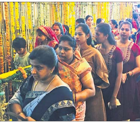
ମା'ଙ୍କ ଦର୍ଶନ ପାଇଁ ଶ୍ରଦ୍ଧାଳୁମାନେ ଯାଉଛନ୍ତି।

ଗୋଲାପୀ, ମା' ବୈଷ୍ଣବୀଙ୍କ ତୟଳ, ମା' ବରାହୀଙ୍କ ଧୂପ, ମା' ଇନ୍ଦ୍ରାଣୀଙ୍କ ଇନ୍ଦ୍ର