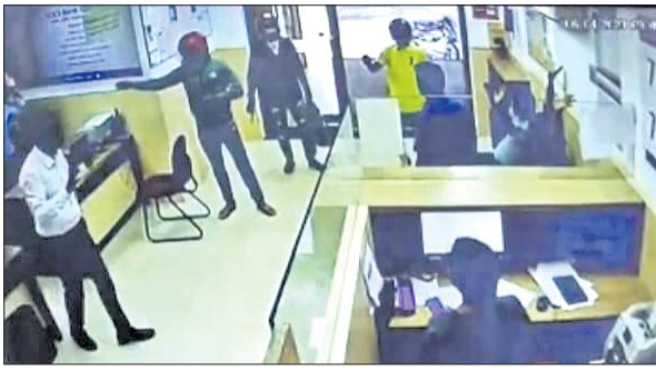
ବ୍ୟାଙ୍କ ପରିସର ଭିତରେ ଅଭିଯୁକ୍ତଙ୍କ ଲୁଟ୍ ଭଦ୍ୟମ ଦୃଶ୍ୟ ସିସିଟିଭିରେ କ୍ୟାପ୍ଚର।

ବାରଙ୍ଗ ଥାନା ଅଧୀନ ଡ୍ରିଫ୍ଟିଆ ଛକ ନିକଟ ପଞ୍ଚାବିଠାଠାରେ ଥିବା ଆଇସିଆଇଆଇ ବ୍ୟାଙ୍କରେ ଗୁରୁତ୍ୱପୂର୍ଣ୍ଣ ବନ୍ଧୁକ ଦେଖାଇ କରାଯାଇଥିବା ଲୁଟ୍ ଭଦ୍ୟମ ବିଫଳ ହୋଇଛି। ଗଣେଶ ମୁକ୍ତରେ ହେଲେମେଫ୍ ଲଗାଇ ବ୍ୟାଙ୍କ ଭିତରେ ପଶି ବନ୍ଧୁକ ଓ ଛୁରି ଦେଖାଇ ଲୁଟ୍ ଭଦ୍ୟମ କରିଥିଲେ ମଧ୍ୟ ହଠାତ୍ ବ୍ୟାଙ୍କ ସ୍ୱାଲରନ ବାଜିବାରୁ ଭୟଭୀତ ହୋଇ ଲୁଟ୍‌ଚୋରୀମାନେ ଆଶିର୍ୱା ପଳାସର ଗାଡ଼ିରେ ପଳାଇଯାଇଥିଲେ। ଏହି ସମୟରେ ଉଚ୍ଚସ୍ତରୀୟ ପ୍ରତିନିଧି ଦଳ ଏକ ଭିଡିଓ ବ୍ୟାଙ୍କରେ ଲାଗିଥିବା ସିସିଟିଭିରେ କ୍ୟାପ୍ଚର ହୋଇଛି। ଯାହା ଏବେ ସୋସିଆଲ ମିଡ଼ିଆରେ