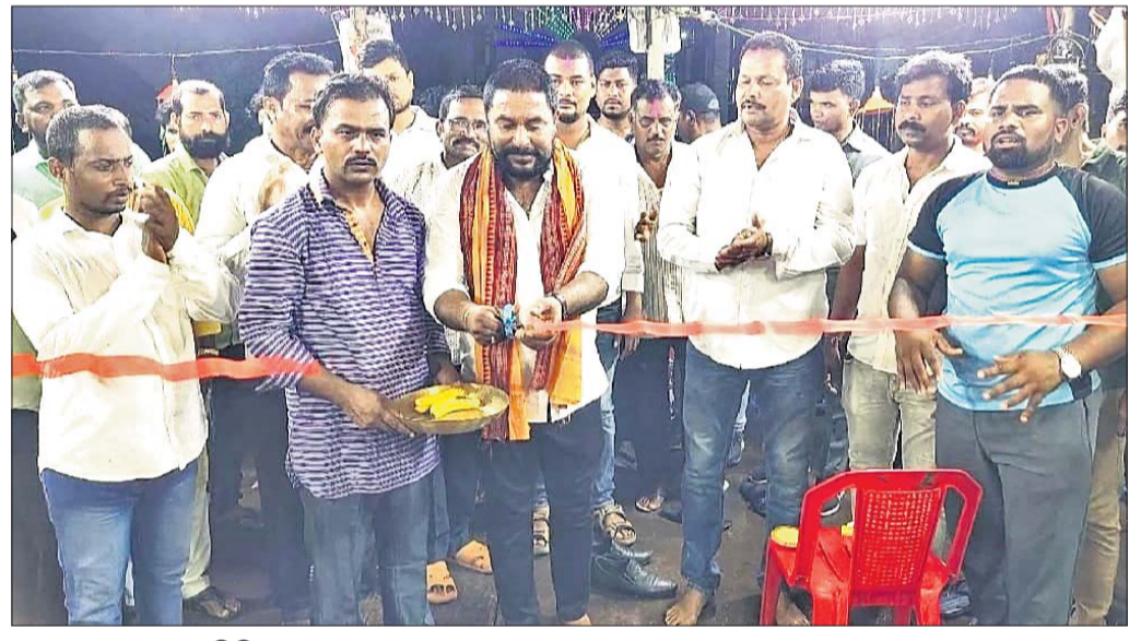
ନାଟକ ଉଦ୍‌ଯାପନ କରୁଛନ୍ତି ବିଧାୟକ ।