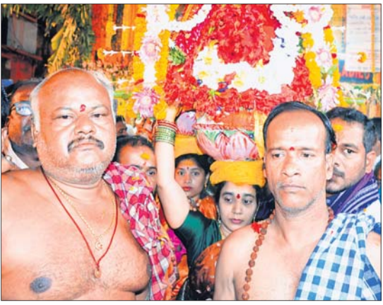
ମା'ଙ୍କ ଘଟ ପରିକ୍ରମା କରାଯାଇଛି।