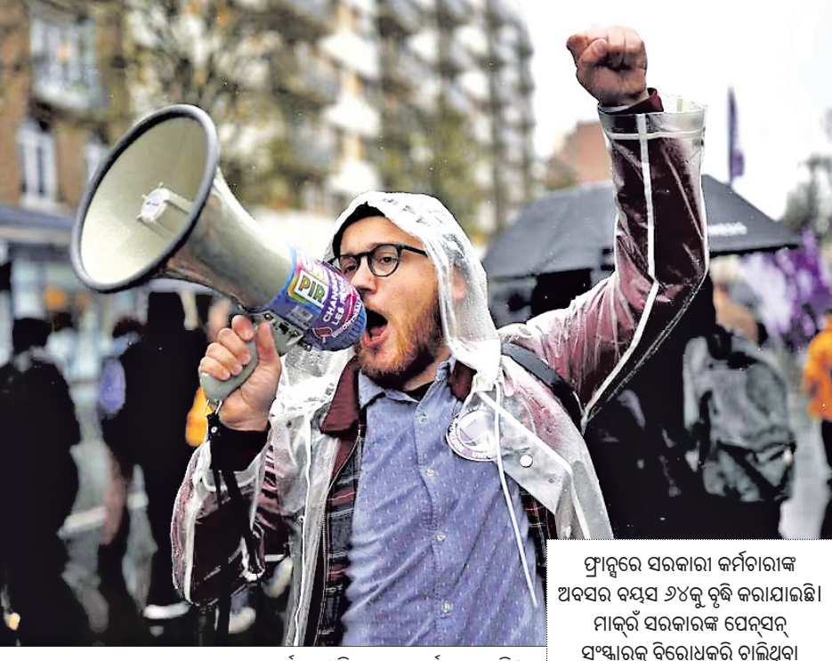
ଫ୍ରାନ୍ସରେ ରେନେସ୍ ସହରେ କଶେ କର୍ମଚାରୀ ବିରୋଧ ପ୍ରଦର୍ଶନ କରୁଛନ୍ତି।