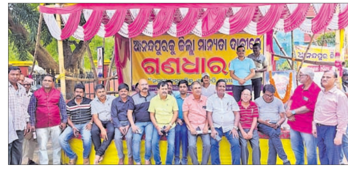
ଗଣଧାରଣାରେ ଔଷଧ ବ୍ୟବସାୟୀ ସଂଘ ସଭାସଭା