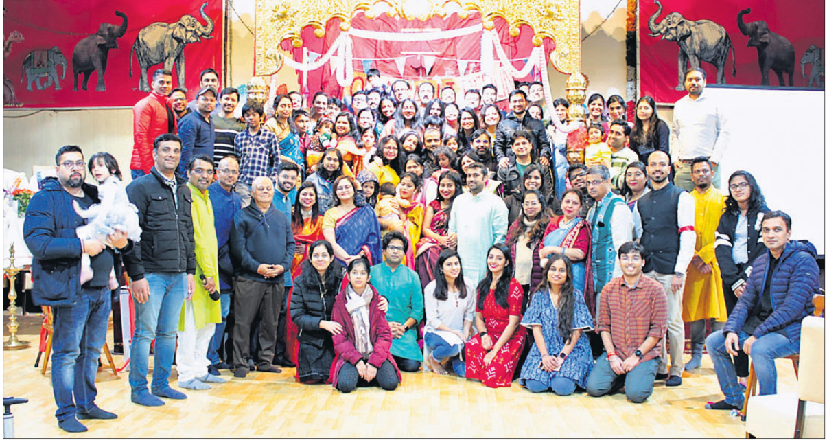
ଓଡ଼ିଆ ସମାଜ ବର୍ଲିନ ପକ୍ଷରୁ ୮୭ତମ ଓଡ଼ିଶା ଦିବସ କର୍ମନା ରାଜଧାନୀ ବର୍ଲିନରେ ପାଳିତ ହୋଇଯାଇଛି। ଏହି ପରିପ୍ରେକ୍ଷାରେ ବର୍ଲିନ ଓଡ଼ିଆ ସମାଜର ସଦସ୍ୟମାନେ ଏକତ୍ରିତ ହୋଇଛନ୍ତି।

୭ ଲକ୍ଷ ୨୦ ହଜାର ୧୩୫ ଟଙ୍କା, ୨୦୨୧ରେ ୨,୦୩୭ ମାମଲାରେ ୪୦ କୋଟି ୩୯ ଲକ୍ଷ ୭୦ ହଜାର ୫୧୪ ଟଙ୍କା ଏବଂ ୨୦୨୨ ଫେବୃୟାରୀ ପୂର୍ବା ୨୫୭ ମାମଲାରେ ୩ କୋଟି ୯୧ ଲକ୍ଷ ୮୬ ହଜାର ୯୩୩ ଟଙ୍କା ଲୁଟି ହୋଇଛି। କ୍ୱାଲିଫିକେସନ୍ ଲକ୍ଷ୍ୟ-୨୦୨୧ରେ ପ୍ରକାଶିତ ତଥ୍ୟ ଅନୁଯାୟୀ କାର୍ଯ୍ୟ ଅନୁପାତ ଦୃଷ୍ଟିରୁ ଓଡ଼ିଶାରେ ସାଇବର ଅପରାଧ ହାର ବଢ଼ିଚାଲିଛି। ୨୦୨୧ରେ ଓଡ଼ିଶାରେ ସାଇବର ଅପରାଧ ୪.୪ ପ୍ରତିଶତ ହୋଇଥିବା ବେଳେ ଦେଶରେ ୩.୧ ପ୍ରତିଶତ ରେକର୍ଡ଼ କରାଯାଇଥିଲା। ଅନ୍ୟପଟେ ସାଇବର ଅର୍ଥ ଲୁଟି ମାମଲାରେ ପୋଲିସ ୨୦୧୮ରେ ୧୦ ଲକ୍ଷ ୭୫ ହଜାର ୧୨୬ ଟଙ୍କା, ୨୦୧୯ରେ ୨୮ ଲକ୍ଷ ୪୬ ହଜାର