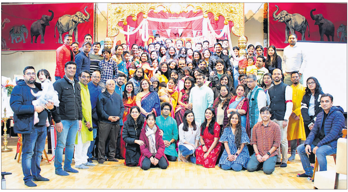
ଓଡ଼ିଆ ସମାଜ ବର୍ଲିନ ପସ୍ତୁର ୮୭ତମ ଓଡ଼ିଶା ଦିବସ କର୍ମନା ରାଜଧାନୀ ବର୍ଲିନରେ ପାଳିତ ହୋଇଯାଇଛି। ଏହି ପରିପ୍ରେକ୍ଷାରେ ବର୍ଲିନ ଓଡ଼ିଆ ସମାଜର ସଦସ୍ୟମାନେ ଏକତ୍ରିତ ହୋଇଛନ୍ତି।

୭ ଲକ୍ଷ ୨୦ ହଜାର ୧୩୫ ଟଙ୍କା, ୨୦୨୧ରେ ୨,୦୩୭ ମାମଲାରେ ୪୦ କୋଟି ୩୯ ଲକ୍ଷ ୭୦ ହଜାର ୫୧୪ ଟଙ୍କା ଏବଂ ୨୦୨୨ ଫେବୃଆରୀ ସୁଦ୍ଧା ୨୫୭ ମାମଲାରେ ୩ କୋଟି ୯୧ ଲକ୍ଷ ୮୬ ହଜାର ୯୩୩ ଟଙ୍କା ଲୁଟି ହୋଇଛି। କ୍ରାଇମ୍ ଇନ୍ ଇଣ୍ଡିଆ-୨୦୨୧ରେ ପ୍ରକାଶିତ ତଥ୍ୟ ଅନୁଯାୟୀ ଜାତୀୟ ଅନୁପାତ ଦୃଷ୍ଟିରୁ ଓଡ଼ିଶାରେ ସାଇବର ଅପରାଧ ହାର ବଢ଼ିଚାଲିଛି। ୨୦୨୧ରେ ଓଡ଼ିଶାରେ ସାଇବର ଅପରାଧ ୪.୪ ପ୍ରତିଶତ ହୋଇଥିବା ବେଳେ ଦେଶରେ ୩.୧ ପ୍ରତିଶତ ରେକର୍ଡ୍ କରାଯାଇଥିଲା। ଅନ୍ୟପଟେ ସାଇବର ଅର୍ଥ ଲୁଟି ମାମଲାରେ ପୋଲିସ ୨୦୧୮ରେ ୧୦ ଲକ୍ଷ ୭୫ ହଜାର ୧୨୭ ଟଙ୍କା, ୨୦୧୯ରେ ୬୮ ଲକ୍ଷ ୪୭ ହଜାର