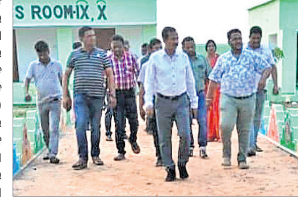
S ROOM-IX, X

ଭୁବନେଶ୍ୱର, ୭ (ସ.ପ୍ର.): ଡେକାନାଲ ଜିଲ୍ଲାପାଳ ସରୋଜ କୁମାର ସେଠୀ ଶୁକ୍ରବାର କାର୍ଯ୍ୟାଳୟରେ ଓ ଭୁବନେଶ୍ୱର ୪-ଟି ସ୍କୁଲର ବିଦ୍ୟାଳୟ କାର୍ଯ୍ୟ ଅନୁଧ୍ୟାନ କରିଛନ୍ତି।