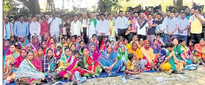
ବେଠିକରେ ଯୋଗଦେଇଥିବା ଅତିଥିଙ୍କ ସହ ବିଜେଡି କର୍ମୀମାନେ।