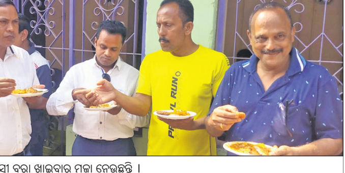
ସହରବାସୀ ବରା ଖାଇବାର ମଜା ବେଢ଼ିଛନ୍ତି ।

ଲୋକପ୍ରିୟ ବରା ଇତିହାସ ବହୁ ପ୍ରାଚୀନ। ସାଧାରଣ ପୂର୍ବରୁ ରାଜତନ୍ତ୍ର ଶାସନ ଥିବାବେଳେ ବରା ଅଞ୍ଚଳବାସୀଙ୍କ ଭାବାବେଗ ସହିତ ଯୋଡ଼ିହୋଇ ଆସିଛି। ବିଶେଷକରି ସହରବାସୀଙ୍କ ପାଇଁ ଏହା ନିତଦିନିଆ ଖାଦ୍ୟ ସାଧାରଣରେ ସୀମିତ ହୋଇଛି। ଏହି ପାରମ୍ପରିକ ଖାଦ୍ୟକୁ ଜିଆଇ ଟ୍ୟାଗ୍ ମାନ୍ୟତା ପାଇଁ ଉତ୍ତମ କରାଯିବ। ଜରୁରୀ ବୋଲି ଭୁଞ୍ଜିବାମାନା ନେ ଦାବି କରିଛନ୍ତି।