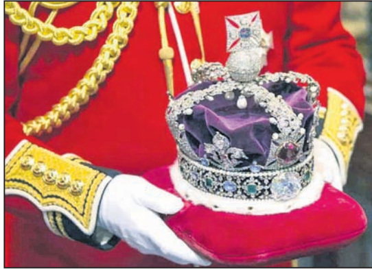
ରାଜ୍ୟାଧିକାରୀଙ୍କ ପାଇଁ ନିମନ୍ତ୍ରଣ ପତ୍ର ଛପା କରିବା ପାଇଁ ପଞ୍ଜାବୀ ୨୦୦୦ ଅତିଥି ଏହି ଭବ୍ୟ କାର୍ଯ୍ୟକ୍ରମରେ ସାମିଲ ହେବାକୁ ବ୍ୟବସ୍ଥା କରାଯାଇଛି।

ବ୍ୟବହାର କରୁଥିବା ପାନୀର ବେଲୁ ମଧ୍ୟ ଭାରତର ବୋଲି ଉକ୍ତ ପାଇଲରେ ଦର୍ଶାଯାଇଛି।