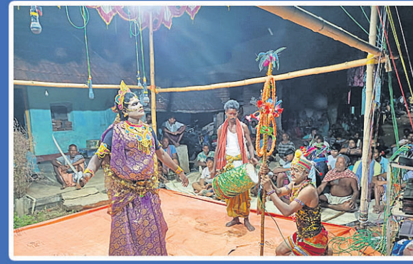
ନାନାପ୍ରକାରର ପୂଜାପତ୍ରରେ ଚାହିଆରେ ସଜ୍ଜିତ କରାଯାଇଥାଏ । ଦଣ୍ଡରେ ଅଗ୍ନି ସଂଯୋଗ କରି ଝୁଣା ମାରିଥାନ୍ତି । ପରେ ଗ୍ରାମର ଦେବଦେବୀଙ୍କ ପୀଠରେ ଧୂପ ଦେଇଥାନ୍ତି । ପରମ୍ପରା ଅନୁଯାୟୀ ପ୍ରଥମେ କୋଠିଘରଠାରେ ଦଣ୍ଡ ଠାକୁରଙ୍କୁ ପୂଜାର୍ଚ୍ଚନା କରାଯାଇଥାଏ । ପରେ ମାନସିକଧାରୀଙ୍କ ପାଇଁ

ଉପଦେଶ ଦେଲେ । ଏହା ଶୁଣି ବ୍ରହ୍ମା, ଇନ୍ଦ୍ର ଏବଂ କୁବେର ସମେତ ତେରଜଣ ବାଳକ କାଳବିଳମ୍ବନ କରି ମହାଦେବଙ୍କ ପାଖରେ ପହଞ୍ଚିଲେ । ସେତେବେଳେ ମହାଦେବ ରୁଦ୍ରକାଳୀଙ୍କୁ ପ୍ରାର୍ଥନା କରୁଥିଲେ । ସେହି ସମୟରେ ସାଧନାରେ କିଛି ବିଷ୍ଣୁ ଆଶଙ୍କାରେ ମା' ରୁଦ୍ରକାଳୀ ଆବିର୍ଭାବ ହୋଇ ବାଳକମାନଙ୍କୁ ଉଦ୍ଧାର କରିଥିଲେ । ଏହାପରେ ମହାଦେବ ଏବଂ ତେରଜଣ ବାଳକ ରୁଦ୍ରକାଳୀଙ୍କ ଦଣ୍ଡ ବ୍ରତ ପାଳନ ନିମନ୍ତେ ନିଷ୍ଠାର ସହିତ ଉପବାସ ଓ ରାତି ଉଜାଗର ରହି ଈଶ୍ଵରଙ୍କୁ ପ୍ରାର୍ଥନା କଲେ । ଏହି ସମୟରେ ତେରଜଣ ବାଳକ ନିଦରେ ଶୋଇପଡ଼ିଥିବାରୁ ମହାଦେବ ସେମାନଙ୍କୁ ଦଣ୍ଡ ସ୍ଵରୂପ ବେତମାଡ଼ ଦେଇ ନିଦ୍ରାଭଙ୍ଗ କରିଥିଲେ ବୋଲି ଧର୍ମବିଶ୍ଵାସ ରହିଛି । ତେବେ ଏହିବ୍ରତ ପାଳନରେ ବ୍ରତଧାରୀମାନେ ବିଭିନ୍ନ ଦଣ୍ଡ ଭୋଗ କରୁଥିବାରୁ ଏହା ଦଣ୍ଡପର୍ବ ବୋଲି କୁହାଯାଏ । ଏହି ପର୍ବରେ ଦଣ୍ଡବରଣ କରି ବା ନିଜକୁ କଷ୍ଟ ଦେଇ ଆରାଧ୍ୟା ଦେବତାଙ୍କଠାରୁ ଦୟା ବା କରୁଣା ଉଦ୍ରେକ କରିବା ଏବଂ ଶିବଙ୍କ ପ୍ରତୀକ ରୂପେ ସାହିକ ଭାବାପନ ହୋଇ ଦଣ୍ଡବେତ ପୂଜା କରିଥାନ୍ତି ।