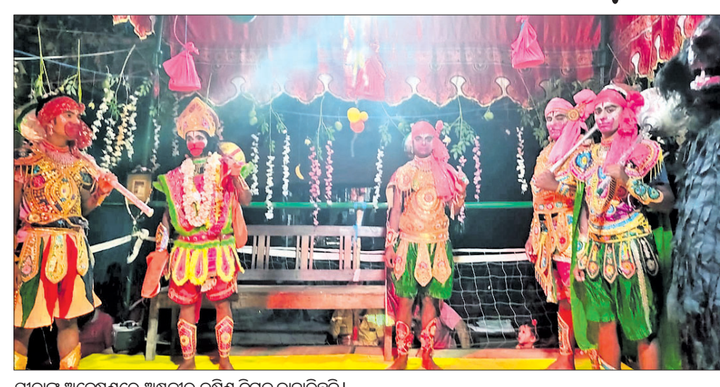
ସୀତାଙ୍କ ଅଦ୍ୱେଷଣରେ ଅଶ୍ୱକାର ଦକ୍ଷିଣ ଦିଗକୁ ବାହାରିଛନ୍ତି।

ଭେଡେନ, ୮୪(ଡି.ଏନ.ଏ) ବରଗଡ଼ ଜିଲ୍ଲା ଭେଡେନ ବ୍ଲକ ମହୁଳପାଳି ପଞ୍ଚାୟତ ଅନ୍ତର୍ଗତ ଗଣତନ୍ତ୍ରରେ ପ୍ରସିଦ୍ଧ ସୀତା ଠାର ଲଙ୍କାପୋଡ଼ି ମଞ୍ଚସ୍ଥ ପ୍ରଦର୍ଶନ ହେଉଛି। ନାଟ୍ୟାଭିନୟରେ ବାଳି ବଧ ପରେ ରାମଚନ୍ଦ୍ର ପୁସ୍ତାବକୁ