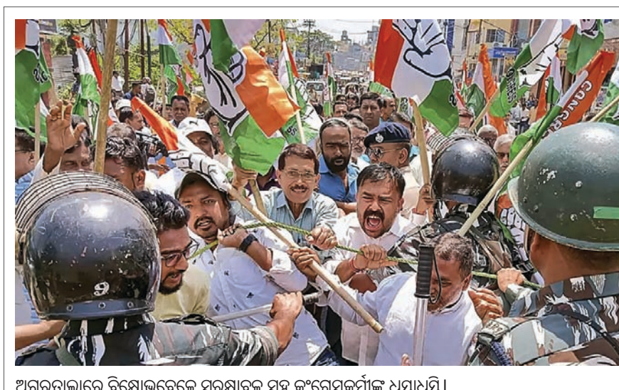
ଅଗରତାଳାରେ ବିକ୍ଷୋଭବେଳେ ସୁରକ୍ଷାବଳ ସହ କଂଗ୍ରେସକର୍ମୀଙ୍କ ଧସାଧସି।