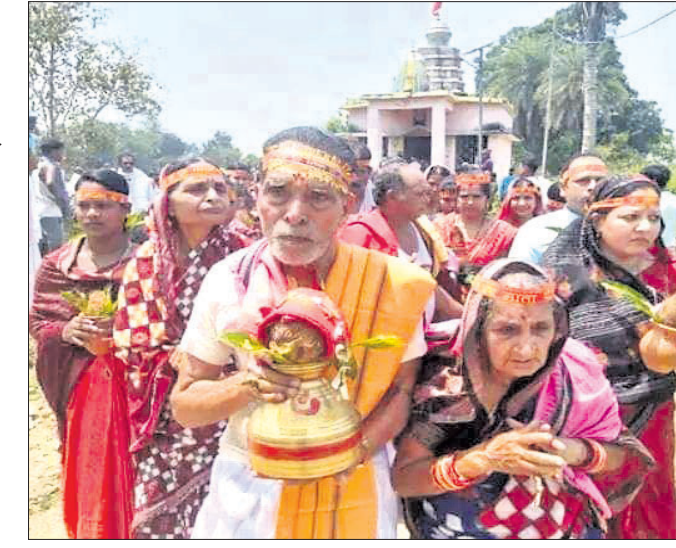
ମନ୍ଦିର ପ୍ରତିଷ୍ଠା ସମାରୋହରେ କଳସ ଯାତ୍ରା।

ଅଗାଧିକାରୀ, ୮୪(ଡି.ଏନ.ଏ.) ବରଗଡ଼ ଜିଲ୍ଲା ଅଗାଧିକାରୀ ବ୍ଲକ ମନାପଡ଼ା ଗ୍ରାମରେ ନବନିର୍ମିତ ସମଲେଶ୍ୱରୀ ମନ୍ଦିର ପ୍ରତିଷ୍ଠା ସମାରୋହ ଆରମ୍ଭ ହୋଇଛି। ଏହି ମହୋତ୍ସବ ରବିବାର ପୂର୍ଣ୍ଣାହୁତି ସହ ଦୋଳାଳ ବଜାର, ଶିକ୍ଷାନୁଷ୍ଠାନ ବନ୍ଦ ରହିଥିଲା। ଟାକ ବିଭାଗରେ ଅଞ୍ଚଳରେ ଶୋକର ଛାୟା ଖେଳିଯାଇଛି।