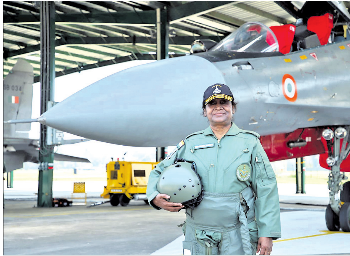
ଶନିବାର ସୁଖୋଇ-୩୦ ଏମ୍‌କେଆଇ ମୁଖ୍ୟମନ୍ତ୍ରୀଙ୍କୁ ଭେଟିବା ପରେ ଆସାମର ତେଜପୁର ବାୟୁସେନା ଷ୍ଟେସନରେ ରାଷ୍ଟ୍ରପତି ଦ୍ରୌପଦୀ ମୁର୍ମୁ ।