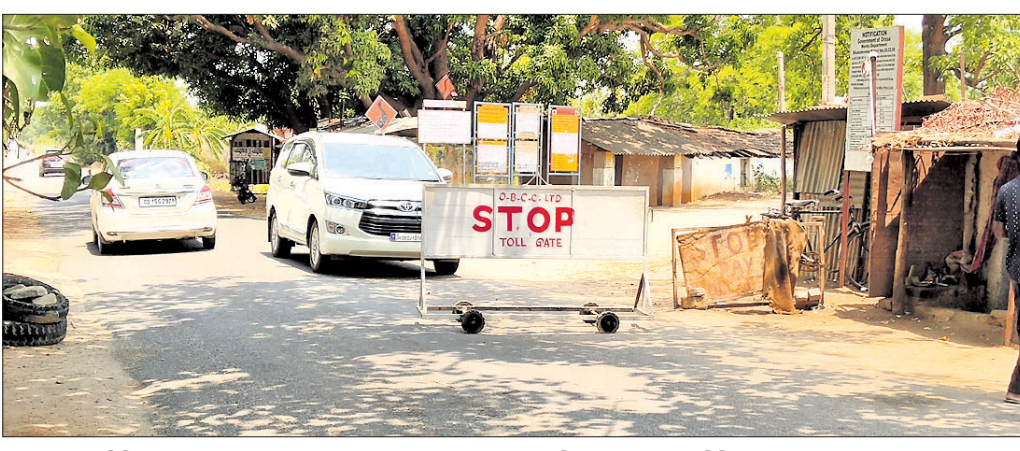
ସୋନପୁର-ବିନିକା ରାସ୍ତାର ଯୋଡ଼ାଧାରରେ ଥିବା ଟୋଲଗେଟରେ ଟିକସ ଆଦାୟ ରାଜିଛି।

ସୁବର୍ଣ୍ଣପୁର ଜିଲ୍ଲାର ୩ଟି ସ୍ଥାନରେ ଥିବା ପଥକର ଫାଟକ(ଟୋଲ ଗେଟ)ରୁ ଦୀର୍ଘ ବର୍ଷ ଧରି ଟିକସ ଆଦାୟ ହେଉଛି। ତ୍ରିକ୍ ନିର୍ମାଣର ଖର୍ଚ୍ଚ ବାହାରି ସାରିଥିଲେ ମଧ୍ୟ ସରକାର ଟୋଲଗେଟରୁ ଟିକସ ବନ୍ଦ କରୁନାହାନ୍ତି। ବିଧାନସଭାରେ ପ୍ରଶ୍ନ ପଚାରିଲେ ମଧ୍ୟ ସ୍ୱଳ୍ପ ଉତ୍ତର ମିଳୁଛି। ସାଧାରଣରେ ଏଥିନେଇ ପ୍ରବଳ ଅସନ୍ତୋଷ ଦେଖା ଦେଇଥିଲା ବେଳେ ରାଜନେତା ଓ ପ୍ରଶାସନ ଅସହାୟ ହୋଇ ପଡିଛନ୍ତି। ସୋନପୁର-ବିନିକା-ଭୁବନେଶ୍ୱର ରାସ୍ତାର ଯୋଡ଼ାଧାରରେ ଅଧିକାରୀ ଉପରେ ୩୦ବର୍ଷ ପୂର୍ବରୁ ତ୍ରିକ୍ ନିର୍ମାଣ ହୋଇଛି। ସେହି ଦିନଠାରୁ ଓଡ଼ିଶା ତ୍ରିକ୍ ନିର୍ମାଣ ସଂସ୍ଥା ପକ୍ଷରୁ ପ୍ରତ୍ୟେକ ବର୍ଷ ଟିକସର କରାଯାଇ ଟୋଲ ଟିକସ ଆଦାୟ କରାଯାଉଛି। ତ୍ରିକ୍ ନିର୍ମାଣରେ ସେତେବେଳେ ୩କୋଟି ଟଙ୍କା ବ୍ୟୟ ହୋଇଥିଲା। ବର୍ତ୍ତମାନ ସୁଦ୍ଧା ଟୋଲ ଟିକସରୁ ୯ କୋଟିରୁ ଊର୍ଦ୍ଧ୍ୱ ଟଙ୍କା ଆଦାୟ ସରିଲାଣି। ତଥାପି ମହାସୁଧା ଫାଟକ ବନ୍ଦ ହେଉଛି। ଏହି ରାସ୍ତା ଦେଇ ଯାତାୟତ କରୁଥିବା ଯାନବାହାନରୁ ଯଥାସମ୍ଭବ ଟିକସ ଆଦାୟ ରାଜିଛି। ସୁବର୍ଣ୍ଣପୁର ଓ ବୌଦ୍ଧ ଜିଲ୍ଲାର ଅଧିକାରୀ ବୁଲି ଚାଲୁଛନ୍ତି ମାହାସୁଧା ଆଦାୟ କରାଯାଉଛି। ଏହି ମୁଖ୍ୟ ରାସ୍ତାଦେଇ ଦୈନିକ ଶତାଧିକ ଯାନବାହାନ ସମ୍ବଳପୁର, ବୁଲି ଓ ବାରମହାରାଜପୁର ଯିବା ଆସିବା କରୁଛି। ଆଶ୍ଚର୍ଯ୍ୟର ବିଷୟ ସୋନପୁର ତ୍ରିକ୍ ସହିତ ବୌଦ୍ଧ ଜିଲ୍ଲାର ବୌଦ୍ଧ-ଟିଆକଟା ତ୍ରିକ୍ କାର୍ଯ୍ୟ ସମାନ ସମୟରେ ସରିଥିଲା। ବୌଦ୍ଧରେ ମହାସୁଧା ଅସୁଲି ଅନେକ ବର୍ଷ