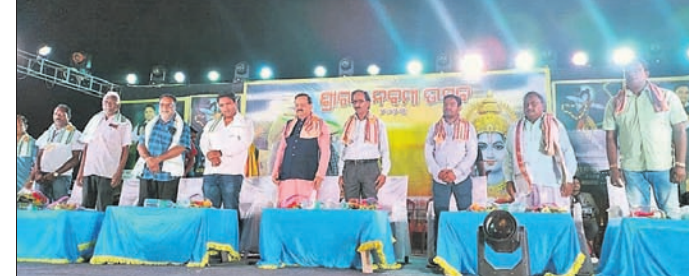
ଉଦ୍‌ଘାଟନା କାର୍ଯ୍ୟକ୍ରମରେ ମଞ୍ଚାପାଳ ଅତିଥିମାନେ।

ଆଠମଲ୍ଲିକ ବୃକ୍ଷ ଅଞ୍ଚଳ ପଞ୍ଚାୟତ ଓଲଥ ଗ୍ରାମସ୍ଥିତ ରାମ ମନ୍ଦିରରେ ୯ ଦିନ ଧରି ଚାଲିଥିବା ରାମ ନବମୀ ଉତ୍ସବ ପ୍ରତିଷ୍ଠା ତଥା ସାମାଜିକ କର୍ମ ନାମ ସଂକୀର୍ତ୍ତନ, ମେଳୋତି ଆଦି ଅନୁଷ୍ଠିତ ହୋଇଥିଲା।