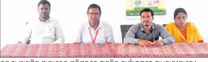
ବଲଶା ପ୍ରାଥମିକ ସ୍ୱାସ୍ଥ୍ୟକେନ୍ଦ୍ର ପରିସରରେ ଅନୁଷ୍ଠିତ କାର୍ଯ୍ୟକ୍ରମରେ ଅଧିକାରୀମାନେ।

ତାଳଚେର ରୋପାଲପ୍ରସାଦପୁର ମା' ହିରୁକା ପୀଠରେ ଚାଲିଥିବା ୧୯ ତମ ଲୋକମହୋତ୍ସବର ଚତୁର୍ଥ ସମ୍ପର୍କରେ ବିଭିନ୍ନ ସାଂସ୍କୃତିକ କାର୍ଯ୍ୟକ୍ରମ ଅନୁଷ୍ଠିତ ହୋଇଥିଲା।