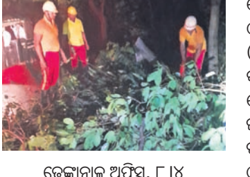
ଡେଙ୍କାନାଳ ଅଫିସ୍, ୮୪