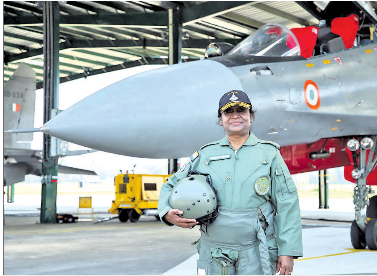
ଶନିବାର ସୁଖୋଇ-୩୦ ଏମ୍ବେକଆଇ ମୁଖ୍ୟମନ୍ତ୍ରୀଙ୍କ ସହିତ ଭିଡ଼ା କରିବା ପରେ ଆସାମର ତେଜପୁର ବାୟୁସେନା ଷ୍ଟେସନରେ ରାଷ୍ଟ୍ରପତି ଦ୍ରୌପଦୀ ମୁର୍ମୁ ।