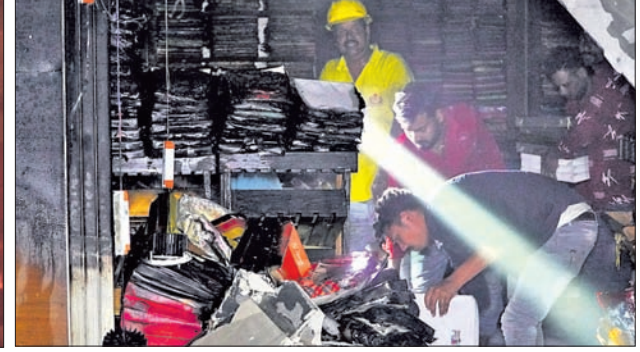
ନିଆଁ ଲିଭାଇବା ପରେ ବୋକାନ ଭିତରୁ ଶାଢ଼ିସବୁ ବାହାରକୁ ଅଣାଯାଇଛି।