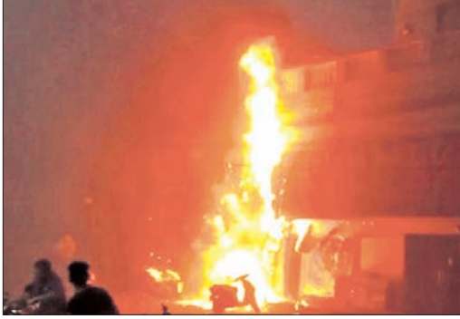
ଅନୁଗୋଳ ବଜାରରେ ଥିବା ଶାଢ଼ି ଗୋ'ରୁ ମଙ୍ଗଳମରେ ନିଆଁ।