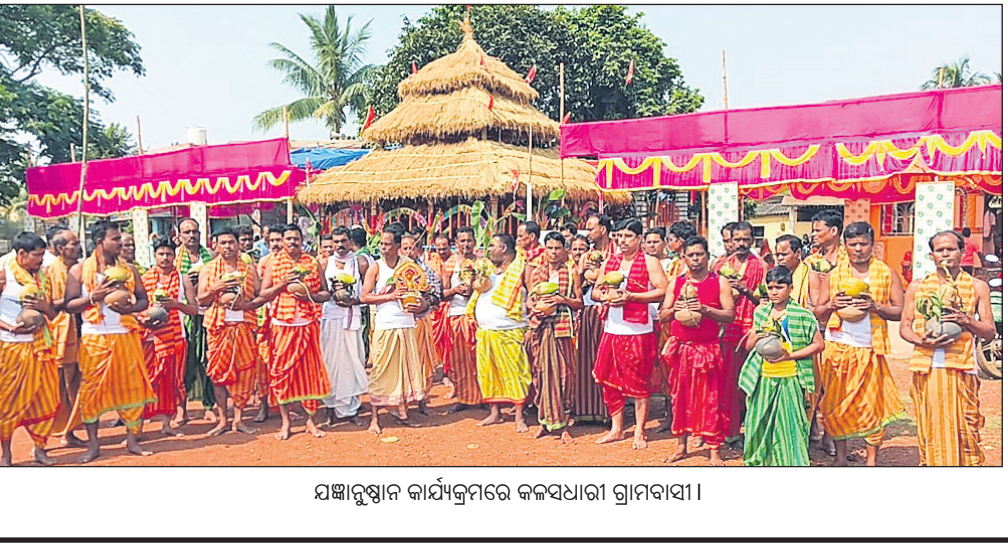
ଯଜ୍ଞାବସ୍ଥାନ କାର୍ଯ୍ୟକ୍ରମରେ କଳସଧାରୀ ଗ୍ରାମବାସୀ।