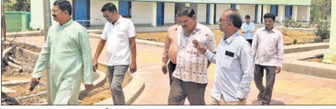
ବିଧାୟକ ବିଦ୍ୟାଳୟ ପରିଦର୍ଶନ କରି ଫେରାଉଛନ୍ତି।

ନୃତ୍ୟ ପରିବେଷଣ କରି ଦର୍ଶକମାନଙ୍କ ମନ ଜିଣି ନେଇଥିଲେ। ସଞ୍ଚାର ଜନନୀୟରେ ଉନ୍ନତ କରିଥିଲେ। ସେହିପରି ପଶୁମୁଖା ନୃତ୍ୟ ପରିବେଷଣ କରିବାକୁ ନିର୍ଦ୍ଦେଶ ଦେଇଛନ୍ତି।