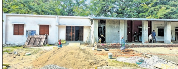
ଅସ୍ଥାୟୀ ଜ୍ୟେମ୍‌ସପସି କୋର୍ଟ ଲାଗି ଜାମିନ ଗାଳିଛି।