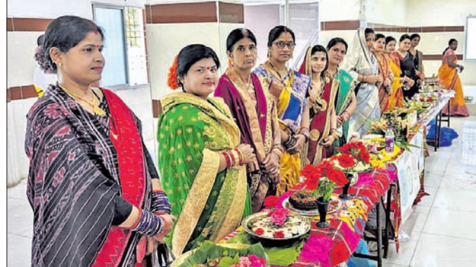
ପିଠା ପ୍ରତିଯୋଗିତାରେ ଭାଗ ନେଇଥିବା ମହିଳାମାନେ।

ରାୟଗଡ଼ା ବିଷୁବ ବନ୍ଧୁମିଳନ ଉତ୍ସବ କମିଟି ତରଫରୁ ବିଭିନ୍ନ ପ୍ରତିଯୋଗିତା କରାଯାଇଛି। ଶିବିରର ରାୟଗଡ଼ା ସହର କୃଷିଚକ୍ର ନଗର ଭବନ ଠାରେ 'ଓଡ଼ିଆ ପିଠା ପ୍ରତିଯୋଗିତା' କାର୍ଯ୍ୟକ୍ରମ ଆୟୋଜିତ ହୋଇଥିଲା।