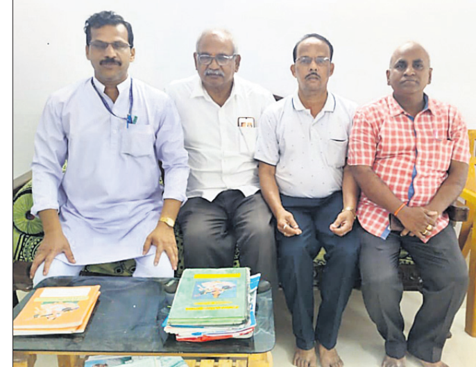
ରଜତ ଜୟନ୍ତୀ ପାଳନ କେଳି ସୂଚନା ପ୍ରଦାନ କରାଯାଇଛି।

ରାୟଗଡ଼ା ଜିଲ୍ଲା ଅଧିକାରୀ ପୋଲିସ ଦାସିନୀ ଧରଣୀ ଯୋଗେ ଥିବା ଏକାଧିକ ମାମଲାର ଅଭିଯୁକ୍ତ ବୁଲୁ ଗିରଫ କରାଯାଇଛି।