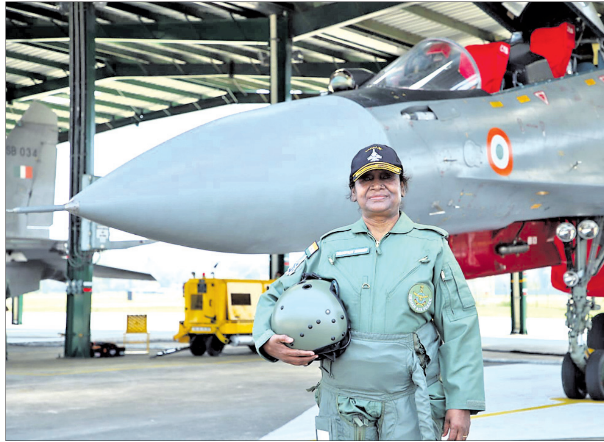
ଶନିବାର ସୁଖୋଇ-୩୦ ଏମ୍ବେକ୍ସାଲ୍ ମୁକ୍ତିପାନରେ ଉଡ଼ାଣ କରିବା ପରେ ଆସାମର ତେଜପୁର ବାୟୁସେନା ଷ୍ଟେଶନରେ ରାଷ୍ଟ୍ରପତି ଦ୍ରୌପଦୀ ମୁର୍ମୁ ।