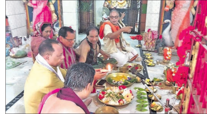
ମନ୍ଦିର ପ୍ରତିଷ୍ଠା ପାଇଁ ପୂଜାର୍ଚ୍ଚନା କରାଯାଇଛି।

ରାୟଗଡ଼ା ଜିଲ୍ଲା ଗୁଣ୍ଡାପୁର କଲେଜ ନିକଟ ସିଦ୍ଧ ବିନାୟକ ମନ୍ଦିରର ୧୩ତମ ପ୍ରତିଷ୍ଠା ଉତ୍ସବ ଅନୁଷ୍ଠିତ ହୋଇଯାଇଛି। ଏଥିରେ ବିଧାୟକ ରଘୁନାଥ ଗମାଙ୍ଗ ଯୋଗଦେଇଥିଲେ।