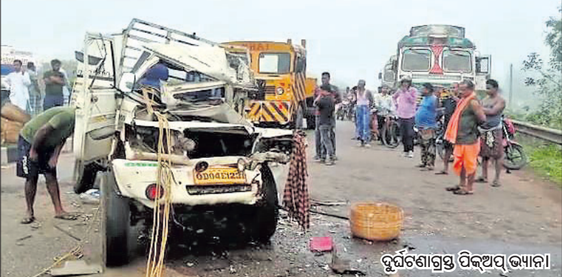
ଦୁର୍ଘଟଣାସ୍ଥଳ ପିକ୍‌ଅପ୍ ଭ୍ୟାନ।