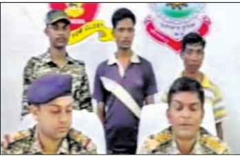
ମାଲକାନଗିରି, ୮୪