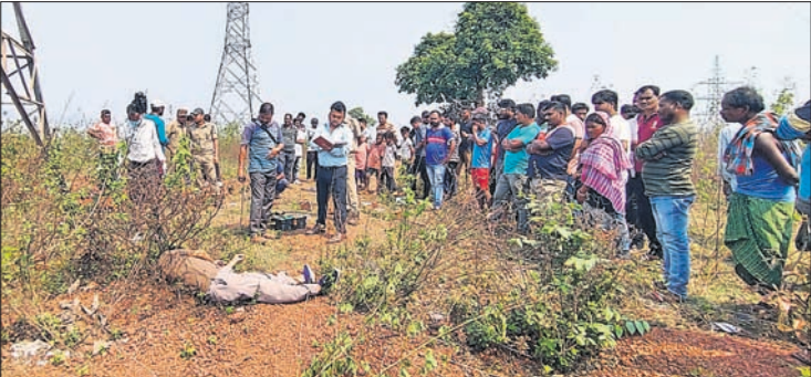
ଓଏମ୍‌ଡିସି କର୍ମଚାରୀ ଦୁର୍ଘଟାସ୍ଥଳରେ ବାରିକକ ମୃତଦେହ।