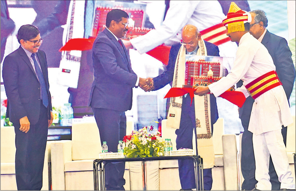
ସୁପ୍ରିମକୋର୍ଟର ପୂର୍ବତନ ପ୍ରଧାନ ବିଚାରପତି ଗୋପାଳ ବଲ୍ଲଭ ପଟ୍ଟନାୟକଙ୍କୁ ସମ୍ବର୍ଦ୍ଧିତ କରାଯାଇଛି ।

କଟକ ଅଫିସ,୮୪: ପୂର୍ବତନ ମୁଖ୍ୟ ବିଚାରପତି, ବିଚାରପତିଙ୍କୁ ସମ୍ବର୍ଦ୍ଧନା ଓଡ଼ିଶା ହାଇକୋର୍ଟର ୭୫ ବର୍ଷ ପୂର୍ବ ପାଳନ ଉପଲକ୍ଷେ ବର୍ଷତମାମ ବିଭିନ୍ନ କାର୍ଯ୍ୟକ୍ରମ ଅନୁଷ୍ଠିତ ହେଉଛି । ଏହି କ୍ରମରେ ପୂର୍ବତନ ମୁଖ୍ୟ ବିଚାରପତି ଓ ବିଚାରପତିମାନଙ୍କୁ ସମ୍ବର୍ଦ୍ଧନା ଉତ୍ସବ କଟକ ଜବାହରଲାଲ ନେହେରୁ ଜନ୍ମତୋର ଷ୍ଟାଡ଼ିୟମଠାରେ ଶନିବାର ଆୟୋଜିତ ହୋଇଥିଲା । ଏଥିରେ ସୁପ୍ରିମକୋର୍ଟ ବିଚାରପତି ବି. ଆର୍. ଗଭାଲ ଅଧ୍ୟକ୍ଷତା କରି କହିଥିଲେ, ଓଡ଼ିଶା ହାଇକୋର୍ଟ ଗତ ୭୫ ବର୍ଷ ମଧ୍ୟରେ ଆଇନକୁ ବିକଶିତ କରିବା ସହିତ ଅନେକ ଉଲ୍ଲେଖନୀୟ ରାୟ ପ୍ରଦାନ କରି ଆଇନ କ୍ଷେତ୍ରରେ ଏକ ଚେଷ୍ଟାସେଚର ଭାବେ ପ୍ରମାଣିତ ହୋଇପାରିଛି । ସୁପ୍ରିମକୋର୍ଟକୁ ଓଡ଼ିଆ ବିଚାରପତିମାନଙ୍କ ଅବଦାନ ବହୁତ ରହିଛି । ବିଚାରପତି ଗଭାଲ ମଧୁବାବୁଙ୍କ ଶ୍ରଦ୍ଧାଞ୍ଜଳି ଜଣାଇବା ସହ ଓଡ଼ିଶା ସ୍ୱାଧୀନତା ଆନ୍ଦୋଳନର କର୍ଣ୍ଣଧାର ବୋଲି କହିଥିଲେ । ଓଡ଼ିଶା ହାଇକୋର୍ଟ ମୁଖ୍ୟ ବିଚାରପତି ଏସ୍. ମୁରଲୀଧର କହିଥିଲେ, ଆସନ୍ତା ଜୁଲାଇ ୨୬ରେ ହାଇକୋର୍ଟ ୭୫ ବର୍ଷ ପୂର୍ବ ପାଳନ କରିବ, ଯାହା ଦୀର୍ଘ ନ୍ୟାୟିକ ଯାତ୍ରାର ଏକ ମାଇଲଖୁଣ୍ଟ । କଟକରେ