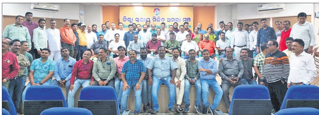
ବୈଠକରେ ଉପସ୍ଥିତ ଜିଲ୍ଲାସ୍ତରୀୟ ମିଳିତ ଅମଲା ମଞ୍ଚ ସଦସ୍ୟମାନେ।

ଉପରେ ଆଲୋଚନା କରାଯାଇଥିଲା। ବେତନ ବୃଦ୍ଧି ନେଇ ରାଜ୍ୟ ସରକାରଙ୍କ ଚାଲୁ ନୀତିକୁ ନେଇ ଜିଲ୍ଲାସ୍ତରୀୟ ଅମଲାଙ୍କ ମଧ୍ୟରେ ତୀବ୍ର ଅସନ୍ତୋଷ ପ୍ରକାଶ ପାଇଥିଲା। ରାଜ୍ୟ ସରକାର ୨୦୧୭ରୁ ଜିଲ୍ଲାସ୍ତରୀୟ ପ୍ରତିନିଧିମାନେ ଯୋଗ ଦେଇଥିଲେ। ଅମଲାମାନଙ୍କର ବେତନରେ ଥିବା ଅସନ୍ତୋଷ ଦୂର କରିବାରେ ରାଜ୍ୟ ସରକାରଙ୍କ ବିନାମୁକ୍ତ ମନୋଭାବ