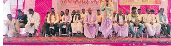
ବୈଠକରେ ଉପସ୍ଥିତ ଅତିଥିମାନେ।