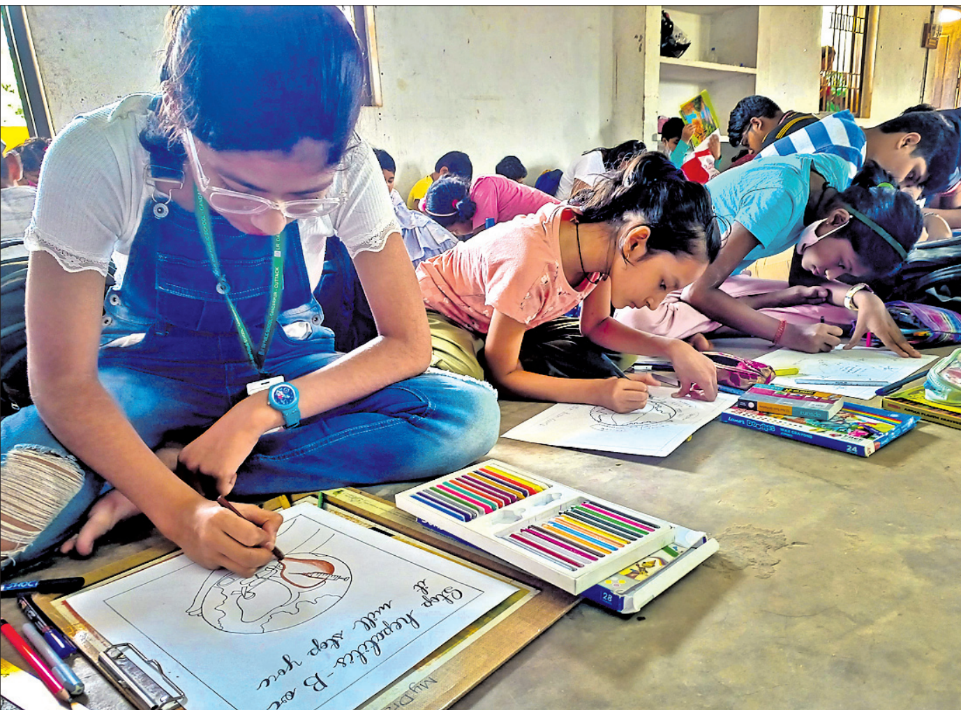
କଟକ ଆର୍ଟିଷ୍ଟ ଅର୍ଗାନାଇଜେଶନ ଓ କଲିଙ୍ଗ ଗ୍ୟାଲେରୀ ଏସୋସିଏସନଙ୍କ ଫାଉଣ୍ଡେସନ ପକ୍ଷରୁ ରବିବାର ଗ୍ରାମୀଣ କଳାବିକାଶ କେନ୍ଦ୍ରରେ ହେପାଟାଇଟିସ୍-ବି ସମ୍ପର୍କିତ ଚିତ୍ରାଙ୍କନ ପ୍ରତିଯୋଗିତାରେ ଭାଗନେଇଥିବା ଛାତ୍ରାଛାତ୍ରୀ।

ବଲିଉଡ୍ ସୁପରଷ୍ଟାର ଶାହାରୁଖ୍ ଖାନ କଲିକତାରେ ଏସିଡ୍ ଆକ୍ରମଣର ଶିକାର ହୋଇଥିବା ମହିଳାଙ୍କୁ ଭେଟିଛନ୍ତି।