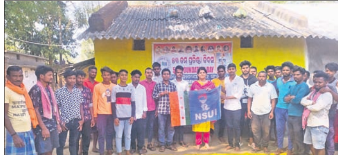
ଅତିଥିମାନେ ଦକ୍ଷାୟ ପତାକା ଦେଖାଉଛନ୍ତି।

ଏନ୍ଏସ୍‌ୟୁଆଇର ୫୩ତମ ପ୍ରତିଷ୍ଠା ଦିବସ ରବିବାର ନବରଙ୍ଗପୁର ଜିଲ୍ଲା ଛାତ୍ର କଂଗ୍ରେସ ପାଳନ କରିଛି। ରବିବାର ନବରଙ୍ଗପୁର ଜିଲ୍ଲା ନବୀହାତ୍ତି ବ୍ଲକ୍‌ର ସମ୍ପୂର୍ଣ୍ଣ ମତ ପୂଜ୍ଞ ଗ୍ରାମ ବୈରାଗିରୁଆରେ ଆଦିବାସୀ ଓ ଦଳିତ ଛାତ୍ରମାନଙ୍କୁ ନେଇ ଏହି ଦିବସ ପାଳନ କରାଯାଇଛି।