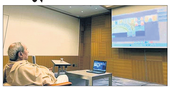
ଜାପାନର କିଟୋରୁ ରବିବାର ମୁଖ୍ୟମନ୍ତ୍ରୀ ନବୀନ ପଟ୍ଟନାୟକଙ୍କ ଭର୍ଚୁଆଲ୍ ମାଧ୍ୟମରେ କ୍ୟାବିନେଟ୍ ବୈଠକରେ ଅଧ୍ୟକ୍ଷତା କରୁଛନ୍ତି।

ଭୁବନେଶ୍ୱର, ୯/୪ (ବ୍ୟୁରୋ) ଓଡ଼ିଶା ପରିବାର ନିର୍ଦ୍ଦେଶାଳୟ ସକାଶେ 'ପରିବାର-୯୯' ପୋର୍ଟାଲ ଫର୍ ପ୍ରବାସୀ ଓଡ଼ିଆଙ୍କୁ-କନେକ୍ଟିଂ ନ ଚାହୁଁ ନାମକ ଉପକ୍ରମକୁ ପୋର୍ଟାଲ ହେବ। ଏହାସହ