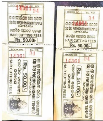
କଟାଯାଇଥିବା ଚିକିତ୍ସା ଏସ୍ତିତ୍ସିରୁ ମୁଣ୍ଡନ ବାବଦ ୩୦୦ରୁ ଅଧିକ ଟଙ୍କା ଲୁଟି ହେଉଛି। ଏହାର ସୁଯୋଗ ନେଇ ନକଲି ଚିକିତ୍ସା ଦିଆଯାଇଛି।

ରାୟଗଡ଼ାର ଅଧିକାରୀ ଦେବୀ ମା' ମଝିଘରିଆଣିଙ୍କ ମନ୍ଦିର ରସିଦ୍ ବହିରେ କାଲିଆତି କରାଯାଇଛି। ମନ୍ଦିରର କେତେକ ଅଧିକାରୀ ମା'ଙ୍କ ନିକଟକୁ ମୁଣ୍ଡନ ପାଇଁ ଆସୁଥିବା ମାନସିକଧାରୀଙ୍କୁ ନକଲି ଚିକିତ୍ସା ଦେଇ ଲକ୍ଷାଧିକ ଟଙ୍କା ଲୁଟି କରିଛନ୍ତି। ମନ୍ଦିର ଗ୍ରନ୍ଥ ବାଚା ନିୟୋଜିତ କର୍ମଚାରୀ ଏହି କାଲିଆତି କରିଥିବା ଅଭିଯୋଗ ହୋଇଛି।