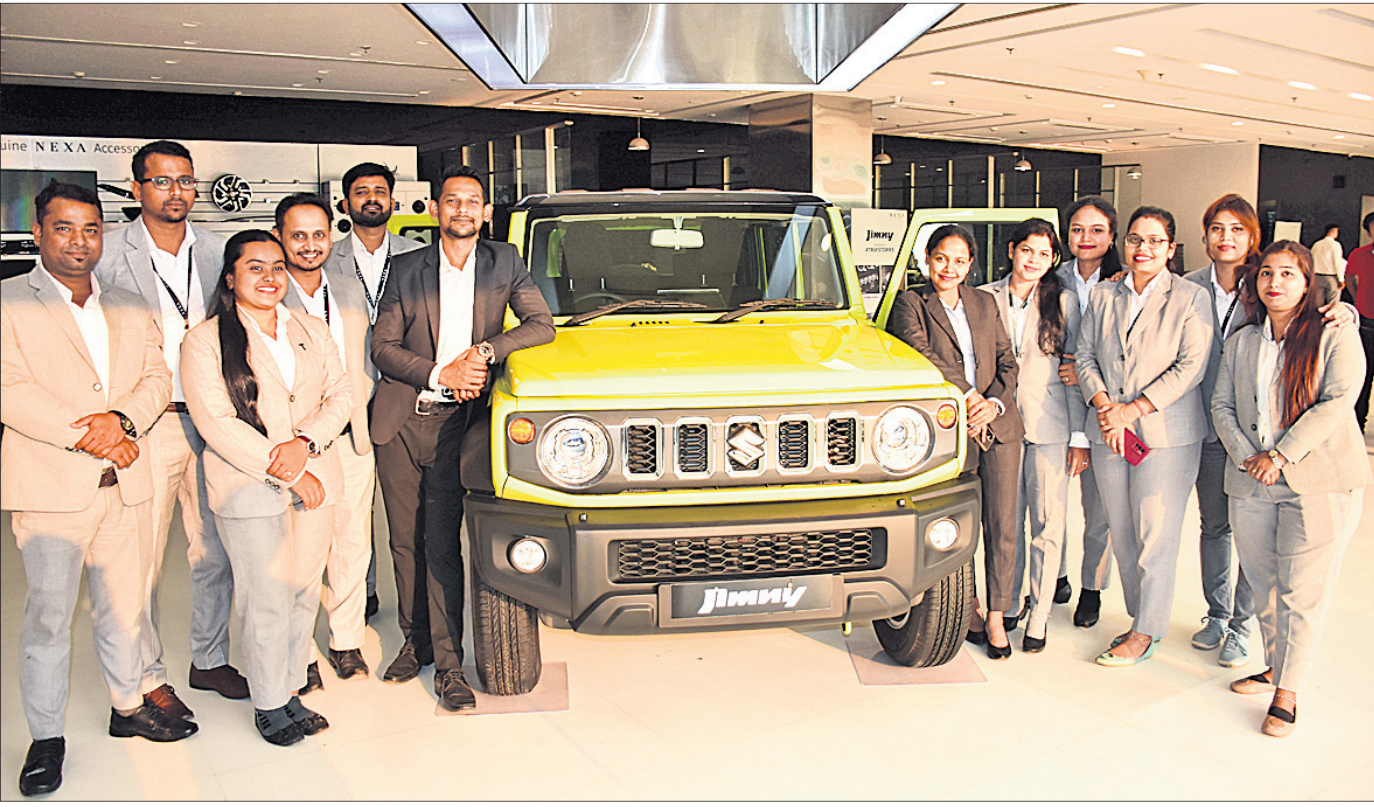
ଭୁବନେଶ୍ୱର ପତିଆସ୍ଥିତ ନେକ୍ସା ସାଇବର୍ସିଟିରେ ଆୟୋଜିତ ମାରୁତି ସୁଜୁକି ଜିମ୍ନିର ୨ ଦିନିଆ ଷ୍ଟରଟ୍ ପ୍ରଦର୍ଶନ ଅବସରରେ ଶୋ'ରୁମର କର୍ମଚାରୀମାନେ ଉପସ୍ଥିତ ଅଛନ୍ତି ।