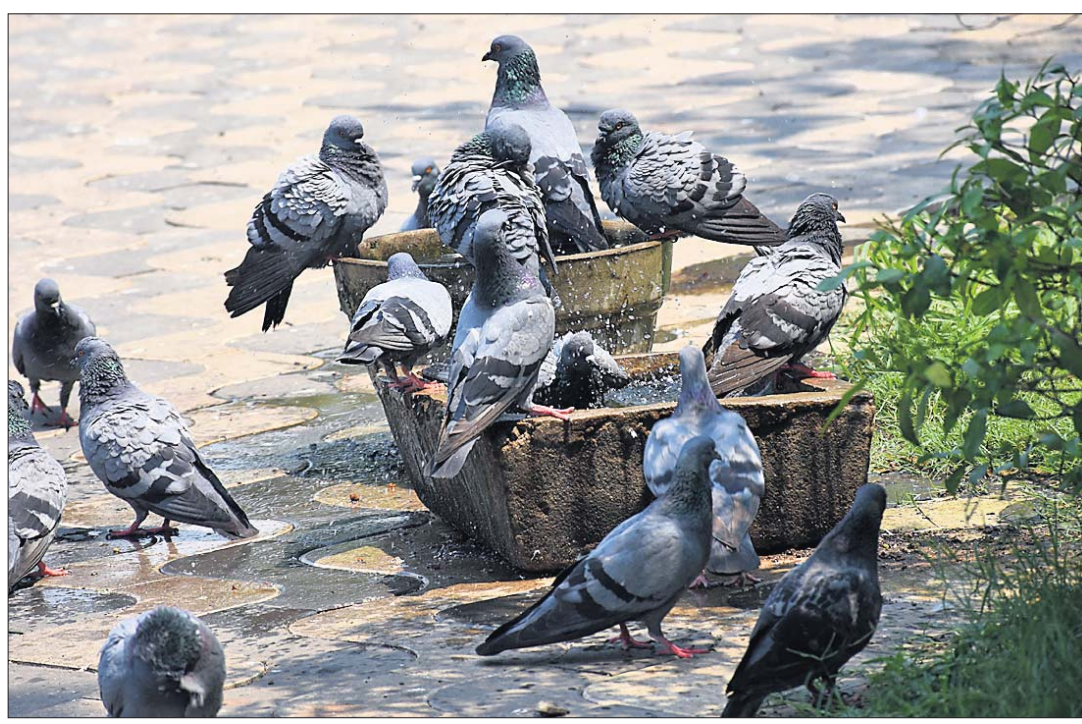
ତାତି ବଢ଼ାଇଲା ଶୋଷ: ରାଜଧାନୀ ଭୁବନେଶ୍ୱରର ଯୋଗବାର ଚାପମାତ୍ରା ୩୯ ଡିଗ୍ରୀ ଛୁଇଁଥିବାବେଳେ ଏକ ଛକ ନିକଟରେ ଥିବା ପାଣିକୂଣ୍ଡରେ ପାରାମାନେ ଦଳବଦ୍ଧ ହୋଇ ଗାଧୋଇବା ସହ ପାଣି ପିଇଛନ୍ତି।