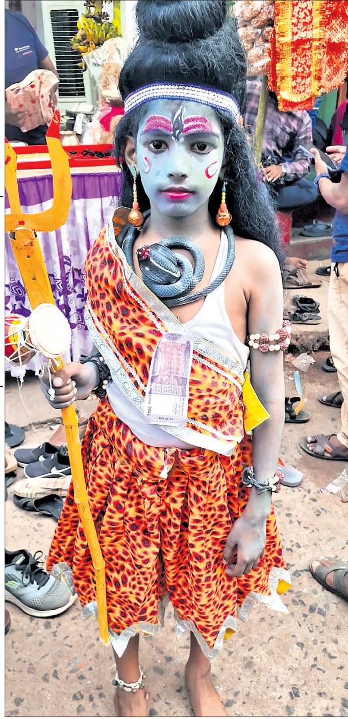
ଶିବ ବେଶରେ କଣେ ଶିଶୁ ।

ଶଙ୍ଖାରି ସାହି, ଜେମାବେଇ ପେଣ୍ଠ ଓ ପୁରୁଣା ବ୍ରହ୍ମପୁର ସାହି ପରିକ୍ରମା କରିଥିଲେ। ଶେଷରେ ପୁଣି ଖାନ୍ଦା ସାହି ହୋଇ ନଡ଼ିଆ ବଜାର, ଦେଶୀ ବେହେରା ସାହି ହୋଇ ଅଣ୍ଡାୟା ମଞ୍ଚପରେ ପହଞ୍ଚିଥିଲେ। ସୋମବାର ମା' ଠାକୁରାଣୀ ବିଭିନ୍ନ ସାହିର ରଥକୁ ନିମନ୍ତ୍ରଣ କରିଥିଲେ। ଖାନ୍ଦାସାହିର ହରି ଅର୍ଜୁନ ରଥ, ନରସିଂହ ମନ୍ଦିର ସାହିର ଶ୍ରୀରାମ ରଥ, ଚନ୍ଦ୍ରଶେଖର ମନ୍ଦିର ସାହିର ବୀର ହନୁମାନ ରଥ, ଶଙ୍ଖାରି ସାହିର ଲକ୍ଷ୍ମଣ ରଥ, ଜେମାବେଇ ପେଣ୍ଠରେ ଜଗନ୍ନାଥ ରଥ ଓ ପୁରୁଣା ବ୍ରହ୍ମପୁର ମହାବୀର କର୍ଣ୍ଣ ରଥକୁ ନିମନ୍ତ୍ରଣ କରାଯାଇଥିଲା। ଆଜି ବି ଅଣ୍ଡାୟା ମଞ୍ଚପରେ ବହୁ ମାନସିକ ବେଶଧାରୀ ମା' ଠାକୁରାଣୀଙ୍କ ଦର୍ଶନ ନିମନ୍ତେ ଆସିଥିଲେ।