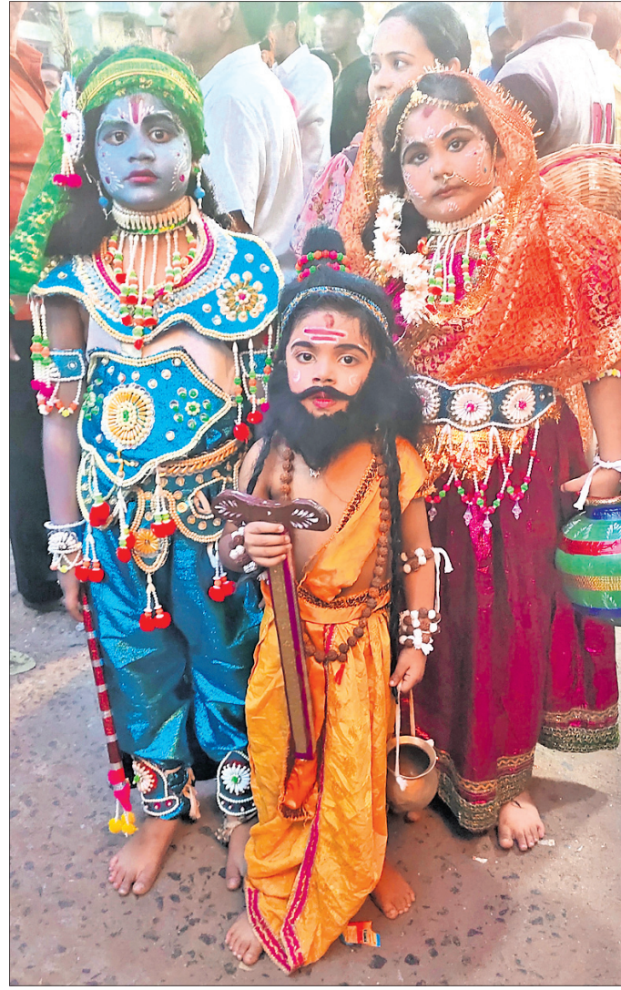
ଛୋଟ ଶିଶୁଙ୍କ କୃଷ୍ଣ, ବାବାଜୀ ଓ ରାଧା ବେଶ।