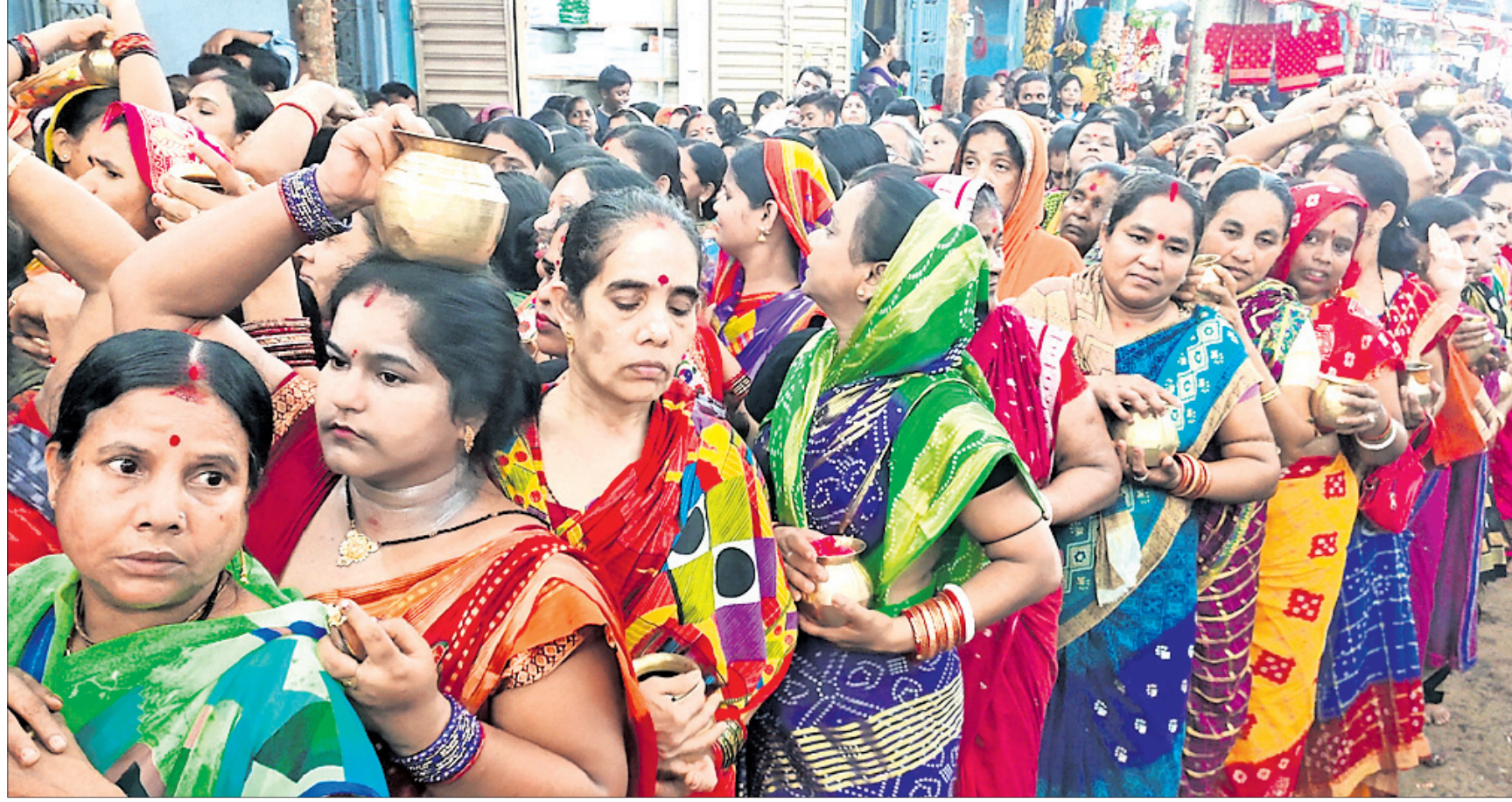
ଅଣ୍ଡାୟା ମଞ୍ଚପରେ ମହିଳାଙ୍କ ଭିଡ଼।