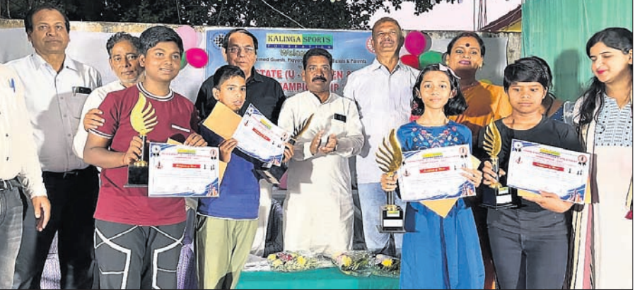
ଅତିଥିକ ଗହଣରେ କୃତୀ ପ୍ରତିଯୋଗୀ।

ଜାତୀୟ ପ୍ରତିଯୋଗିତାରେ ଭାଗ ନେବା ପାଇଁ ଯୋଗ୍ୟ ବିଭେଦିତ ହୋଇଛନ୍ତି। ପୁରୁଷର ବିଭେଦିତ ଉତ୍ତରରେ ବିଧାୟକ ତଥା ଜିଲ୍ଲା ଯୋଜନା ବୋର୍ଡ ଅଧ୍ୟକ୍ଷ ରଘୁରାମ ପଟ୍ଟନାୟକ ଆୟୋଜିତା ପ୍ରତିଯୋଗିତା ଆରମ୍ଭ କରିବେ। ଏହା ଖୁବ୍ ସିଧା ବିଷୟ ଯେ ହକି ଇଣ୍ଡିଆ ଲିଗ୍ ଏକ ନୂତନ ଯୁଗ ଆରମ୍ଭ ହେବାକୁ ଯାଉଛି। ଏହା କେବଳ ଭାରତରେ ହକି ନୁହେଁ, ବରଂ ବିଶ୍ୱବ୍ୟାପୀ କ୍ରୀଡ଼ାକୁ ପୁନର୍ଜୀବିତ କରିବ।