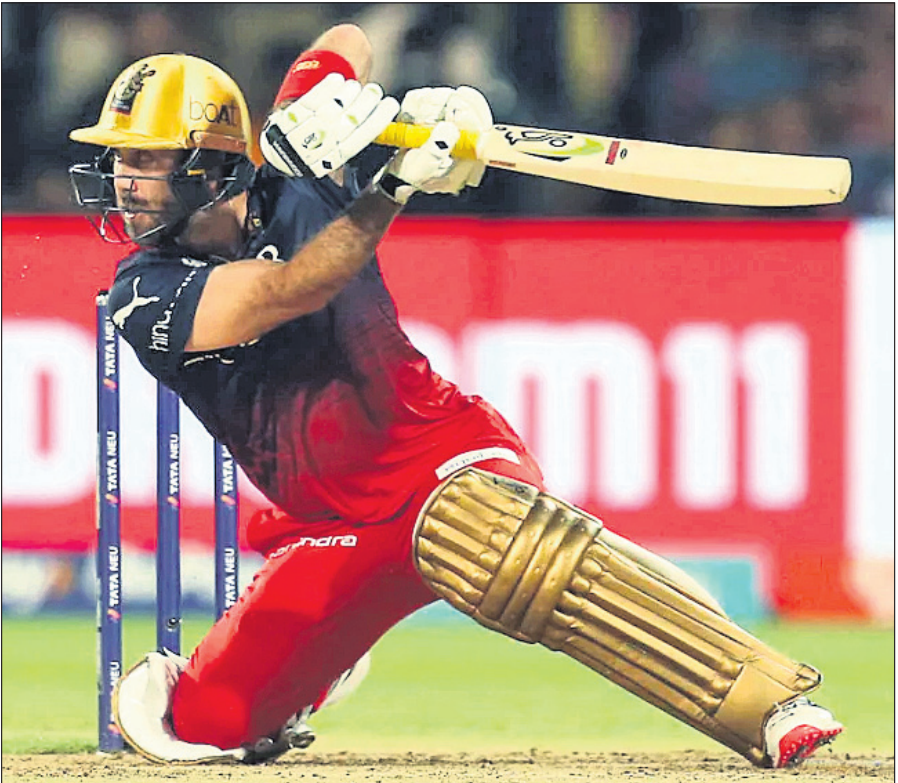
ଶର୍ ଷ୍ଟୋଇନସ ଅବସରରେ ଆରସିବିର ରୋନ ମାକ୍ଗୁଏକ୍ସଲେନ୍।

ରନର ଲିମିଟ୍ ଖେଳିଥିଲେ। ଚନ୍ଦ୍ରିତ ଫିଲ୍ଡିଂ ନିଷ୍ପତ୍ତି ନେଇଥିଲେ ଲକ୍ଷ୍ନୌ ସୁପର ଜାଏଣ୍ଟ ଅଧିନାୟକ ଲୋକେଶ ରାହୁଲ। ଗତ ମ୍ୟାଚରେ କୋଲକାତା ନାଇଟ ରାଇଡର୍ସଠାରୁ ପରାଜୟରୁ ଶିଖାଇବା କରିଥିବା ଆରସିବି ଏଠାରେ ଯେ କେବଳ ଭଲ ଆରମ୍ଭ କରିଥିଲା ତା' ନୁହେଁ ଉଇକେଟ ନ ପଡ଼ିବା ଉପରେ ମଧ୍ୟ ଧ୍ୟାନ ଦେଇଥିଲା। ଉଭୟ ବିରାଟ କୋହଲି ଓ ଅଧିନାୟକ ଫାଟ୍ ଡୁଗ୍ଲେସି ଦ୍ରୁତ ହାରରେ