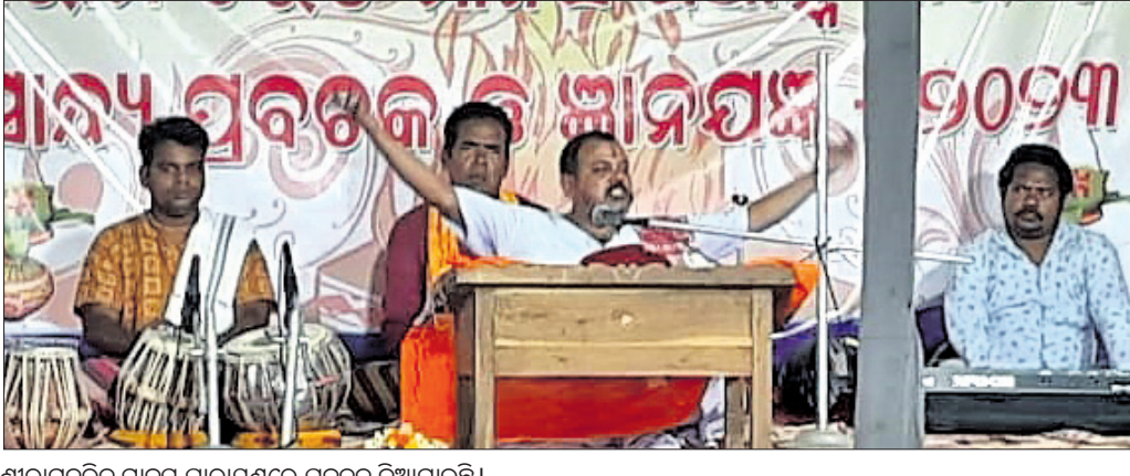
ଶ୍ରୀରାମଚରିତ ମାନସ ପାରାୟଣରେ ପ୍ରବଚନ ଦିଆଯାଇଛି।