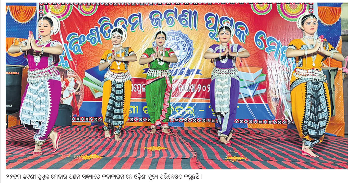
୨୨ତମ ଜଗନ୍ନାଥ ପୁସ୍ତକ ମେଳାର ପଞ୍ଚମ ସନ୍ଧ୍ୟାରେ କଳାକାରମାନେ ଓଡ଼ିଶା ନୃତ୍ୟ ପରିବେଷଣ କରୁଛନ୍ତି।

ଖୋର୍ଦ୍ଧା ଅଫିସ, ୧୦୧୪: ଖୋର୍ଦ୍ଧା ଜିଲ୍ଲା ସାହିତ୍ୟ ସମାଜ ପକ୍ଷରୁ ସ୍ଥାନୀୟ ଗାଦୀଭବ ପରିସରରେ ଆସନ୍ତା ୧୪ ତାରିଖରେ ଖୋର୍ଦ୍ଧା ବିଷୁବ ମିଳନ ଉତ୍ସବ ଅନୁଷ୍ଠିତ ହେବ।