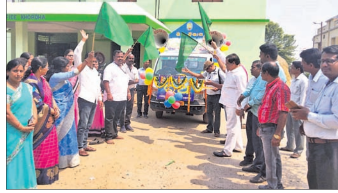
ବିଧାୟକ କ୍ୟୋତିରାମ୍ ନାଥ ମିତ୍ର ସଚେତନତା ରଥ ଉଦ୍‌ଘାଟନ କରୁଛନ୍ତି।