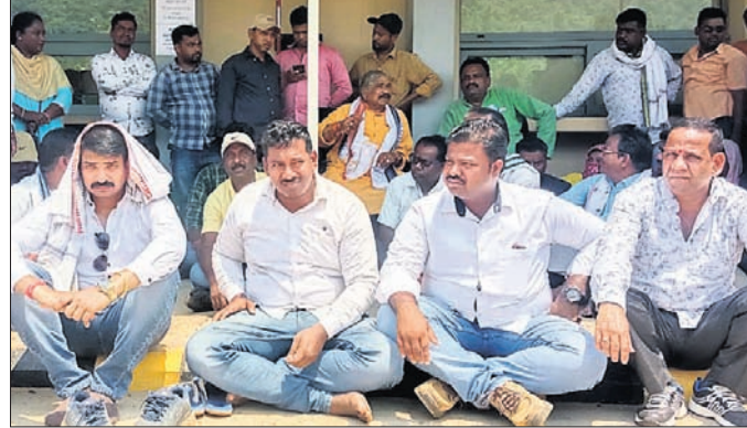
କଟଣା ନାଗରିକ କମିଟି ପକ୍ଷରୁ ଧାରଣା ଦିଆଯାଇଛି।