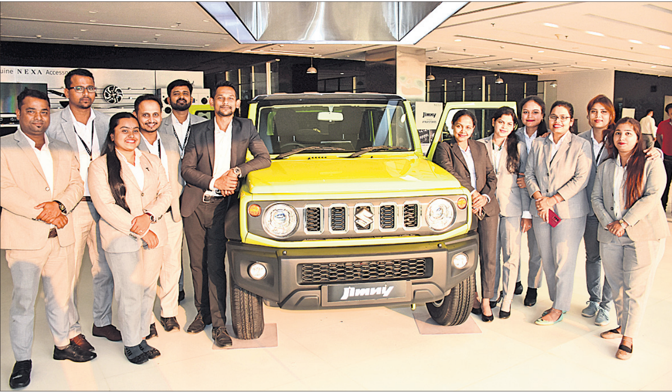
ଭୁବନେଶ୍ୱର ପରିଆସିତ ନେକ୍ସା ସାଇବରସିଟିରେ ଆୟୋଜିତ ମାରୁତି ସୁଜୁକି ଜିମ୍ନିର ୨ ଦିନିଆ ସ୍ୱତନ୍ତ୍ର ପ୍ରଦର୍ଶନ ଅବସରରେ ଶୋ'ରୁମର କର୍ମଚାରୀମାନେ ଉପସ୍ଥିତ ଅଛନ୍ତି।