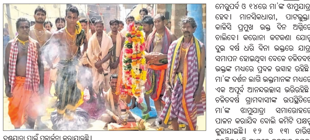
ଦଣ୍ଡଯାତ୍ରା ପାଇଁ ପୂଜାର୍ଚ୍ଚନା କରାଯାଇଛି।

ଖୋର୍ଦ୍ଧା ରୁକ୍ମ ଗାଁଆପଡ଼ା ପଞ୍ଚାୟତ ଉତ୍ତମୋତ୍ତମ ନଗରର ଆରାଧ୍ୟା ଦେବୀ ମା' ଅନେଇଙ୍କ ପ୍ରସିଦ୍ଧ ଦଣ୍ଡଯାତ୍ରା ତଥା ଝାମୁଯାତ୍ରା ସୋମବାର ଠାରୁ ପାରମ୍ପରିକ ବିଧିବିଧାନପୂର୍ବକ ଆରମ୍ଭ ହୋଇଛି।