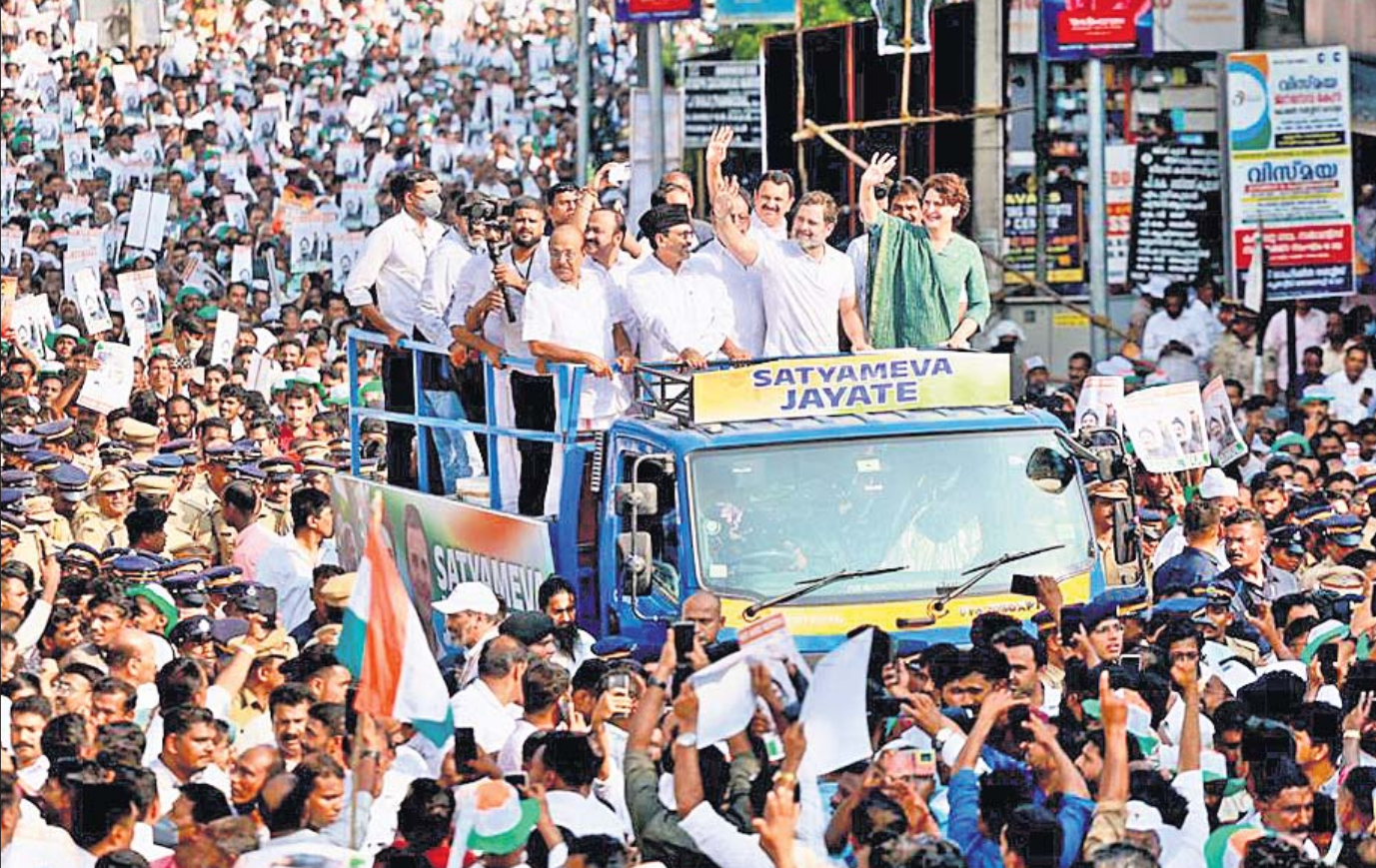
ଲୋକ ସଭା ସଦସ୍ୟତା ଭବନ ହେବା ପରେ କଂଗ୍ରେସ ନେତା ରାହୁଲ ଗାନ୍ଧୀ ମଙ୍ଗଳବାର ପ୍ରଥମ ଥର ପାଇଁ ନିଜ ସଂସଦୀୟ ଆସନ କେରଳ ଖାଣ୍ଡିଗାଡ଼ ଗସ୍ତ କରିଛନ୍ତି। ଏହି ଅବସରରେ ସେ 'ସତ୍ୟମେବ ଜୟତେ' ରୋଡ୍ ଶୋ' କରିଛନ୍ତି। (ରିପୋର୍ଟ: ପୃଷ୍ଠା-୧୪)

ମୁମ୍ବାଇ ଇଣ୍ଡିଆନ୍ସ ବିପକ୍ଷ ମ୍ୟାଚରେ ଦିଲ୍ଲୀ କ୍ୟାପିଟାଲ୍ସର ଅକ୍ଷର ପଟେଲ ଆଇପିଏଲରେ ତାଙ୍କର ପ୍ରଥମ ଅର୍ଦ୍ଧଶତକ ହାସଲ କରିଛନ୍ତି।