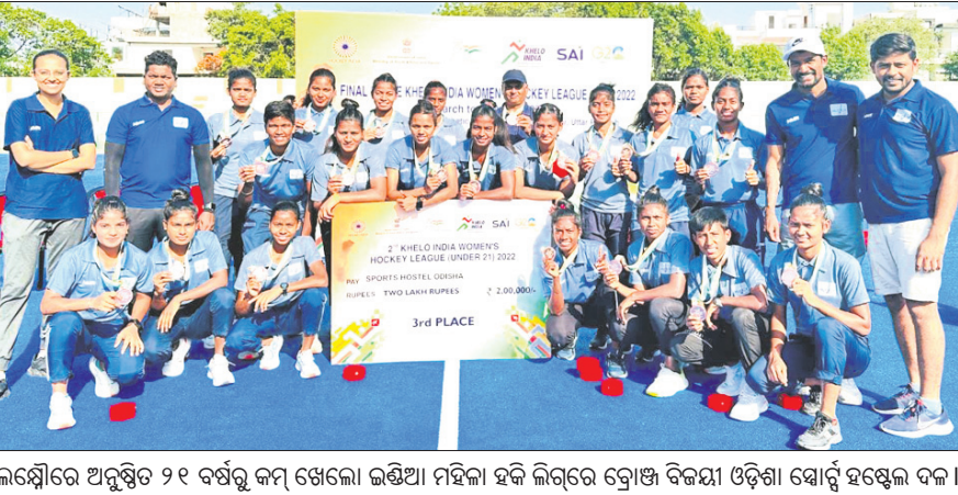
ଲକ୍ଷ୍ମୀରେ ଅନୁଷ୍ଠିତ ୧୧ ବର୍ଷରୁ କମ୍ ଖେଳା ଇଣ୍ଡିଆ ମହିଳା ହକି ଲିଗରେ ବ୍ରୋଞ୍ଜ ବିଜୟୀ ଓଡ଼ିଶା ସ୍ପୋର୍ଟ୍ସ୍ ହଷ୍ଟେଲ୍ ଦଳ।

କରିଥିବାରୁ ଚୁନାମେଣ୍ଟର ଭେଦକୁ ନେଇ ଅନିଶ୍ଚିତତା ଦେଖାଦେଇଛି। ସେଠା ତାଙ୍କର ଏକ ପ୍ରସ୍ତାବ ଦେଇଛନ୍ତି। ଭାରତର ମ୍ୟାଚରୁଡିକ ଦେଶ ବାହାରେ ଆୟୋଜନ କରାଯାଇପାରିବ। ସେମାନେ ଆୟୋଜନ ଅଧିକାର ହରାଇବାକୁ ଚାହୁଁନାହାନ୍ତି ବୋଲି କହିଛନ୍ତି। ପୁରୁଷା କାରଣରୁ ପାକିସ୍ତାନରେ ଖେଳିବା ଲାଗି ଭାରତ ସରକାର ଅନୁମତି ଦେଉନାହାନ୍ତି ବୋଲି ଭାରତୀୟ କ୍ରିକେଟ କଣ୍ଟ୍ରୋଲ ବୋର୍ଡ୍ (ସିସିଆଇ) କହିଛନ୍ତି। ହେଲେ ସେମାନଙ୍କୁ ଏହାର ଲିଖିତ ପ୍ରମାଣ ଆବଶ୍ୟକ। ଇତିମଧ୍ୟରେ ଅଷ୍ଟ୍ରେଲିଆ, ଇଂଲଣ୍ଡ, ୟୁଜିଏସ୍ ପାକିସ୍ତାନରେ ଆସି ଖେଳି ସାରିଛନ୍ତି। ସେମାନଙ୍କର କୌଣସି ଅପୂର୍ବତା ହୋଇନାହିଁ। କିନ୍ତୁ ସୁରକ୍ଷାକର୍ତ୍ତା କାରଣ ଦର୍ଶାଇ ଭାରତ ପାକିସ୍ତାନ ରୁଟ୍‌ରେ ନ ଆସିବା ସମ୍ଭାବନା ରୁହେଁ। ପିସିବି ଚେନ୍ନାଇରୁ ଆସିଥିବା ସିସିଆ କପ୍ ଆୟୋଜନ କରିବାର କାର୍ଯ୍ୟକ୍ରମ ରହିଛି। ଭାରତ ପାକିସ୍ତାନରେ ଖେଳିବାକୁ ରାଜି ନ ଥିବା ସ୍ପଷ୍ଟ