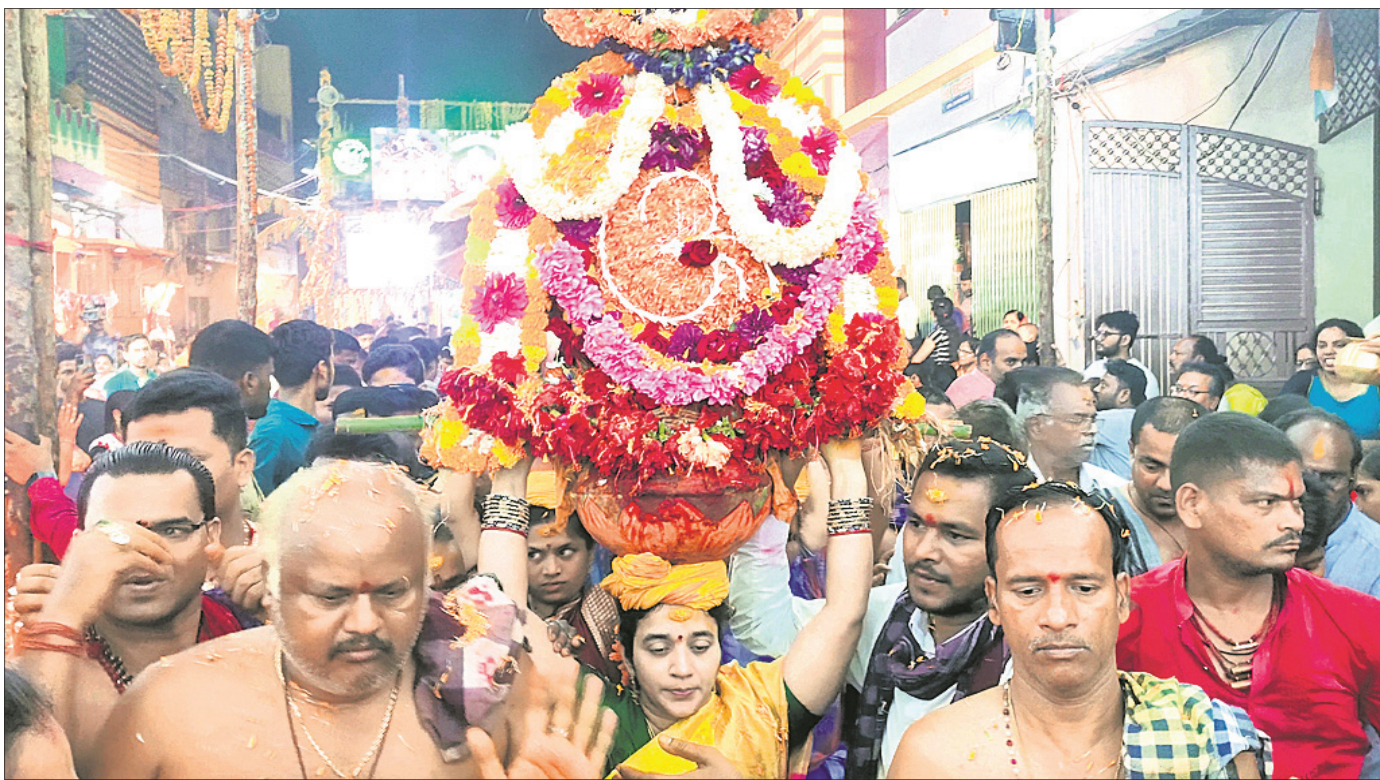
ଘଟ ପରିକ୍ରମା କରାଯାଉଛି।