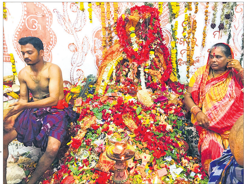
ଅଗ୍ନିପତ୍ନୀ ମଣ୍ଡପରେ ଘଟ ପୂଜାର୍ଚ୍ଚନା।