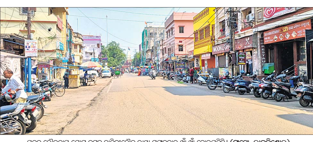
ପ୍ରବଳ ଚାନ୍ଦିପ୍ରାପ୍ତ ପୋଲିସ୍‌ କଟକ ରାଜନୀତୋକ ରାସ୍ତା ମଙ୍ଗଳବାର ଖାଁ ଖାଁ ହୋଇପଡ଼ିଛି।

ଭୁବନେଶ୍ୱର, ୧୧/୧୪(ବୁଧବାର) ଚାନ୍ଦି ପ୍ରକୋପରେ ମଣିଷଠାକୁ ଜୀବକକୁ ସମସ୍ତେ ଲୋଭନ ହେଉଛନ୍ତି। ସକାଳ ୮ଟା ପରେ ମାଡ଼ିଆପୁଲି ଚଳା ପବନ। ଅପରାହ୍ନ ୫ଟା ଯାଏ ନିୟାମ ନାହିଁ। ଦେହପୁଣ୍ଡ ଜଳପାତି ଯାଉଛି। ପାରବ ୪୧ ଡିଗ୍ରୀ ରାଜ୍ୟର ୯ ସହରରେ ସର୍ବୋଚ୍ଚ ତାପମାତ୍ରା ୪୦ ଡିଗ୍ରୀ ଉପରେ ରହିଛି। ଆଞ୍ଚଳିକ ଆଞ୍ଚଳିକ କାର୍ଯ୍ୟାଳୟ ସୂଚନା ଅନୁଯାୟୀ ବିହାର କୋଟି ଆନା ଅଞ୍ଚଳର ଖରିପ୍ ଖାନ୍। କର୍ମଚାରୀଙ୍କୁ ହତ୍ୟା କରିବାକୁ ଯୋଜନା କରିଥିଲେ। ବିହାରରୁ ଆସିଥିଲେ। ଗିରଫ କରିବା ପରେ ଗୁଲିକରି