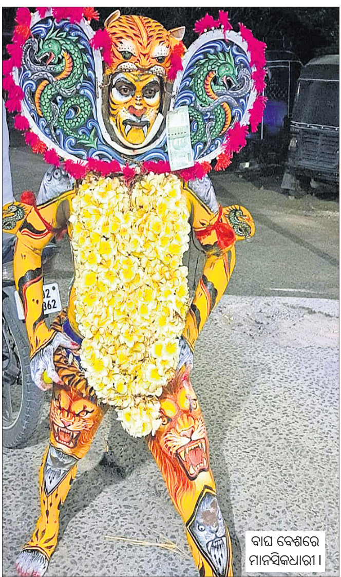
ବାଘ ବେଶରେ ମାନସିକଧାରୀ।