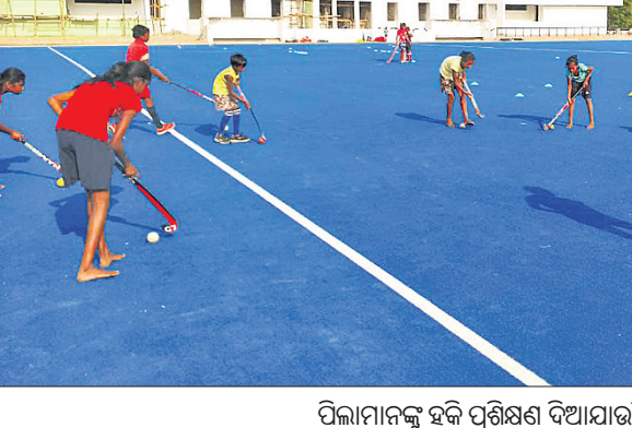
ପିଲାମାନଙ୍କୁ ହକି ପ୍ରଶିକ୍ଷଣ ଦିଆଯାଉଛି।

ଭୁବନେଶ୍ୱର, ୧୧:୪ (ସ୍ପୋର୍ଟ୍ସ୍ ବ୍ୟୁରୋ) ହକି ପ୍ରତି ରହିଥିବା ଭଲପାଇବା ପାଇଁ ଓଡ଼ିଶାରେ ଆଉ ୨୨ଟି ହକି ପ୍ରଶିକ୍ଷଣ ସେଣ୍ଟର(ଏର୍ଡିସି) ଶ୍ଲାପନ କରାଯାଇଛି। ବୃତ୍ତମୂଳ ସ୍ତରରୁ ହକିର ବିକାଶ ପାଇଁ ରାଜ୍ୟ ସରକାରଙ୍କ କ୍ରୀଡ଼ା ଓ ଯୁବ ବ୍ୟାପାର ବିଭାଗ ପକ୍ଷରୁ ଏହି ପଦକ୍ଷେପ ନିଆଯାଇଛି। ଓଡ଼ିଶା ନାଭାଲ ଟାଟା ହକି ହାଇପରଫର୍ମାଟ୍ ସେଣ୍ଟର ଓ କ୍ରୀଡ଼ା ଓ ଯୁବ ବ୍ୟାପାର ମିଳିତ ଉଦ୍ୟମରେ ଏହି ସେଣ୍ଟରଗୁଡିକ ଶ୍ଲାପନ ହୋଇଛି। ବୃତ୍ତମୂଳ ସ୍ତରରୁ ପ୍ରତିଭା ଚିହ୍ନଟ୍ ସହିତ ସେମାନଙ୍କୁ ସୁଯୋଗ ପ୍ରଦାନ କରିବା ପାଇଁ ଏହି ବ୍ୟବସ୍ଥା ଆରମ୍ଭ କରାଯାଇଛି। ସୁନ୍ଦରଗଡ଼ରେ ରହିଥିବା କାର୍ଯ୍ୟକ୍ରମ ଚର୍ଚ୍ଚତ୍ରିକ ମଧ୍ୟରେ ବୋଣାଲ୍, ଟାଙ୍ଗରପଲ୍, ବାରଗାଓଁ, ଦିର୍ବା, ଲକ୍ଷ୍ମଣାପଡ଼ା, ଲାଠିକଟା, ଲେପ୍ରିପଡ଼ା, ସର୍ବତୋରା, ବାଲିଶଙ୍କରା-ତିଲେଇକାନି,