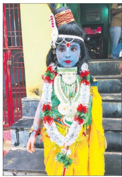
ଶିଶୁଙ୍କ କୃଷ୍ଣ ଓ ହରମାନ ବେଶ।

କରାଯାଇଥିଲା। ଅପରାହ୍ନରେ ପ୍ରବଳ ଖରା ଓ ଗରମ ସତ୍ତ୍ୱେ ଅଗ୍ନିପତ୍ନୀ ମଣ୍ଡପରେ ମା'ଙ୍କ ଦର୍ଶନ ନିମନ୍ତେ ଶ୍ରଦ୍ଧାଳୁଙ୍କ ଭିଡ଼ ଜମିଥିଲା। ମଙ୍ଗଳବାର ମା' ଠାକୁରାଣୀଙ୍କ ମୁଖ୍ୟ ଘଟ ବିଲି ସାହି ପରିକ୍ରମା କରିଥିଲା। ମା'ଙ୍କ ଘଟ ପ୍ରଥମେ ଦେଶୀ ବେହେରା ସାହି ଅଗ୍ନିପତ୍ନୀ ମଣ୍ଡପରୁ ବାହାରି ପରମ୍ପରା ଅନୁଯାୟୀ ମହୁରା ରାଜବାଟୀରେ ପହଞ୍ଚିଥିଲା। ରାଜବାଟୀରେ ରାଜାଙ୍କ ଦ୍ୱାରା ମା'ଙ୍କୁ ପୂଜାର୍ଚ୍ଚନା କରାଯାଇଥିଲା। ରାଜବାଟୀରୁ ଘଟ ବଡ଼ ବଜାର, ପାତ୍ର ପେଟା ସାହି, ଜେନି ସାହି, ମଙ୍ଗଳବାରମ୍ ପେଟା ସାହି, ଲକ୍ଷ୍ମୀଦେବୀ ସାହିକୁ ମା'ଙ୍କ ମୁଖ୍ୟ ଘଟ ପାର୍ଶ୍ୱ ଘଟ ମଧ୍ୟ ପରିକ୍ରମା କରିଥିଲେ। ଶେଷରେ ପୁଣି ବଡ଼ ବଜାର ହୋଇ ନତ୍ୟା ଗୁରୁ ଦେବ ଦେଶୀ ବେହେରା ସାହି ସ୍ଥିତ ଅଗ୍ନିପତ୍ନୀ ମଣ୍ଡପ ନିକଟରେ ଘଟ ପହଞ୍ଚିଥିଲା। ଅଗ୍ନିପତ୍ନୀ ମଣ୍ଡପରେ ମା'ଙ୍କ ଆଜ୍ଞାପରେ ରାଜଭୋଗ କରାଯାଇଥିଲା। ବହୁ ମାନସିକଧାରୀ ଠାକୁରାଣୀଙ୍କୁ ଦର୍ଶନ କରିଥିଲେ।