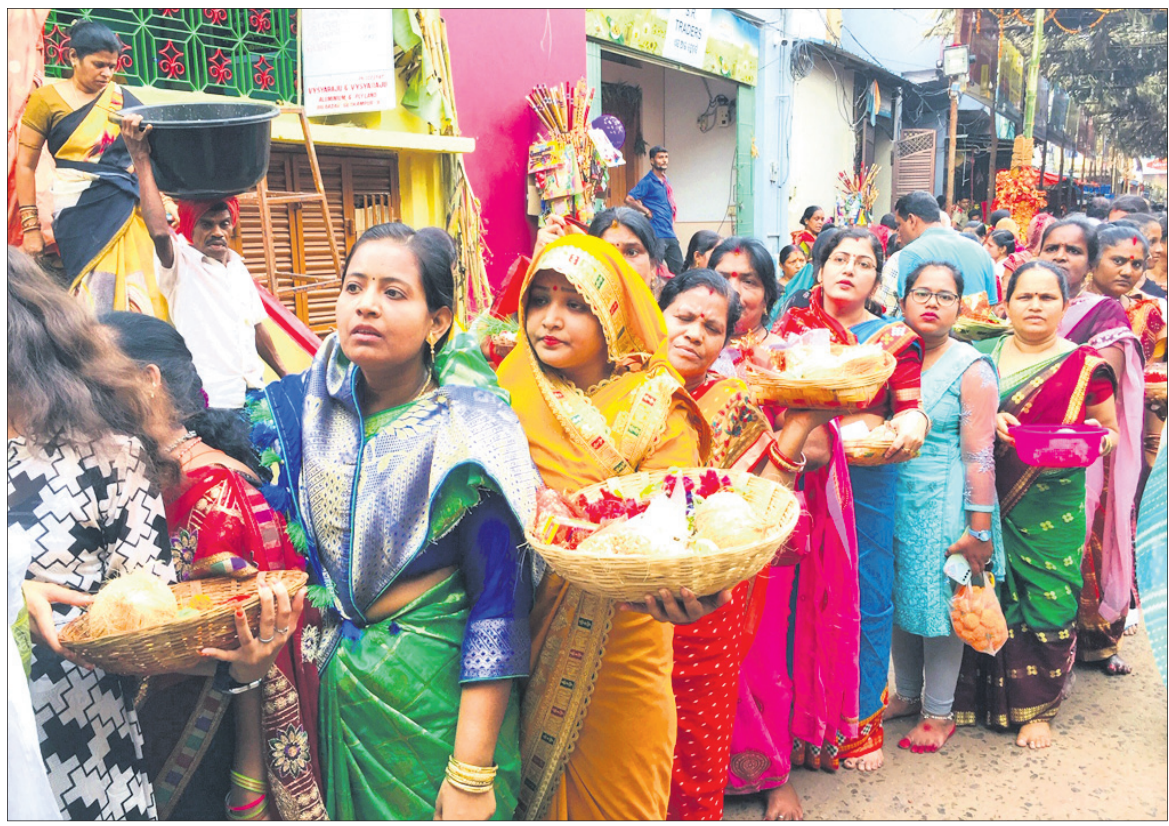
ଅଗ୍ନିପତ୍ନୀ ମଣ୍ଡପ ବାହାରେ ଶ୍ରଦ୍ଧାଳୁଙ୍କ ଭିଡ଼।