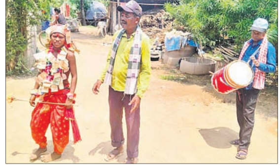
ଦୋହରାପାଟଣାରେ ପାରୁଆ କାଳନ୍ଦୀ ନାଚୁଛନ୍ତି।