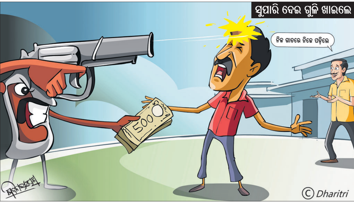
ସୁପାରି ଦେଇ ଗୁଳି ଖାଇଲେ