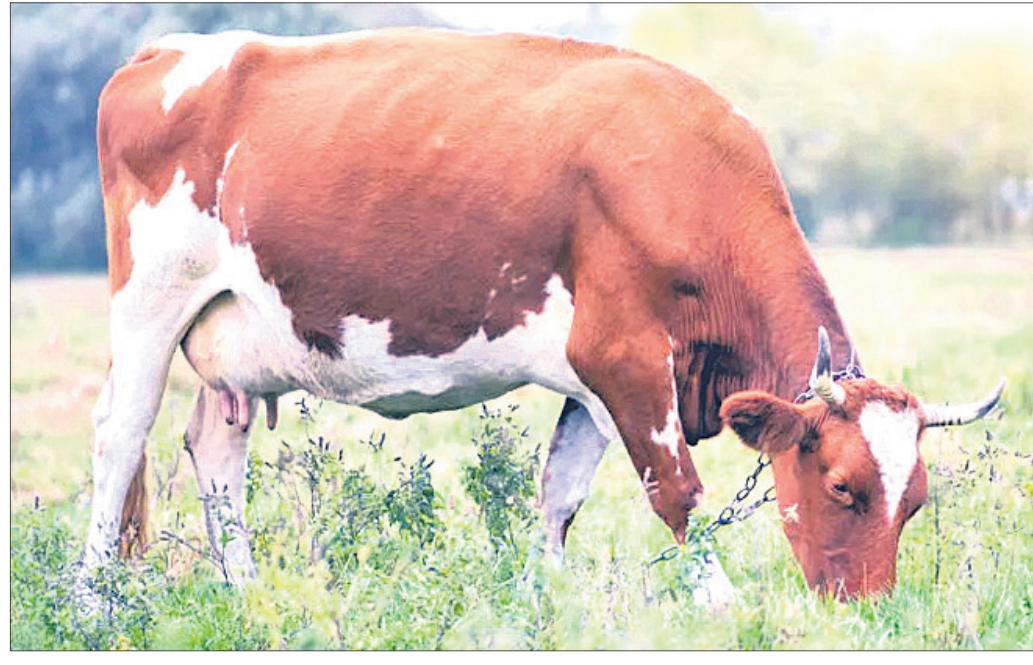
ଡା. ହିମାଂଶୁ ବେହେରା

ଗାଈ ପାଳନର ପ୍ରତ୍ୟେକ ବର୍ଷ ଏକ ବାହୁରୀ ପାଇବା ସମସ୍ତ ଚାଖିଆର ଏକ ଲକ୍ଷ୍ୟ । ଗାଈ ଗରମ ଲକ୍ଷଣ ବେଶାଈକାଠାରୁ ଆରମ୍ଭକରି ପ୍ରସବ ପର୍ଯ୍ୟନ୍ତ ସମସ୍ତ ପଦକ୍ଷେପ ବା ପ୍ରଣାଳୀ ରୁହନ୍ତୁପୁଣି । ସ୍ୱାଭାବିକ ଭାବରେ ପ୍ରସବ ହେଲେ ବାହୁରୀ ସଦାସର୍ବଦା ସବଳ ହୋଇଥାଏ ଏବଂ ବୁଢ଼ ଉତ୍ପାଦନରେ ମଧ୍ୟ ଠିକ୍ ବୁଝି ହୋଇଥାଏ ।