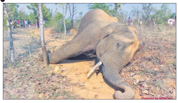
ବାରଜୁଲୁରି ସଂରକ୍ଷିତ ଜଙ୍ଗଲରେ ମୃତ ଦନ୍ତା ହାତୀ ।

ସ୍ଥାପନ ହେଉଛି। ମାତ୍ର ସେମାନେ ହାତୀର ଗତିବିଧି ଜାଣି ନ ପାରିବା ସମସ୍ତଙ୍କୁ ଆଶ୍ଚର୍ଯ୍ୟ କରିଛି। ବନ ବିଭାଗ ହାତୀ ଚଳପ୍ରଚଳ ସମ୍ପର୍କରେ ବିଦ୍ୟୁତ୍ ବିଭାଗକୁ ଅବଗତ କରି ନ ଥିଲା। ସମସ୍ତ ଅଞ୍ଚଳ ସୋନପୁର ରାଜିରେ ବିଦ୍ୟୁତ୍ କାର୍ ହୋଇ ନ ଥିଲା। ଫଳରେ ହାତୀର ମୃତ୍ୟୁ ହେଲା ବୋଲି ଅଭିଯୋଗ ହେଉଛି।