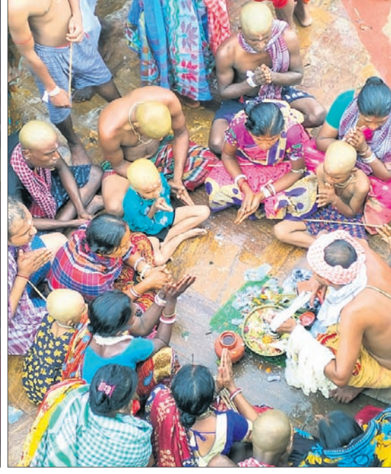
ମାନସିକଧାରୀମାନେ କାଳକ ପୀଠରେ ପୁଣନ କରାଉଛନ୍ତି।