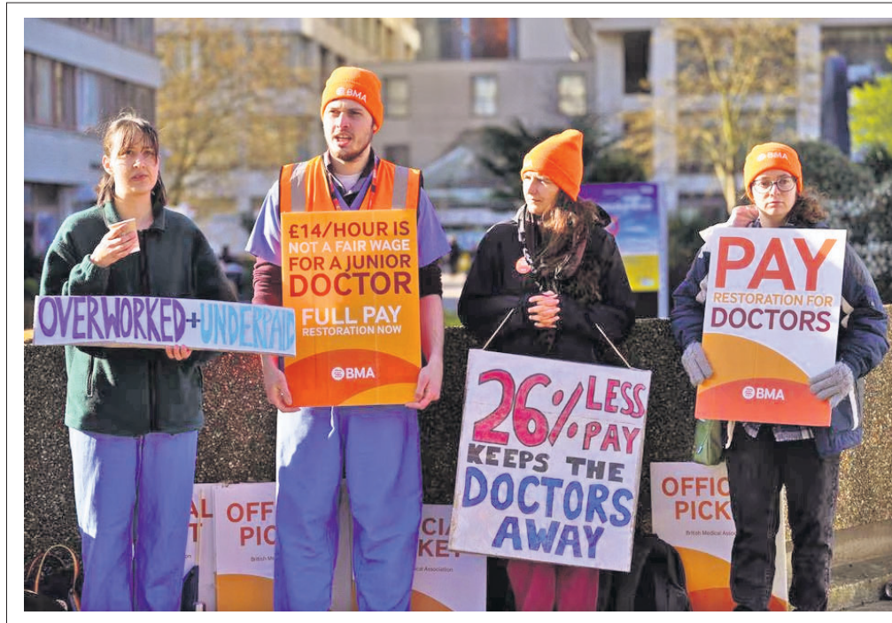
ବ୍ରିଟେନ୍ ସରକାରଙ୍କ ସହ ଆଲୋଚନା ବିଫଳ ହେବା ପରେ ଲଣ୍ଡନର ସେଣ୍ଟ ଥୋମାସ୍ ହସ୍ପିଟାଲ ବାହାରେ ଆନ୍ଦୋଳନରେ ଭାଗ ନେଇଛନ୍ତି।

ଭାରତ ଓ ନେପାଳ ମଧ୍ୟରେ ଇ-ପେମେଣ୍ଟସ୍ ବ୍ୟବହାର କରି ସାମାନ୍ୟ ଡିଜିଟାଲ ପେମେଣ୍ଟ ପାଇଁ ରୁଜ୍‌ନାମା ସ୍ୱାକ୍ଷର ହେବାକୁ ଯାଉଛି। ମୁଦ୍ରାକଳିତ ପ୍ରତିବନ୍ଧକ ଦୂର ହେବା ଫଳରେ ଦୁଇ ଦେଶ ମଧ୍ୟରେ ବାଣିଜ୍ୟ ଓ ପର୍ଯ୍ୟଟନ ବୃଦ୍ଧି ପାଇବ। ନେପାଳ ପ୍ରଧାନମନ୍ତ୍ରୀ ବଳିତ ମାସରେ ଭାରତ ଗସ୍ତରେ ଆସିବାକୁ ଥିବାବେଳେ ସେହି ସମୟରେ ଉପରୋକ୍ତ ରୁଜ୍‌ନାମା ସ୍ୱାକ୍ଷର ହେବା ଆଶା କରାଯାଇଛି। ଫଳରେ ଭାରତୀୟ ପର୍ଯ୍ୟଟକମାନେ ନେପାଳରେ ଭାରତପେ, ଫୋନ୍‌ପେ, ସି.ଟି. ରବିକୃଷ୍ଣା ରହିଛନ୍ତି। ଆର୍ଡିଏ ଗ୍ରହଣ କରିବାକୁ ଯୁକ୍ତମାନେ ବାଧ୍ୟ ରୁହନ୍ତି ପରେ ମାମଲାରେ ପରବର୍ତ୍ତୀ ଶୁଣାଣି ଅଗଷ୍ଟରେ କରିବାକୁ ଧାର୍ଯ୍ୟ ହୋଇଛି।