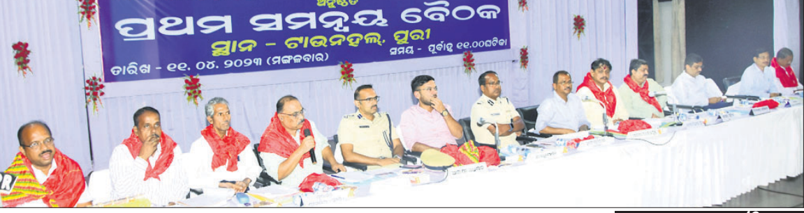
ଚାଉଳ ହଲରେ ଅନୁଷ୍ଠିତ ପ୍ରଥମ ସମନ୍ୱୟ ବୈଠକରେ ଉପସ୍ଥିତ ଆରଟିସି, ଅଧିକାରୀ ଓ ଅନ୍ୟମାନେ

ପ୍ରଥମ ସମନ୍ୱୟ ବୈଠକ ପ୍ରଥମ ସମନ୍ୱୟ ବୈଠକରେ ଉପସ୍ଥିତ ଆରଟିସି, ଅଧିକାରୀ ଓ ଅନ୍ୟମାନେ