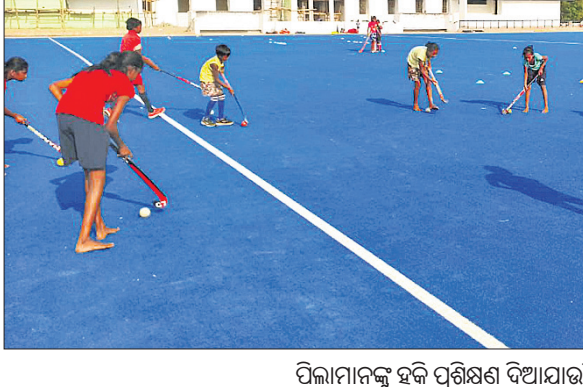
ପିଲାମାନଙ୍କୁ ହକି ପ୍ରଶିକ୍ଷଣ ଦିଆଯାଉଛି।

ପ୍ରଶିକ୍ଷଣ ଓ ସୁଯୋଗ ମିଳିଲେ ଯୁବ ପିଠି କ୍ରୀଡ଼ାରେ ଆଗକୁ ଅଗ୍ରସର ହୋଇ ପାରିବେ ବୋଲି କହିଥିଲେ। ଏହାପରେ କ୍ରୀଡ଼ା ଓ ଯୁବ ବ୍ୟାପାର ବିଭାଗ ପକ୍ଷରୁ ଓଡ଼ିଶା ନାଭାଲ ଟାଟା ହକି ହାଇପରଫର୍ମାଟ୍ ସେଣ୍ଟର ସହାୟତାରେ ଏର୍ଡିସି ଆରମ୍ଭ କରାଯାଇଛି। ଏହି ପ୍ରୋଜେକ୍ଟରେ ନିଯୁକ୍ତ କୋର୍ସାଂସନ ହକି ଓଡ଼ିଶା ନିର୍ଦ୍ଦେଶକ ଡେଭିଡ୍ ଜନକ ସହିତ ପ୍ରଶିକ୍ଷଣ ଆରମ୍ଭ କରିଛନ୍ତି। ଏହି ପ୍ରକଳ୍ପ ଆରମ୍ଭ ହେବା ପରେ ପ୍ରତି ସପ୍ତାହରେ କୁର୍ ପ୍ରମାଣ ଚୁନାମେଣ୍ଟ ଆୟୋଜନ କରାଯିବ। ଆମେରିକା, ଅଷ୍ଟ୍ରେଲିଆ ଓ ନ୍ୟୁଜିଲ୍ୟାଣ୍ଡ ଦଳରେ ଚୁନାମେଣ୍ଟ ଖେଳାଯାଏ। ବିଦେଶରେ ସଫଳ ଏହି ମଡେଲର ଫାଇଦା ତୁଣ୍ଡୁଳ ସ୍ତରରୁ କ୍ରୀଡ଼ାବିତ୍ତକୁ ମଧ୍ୟ ମିଳିବ ବୋଲି ଓଡ଼ିଶା ନାଭାଲ ଟାଟା ହକି ହାଇପରଫର୍ମାଟ୍ ସେଣ୍ଟର ପ୍ରକଳ୍ପ ନିର୍ଦ୍ଦେଶକ ରାଜୀବ ସେଠା କହିଛନ୍ତି। ଏହା ସହିତ ତୁଣ୍ଡୁଳ ସ୍ତରରୁ କୋର୍ସାଂସନ ପାଇଁ ମଧ୍ୟ ଏକ ସୁଯୋଗ ସୃଷ୍ଟି କରିବ ବୋଲି ସେ କହିଛନ୍ତି। ଏହି ଲକ୍ଷ୍ୟରେ ସମସ୍ତ ସ୍କୁଲ, କମ୍ୟୁନିଟି ଓ ଜିଲ୍ଲାଗୁଡ଼ିକୁ ସାମିଲ ହେବାକୁ ଆହ୍ୱାନ ଦିଆଯାଇଛି। ସ୍ଥାନୀୟ ପ୍ରତିଭାମାନଙ୍କୁ ଆଗକୁ ବଢ଼ିବାର ସୁଯୋଗ ଦେବାପାଇଁ ଏହି ବ୍ୟବସ୍ଥା ଆରମ୍ଭ କରାଯାଇଥିବା ସେ କହିଛନ୍ତି।