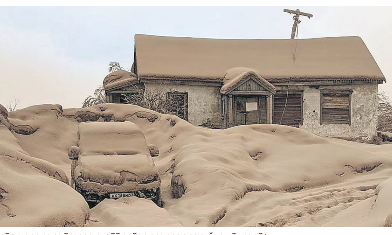
ରୁଷିଆର କାମ୍ପୋଟାରେ ଶିତଲତା ଆଗ୍ନେୟଗିରି ଉଦ୍‌ଗିରଣ ପରେ ସମଗ୍ର ଅଞ୍ଚଳ ପାଉଁଶ ଆଚ୍ଛାଦିତ ହୋଇଛି।