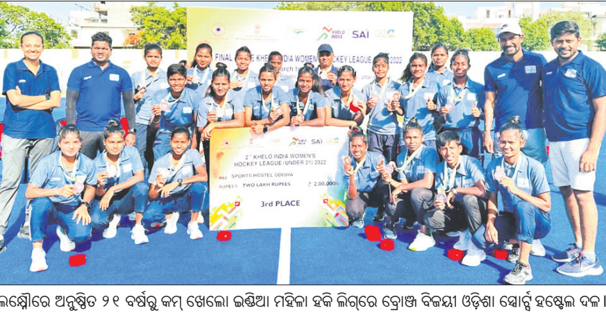
ଲକ୍ଷ୍ମୀରେ ଅନୁଷ୍ଠିତ ୨୧ ବର୍ଷରୁ କମ୍ ଖେଳା ଇଣ୍ଡିଆ ମହିଳା ହକି ଲିଗରେ ତ୍ରୋଖ ବିଜୟୀ ଓଡ଼ିଶା ସ୍କୋର୍ ହଷ୍ଟଲ ଦଳ।

ଏସିଆ କପ୍ କରିଥିବାରୁ ଚୁନାମେଣ୍ଟ ଭେଦକୁ ନେଇ ଅନିଚ୍ଛୁତତା ଦେଖାଦେଇଛି। ସେଠୀ ତାଙ୍କର ଏକ ପ୍ରସ୍ତାବ ଦେଇଛନ୍ତି। ଭାରତର ମ୍ୟାଚ୍ ଟୁକିଟ୍ ଦେଶ ବାହାରେ ଆୟୋଜନ କରାଯାଇପାରିବ। ସେମାନେ ଆୟୋଜନ ଅଧିକାର ହରାଇବାକୁ ଚାହୁଁନାହାନ୍ତି ବୋଲି କହିଛନ୍ତି। ସୁତରାଓ, ପାକିସ୍ତାନରେ ଖେଳିବା ଲାଗି ଭାରତ ସରକାର ଅନୁମତି ଦେଉନାହାନ୍ତି ବୋଲି ଭାରତୀୟ କ୍ରିକେଟ କଣ୍ଟ୍ରୋଲ ବୋର୍ଡ (ବିସିଆଇ) କହିଛି। ହେଲେ ସେମାନଙ୍କୁ ଏହାର ଲିଖିତ ପ୍ରମାଣ ଆବଶ୍ୟକ। ଲିଖିତପରେ ଅଷ୍ଟ୍ରେଲିଆ, ଇଂଲଣ୍ଡ, ନ୍ୟୁଜିଲାଣ୍ଡ ପାକିସ୍ତାନରେ ଆସି ଖେଳି ସାରିଛନ୍ତି। ସେମାନଙ୍କର କୌଣସି ଅପ୍ରବିଧି ହୋଇନାହିଁ। କିନ୍ତୁ ସୁରକ୍ଷାକର୍ତ୍ତା କାରଣ ଦର୍ଶାଇ ଭାରତ ପାକିସ୍ତାନ ରୁଟ୍ରେ ନ ଆସିବା ସମ୍ଭାବନା ରୁହେଁ। ପିସିବି ଚେୟାରମ୍ୟାନ କହିଛନ୍ତି, ଏସିଆନ କ୍ରିକେଟ କାଉନ୍ସିଲ୍ (ଏସିସି)ର ୮୦ ପ୍ରତିଶତ ରାଜସ୍ୱ ପାକିସ୍ତାନ ଓ ଭାରତ ମ୍ୟାଚ୍ରେ ଆସିଥାଏ।