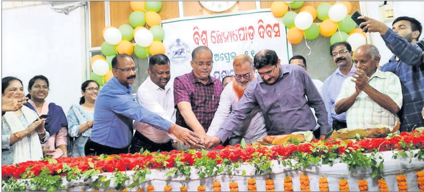
ଜିଆଇ ଷୋର୍ ମାନ୍ୟତା ପାଇବ ଛେନାପୋଡ଼ କାର୍ଯ୍ୟକ୍ରମ