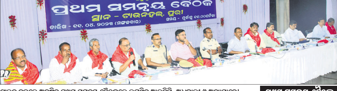
ଚାନ୍ଦନ ହଲରେ ଅନୁଷ୍ଠିତ ପ୍ରଥମ ସମନ୍ୱୟ ବୈଠକରେ ଉପସ୍ଥିତ ଆରଟିସି, ଅଧିକାରୀ ଓ ଅନ୍ୟମାନେ

ପ୍ରଥମ ସମନ୍ୱୟ ବୈଠକ ଆରଟିସି, ୧୧୧୪ ଜୁନ ୨୦ରେ ମହାପ୍ରଭୁଙ୍କ ରଥଯାତ୍ରା । ଏଥିପାଇଁ ପ୍ରସ୍ତୁତି ଆରମ୍ଭ ହୋଇଯାଇଥିବା ବେଳେ ରଥଯାତ୍ରା ମଧ୍ୟ ପର୍ଯ୍ୟାୟକ୍ରମେ ପୁରାପୁରା ପହଞ୍ଚିବାରେ ଲାଗିଛି ।