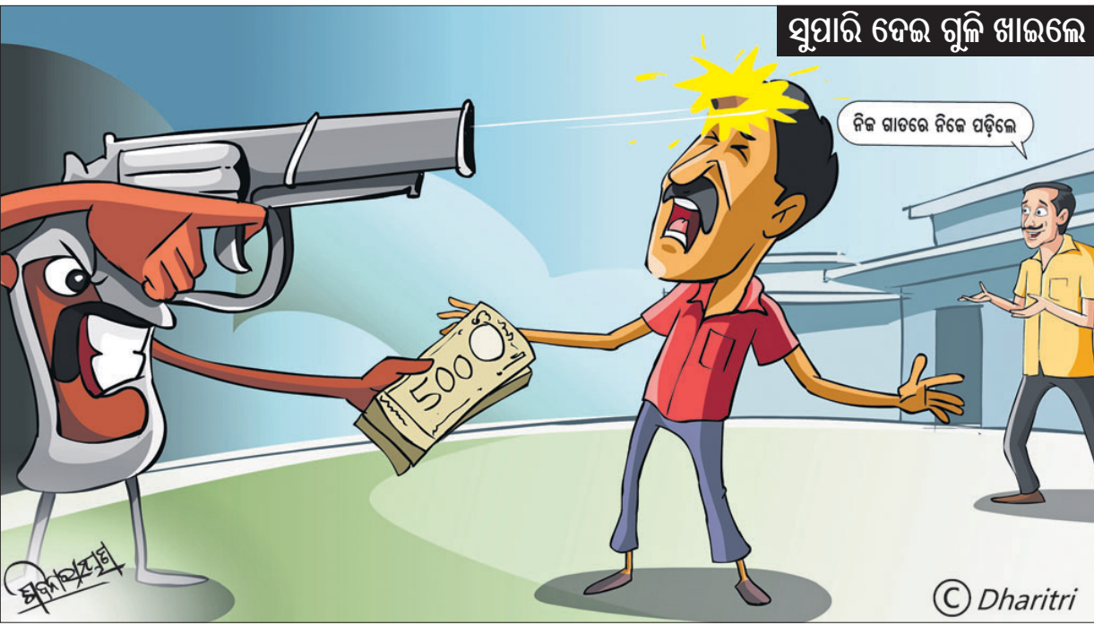
ସୁସ୍ୱାଦି ଦେଇ ଗୁଳି ଖାଇଲେ