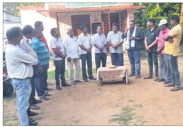
ଖଣ୍ଡପଡା ଆଞ୍ଚଳିକ ସାମାଜିକ ସଂଘ।