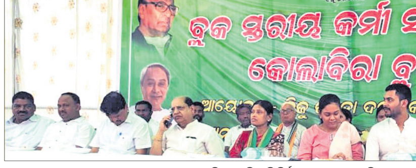
କୋଲାରୀରେ ବିଜେଡି ନିର୍ବାଚନ ସଭାରେ ଉପସ୍ଥିତ ଦଳୀୟ ନେତୃତ୍ୱ ।

କୋଲାରୀ, ୧୧୮୪ (ସ୍ପେଶାଲ) କୋଲାରୀରେ ବିଜେଡି ନିର୍ବାଚନ ପ୍ରଚାର ସଭାରେ ଏକତାର ବାର୍ତ୍ତା ପ୍ରଦାନ କରାଯାଇଛି । ଏହାକୁ ଧରି ରଖିବା ପାଇଁ ବିଜେଡି ନିର୍ବାଚନ ଜିତିବା ପାଇଁ ଲକ୍ଷ୍ୟ ରଖିଛି । ଏହାକୁ ଧରି ରଖିବା ପାଇଁ ବିଜେଡି ନିର୍ବାଚନ ଜିତିବା ପାଇଁ ଲକ୍ଷ୍ୟ ରଖିଛି ।