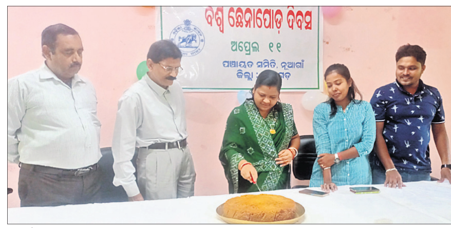
ଦୁଆର୍ଗା ପଞ୍ଚାୟତ ସମିତି କାର୍ଯ୍ୟାଳୟ।