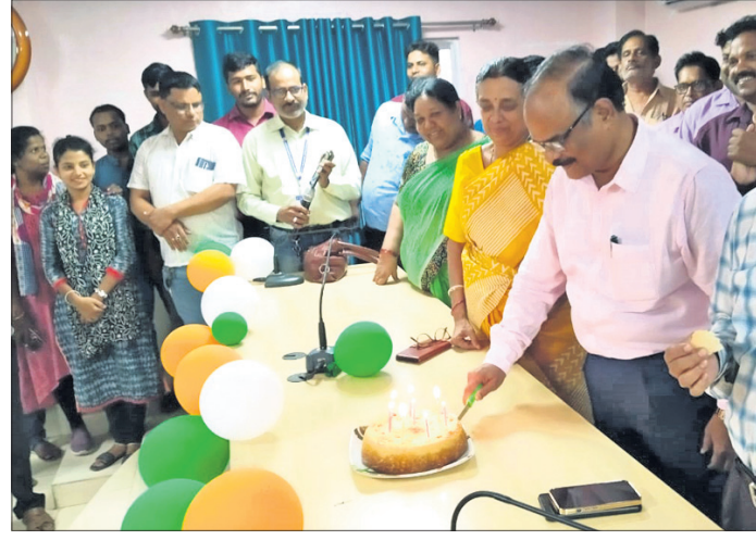
ଜିଲ୍ଲା ମୁଖ୍ୟ ଚିକିତ୍ସାଳୟ ଅଧିକାରୀଙ୍କ କାର୍ଯ୍ୟାଳୟ।