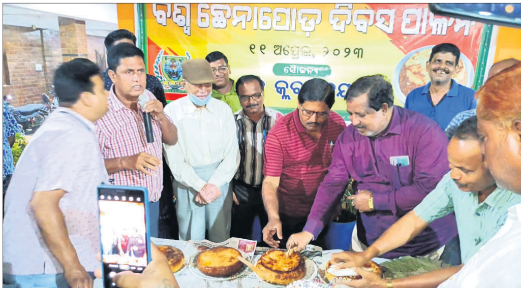
କେସି କୁଳ ପକ୍ଷରୁ ଛେନାପୋଡ଼ ଦିବସ ପାଳନ ଦିବସରେ ଯୋଗ ଦେଇଥିବା ଅତିଥି

କେସି କୁଳ ପକ୍ଷରୁ ଛେନାପୋଡ଼ ଦିବସ ପାଳନ ଦିବସରେ ଯୋଗ ଦେଇଥିବା ଅତିଥି । ସାମାଜିକ ଉନ୍ନତି ପାଇଁ ଛେନାପୋଡ଼ କାଟିଥିଲେ । ସରକାରୀ, ବେସରକାରୀ କାର୍ଯ୍ୟାଳୟରେ ବିଶ୍ୱ ଛେନାପୋଡ଼ ଦିବସ ପାଳିତ ହୋଇଛି । ନୟାଗଡ଼ରୁ ରାଜଧାନୀ ଭୁବନେଶ୍ୱରରେ ବିଶ୍ୱ ଛେନାପୋଡ଼ ଦିବସ ପାଳନ କରାଯାଇଛି । ଯୁବ ଗୋଷ୍ଠୀ ଛେନାପୋଡ଼ କାଟି ଶୁଭେଚ୍ଛା ଜଣାଇଥିଲେ । ତେବେ ଚାରା ରୋପଣ କରିଥିଲେ । ମଙ୍ଗଳବାର ଭୋଗ ସମୟରେ ନୟାଗଡ଼ ଖେଳପଡ଼ିଆରେ ଖୋଳା ଜିମ ନିକଟରେ ପ୍ରାୟ ୭୦ ଗୋଷ୍ଠୀରେ ଆସିଥିବା ବ୍ୟକ୍ତିମାନେ