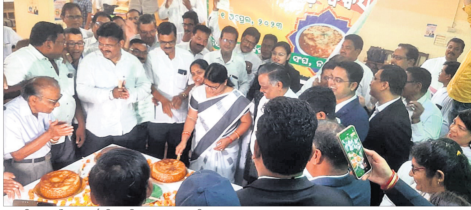
ନୟାଗଡ଼ ଜିଲ୍ଲା ଜଳ ଓ ବୌଦ୍ଧିକଜଳ କୋର୍ଟ ପରିସରରେ ଜିଲ୍ଲା ଜଳ ଛେନାପୋଡ଼ କାରୁଛନ୍ତି।