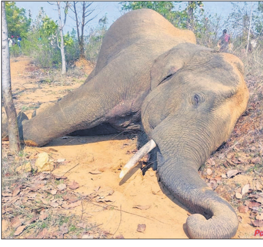
ବାରଗୁଲୁରି ସଂକ୍ଷରଣ ଜଙ୍ଗଲରେ ମୃତ ଦକ୍ଷା ହାତୀ ।

ସୋନପୁର ବନଖଣ୍ଡ ବିନିକା ରେଞ୍ଜ ବାରଗୁଲୁରି ସଂକ୍ଷରଣ ଜଙ୍ଗଲରେ ମଙ୍ଗଳବାର ସକାଳେ ଏକ ଦକ୍ଷାହୀନ ମୃତଦେହ ଜବତ ହୋଇଛି । ବିଦ୍ୟୁତ୍ ତାର ସଂକ୍ଷରଣ ଆସି ହାତୀର ମୃତ୍ୟୁ ହୋଇଥିବା ଅନୁମାନ କରାଯାଇଛି ।