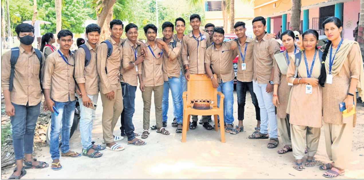
ନୀଳାଧର ମହାବିଦ୍ୟାଳୟର ଛାତ୍ରଛାତ୍ରୀ ଛେନାପୋଡ଼ ଦିବସ ପାଳନ କରୁଛନ୍ତି।