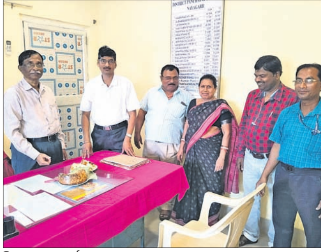
ଜିଲ୍ଲା ପଞ୍ଚାୟତ କାର୍ଯ୍ୟାଳୟ।