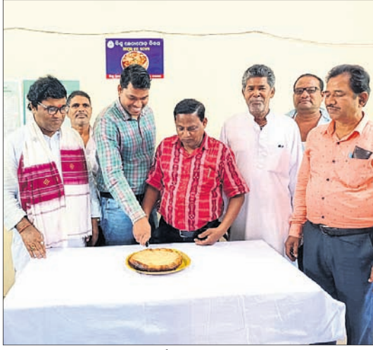
ଜିଲ୍ଲା ସଂସ୍କୃତି ଅଧିକାରୀଙ୍କ କାର୍ଯ୍ୟାଳୟ।