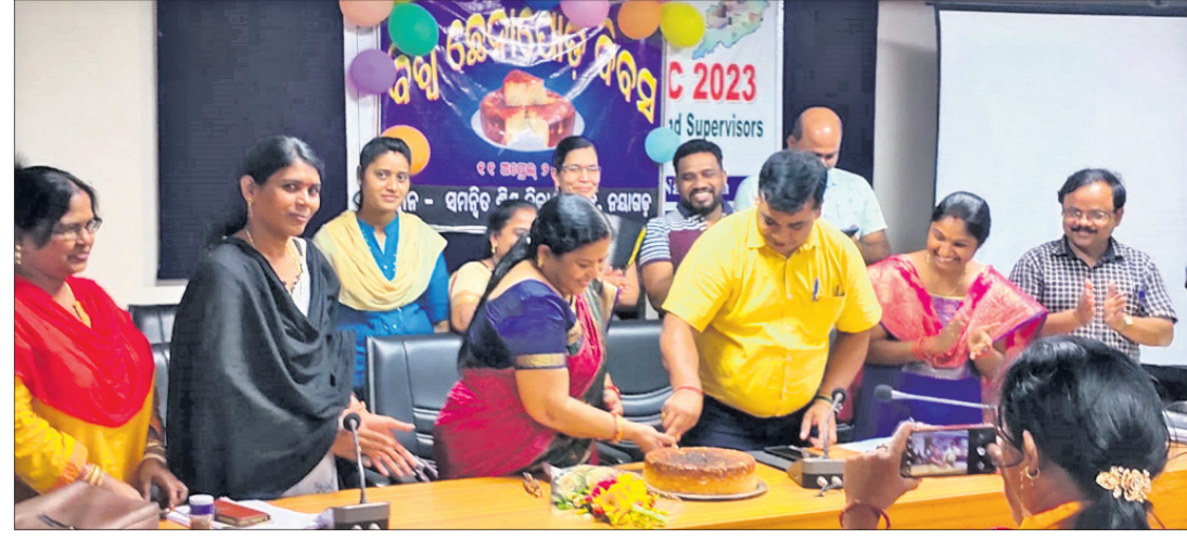
ସିଡ଼ିପାଠ ଓ ବିଡ଼ିଓ ଛେନାପୋଡ଼ କାରୁଛନ୍ତି।