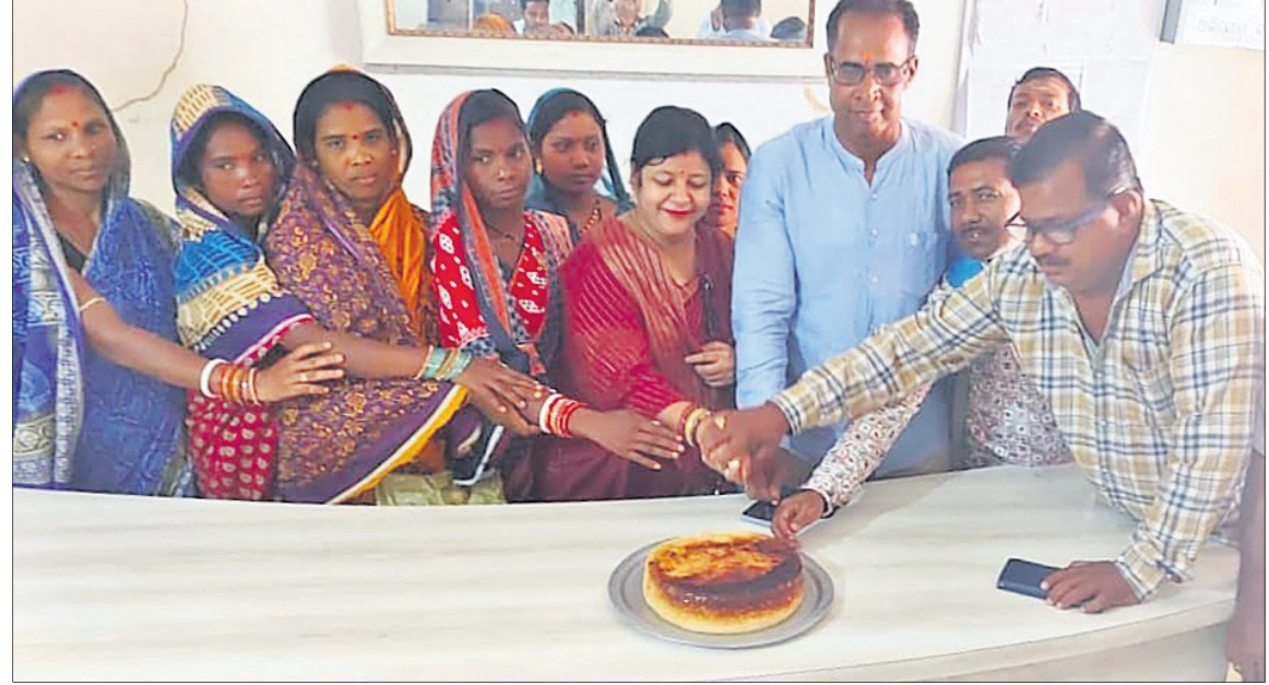
ଶରଣକୁଳ ପଞ୍ଚାୟତ କାର୍ଯ୍ୟାଳୟ।