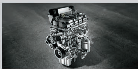
K15 (1.5L) Petrol Engine