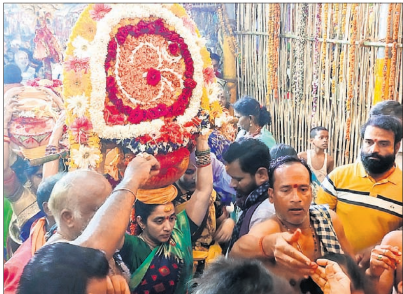
ମା'ଙ୍କ ଘଟ ପରିକ୍ରମା କରାଯାଇଛି।

ବ୍ରହ୍ମପୁରର ଅଧିକାଂଶ ଦେବୀ ମା ବୁଢ଼ା ଠାକୁରାଣୀ ଯାତ୍ରା ଗୁରୁବାର ଦଶମ ଦିନରେ ପହଞ୍ଚିଛି। ମା'ଙ୍କ ଆଳତି ପରେ ଅପରାହ୍ନରେ ଦହି ଅନ୍ନ ଓ ରାଜଭୋଗ କରାଯାଇଥିଲା। ରାତି ୮ଟା ପରେ ମା'ଙ୍କ ଘଟ ୪ ସାହି ପରିକ୍ରମା ହୋଇଥିଲା। ମା'ଙ୍କ ଘଟ ଦେଖା ବେହେରା ସାହି ଛିଡ଼ା ଅଗ୍ରାୟା ମଞ୍ଚପୁରୁ ବାହାରି ମହୁରା ରାଜବାଟୀରେ ପହଞ୍ଚିଥିଲା। ମହୁରା ରାଜା ଠାକୁରାଣୀଙ୍କୁ ପୂଜାର୍ଚ୍ଚନା କରିଥିଲେ। ଏହାପରେ ମା'ଙ୍କ ଘଟ ଗୁଡ଼ ବଜାର, ପଦରା ସାହି, କାମୁଲବନ୍ଧ ସାହି, କଂସାବା ସାହି, ଖଣ୍ଡିଆ କୁମ୍ଭି ସାହି, ନୂଆ କାଳୁପାତ୍ର ସାହି ଓ ଶାଣ୍ଡିଆ ସାହି ପରିକ୍ରମା କରିଥିଲା। ପ୍ରତି ସାହିରେ ଶହ ଶହ ମହିଳା ହଳଦୀ ପାଣିରେ ମା'ଙ୍କ ପାଦ ଧୋଇଥିଲେ। ଶେଷରେ ଘଟ ସାତରାମ ସାହି ଦେଇ ଗୁଡ଼ ବଜାର ହୋଇ ଦେଶା ବେହେରା ସାହିରେ ଅଗ୍ରାୟା ମଞ୍ଚପୁରରେ ପହଞ୍ଚିଥିଲା।