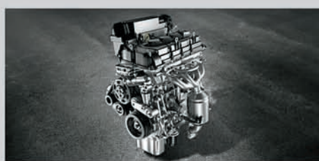
K15 (1.5L) Petrol Engine