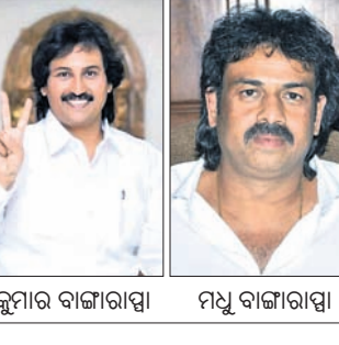
କୁମାର ବାଜାରାସ୍ତା ମଧୁ ବାଜାରାସ୍ତା