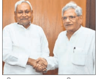
ବିହାର ମୁଖ୍ୟମନ୍ତ୍ରୀ ତଥା କେନ୍ଦ୍ର ନେତା ନୀତୀଶ କୁମାର ଓ ବିପିଆଇ(ଏମ୍) ସାଧାରଣ ସମ୍ପାଦକ ସାତାରାମ ଘୋଷ୍ଟା

୨୦୨୪ ଲୋକ ସଭା ନିର୍ବାଚନରେ ଭାଜପାକୁ ପରାସ୍ତ କରିବା ଲାଗି ବିହାର ମୁଖ୍ୟମନ୍ତ୍ରୀ ତଥା କେନ୍ଦ୍ର ନେତା ନୀତୀଶ କୁମାର ଅଣ୍ଟା ଭିଡ଼ିଛନ୍ତି। ୩ ଦିନିଆ ନୂଆଦିଲ୍ଲୀ ଗସ୍ତରେ ଥିବା ନୀତୀଶ ସବୁ ଅଣ୍ଟାଭାଜପା ଦଳକୁ ଏକାଠି କରିବା ଲାଗି ଉଦ୍ୟମ କରି ରଖିଛନ୍ତି। ଏହି କ୍ରମରେ ସେ ବୁଧବାର କଂଗ୍ରେସ ଅଧ୍ୟକ୍ଷ ମଲ୍ଲିକାର୍ଜୁନ ଖାର୍ଜେ, ପୂର୍ବତନ ଅଧ୍ୟକ୍ଷ ରାହୁଲ ଗାନ୍ଧୀ ଏବଂ ଏଏପି ନେତା ତଥା ଦିଲ୍ଲୀ ମୁଖ୍ୟମନ୍ତ୍ରୀ ଅରବିନ୍ଦ କେଜ୍ରିୱାଲଙ୍କୁ ଭେଟି ମିଳିତ ରଣନୀତି ଉପରେ ଆଲୋଚନା କରିଥିଲେ। ଗୁରୁବାର ସେ ବିପିଆଇ(ଏମ୍) ସାଧାରଣ ସମ୍ପାଦକ ସାତାରାମ ଘୋଷ୍ଟା, ବିପିଆଇ ନେତା ଡି. ରାଜା ଏବଂ ଅନ୍ୟ ନେତାମାନଙ୍କୁ ଭେଟି ବିରୋଧୀ ଏକତା ନେଇ କଥା