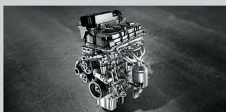
K15 (1.5L) Petrol Engine