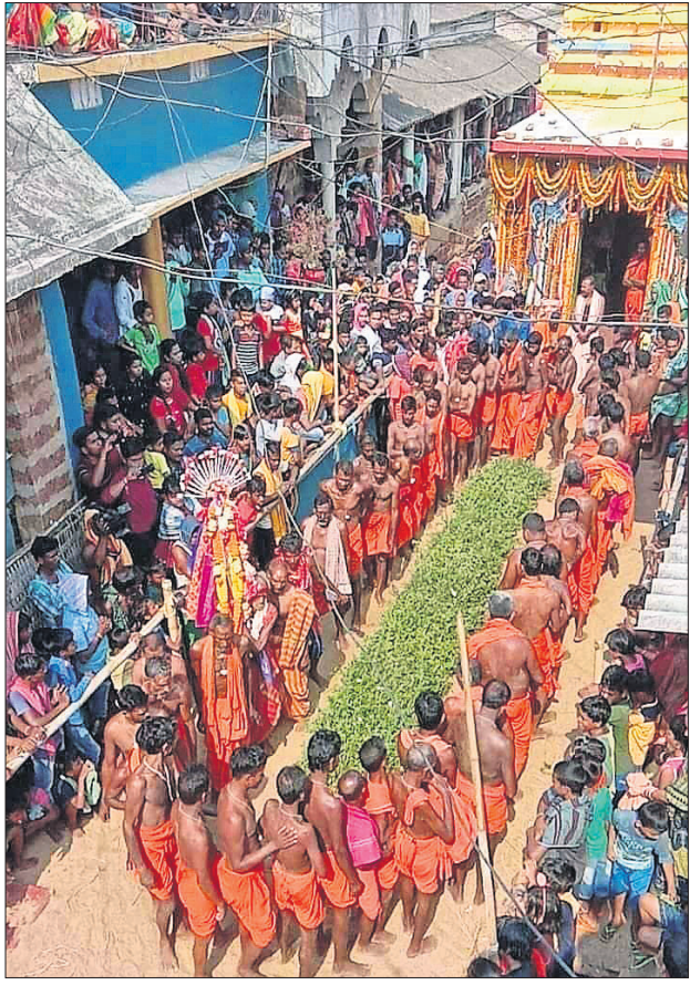
ଦଣ୍ଡୁଆମାନେ କଣ୍ଠେଇ କଣ୍ଠା ଉପରେ ଗତିବାକୁ ଯାଉଛନ୍ତି ।

ଆସୁଛି । ଅଧିକାଂଶ ଶିକ୍ଷକନେତା ନିଜ ନାମ ଗୋପନ ରଖି କହିଛନ୍ତି ନକଲି ଶିକ୍ଷକମାନେ ଯାଞ୍ଚ ସମୟରେ ଦୂରରେ ରହୁଛନ୍ତି ।