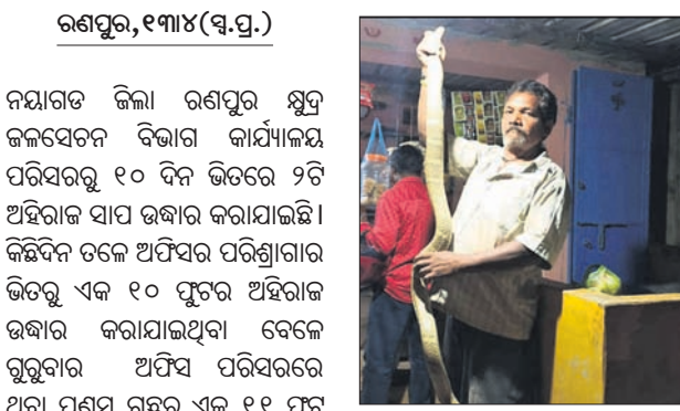
ପ୍ରକାଶ ପାଇଛି । ସାପ ଧରିବାକୁ ଥିବା ଏହି ୨ ଅଧିକାରକୁ ଉଦ୍ଧାର କରି ରଖିବା ପାଇଁ ନୟାଗଡ଼ ଜିଲାର କର୍ମଚାରୀମାନଙ୍କ ମଧ୍ୟରେ ଆଡ଼କ

ପର୍ଯ୍ୟନ୍ତ ଶ୍ରମିକଙ୍କୁ କାମ କରିବାକୁ ମନା କରାଯାଇଥିଲା । ଗୃହ ପାଳିତ ପ୍ରାଣୀ ପାଇଁ ହାଟରେ, ଗୋଠରେ କଳକୃଷ୍ଣ ବ୍ୟବସ୍ଥା ଓ ଲୋକଙ୍କ ପାଇଁ ଛକ ସ୍ଥାନରେ ଜଳଛତ୍ରର ବ୍ୟବସ୍ଥା କରିବାକୁ କୁହାଯାଇଥିଲା ।