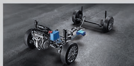
Smart Hybrid Technology