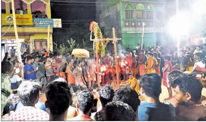
ମଣିଷୁମ୍ଭରେ ଓଲଟା ଝୁଲୁଛନ୍ତି ଭଗତ ।

ରୁରୁବାର ମେଳ ପର୍ବରେ ରଣପୁର ପାଟଦଣ୍ଡ କାମନା କୋଠର ଭଗତମାନଙ୍କ ଦ୍ୱାରା କୋଠି ପ୍ରାଙ୍ଗଣରେ ବିଭିନ୍ନ ପ୍ରକାର ହଲୁଆ ନାଚ ଗୀତ ଓ ପାରମ୍ପରିକ ଧାନ୍ ବୁଣା ଯାଇଥିଲା ।