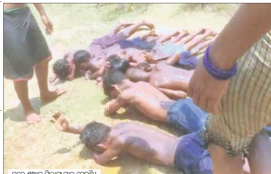
ତଳେ ଶୁଆଲ ପିଲାଙ୍କୁ ମାଡ଼ ହେଉଛି।

୪୮ ଘଣ୍ଟାରେ ଅଂଶୁଯାତ ମୃତ୍ୟୁ ରିପୋର୍ଟ ଦେବାକୁ ଜିଲ୍ଲାପାଳଙ୍କୁ ନିର୍ଦ୍ଦେଶ ଦିଆଯାଇଛି।