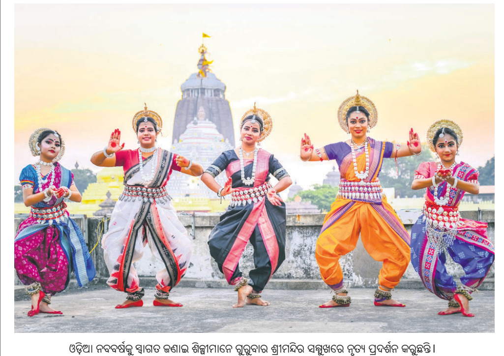
ଓଡ଼ିଆ ନବବର୍ଷକୁ ସାଗର ଜଣାଇ ଶିଶୁମାରୀରେ ଗୁରୁବାର ଶ୍ରୀମନ୍ଦିର ସମ୍ମୁଖରେ ନୃତ୍ୟ ପ୍ରଦର୍ଶନ କରୁଛନ୍ତି।

ମାପଲାରେ ସଫେଦ କର୍ମଚାରୀମାନେ ଟ୍ରେନ୍ ସଫା କରୁଥିବାବେଳେ ସାଧାରଣ ବରିକୁ ଏକ ଶବ୍ଦ ଶୁଣିବାକୁ ପାଇଥିଲେ। ଶବ୍ଦ ଶୁଣି ସେମାନେ ଚମକି ପଡ଼ିବା ସହ ଭୟଭୀତ ହୋଇ ପଡ଼ିଥିଲେ। ଭୁବନେଶ୍ୱର କର୍ମଚାରୀମାନେ ସେଠାକୁ ଯିବା ପରେ ଭକ୍ତ ବରିକୁ ଥିବା ବାହାରିଥିବା ଦେଖିବାକୁ ପାଇଥିଲେ। ସେମାନେ ଏ ସଂକ୍ରାନ୍ତରେ ଆର୍ପିଏସ୍କୁ ଜଣାଇଥିଲେ। ଆର୍ପିଏସ୍ ଅଧିକାରୀମାନେ ସେଠାକୁ ଯାଇ ଯାଞ୍ଚ କରିଥିଲେ। ପରେ ଡିଏସ୍ ଡିଏସ୍ ଦ୍ୱାରା ଯାଞ୍ଚ ପରେ ଏଗୁଡ଼ିକ ବିଘ୍ନୋରକ ସାମଗ୍ରୀ ବୋଲି ସ୍ପଷ୍ଟ ହୋଇଥିଲା। ଚେତେ ଅଧିକ ଯାଞ୍ଚ ପାଇଁ ବୋମା ନିଷ୍ପତ୍ତିକାରୀ ବଳକୁ ଡକାଯାଇଛି।