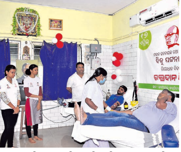
ପ୍ରବାଦପୁରୁଷ ବିକ୍ର ପଟ୍ଟନାୟକଙ୍କ ଚିରୋପାନ ଦିବସ ପରିପ୍ରେକ୍ଷାରେ ଗୁରୁବାର କ୍ୟାମ୍ପିଗାଲ ହସ୍ପିଟାଲ ରୁଡ୍ ବ୍ୟାଙ୍କଠାରେ ମୋ ପରିବାର ପକ୍ଷରୁ ଅନୁଷ୍ଠିତ କାର୍ଯ୍ୟକ୍ରମ।