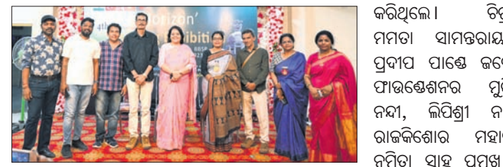
କଳାକାର୍ଯ୍ୟରେ ଦେଶ ବିଦେଶରୁ ସମ୍ମାନିତ ସମାରୋହରେ ସହଯୋଗ କରିଥିଲେ । ଗଣମାଧ୍ୟମ ପ୍ରତିନିଧିଙ୍କୁ ମଧ୍ୟ ସମ୍ବର୍ଦ୍ଧନା ଦିଆଯାଇଥିଲା । ଏହି ଚିତ୍ରକଳା ପ୍ରଦର୍ଶନୀକୁ ପରମଗୁରୁ ମୁଖ୍ୟ ଅତିଥିଙ୍କୁ ସମ୍ବର୍ଦ୍ଧିତ

ପିପିଲି ବ୍ଲକ ଉତ୍ତରାଞ୍ଚଳ ଶିଳ୍ପକଳା ପ୍ୟାଲେସ୍ ଆର୍ଟ ଗ୍ୟାଲେରୀରେ ବହୁର୍ଥ ଅନ୍ତର୍ଜାତୀୟ ଚିତ୍ରକଳା ପ୍ରଦର୍ଶନୀ ରୁଣ୍ଡିଆର ଉଦ୍‌ଯାପିତ ହୋଇଛି । ଶିବିରରେ ଭାରତ ସମେତ ନେପାଳ, ଭୁଟାନ, ବାଙ୍ଗାଦେଶ ଓ ଭିଏତନାମ ପ୍ରଭୃତି ରାଷ୍ଟ୍ରର ୧୭ ମହିଳା ଓ ୩୦ ପୁରୁଷ ଚିତ୍ରଶିଳ୍ପୀ ଯୋଗ ଦେଇଥିଲେ । ମୁଖ୍ୟ ଅତିଥି ଭାବେ କିଏ ସୁତେଞ୍ଜ କାଉନସିଲିଂର ଡାଇରେକ୍ଟର ତଥା ଚିତ୍ରକଳା,