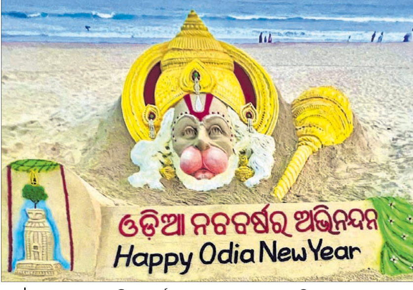
ଓଡ଼ିଆ ନବବର୍ଷ ଉପଲକ୍ଷେ ଗୁରୁବାର ପୁରୀ ବେଳାଭୂମିରେ ପରୁଣୀ ସୁଦର୍ଶନ ପଟ୍ଟନାୟକଙ୍କ ବାଲୁକାକଳା।