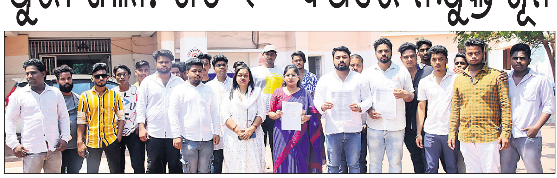
ବିଜେ ଦାବି ନେଇ ଜିଲ୍ଲା ଛାତ୍ର କଂଗ୍ରେସ ପକ୍ଷରୁ ଜିଲ୍ଲାପାଳଙ୍କ କାର୍ଯ୍ୟାଳୟ ସମ୍ମୁଖରେ ଧାରଣା ଦିଆଯାଇଛି ।

ପୁରୀ ଅଫିସ୍, ୧୩୩୫: ପୁରୀ ଜିଲ୍ଲାରେ ଗତ ୧୦ ବର୍ଷ ମଧ୍ୟରେ ରୋଜଗାର ବିନିମୟ କାର୍ଯ୍ୟାଳୟରେ ୩୫୨୨୧ ଜଣ ନାମ ପଞ୍ଜୀକୃତ କରିଥିବା ବେଳେ ଜଣଙ୍କୁ ମଧ୍ୟ ନିୟୁତ୍ତି ମିଳିନାହିଁ। ଉଭୟ କେନ୍ଦ୍ର ଓ ରାଜ୍ୟ ସରକାର ଯଥାକ୍ରମେ ବର୍ଷକୁ ୨ କୋଟି ଓ ୧୦ ହଜାର ନିୟୁତ୍ତି ଦେବାକୁ ନିଜ ନିର୍ଦ୍ଦେଶ ଦେଇଛନ୍ତି।