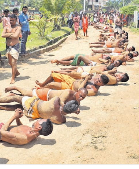
ଭୁବନେଶ୍ୱର ଉପକଣ୍ଠ ମେଣ୍ଟାଣକ ଗ୍ରାମରେ ଗୁରୁବାର ଅନୁଷ୍ଠିତ ଧୂଳିଦଣ୍ଡ ଉତ୍ସବରେ ମାନସିକଧାରୀମାନେ ଧୂଳିରେ ଦଣ୍ଡ ଗଢ଼ୁଛନ୍ତି।

ସେଲ୍ଫି ପଠାଇବା ସମୟରେ ନିଜର ନାମ ଏବଂ ମୋବାଇଲ ନମ୍ବର ଦେବାକୁ ଭୁଲିଛନ୍ତି ନାହିଁ। ଯୋଗ୍ୟ ବିବେଚିତ ଏବଂ ପ୍ରକାଶ ପାଇବ।