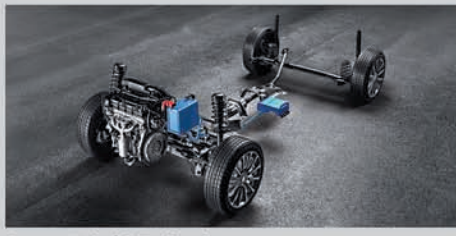
Smart Hybrid Technology