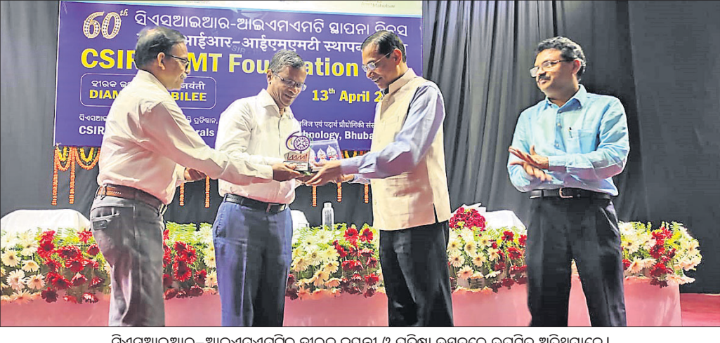
ସିଏସ୍ଆଇଆର୍-ଆଇଏମ୍ଏମ୍ଟିର ହାରକ ଜୟନ୍ତୀ ଓ ପ୍ରତିଷ୍ଠା ଉତ୍ସବରେ ଉପସ୍ଥିତ ଅତିଥିମାନେ।

ଆମେ ବିଭିନ୍ନ ପ୍ରକାରର କର୍ମଶାଳା ଆୟୋଜନ କରି ସମସ୍ତ କ୍ଷେତ୍ରରେ ଖଣିଜ ପଦାର୍ଥର ଘାଣ୍ଟା ଏବଂ ଉନ୍ନତ ସମାଧାନ ପାଇଁ ଚେଷ୍ଟାକରତ। ଆମର ସମ୍ପତ୍ତୀ ଓ ସାମର୍ଥ୍ୟକୁ ଆହୁରି ବଢ଼ାଇବା, ଯତ୍ନାତ୍ମକ ଭାବେ ଏହି କ୍ଷେତ୍ରର ସମସ୍ତ ସମାଧାନ ସମାଧାନ ନିମନ୍ତେ ସିଏସ୍ଆଇଆର୍-ଆଇଏମ୍ଏମ୍ଟିରୁ ଉପଯୁକ୍ତ ମନେ କରିବେ ବୋଲି ସେ କହିଥିଲେ। ଏହି ଅବସରରେ ହିରା ପତ୍ରିକା 'ଅଭିବ୍ୟକ୍ତି' ଉନ୍ମୋଚିତ ହୋଇଥିଲା। ସଂଯୋଜକ ଡ. ସାହୁ ଧନ୍ୟବାଦ ଅର୍ପଣ କରିଥିଲେ।