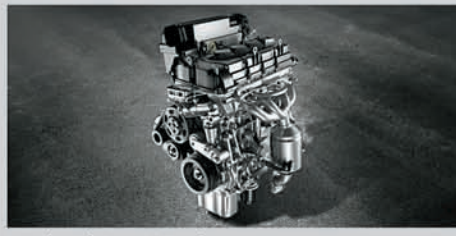
K15 (1.5L) Petrol Engine