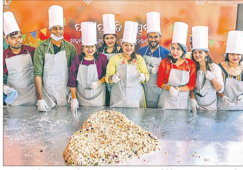
ଭୁବନେଶ୍ୱରସ୍ଥିତ ରେଷୁରାଃ ନିମନ୍ତଣ'ରେ ସେଫମାନଙ୍କ ସହ ସେଲିବ୍ରିଟମାନେ ପଣା ପ୍ରସ୍ତୁତ କରୁଛନ୍ତି।

କୁହାଯାଏ 'ପଣା'ରେ ରହିଛି ଓଡ଼ିଆଙ୍କ ପ୍ରାଣ। ଓଡ଼ିଆ ପଞ୍ଜିକାର ରାଶନ ଅନୁସାରେ, ମହାବିଷୁବ ସଂକ୍ରାନ୍ତି ହିଁ ବର୍ଷର ପ୍ରଥମ ସଂକ୍ରାନ୍ତି। ଏହି ଦିନଟିକୁ ଓଡ଼ିଆ ନବବର୍ଷ ଭାବରେ ପାଳନ କରାଯାଏ। ଏହିଠାରୁ ବର୍ଷ ଆରମ୍ଭ ସହ ଖରା ଚାନ୍ଦି ଓ ବାୟୁର ଗତି ପ୍ରଖର ହୋଇଥାଏ। ତେଣୁ ଓଡ଼ିଆ ପରିବାରରେ ଦେବାଦେବଙ୍କଠାରେ ସ୍ୱତନ୍ତ୍ର ପୂଜା, ଭୋଗ, ହୋମ ଆଦି କରାଯାଇଥାଏ। ଏହି ଦିନରେ ମନ୍ଦିରଗୁଡ଼ିକରେ ଛତୁ ଓ ପଣା ଭୋଗର ବିଧି ରହିଛି। ସାଲପଡ଼ିଶା, ବନ୍ଧୁବାହୁବ ଓ ବ୍ରାହ୍ମଣମାନଙ୍କୁ ପଣା ଦିଆଯାଏ। ତେଣୁ ଏହିଦିନକୁ ପଣାସଂକ୍ରାନ୍ତି ବୋଲି କୁହାଯାଇଥାଏ। ରାସ୍ତାକଡ଼ରେ ପଥକଙ୍କ ବୃକ୍ଷା ନିବାରଣ ପାଇଁ କଳକ୍ରମାନ୍ତର ଖୋଲାଯାଏ। ହିନ୍ଦୁ ପରିବାରରେ ଚଉଁରାରେ ପୂଜା ପାଉଥିବା ଚୁଳିଆ ବୃକ୍ଷ ଉପରେ ଛାପୁଡ଼ିଆ କରି ପଡ଼ିରେ କଳ ରଖି ପୂଜା ଧାରରେ କଳଦାନ କରାଯାଇଥାଏ। ଏହି ସଂକ୍ରାନ୍ତି ପରଠାରୁ ବୃକ୍ଷ ଓ ଜୀବଜଗତକୁ କଳ ପ୍ରଦାନ କରାଯାଉଥିବାରୁ ଏହି ସଂକ୍ରାନ୍ତିର ଅନ୍ୟନାମ କଳସଂକ୍ରାନ୍ତି ବୋଲି କହିଥାନ୍ତି। ସେହିପରି ଉତ୍ତମ ଅଗ୍ନି ଓ ବାୟୁଙ୍କ ପ୍ରକୋପରୁ ରକ୍ଷାପାଇବା ପାଇଁ ଏହି ସମୟରେ ହନୁମାନ ଜୟନ୍ତି ପାଳନ କରାଯାଏ। ଓଡ଼ିଆମାନଙ୍କ ପାଇଁ ଏହି ଦିନଟି ଅତ୍ୟନ୍ତ ସ୍ୱତନ୍ତ୍ର। ତେଣୁ କିଏ ଏହାକୁ ପଣା ବାଣ୍ଟି ପାଳନ୍ତି ତ ଆଉ କିଏ ଓଡ଼ିଆ ନବ ବର୍ଷର ଶୁଭେଚ୍ଛା ସହ ଦିନଟିକୁ ବିତାନ୍ତି। ରାଜାଧାନୀରେ ଅନେକ ସାମାଜିକ ଅନୁଷ୍ଠାନ ରାସ୍ତା ପାର୍ଶ୍ୱରେ ପଣା ବାଣ୍ଟିବାର ବ୍ୟବସ୍ଥା କରିଛନ୍ତି।