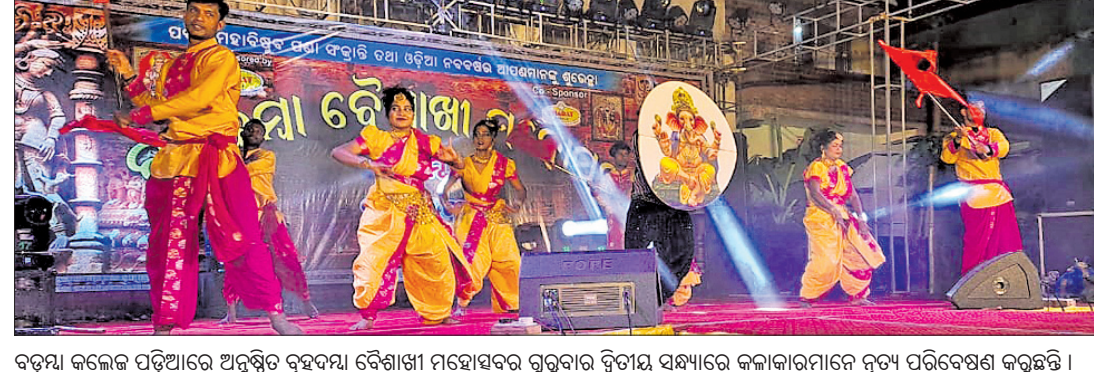
ବଡ଼ମ୍ବା କଲେଜ ପଢ଼ୁଆରେ ଅନୁଷ୍ଠିତ ବଡ଼ମ୍ବା ବିଶିଷ୍ଟା ମହୋତ୍ସବର ଗୁରୁବାର ଦ୍ଵିତୀୟ ସନ୍ଧ୍ୟାରେ କଳାକାରମାନେ ନୃତ୍ୟ ପରିବେଷଣ କରୁଛନ୍ତି।