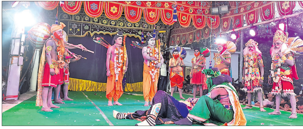
ବୌଦ୍ଧରେ ରାମଲୀଳା ନାଟକର ଦୃଶ୍ୟ ।

ବୌଦ୍ଧଗଡ଼ଜାତର ଗଣପର୍ବ ପ୍ରସିଦ୍ଧ ରାମଲୀଳା ଯାତ୍ରାର ଶୁକ୍ରବାର ଥିଲା ଷୋହଳତମ ଦିବସ । ଷୋହଳତମ ଦିବସରେ ପରିବେଷିତ ହୋଇଛି ନାଟକ ନରାଡ଼କ ବଧ । ମହାମାୟାବା ମହାରାବଣ ବଧ ପରେ ରାବଣ ଚିନ୍ତିତ ହୋଇପଡ଼ିଛି । ତଥାପି ଲଙ୍କାଗଡ଼ ବୀରଶୂନ୍ୟ ହୋଇନାହିଁ । ମହାରାବଣ ବଧ ପରେ ରାବଣକୁ ଚେତାଇ ଦେଇଛି ମାତା ନୌକେଶୀ । ଏବେବି ବଞ୍ଚିଛି ପୁତ୍ର ନରାଡ଼କ । ଯେଉଁ ପୁଅମାନଙ୍କୁ ରାବଣ ସମୁଦ୍ରକୁ ପିଲି ଦେଇଥିଲା, ସେହି ପୁତ୍ରମାନଙ୍କ ମଧ୍ୟରୁ ଅନ୍ୟତମ ହେଉଛି ନରାଡ଼କ । ସେ ରୁଦ୍ର ଶୁକ୍ରାଚାର୍ଯ୍ୟଙ୍କଠାରୁ ମୁକ୍ତ ବିଦ୍ୟା ଶିକ୍ଷା କରି ହୋଇଛି ମହାପ୍ରତାପୀ । ନରାଡ଼କ ଭଳି ବୀର ସାଗା ଜଗତରେ ନାହିଁ । ପିତା ରାବଣର ଡାକ ଶୁଣି ଯୁଦ୍ଧରେ ଉତ୍ତମ ପଟ୍ଟନାୟକ ସଙ୍ଗୀତ ନିର୍ଦ୍ଦେଶନା ଦେଇଛନ୍ତି । ନରାଡ଼କ ବଧ ନାଟକ ଦେଖିବାକୁ ବିକମ୍ପିତ ରାତି ପର୍ଯ୍ୟନ୍ତ ହଜାର ହଜାର ଦର୍ଶକଙ୍କ ଭିଡ଼ ଲାଗିରହିଥିଲା ।