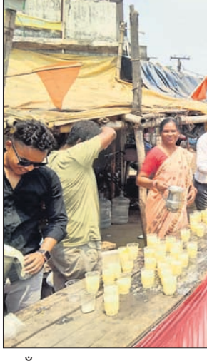
କୁଆଁରମୁଣ୍ଡା ଚେକ ଗେଟ ଛକରେ ପଥଚାରୀମାନଙ୍କୁ ସରବତ ବଣ୍ଟନ କରାଯାଇଛି।

ସୁନ୍ଦରଗଡ଼ ଜିଲ୍ଲା କୁଆଁରମୁଣ୍ଡା ବ୍ଲକର ବିଭିନ୍ନ ସ୍ଥାନରେ ଶୁକ୍ରବାର ପଣାବଂକ୍ରାନ୍ତି ଓ ଓଡ଼ିଆ ନବବର୍ଷ ପାଳିତ ହୋଇଯାଇଛି। ଏହି ଉପଲକ୍ଷେ ପଥଚାରୀମାନଙ୍କୁ ପଣାବଂକ୍ରାନ୍ତି କରାଯାଇଛି।