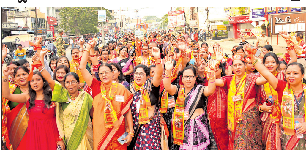
ଏସ୍ଆରୁଆଇଟି କଲୋନୀ ଶୋଭାଯାତ୍ରାରେ ମହିଳାମାନେ।