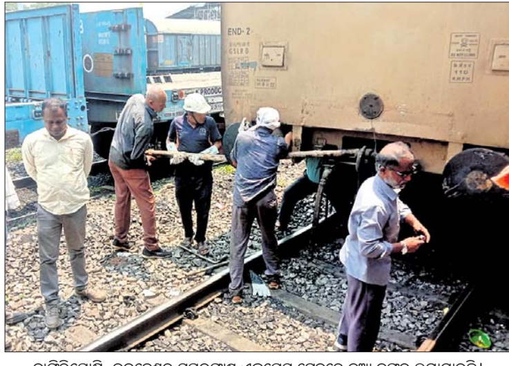
ବାଙ୍ଗିରିପୋଷି-ଭୁବନେଶ୍ୱର ସୁପରଫାଷ୍ଟ ଏକ୍ସପ୍ରେସ୍ ଟ୍ରେନ୍ରେ ନୂଆ ବମ୍ବର ଲାଗାଯାଇଛି।

ସେହି ଅବସ୍ଥାରେ ଟ୍ରେନ୍ଟି ପ୍ରାୟ ଅଢେଇ ଘଣ୍ଟା ରହିବାରୁ ଅଧିକାଂଶ ଯାତ୍ରୀମାନେ କଟକରେ ରହି ରେଳ ଚଳାଚଳ ସମ୍ପୂର୍ଣ୍ଣ ବନ୍ଦ ହୋଇଯାଇଥିଲା। ଭୁବନେଶ୍ୱର ଓ କଟକର ରେଳକାଳିନ୍ଦି ଟ୍ରେନ୍ ସହ ବରିଷ୍ଠ ଅଧିକାରୀମାନେ ଘଟଣାସ୍ଥଳରେ ପହଞ୍ଚି ନଷ୍ଟ ବମ୍ବରକୁ କାଟି ବାହାର କରିବା ପରେ ନୂତନ ବମ୍ବର ଯୋଡ଼ା ଯାଇଥିଲା। ପୂର୍ବରୁ ପ୍ରାୟ ୧୧ଟା ୧୫ ପରେ ଟ୍ରେନ୍ଟି ଭୁବନେଶ୍ୱର ଅଭିମୁଖେ ଯାତ୍ରା କରିଥିଲା। ଅପରପକ୍ଷରେ ରେଳଓ ପକ୍ଷରୁ ଉଦ୍ଧୃତ ଆହୁ ଅନୁସୂଚୀ ଟ୍ରେନ୍ଗୁଡ଼ିକୁ ବିଭିନ୍ନ ଷ୍ଟେଶନରେ ଅଟକି ଅଟକି ହୋଇପଡ଼ିଥିଲା।