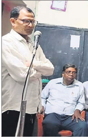
ବନାନୀ ସାହିତ୍ୟ ସଂସଦ ପକ୍ଷରୁ କବିତା ପାଠ କାର୍ଯ୍ୟକ୍ରମରେ ମଞ୍ଚାସୀନ ଅତିଥି।