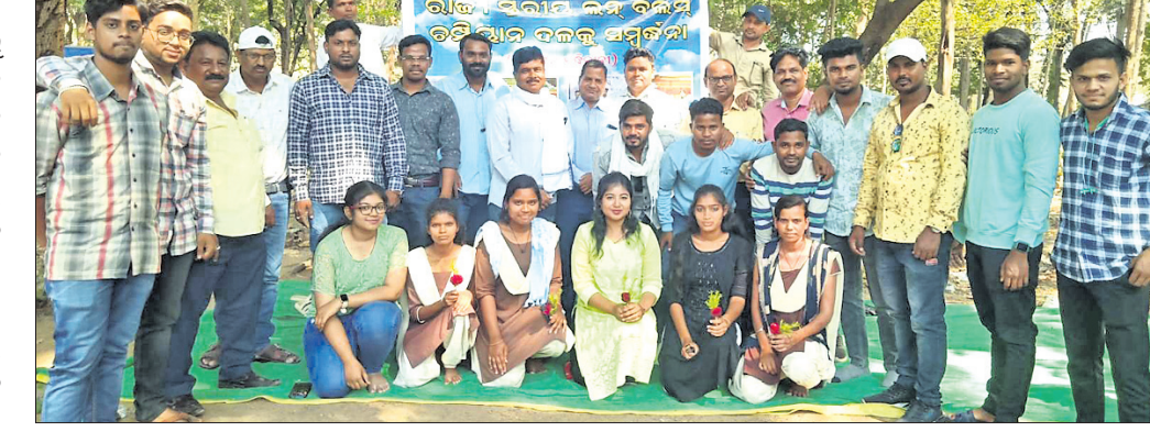
ଚାମ୍ପିୟନ ବଲାଙ୍ଗୀର ଲନ୍ ବଲ୍ ଦଳ ସଦସ୍ୟଙ୍କୁ ସମ୍ବର୍ଦ୍ଧନା ଅବସରରେ କ୍ରୀଡ଼ାପ୍ରେମୀମାନେ ।