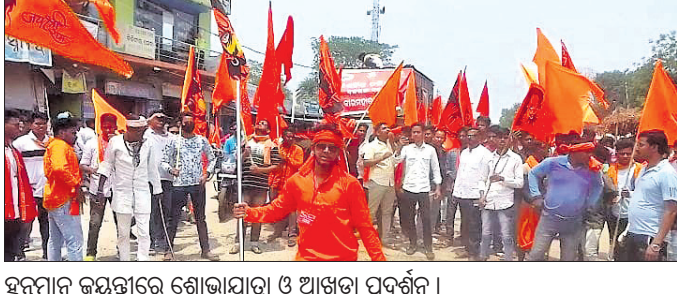
ହନୁମାନ ଜୟନ୍ତୀରେ ଶୋଭାଯାତ୍ରା ଓ ଆଖଡ଼ା ପ୍ରଦର୍ଶନ ।

ସୁବର୍ଣ୍ଣପୁର ଜିଲା ବଜରଙ୍ଗ ଦଳ ପକ୍ଷରୁ ବୀରମହାରାଜପୁରରେ ଶୁକ୍ରବାର ଦିନ ଏକ ଶୋଭାଯାତ୍ରା ଅନୁଷ୍ଠିତ ହୋଇଯାଇଛି । ପଥରଘାଟଠାରେ ଥିବା ପଞ୍ଚମୁଖୀ ହନୁମାନ ମନ୍ଦିରରେ ପୂଜାର୍ଚ୍ଚନା କରିବା ପରେ ସେଠାରୁ ଏକ ବିରାଟ ଶୋଭାଯାତ୍ରା ସାହାରା ସହରର ମୁଖ୍ୟ ହଲଠାରେ ଆଖଡ଼ା, ଖଣ୍ଡା ବୁଲାଇ ଓ କୁସ୍ତି ପ୍ରଦର୍ଶନ କରିଥିଲେ । ସେଠାରୁ ଗଙ୍ଗାବୀହିଠାରେ ଥିବା ହନୁମାନ ମୂର୍ତ୍ତି ସମ୍ମୁଖରେ ବଜରଙ୍ଗ ଦଳର କାର୍ଯ୍ୟକର୍ତ୍ତାମାନେ ଦର୍ଶନ କରି ପୂଜାର୍ଚ୍ଚନା କରିଥିଲେ । ଏହି