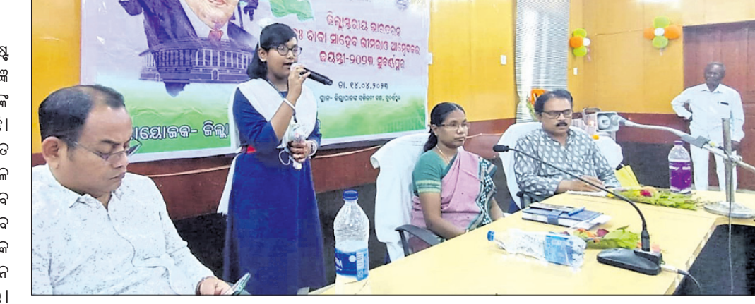
ଆନ୍ଦୋଳନଙ୍କ ଜୟନ୍ତୀ ପାଳନ ଅବସରରେ ଜଣେ କୃତି ଛାତ୍ରୀ ବକ୍ତବ୍ୟ ପ୍ରଦାନ କରୁଛନ୍ତି ।