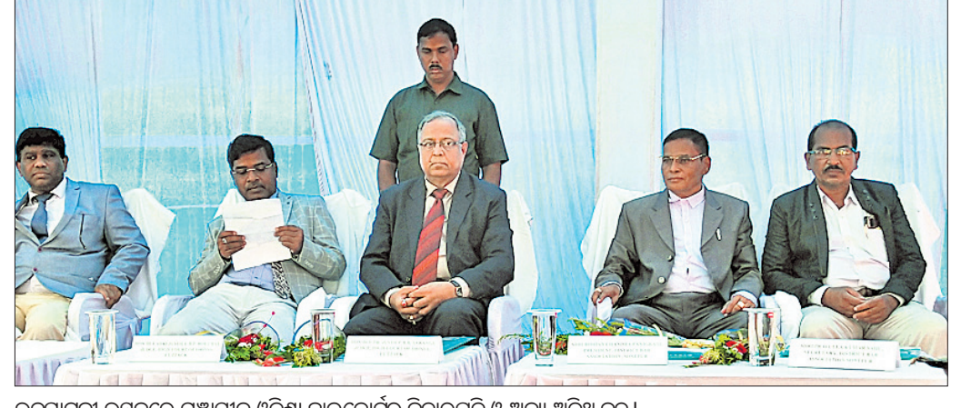
ଉଦ୍ଘାଟନା ଉତ୍ସବରେ ମହାସାଧନ ଓଡ଼ିଶା ହାଇକୋର୍ଟର ବିଚାରପତି ଓ ଅନ୍ୟ ଅତିଥି ବୃନ୍ଦ ।

■ ୩.୧୧ କୋଟି ବ୍ୟୟରେ ନିର୍ମିତ ଏହି କେନ୍ଦ୍ର ରାଜ୍ୟରେ ପ୍ରଥମ ■ କେନ୍ଦ୍ରରେ ଓକିଲ ସଂଘ ସମ୍ମିଳନୀ କକ୍ଷ, ବ୍ୟାଙ୍କ, ଡାକଘର, ପ୍ରାଥମିକ ଉପଚାର କେନ୍ଦ୍ର, କ୍ୟାଣ୍ଟିନ୍, ଡାକ୍ତାରି ହଲ୍ ସୁବିଧା ରହିଛି