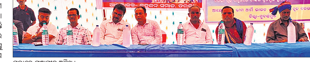
ସଭାରେ ମହାସାଧନ ଅତିଥି ।