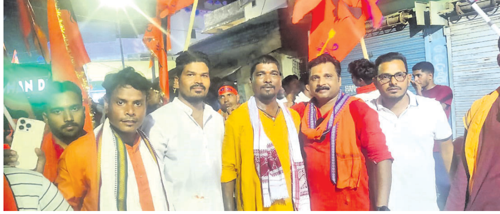
ହନୁମାନ ଜୟନ୍ତୀ ଅବସରରେ ସହରରେ ଅନୁଷ୍ଠିତ ଝଣା ଶୋଭାଯାତ୍ରା ।

ପଠାକାରେ ସଜା ଯାଇଥିଲା । ଅଷ୍ଟ ହନୁମାନଙ୍କ ପୀଠରେ ଶୁକ୍ରବାର ସ୍ୱତନ୍ତ୍ର ପୂଜା ଅନୁଷ୍ଠିତ ହୋଇଥିଲା । ସହରର ବଡ଼ ହନୁମାନ, ଧାର ହନୁମାନ, ଝାର ହନୁମାନ, ଘର ହନୁମାନ, ପର ହନୁମାନ, ବାଟ ହନୁମାନ, ଗଡ଼ ହନୁମାନ ଓ ଘାଟ ହନୁମାନ ପୀଠରେ ଶ୍ରଦ୍ଧାଳୁମାନେ ପୂଜାର୍ଚ୍ଚନା କରିଥିଲେ । ମନ୍ଦିରରେ ହନୁମାନ ଚାଳିଶା ପାଠ କରାଯିବା ସହ ପଣା ବିତରଣ କରାଯାଇଥିଲା । ହନୁମାନ ଜୟନ୍ତୀ ଅବସରରେ ବକରଙ୍ଗ ଦଳ ହନୁମାନ ଜୟନ୍ତୀ ଜିଲ୍ଲାର ବିଭିନ୍ନ ସ୍ଥାନରେ ଭକ୍ତିର ସହ ପାଳିତ ହୋଇଯାଇଛି । ଏଥିପାଇଁ ସୋନପୁର ସହରକୁ ଚେରୁଆ