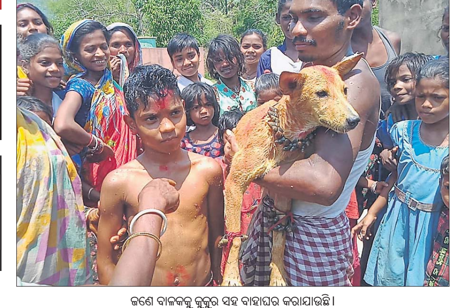
ଜଣେ ବାଳକକୁ କୁକୁର ସହ ବାହାଘର କରାଯାଇଛି ।

ସୋର, ୧୪୪୪(ଡି.ଏନ.ଏ.) ରିଷ୍ଟ ଖଣ୍ଡନ ନାଁରେ ଅଜବ ପରମ୍ପରା ପରମ୍ପରା ନାମରେ ଏବେକି ଲୋକଙ୍କ ମନରେ ବସା ବାନ୍ଧିଛି ଅଶ୍ରବଣୀୟା। ବିବାହ ବେଳେ ମଙ୍ଗଳଦୋଷ ଥିଲେ ପୁଅ କିମ୍ବା ଝିଅର ରିଷ୍ଟ ଖଣ୍ଡନ ଲାଗି ପ୍ରଥମେ ସାହାଯ୍ୟ ଗରୁଡ଼ି ଦିବାହ କରାଯାଉଥିବା ପୂର୍ବରୁ ଆମେ ଶୁଣିଛେ। ହେଲେ ଶିଶୁଟିର ପ୍ରଥମେ ଉପର ଦାନ୍ତ ଉଠିଲେ କୁକୁର ସହ ବାହାଘର କରାଯିବା ପରମ୍ପରା ଶୁଣିବାକୁ ଅଜବ ଲାଗୁଥିଲେ ଦି ଏହ ସତ। ଏପରି କଲେ ପିଲାଟିର ରିଷ୍ଟ ଖଣ୍ଡନ ହେବା ସହ ଦେହ ସ୍ଥୁଳ ରୁହେ ବୋଲି ଲୋକଙ୍କ ବିଶ୍ୱାସ ରହିଛି। ଏଭଳି ଘଟଣା ଦେଖିବାକୁ ମିଳିଛି ବାଲେଶ୍ୱର ଜିଲ୍ଲା ସୋର ବ୍ଲକ୍ ଶିଖାଖୁଣ୍ଟା ପଞ୍ଚାୟତ ଅନ୍ତର୍ଗତ ବନ୍ଧସାହି ଗ୍ରାମରେ। ଶୁକ୍ରବାର ପୂର୍ବାହ୍ନରେ ଆଦିବାସୀ ପରମ୍ପରା ରୀତିନୀତି ଅନୁସାରେ ଏହି ଗ୍ରାମର ଦରି ସିଂଙ୍କ ପୁଅ ସହିତ ଏକ ମାଛ କୁକୁର ଏବଂ ବୁଢ଼ୁରୁ ସିଂଙ୍କ ଝିଅ ସହିତ ଏକ ଅଣ୍ଡିଆ କୁକୁର ବିବାହ ଅନୁଷ୍ଠିତ ହୋଇଛି। ଏହି ସମ୍ପ୍ରଦାୟର ଗ୍ରାମବାସୀ ଏହାକୁ ବେଶ୍ ଧ୍ୟାନପାତ୍ରରେ ପାଳନ କରିଛନ୍ତି। ଉକ୍ତ ସମ୍ପ୍ରଦାୟର ଲୋକଙ୍କ କହିବା ଅନୁଯାୟୀ, ପିଲାଟିର ଯଦି ପ୍ରଥମେ ଉପର ଦାନ୍ତ ଉଠେ ତେବେ ସେ ବିଭିନ୍ନ ରୋଗରେ ଆକ୍ରାନ୍ତ ହୋଇଥାଏ। ତା'ର ରିଷ୍ଟ ଖଣ୍ଡନ ପାଇଁ ପିଲାଟିକୁ କୁକୁର ସହିତ ବିବାହ କରାଇଦିଆଯାଏ। ରିଷ୍ଟ ଖଣ୍ଡନ ହୋଇଗଲେ କୁକୁର ରୋଗଗ୍ରସ୍ତ ହେବା ସହିତ ମୃତ୍ୟୁ ମୁଖରେ ପଡ଼ିଥିବା ପିଲାଟି ସ୍ଥୁଳ ହୋଇଯାଏ ବୋଲି ବିଶ୍ୱାସ ରହିଛି।