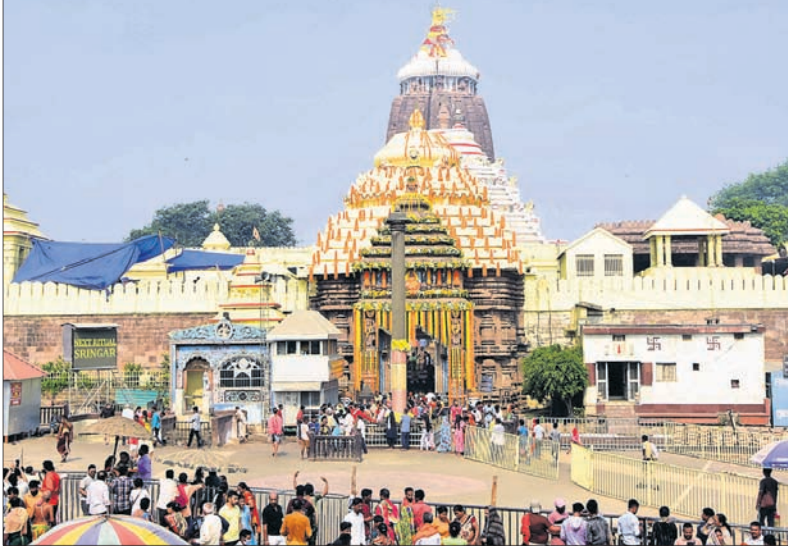
ମହାବିଷୁବ ସଂକ୍ରାନ୍ତି ଅବସରରେ ପୁସ୍ତକିତ ଶ୍ରୀମନ୍ଦିର ସମ୍ମୁଖରେ ଶ୍ରଦ୍ଧାଳଙ୍କ ଭିଡ଼ ।

ପବିତ୍ର ମହାବିଷୁବ ସଂକ୍ରାନ୍ତି ଅବସରରେ ଶୁକ୍ରବାର ଶ୍ରୀମନ୍ଦିରରେ ବିଶେଷ ନାଚି ଅନୁଷ୍ଠିତ ହୋଇଛି । ଏହି ଅବସରରେ ନୂତନ ପଞ୍ଜିକା ପଠନ ସହ ପ୍ରଚଳନ ହୋଇଛି । ମହାପ୍ରଭୁଙ୍କ ମଙ୍ଗଳ ଆଳତି, ଅବକାଶ ନାଚି ବଢ଼ ସକାଳ ଧୂପ ସରିବା ପରେ ପ୍ରଭୁ ହନୁମାନଙ୍କ ବିଗ୍ରହ ଦକ୍ଷିଣା ଘରୁ ହିଂସାସନକୁ ବିକେ କରାଯାଇଥିଲା । ପାଳିଆ ପୂଜାପଣ୍ଡା ସାମନ୍ତ ମହାପ୍ରଭୁଙ୍କ ଶ୍ରୀଅଙ୍ଗଳାଗି ଅଧର ରୂପିତ ଗୋଟିଏ ଆଜ୍ଞାମାଳ ଏବଂ ଅନ୍ୟ ଏକ ମାଳ ଆଣି ହନୁମାନଙ୍କୁ ଦେଇଥିଲେ । ଏହାପରେ ବିନାମକୁ ହନୁମାନ ବିକେ ହୋଇଥିଲେ । ଶ୍ରୀମନ୍ଦିର ଚାରିଦିଗରେ ଥିବା ମହାବୀର ଓ ବାରଭାଇ ହନୁମାନ ଏବଂ ଶ୍ରୀମନ୍ଦିର ପରିସରସ୍ଥ ସମସ୍ତ ହନୁମାନଙ୍କୁ ପୂଜାପଣ୍ଡା ଆଜ୍ଞାମାଳ ଦେବା ପରେ ଘଣ୍ଟା, ଛତା, କାହାଳୀ ପଦ୍ମଆରରେ ଜଗନାଥବଳଭଦ୍ର ମଠକୁ ଏହି ଆଜ୍ଞାମାଳ ବିକେ କରାଯାଇଥିଲା । ପ୍ରଥମେ ମହାବୀର ଓ ଶେଷରେ ଗଜପତି ଗୋଡ଼ସ୍ଥିତ ବେଢ଼ି ହନୁମାନ ତଥା ଦରିଆ ମହାବୀରଙ୍କ ନିକଟକୁ 'ଆଜ୍ଞାମାଳ' ଯାଇଥିଲା । ଅନ୍ୟପକ୍ଷରେ ଶ୍ରୀମନ୍ଦିରରେ ପୂର୍ବରୁ ଆଜ୍ଞାମାଳ ପାଇ ପାଲିକିରେ ବିକେ ଥିବା ହନୁମାନଙ୍କ ପ୍ରତିମୂର୍ତ୍ତି ଜଗନାଥ ବଳଭଦ୍ର ବିକେ କରିଥିଲେ । ସେଠାରେ ନାଚି ଅନୁଷ୍ଠିତ ହୋଇଥିଲା । ମଠରେ