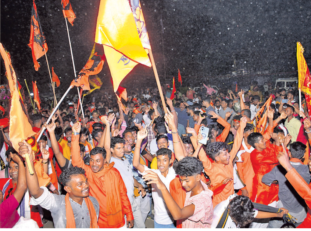
ସମ୍ବଲପୁର ଜିଲ୍ଲା ସ୍ଵଳ୍ପ ଛକ ଦେଇ ଯାଉଥିବା ହନୁମାନ ଜୟନ୍ତୀ ଶୋଭାଯାତ୍ରା ।