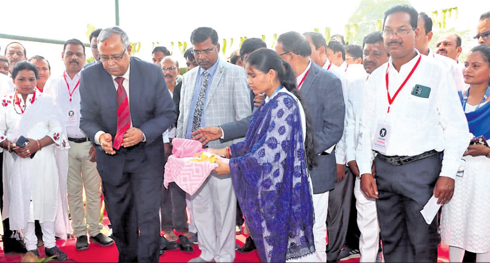
ଭିତ୍ତିପଥର ସ୍ଥାପନ ଉତ୍ସବ ।