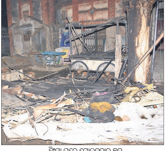
ସମ୍ବଲପୁର ଚଳି ଛକରେ ପୋଡ଼ାଜଳା।