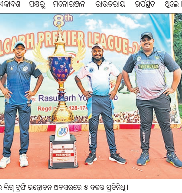
ରସୁଲଗଡ଼ ପ୍ରିମିୟର ଲିଗ୍ ଚୁପ୍ ଉନ୍ମୋଚନ ଅବସରରେ ୫ ଦଳର ପ୍ରତିନିଧି।

ରସୁଲଗଡ଼ ମୁଖ୍ୟ କୋର୍ଟ ଆନୁକୁଲ୍ୟରେ ରସୁଲଗଡ଼ ପ୍ରିମିୟର ଲିଗ୍ ୮ମ ସଂସ୍କରଣ ଶନିବାରଠାରୁ ଆରମ୍ଭ ହେବ। ଲିଗ୍ ପଡ଼ିଆରେ ପ୍ରତିଯୋଗିତା ୨୩ ତାରିଖ ପର୍ଯ୍ୟନ୍ତ ଚାଲିବ। ପ୍ରତିଯୋଗିତାରେ ମୋଟ ୫୦ଟି ଦଳ ଅଂଶଗ୍ରହଣ କରିବେ। ଶୁକ୍ରବାର ୫ ଦଳର ପ୍ରତିଯୁକ୍ତ ଉପସ୍ଥିତିରେ ଚୁପ୍ ଉନ୍ମୋଚନ କାର୍ଯ୍ୟକ୍ରମ ଅନୁଷ୍ଠିତ ହୋଇଯାଇଛି। ଏହି ଅବସରରେ ମା' ଦୁର୍ଗା ଦେବ ଏକାଦଶ ପକ୍ଷରୁ ପାର୍ଥ ଏକାଦଶ ପକ୍ଷରୁ ମନୋରଞ୍ଜନ ଲଭିବ। ପ୍ରତିଯୋଗିତାରେ ମୋଟ ୫୦ଟି ଦଳ ଅଂଶଗ୍ରହଣ କରିବେ। ଶୁକ୍ରବାର ୫ ଦଳର ପ୍ରତିଯୁକ୍ତ ଉପସ୍ଥିତିରେ ଚୁପ୍ ଉନ୍ମୋଚନ କାର୍ଯ୍ୟକ୍ରମ ଅନୁଷ୍ଠିତ ହୋଇଯାଇଛି। ଏହି ଅବସରରେ ମା' ଦୁର୍ଗା ଦେବ ଏକାଦଶ ପକ୍ଷରୁ ପାର୍ଥ ଏକାଦଶ ପକ୍ଷରୁ ମନୋରଞ୍ଜନ ଲଭିବ। ପ୍ରତିଯୋଗିତାରେ ମୋଟ ୫୦ଟି ଦଳ ଅଂଶଗ୍ରହଣ କରିବେ। ଶୁକ୍ରବାର ୫ ଦଳର ପ୍ରତିଯୁକ୍ତ ଉପସ୍ଥିତିରେ ଚୁପ୍ ଉନ୍ମୋଚନ କାର୍ଯ୍ୟକ୍ରମ ଅନୁଷ୍ଠିତ ହୋଇଯାଇଛି। ଏହି ଅବସରରେ ମା' ଦୁର୍ଗା ଦେବ ଏକାଦଶ ପକ୍ଷରୁ ପାର୍ଥ ଏକାଦଶ ପକ୍ଷରୁ ମନୋରଞ୍ଜନ ଲଭିବ।