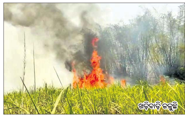
ଖଡ଼ିବାଡ଼ି ଜଳୁଛି ଭୋଗରାଇ, ୧୪୪୪(ଡି.ଏନ.ଏ.)