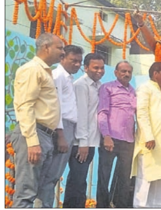
ଉଦ୍‌ଘାଟନରେ ଛକ ଅଧ୍ୟକ୍ଷଙ୍କ ପ୍ରତିମୂର୍ତ୍ତିରେ ପୁଷ୍ପ ମାଳ୍ୟାର୍ପଣ କରାଯାଇଛି।