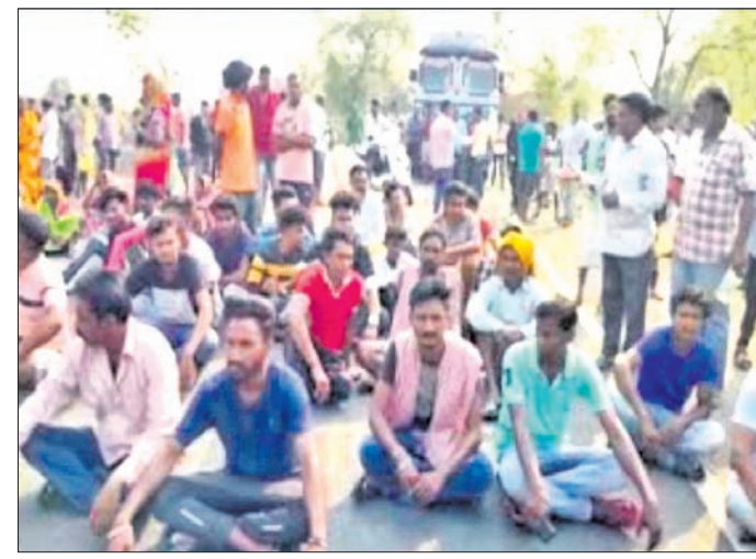
କ୍ଷତିପୂରଣ ଦାବିରେ ରାସ୍ତାରେକୋ କରାଯାଇଛି।