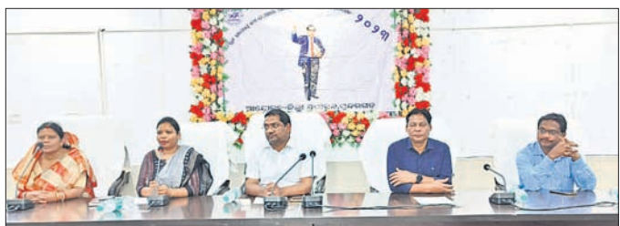
ସୁନ୍ଦରଗଡ଼ରେ ଆୟେଡ଼କରଙ୍କ ଜୟନ୍ତୀରେ ମଞ୍ଚାସୀନ ଅତିଥି।

ଦୂରାନ୍ତର ଯୋଗଦେଇ ଅତିରିକ୍ତ ନିକଟରେ ଅଭିଯୋଗ କରାଯାଇଛି। ଏହି କାର୍ଯ୍ୟକ୍ରମରେ ଯୋଗଦେଇ ଅତିରିକ୍ତ ନିକଟରେ ଅଭିଯୋଗ କରାଯାଇଛି।