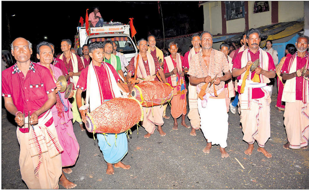
ଶୋଭାଯାତ୍ରାରେ ସାମିଲ ହୋଇଥିବା ସମ୍ପ୍ରଦାୟ ଓ ହରୁମାନଙ୍କ ମେଡ଼।

ବେଲପାହାଡ, ୧୪୪ (ଡି.ଏନ.ଏ.): ଝାରସୁଗୁଡ଼ାଠାରେ ଶୁକ୍ରବାର ଜିଲ୍ଲା ବିଜେଟି ଏସିଏ ସେଲ ପକ୍ଷରୁ ଡ. ବି.ଆର୍. ଆୟେଡ଼କରଙ୍କ ୧୩୨ତମ ଜୟନ୍ତୀ ପାଳିତ ହୋଇଯାଇଛି।