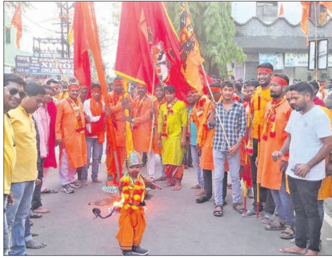
ଦେବଗଡ଼ରେ ହନୁମାନ ଜୟନ୍ତୀ ପାଳନ ମୁହୂର୍ତ୍ତ।

ସାହିରେ ଆକର୍ଷଣୀୟ ଝୋଟି ଓ କଳା ସ୍ଥାପନ କରି ଏହି ଶୋଭାଯାତ୍ରାକୁ ସ୍ୱାଗତ କରାଯାଇଥିଲା। ଏହି ଶୋଭାଯାତ୍ରା ମଠସାହି ବଣିଆଁସାହି,ଆମେ କୁବ ପାଳିତ ହୋଇଥିବାବେଳେ ଆଖଡ଼ା ପ୍ରଦର୍ଶନ ବେଶି ଆକର୍ଷଣୀୟ ହୋଇଥିଲା।