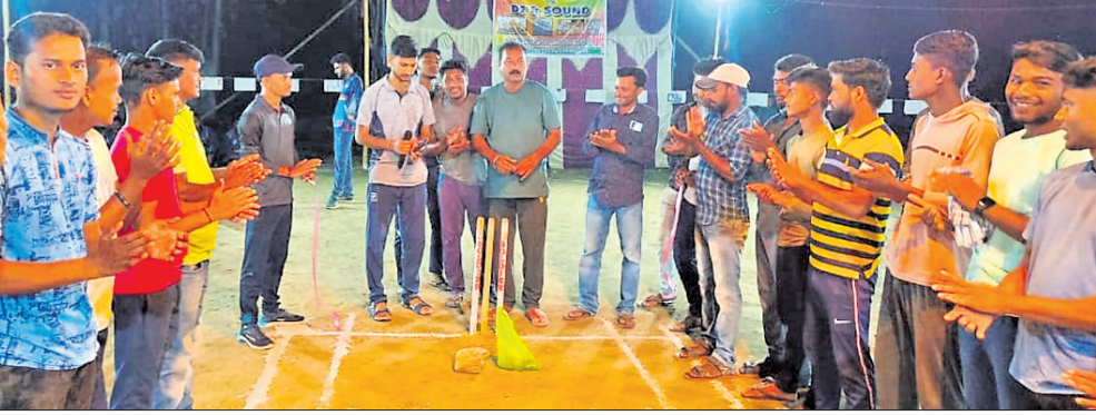
ଉଦ୍ଘାଟନା ଉତ୍ସବରେ ଅତିଥି ଓ ଖେଳାଳି ।