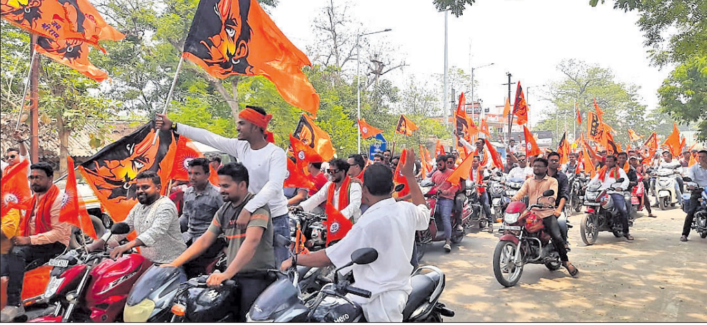
ବୌଦ୍ଧରେ ବଜରଙ୍ଗ ଦଳର ବାଇକ୍ ରାଲି ।

ବୌଦ୍ଧ ବଜରଙ୍ଗ ଦଳ ପକ୍ଷରୁ ହନୁମାନ ଜୟନ୍ତୀ ମହାଆଡ଼ମ୍ବର ସହକାରେ ପାଳିତ ହୋଇଯାଇଛି । ଜିଲ୍ଲା ବିଷ୍ଣୁ ହିନ୍ଦୁ ପରିଷଦ ଓ ବଜରଙ୍ଗ ଦଳ ପକ୍ଷରୁ ସକାଳେ ମହାନଦୀ ଗର୍ଭରେ ଥିବା ସିଦ୍ଧ ହନୁମାନ ମନ୍ଦିର ରୁତାରେ ଧୂଳା ବନ୍ଧନ କରାଯାଇଥିଲା । ତାପରେ ମାତଙ୍ଗେଶ୍ୱର ମନ୍ଦିର ଠାରୁ ଏକ ବିଶାଳ ବାଇକ୍ ରାଲି ବାହାରି ଝାରଲେସ ଛକ, ବାଘରୁଡ଼ା ଛକ, ଗାନ୍ଧୀ