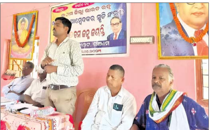
କବିସୂର୍ଯ୍ୟନଗରଠାରେ ଅନୁଷ୍ଠିତ ଜୟନ୍ତୀରେ ମହାସାଧନ ଅତିଥି।

ସେହିପରି ଛତ୍ରପୁରଠାରେ ବାବା ସାହେବ ଡଃ ଭାମରାଓ ରାମଜୀ ଆୟୋଜକଙ୍କର ୧୩୨ ତମ ଜିଲ୍ଲାସ୍ତରୀୟ ଜୟନ୍ତୀ ଶୁକ୍ରବାର ସୂଚନା ଓ ଲୋକ ସମ୍ପର୍କ ବିଭାଗ ପକ୍ଷରୁ ଜଗତ ସମ୍ମିଳନୀ କକ୍ଷରେ ପାଳିତ ହୋଇଛି।