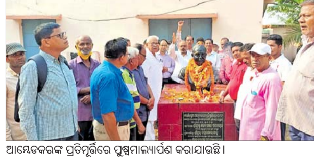
ଆୟୋଜକଙ୍କ ପ୍ରତିମୂର୍ତ୍ତିରେ ପୁଷ୍ପମାଳ୍ୟାର୍ପଣ କରାଯାଇଛି ।