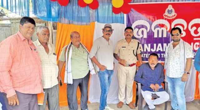
ଶେରଗଡ଼, ୧୪୪୪ (ଡି.ଏନ୍.ଏ.)

ଶେରଗଡ଼ ଥାନା ଆମ ପୋଲିସ ପକ୍ଷରୁ ଏକ ମେଘା ଜଳଛତ୍ରକୁ ଶୁଭାରମ୍ଭ କରାଯାଇଛି। ପ୍ରାୟ ୧୦୦୦ ମାଛ ମରିଯାଇଥିବା ଦେଖିବାକୁ ମିଳିଛି। ପ୍ରାୟ ୧୦୦୦ ମାଛ ମରିଯାଇଥିବା ଦେଖିବାକୁ ମିଳିଛି। ପ୍ରାୟ ୧୦୦୦ ମାଛ ମରିଯାଇଥିବା ଦେଖିବାକୁ ମିଳିଛି। ପ୍ରାୟ ୧୦୦୦ ମାଛ ମରିଯାଇଥିବା ଦେଖିବାକୁ ମିଳିଛି।