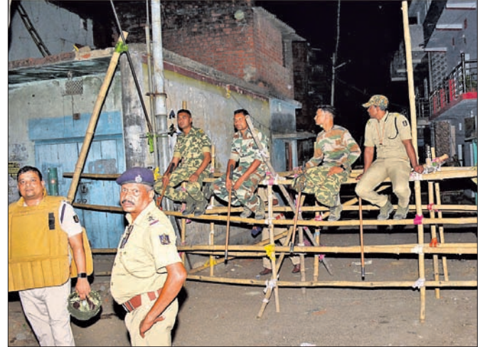
ସମ୍ବଲପୁର ସୁନାପାଲ୍ଲୀ ରାସ୍ତାରେ ଶୋଭାଯାତ୍ରାକୁ ଜମି ରହିଛି ପୋଲିସ୍।