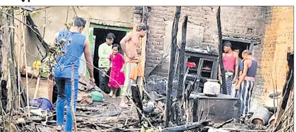
ଭଞ୍ଜନଗର, ୧୪୪୪ (ଡି.ଏନ୍.ଏ.)