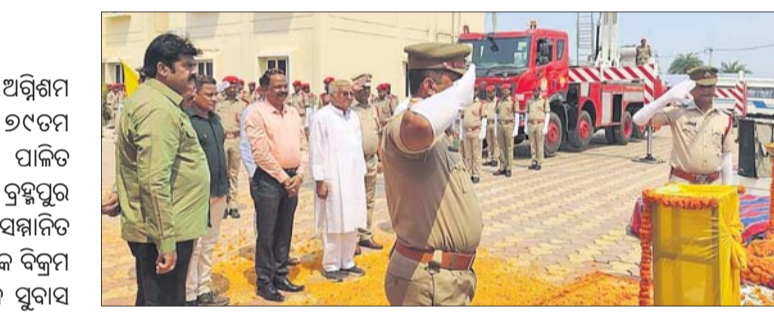
ଅତିଥିମାନଙ୍କ ଉପସ୍ଥିତିରେ ଶହୀଦମାନଙ୍କୁ ଶ୍ରଦ୍ଧାଞ୍ଜଳି ଅର୍ପଣ କରାଯାଇଛି । କର୍ମଚାରୀମାନେ ଲୋକଙ୍କୁ ନିଷ୍ଠାପର ଭାବେ ସେବା ଯୋଗାଇ ଆସୁଛନ୍ତି । ନେତୃତ୍ୱାଧୀନ ହେଉ ବା ସପିଂ ମଲ ହେଉ ଯେଉଁଠାରେ ଅଗ୍ନିଶାଳ ଘଟିଲେ ନିଜ ଜୀବନକୁ ବାଜି ଲାଗାଇ ନିଆଁକୁ ଆୟତ୍ତ କରିବାରେ ଅଗ୍ନିଶମ ବିଭାଗର ଅଧିକାରୀ ଓ କର୍ମଚାରୀମାନଙ୍କ ରୁଲ୍‌ବୁକ୍ସ ଉଜ୍ଜ୍ୱଳ ରହିଛି । ଏହାଛଡା ଅଗ୍ନିଶାଳକୁ କିଭଳି ନିଜକୁ ବଞ୍ଚାଇବେ ଓ ଅଗ୍ନିଶାଳ ହେବାକୁ କିଭଳି ରକ୍ଷା ପାଇବେ ସେ ନେଇ ବିଭିନ୍ନ କ୍ଷେତ୍ରରେ ଲୋକଙ୍କୁ ମନକ୍ଷୁଦ୍ଧ କରିଆଣେ ସତେବେନ

ବ୍ରହ୍ମପୁର ଅପିଏ, ୧୪/୪ ଗୋପାଳପୁର ସ୍ଥିତ ଦକ୍ଷିଣାଞ୍ଚଳ ଅଗ୍ନିଶମ ଅଧିକାରୀଙ୍କ କାର୍ଯ୍ୟାଳୟରେ ୧୯ତମ ଅଗ୍ନିଶମ ଓ ଶହୀଦ ଦିବସ ପାଳିତ ହୋଇଛି । ମୁଖ୍ୟ ଅତିଥି ଭାବେ ବ୍ରହ୍ମପୁର ଏମ୍ପିଏ ଉପସଭାରେ ପା' ଠାକୁରାଣୀଙ୍କ ଦର୍ଶନ ନିମନ୍ତେ ଶ୍ରଦ୍ଧାଳୁଙ୍କ ଭିଡ଼ ଦେଖିବାକୁ ମିଳିଥିଲା । ଭୋର ସଂକ୍ରାନ୍ତି କାରଣରୁ ଠାକୁରାଣୀଙ୍କ ମୁଖ୍ୟ ଝଟାରୁ ଅସ୍ଥାୟୀ ମଣ୍ଡପ ନିକଟରେ ପୁରୁଷ ଓ ମହିଳା ଭକ୍ତଙ୍କ ଲମ୍ବା ଧାଡ଼ି