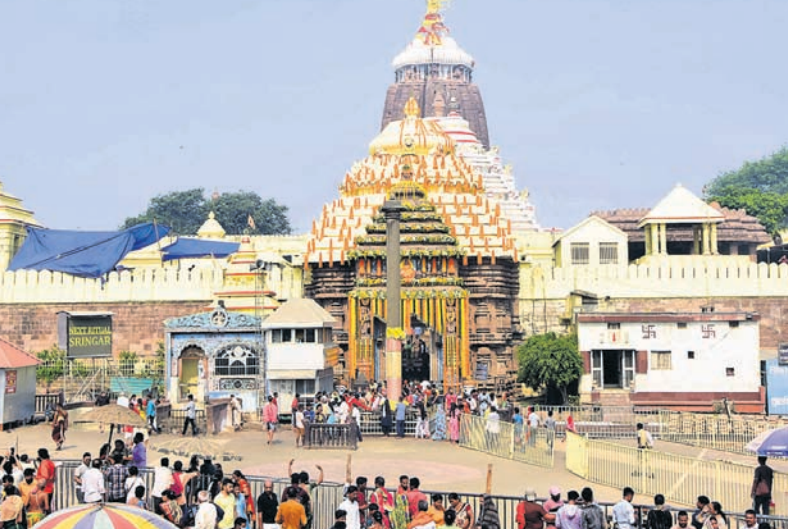
ମହାବିଷୁବ ସଂକ୍ରାନ୍ତି ଅବସରରେ ସୁସଜ୍ଜିତ ଶ୍ରୀମନ୍ଦିର ସମ୍ମୁଖରେ ଶ୍ରଦ୍ଧାଳଙ୍କ ଭିଡ଼।

ପବିତ୍ର ମହାବିଷୁବ ସଂକ୍ରାନ୍ତି ଅବସରରେ ଶୁକ୍ରବାର ଶ୍ରୀମନ୍ଦିରରେ ବିଶେଷ ନୀତି ଅନୁଷ୍ଠିତ ହୋଇଛି। ଏହି ଅବସରରେ ନୂତନ ପଞ୍ଜିକା ପଠନ ସହ ପ୍ରବଳନ ହୋଇଛି। ମହାପ୍ରଭୁଙ୍କ ମଙ୍ଗଳ ଆଳତି, ଅବକାଶ ନୀତି ବଡ଼ ସକାଳ ଧୂପ ସରିବା ପରେ ପ୍ରଭୁ ହନୁମାନଙ୍କ ବିଗ୍ରହ ଦକ୍ଷିଣା ଘରୁ ଦି-ହାସନକୁ ବିକେ କରାଯାଇଥିଲା। ପାଳିଆ ପୂଜାପଣ୍ଡା ସାମନ୍ତ ମହାପ୍ରଭୁଙ୍କ ଶ୍ରୀଅଙ୍ଗଳାଗି ଅଧର ରୂପିତ ଗୋଟିଏ ଆଜ୍ଞାମାଳ ଏବଂ ଅନ୍ୟ ଏକ ମାଳ ଆଣି ହନୁମାନଙ୍କୁ ଦେଇଥିଲେ। ଏହାପରେ ବିମାନକୁ ହନୁମାନ ବିକେ ହୋଇଥିଲେ। ଶ୍ରୀମନ୍ଦିର ଚାରିଦିଗରେ ଥିବା ମହାବୀର ଓ ବୀରଭାଇ ହନୁମାନ ଏବଂ ଶ୍ରୀମନ୍ଦିର ପରିସରସ୍ଥ ସମସ୍ତ ହନୁମାନଙ୍କୁ ପୂଜାପଣ୍ଡା ଆଜ୍ଞାମାଳ ଦେବା ପରେ ଘଣ୍ଟା, ଛତା, କାହାଳୀ ପଦ୍ମଆରରେ ଜଗନ୍ନାଥବଳଭଦ୍ର ମଠକୁ ଏହି ଆଜ୍ଞାମାଳ ବିକେ କରାଯାଇଥିଲା। ପ୍ରଥମେ ମହାବୀର ଓ ଶେଷରେ ଚକ୍ରଚାରୀ ଗୋଡ଼ସ୍ଥିତ ବେଡ଼ି ହନୁମାନ ତଥା ଦରିଆ ମହାବୀରଙ୍କ ନିକଟକୁ 'ଆଜ୍ଞାମାଳ' ଯାଇଥିଲା। ଅନ୍ୟ ପକ୍ଷରେ ଶ୍ରୀମନ୍ଦିରରେ ପୂର୍ବରୁ ଆଜ୍ଞାମାଳ ପାଲ ପାଲିକିରେ ବିକେ ଥିବା ହନୁମାନଙ୍କ ପ୍ରତିମୂର୍ତ୍ତି ଜଗନ୍ନାଥ ବଳଭଦ୍ର ବିକେ କରିଥିଲେ। ସେଠାରେ ନୀତି ଅନୁଷ୍ଠିତ ହୋଇଥିଲା। ମଠରେ