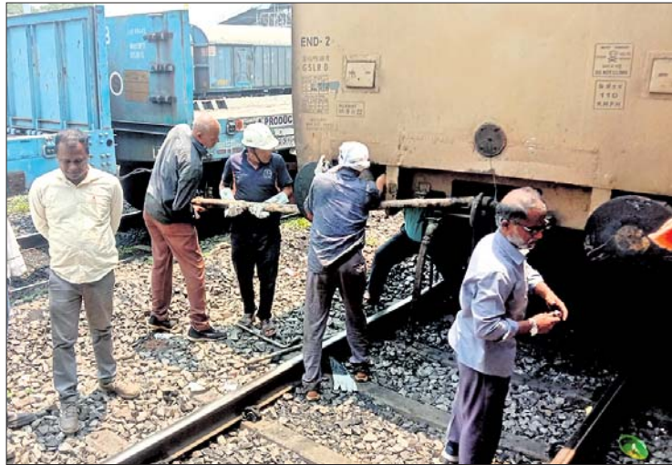
ବାଙ୍ଗିରିପୋଷି-ଭୁବନେଶ୍ୱର ସୁପରଫାଷ୍ଟ ଏକ୍ସପ୍ରେସ ଟ୍ରେନ୍ରେ ନୂଆ ବଙ୍ଗର ଲଗାଯାଇଛି।

ବାଙ୍ଗିରିପୋଷି-ଭୁବନେଶ୍ୱର ସୁପରଫାଷ୍ଟ ଏକ୍ସପ୍ରେସ ଟ୍ରେନ୍ (୧୨୮୧୧)ରେ ଶୁକ୍ରବାର ଯାନ୍ତ୍ରିକ ତ୍ରୁଟି ଯୋଗୁ ପ୍ରାୟ ଅଢେଇ ଦଣ୍ଡା ଧରି ରେଳ ଚଳାଚଳ ବାଧାପ୍ରାପ୍ତ ହୋଇଥିଲା। କଟକ ରେଳଷ୍ଟେଶନର ୫ ନମ୍ବର ପ୍ଲାଟଫର୍ମରେ ଗାଡ଼ିଟି ଅଟକି ରହିବା ହେତୁ ଅଧିକ ଲାଲନ୍ଦର ସେହି ସମୟ ମଧ୍ୟରେ କୌଣସି ରେଳ ଚଳାଚଳ ହୋଇପାରି ନ ଥିଲା। ଫଳରେ କଟକ ଷ୍ଟେଶନ ପୂର୍ବରୁ ୪ଟି ଟ୍ରେନ୍କୁ ଅଟକାଇ ରଖାଯାଇଥିଲା। ଯାତ୍ରୀମାନେ ଗତବ୍ୟ ସ୍ଥଳରେ ପହଞ୍ଚି ନ ପାରି ହତସ୍ତ ହୋଇଥିଲେ। ଟ୍ରେନ୍ରେ ଅଟକି ଷ୍ଟେଶନ ଭୁବନେଶ୍ୱର ହୋଇଥିବାରୁ ଯାତ୍ରୀମାନେ କଟକରେ ଓହ୍ଲାଇ ସଡ଼କ ପଥରେ ବସ୍ ଯୋଗେ ଯିବାକୁ ବାଧ୍ୟ ହୋଇଥିଲେ। ମିଳିଥିବା ସୂଚନା ଅନୁସାରେ, ଉକ୍ତ ଟ୍ରେନ୍ ପ୍ରତିଦିନ ଭଳି ଶୁକ୍ରବାର ପୂର୍ବରୁ ପ୍ରାୟ ୯.୧୫ରେ କଟକ ରେଳଷ୍ଟେଶନର ୫ ନମ୍ବର ପ୍ଲାଟଫର୍ମ ମଧ୍ୟକୁ ପ୍ରବେଶ କରୁଥିଲା। ଏହି ସମୟରେ ଟ୍ରେନ୍ରେ ଲୋକୋ ପାଇଲଟ୍ ଯାନ୍ତ୍ରିକ ତ୍ରୁଟି ସମ୍ପର୍କରେ ଅବଗତ ହୋଇଥିଲେ। ୨୨ ବରିଷ୍ଠ ଟ୍ରେନ୍ ଇଞ୍ଜିନିୟର ଓ ଭୁକ୍ତି ବରିଷ୍ଠ ପ୍ଲାଟଫର୍ମ ମଧ୍ୟକୁ ପ୍ରବେଶ କରିଥିଲେ। ହେଲେ ଯାନ୍ତ୍ରିକ ତ୍ରୁଟି ଶାନ୍ତ କରିବାରେ କ୍ଷମାପତ୍ରିତ ଟ୍ରେନ୍କୁ ସେହି ଅବସ୍ଥାରେ ଅଟକାଇ ରଖାଯାଇଥିଲା। ଭୁକ୍ତି ବରିଷ୍ଠ ମଧ୍ୟରେ ଧକ୍କା ଭାଗ୍ୟ କରିବା ପାଇଁ ଥିବା ବଙ୍ଗର ଆହୁତ୍ତା ଟ୍ରେନ୍କୁ ଭିକ୍ସ ଷ୍ଟେଶନରେ