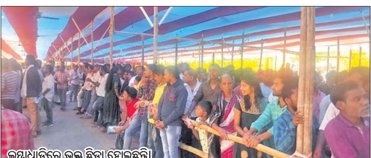
ଲକ୍ଷ୍ୟଧିକରେ ଭକ୍ତ ଛିଡ଼ା ହୋଇଛନ୍ତି।