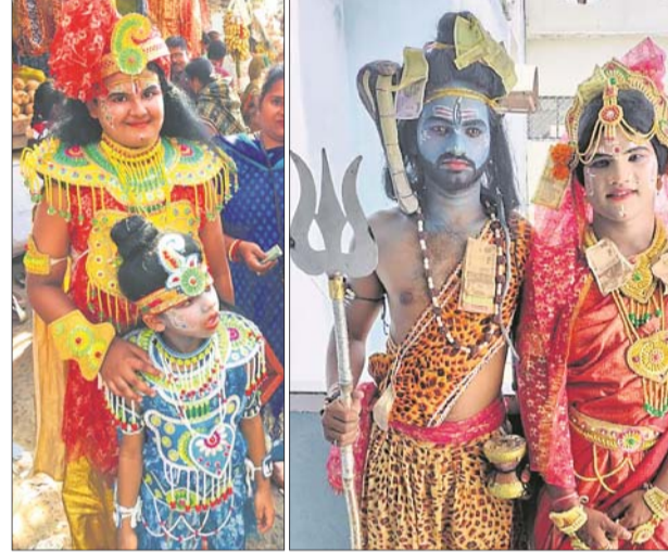
ବୃଷ୍ଟ ଓ ବଳରାମ ଦେଶ । ଶିବ ଓ ପାର୍ବତୀ ଦେଶ ।