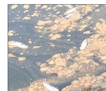
ନଦୀରେ ଭାସୁଥିବା ମଲାମାଛ।

ଗଞ୍ଜାମ, ୧୪୪୪ (ଡି.ଏନ୍.ଏ.) ଗଞ୍ଜାମ ସହର ପୋତାଗଡ଼ସ୍ଥିତ ରକ୍ଷିକୂଳ୍ୟା ନଦୀରେ ହଜାର ହଜାର ସଂଖ୍ୟକ ମାଛ ମରିଯାଇଥିବା ଦେଖିବାକୁ ମିଳିଛି। ପ୍ରାୟ ୧୦୦୦ ମାଛ ମରିଯାଇଥିବା ଦେଖିବାକୁ ମିଳିଛି। ପ୍ରାୟ ୧୦୦୦ ମାଛ ମରିଯାଇଥିବା ଦେଖିବାକୁ ମିଳିଛି। ପ୍ରାୟ ୧୦୦୦ ମାଛ ମରିଯାଇଥିବା ଦେଖିବାକୁ ମିଳିଛି। ପ୍ରାୟ ୧୦୦୦ ମାଛ ମରିଯାଇଥିବା ଦେଖିବାକୁ ମିଳିଛି।