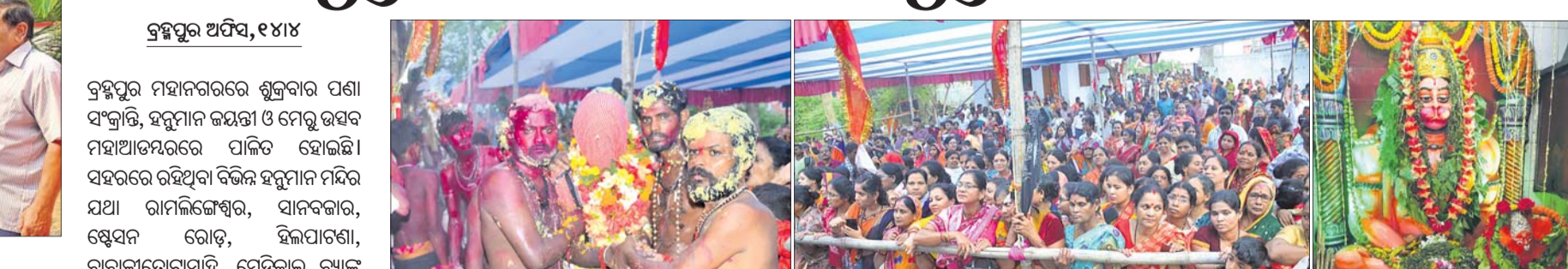
ପାଟ ଭୁକ୍ତ ମେରୁ କୁଣ୍ଡକୁ ନିଆଯାଇଛି । ମେରୁ ଉତ୍ସବ ଦେଖିବାକୁ ଲୋକଙ୍କ ଭିଡ଼ ।

ବ୍ରହ୍ମପୁର ଅପିଏ, ୧୪/୪ ବ୍ରହ୍ମପୁର ମହାନଗରରେ ଶୁକ୍ରବାର ପଣା ସଂକ୍ରାନ୍ତି, ହନୁମାନ ଜୟନ୍ତୀ ଓ ମେରୁ ଉତ୍ସବ ମହାଆତ୍ମସମର୍ପଣ ପାଳିତ ହୋଇଛି । ସହରରେ ରହିଥିବା ବିଭିନ୍ନ ହନୁମାନ ମନ୍ଦିର ଯଥା ରାମଲିଙ୍ଗେଶ୍ୱର, ସାନବଜାର, ଷ୍ଟେସନ ରୋଡ଼, ହିଲପାଟଣା, ବାବାଜୀଗୋପାସାହି, ମେଡିକାଲ ବ୍ୟାଙ୍କ କଲୋନା, ହିଲପାଟଣା ସିକ୍ ବିନାୟକ ପାଠ, ଗୋସାଇଁ ନୂଆଗାଁ, କଂଗ୍ରେସ ଅପିଏ ଛକ, ଶିଶୁଶିକ୍ଷକ, ଲାଞ୍ଜିପଲ୍ଲୀ ଓ ମାଞ୍ଜିଆପଲ୍ଲୀ ହନୁମାନ ମନ୍ଦିରରେ ଶତାଧିକ ଶ୍ରଦ୍ଧାଳୁଙ୍କ ଭିଡ଼ ଜମିଥିଲା । ପୂର୍ବାହ୍ନୁରେ ହନୁମାନଙ୍କ ସ୍ନାନ, ମାର୍ଜନା, ଆଳତୀ, ୧୦୮ ତୁଳସୀ ଅର୍ପଣ, ଷୋଡ଼ଶ ଉପଚାର କରାଯାଇଥିଲା । ଏଥିସହ ମନ୍ଦିର କୃତିକରେ ୧୦୮ ହନୁମାନ ଚାଳିଶା ପାଠ ହୋଇଥିଲା । ଭକ୍ତଙ୍କ ହନୁମାନ ଚାଳିଶା ପାଠ ନିମନ୍ତେ ସ୍ୱତନ୍ତ୍ର ବ୍ୟବସ୍ଥା ଓ ଜନାର୍ଚ୍ଚନା ଦାଣ୍ଡ ପୂଜା କାର୍ଯ୍ୟ ପରିଚାଳନା କରିଥିଲେ । ସେହିଭଳି ସହରର ବିକିପୁର, ପାଟାକେଶ୍ୱର, ଗୋସାଇଁ ନୂଆଗାଁ, ନୂଆ ବସଷ୍ଟାଣ୍ଡ, ପାଣିଗ୍ରାହୀ ପେଣ୍ଠା, ବ୍ରଜନଗର, ଆମପୁଆ ଅଞ୍ଚଳରେ ରହିଥିବା କାଳୀ ମନ୍ଦିର କୃତିକରେ ମେରୁ ଉତ୍ସବ ପାଳିତ ହୋଇଥିଲା । ଏହି ଅବସରରେ ଦକ୍ଷୁଆଳ ସ୍ତ୍ରୀରା ଅପାରାହ୍ନୁରେ ମନ୍ଦିର ସମ୍ମୁଖରେ ଧୂଳି ଦଖ୍ତ ହୋଇଥିଲା । ଏହାପରେ ପାଣି ଦଖ୍ତ ଅନୁଷ୍ଠିତ ହୋଇଥିଲା । ପରେ ଦୀର୍ଘ ୧୩ ଦିନ ଜ୍ୟା ୨୧ ଦିନ ଧରି ମୁଖ୍ୟ ମନ୍ଦିର ମଧ୍ୟରେ ନିଷ୍ଠା ସହକାରେ ରହିଥିବା ପାଟ ଭୁକ୍ତ ମେରୁ କୁଣ୍ଡରେ ଝୁଲି ଯାଇଥିଲା । ହୁଳହୁଳି, ବାଦ୍ୟ ଯନ୍ତ୍ରରେ ସମଗ୍ର ପରିବେଶ ଏକ ଭକ୍ତିମୟ ପରିବେଶ ସୃଷ୍ଟି ହୋଇଥିଲା । ମେରୁ ଉତ୍ସବ ଦେଖିବା ପାଇଁ ସହରର ବ୍ୟାପକ ଭକ୍ତଙ୍କ ସମାଗମ ହୋଇଥିଲା । ସନ୍ଧ୍ୟାରେ ମେରୁ ଉତ୍ସବ ପାଳନ ହୋଇଥିବା କାଳୀ ମନ୍ଦିର କୃତିକରେ ଆଳତୀ ସହ ବିଶେଷ ପୂଜାର୍ଚ୍ଚନା କରାଯାଇଥିଲା ।