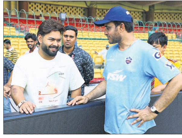
ବେଙ୍ଗାଲୁରୁରେ ଶୁକ୍ରବାର ଦିନା କ୍ୟାପିଟାଲ୍‌ର ଅଭ୍ୟାସ ଅବସରରେ ଅସ୍ତମ୍ଭ ରିଷ୍ଟା ପଟ୍ଟଙ୍କ ସହ ଆଲୋଚନା କରୁଛନ୍ତି ଦଳର କ୍ରିକେଟ ନିର୍ଦ୍ଦେଶକ ସୌରଭ ଗାଙ୍ଗୁଲି।