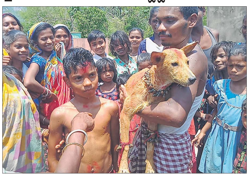
ଜଣେ ବାଳକକୁ କୁକୁର ସହ ବାହାଘର କରାଯାଇଛି ।