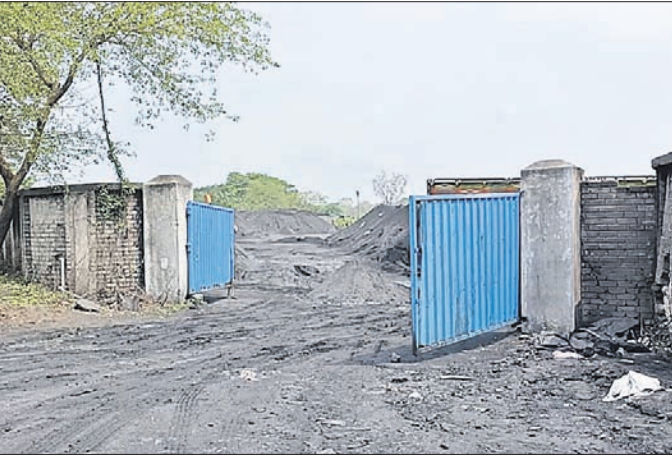
ଖସାରତୁଆ ମୌଜାରେ ଥିବା ଜୟ ଜଗନ୍ନାଥ କୋଳ ଲକ୍ଷ୍ଣୁ ।

କଳିଙ୍ଗନଗର ଶିଳ୍ପାଞ୍ଚଳର ମୁଖଶାଳା କୋରେଇ ବ୍ଲକ୍ ଅଧୀନସ୍ଥ ପଥରପଦା ପଞ୍ଚାୟତର ଖସାରତୁଆ ମୌଜାରେ ଥିବା ଜୟ ଜଗନ୍ନାଥ କୋଳ ଲକ୍ଷ୍ଣୁ କଳାଧୂଆଁ ସାଜି ଲୋକଙ୍କ ପାଇଁ ଖଳନାୟକ ସାଜିଛି। ଏହି କୋଳ ଲକ୍ଷ୍ଣୁ ଦୀର୍ଘ ବର୍ଷ ହେବ ଦିନା କାଗଜପତ୍ରରେ ଚାଲିଛି। ଏନେଇ ପ୍ରଭାବିତ ଲୋକେ ରାଜ୍ୟ ପ୍ରଦୂଷଣ ନିୟନ୍ତ୍ରଣ ବୋର୍ଡ(ଏସପିସିବି)ର କଳିଙ୍ଗନଗର ଆଞ୍ଚଳିକ ଅଧିକାରୀ ଏବଂ ଜିଲ୍ଲା ପ୍ରଶାସନ ନିକଟରେ ଅଭିଯୋଗ କରିଛନ୍ତି। ସୋମବାର ଅଞ୍ଚଳବାସୀ କୋରେଇ ଜନଶୁଣାଣୀରେ ମଧ୍ୟ ଜିଲ୍ଲାପାଳଙ୍କୁ ଦୃଷ୍ଟି ଆକର୍ଷଣ କରିଛନ୍ତି। ଅଭିଯୋଗ ଅନୁଯାୟୀ କେତେକ ପ୍ରଭାବଶାଳୀ ନେତାଙ୍କୁ ହାତ କରି ଲକ୍ଷ୍ଣୁ ମାଲିକ ପଥରପଦା ପଞ୍ଚାୟତ ଖସାରତୁଆ ମୌଜାର ଖାତା ନଂ.୯୪ ଏବଂ ପ୍ଲଟ ନଂ ୭୬, ୩୧୧, ୩୧୨, ୩୧୩, ୩୧୪, ୨୨/୫୭୫ ପାଖାପାଖି ୩୦ ଏକର ଜମିରେ କୋଇଲା ଡମ୍ପ କରି ରାଜ୍ୟ ବାହାରକୁ ଚାଳାଣ କରୁଛନ୍ତି।