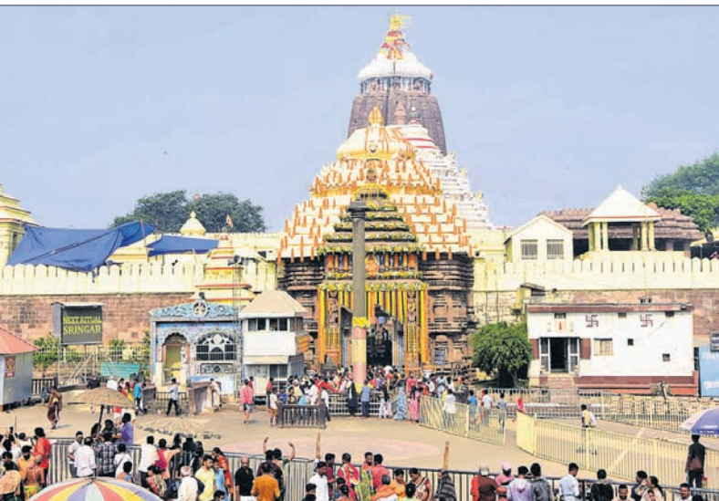
ମହାବିଷୁବ ସଂକ୍ରାନ୍ତି ଅବସରରେ ସୁସଜ୍ଜିତ ଶ୍ରୀମନ୍ଦିର ସମ୍ମୁଖରେ ଶ୍ରଦ୍ଧାଳଙ୍କ ଭିଡ଼।

ପୂଜା ଅଧିକାରୀ, ୧୪୪ ପବିତ୍ର ମହାବିଷୁବ ସଂକ୍ରାନ୍ତି ଅବସରରେ ଶୁକ୍ରବାର ଶ୍ରୀମନ୍ଦିରରେ ବିଶେଷ ନୀତି ଅନୁଷ୍ଠିତ ହୋଇଛି। ଏହି ଅବସରରେ ନୂତନ ପଞ୍ଜିକା ପଠନ ସହ ପ୍ରଚଳନ ହୋଇଛି। ମହାପ୍ରଭୁଙ୍କ ମଙ୍ଗଳ ଆଳତି, ଅବକାଶ ନୀତି ବଡ଼ ସକାଳ ଧୂପ ସରିବା ପରେ ପ୍ରଭୁ ହନୁମାନଙ୍କ ବିଗ୍ରହ ଦକ୍ଷିଣା ଘରୁ ଦି-ହାସନକୁ ବିକେ କରାଯାଇଥିଲା। ପାଳିଆ ପୂଜାପଣ୍ଡା ସାମନ୍ତ ମହାପ୍ରଭୁଙ୍କ ଶ୍ରୀଅଙ୍ଗଳାଗି ଅଧର ରୂପିତ ଗୋଟିଏ ଆଜ୍ଞାମାଳ ଏବଂ ଅନ୍ୟ ଏକ ମାଳ ଆଣି ହନୁମାନଙ୍କୁ ଦେଇଥିଲେ। ଏହାପରେ ବିମାନକୁ ହନୁମାନ ବିକେ ହୋଇଥିଲେ। ଶ୍ରୀମନ୍ଦିର ଚାରିଦିଗରେ ଥିବା ମହାବୀର ଓ ବୀରଭାଇ ହନୁମାନ ଏବଂ ଶ୍ରୀମନ୍ଦିର ପରିସରସ୍ଥ ସମସ୍ତ ହନୁମାନଙ୍କୁ ପୂଜାପଣ୍ଡା ଆଜ୍ଞାମାଳ ଦେବା ପରେ ଘଣ୍ଟା, ଛତା, କାହାଳୀ ପଦ୍ମଆରରେ ଜଗନ୍ନାଥବଳଭଦ୍ର ମଠକୁ ଏହି ଆଜ୍ଞାମାଳ ବିକେ କରାଯାଇଥିଲା। ପ୍ରଥମେ ମହାବୀର ଓ ଶେଷରେ ଚକ୍ରପାଟି ଗୋଡ଼ସ୍ଥିତ ବେଡ଼ି ହନୁମାନ ତଥା ଦରିଆ ମହାବୀରଙ୍କ ନିକଟକୁ 'ଆଜ୍ଞାମାଳ' ଯାଇଥିଲା। ଅନ୍ୟ ପକ୍ଷରେ ଶ୍ରୀମନ୍ଦିରରେ ପୂର୍ବରୁ ଆଜ୍ଞାମାଳ ପାଳ ପାଳିକିରେ ବିକେ ଥିବା ହନୁମାନଙ୍କ ପ୍ରତିମୂର୍ତ୍ତି ଜଗନ୍ନାଥ ବଳଭଦ୍ର ବିକେ କରିଥିଲେ। ସେଠାରେ ନୀତି ଅନୁଷ୍ଠିତ ହୋଇଥିଲା। ମଠରେ