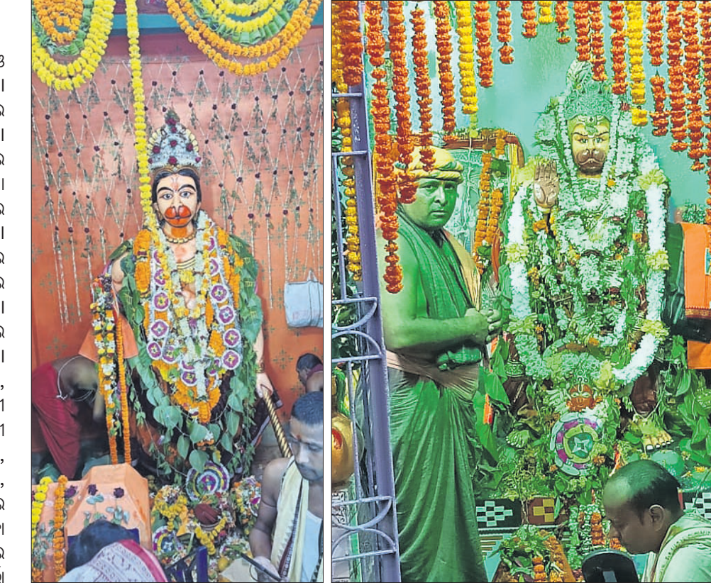
ଯାଜପୁର ସହରରେ ହନୁମାନଙ୍କ ପୂଜାର୍ଚ୍ଚନା ଚାଲିଛି।

ଯାଜପୁର ସହରରେ ହନୁମାନ ଜୟନ୍ତୀ ଓ ମହାବିଷୁବ ସଂକ୍ରାନ୍ତି ପାଳିତ ହୋଇଯାଇଛି। ଓଡ଼ିଆ ନବବର୍ଷ ସହ ପଣାସଂକ୍ରାନ୍ତି ଘରେ ଘରେ ପାଳନ କରିଛନ୍ତି ଯାଜପୁରବାସୀ। ଓଡ଼ିଆ ସଂସ୍କୃତି ଓ ପରମ୍ପରା ଅନୁସାରେ ପ୍ରତ୍ୟେକ ଘରେ ମହିଳାମାନେ ସକାଳୁ ପଣା ଧରି ମା' ବୃନ୍ଦାବତୀଙ୍କୁ ଅର୍ପଣ କରିବା ପରେ ବିଭିନ୍ନ ଦେବଦେବୀଙ୍କୁ ପୂଜାଲାଗି କରିଥିଲେ। ସେହିପରି ସହରର ବିଭିନ୍ନ ଛକ ବଜାରରେ ଅବସ୍ଥିତ ମହାବୀରଙ୍କ ପ୍ରତିମୂର୍ତ୍ତିଠାରେ ପୂଜାର୍ଚ୍ଚନା ହେଉଥିବା ଦେଖିବାକୁ ମିଳିଥିଲା। ଶ୍ରଦ୍ଧାଳୁ ବହୁ ସଂଖ୍ୟାରେ ଯୋଗଦେଇ ପୂଜାର୍ଚ୍ଚନାରେ ସାମିଲ ହୋଇଥିଲେ। ଯାଜପୁର ସହରର ରକ୍ଷାକାଳୀ ଜିନାସିୟମ, ମହାବୀର ଜିନାସିୟମ, ସରକାରୀ ବସଷ୍ଟାଣ୍ଡ (ଡେମ୍ଫସ୍), ହରପାର୍ବତୀ ଛକ, ରାଶିରାମଚନ୍ଦ୍ରପୁର, ରାଉତରାପୁର, ସରସ୍ୱତୀ, ବିରଜା ହାଟ, ଯାଜ୍ଞବଲ୍ଲଭ, କୁଆଁସରପୁର ଆଦି ହନୁମାନ ମନ୍ଦିରରେ ଭିଡ଼ ପରିଲକ୍ଷିତ ହୋଇଥିଲା। ବିରଜା ଜଳଛତ୍ର ଖୋଲାଯାଇଛି। ଜଳଛତ୍ର ବ୍ୟବସ୍ଥା ୱେବସାଇଟ୍ ଉପରେ ଗୋଟିଏ ବୋଲି ଚତ୍ତାବଧାନରେ ଜାଗା ଛକଠାରେ ଅନୁଷ୍ଠାନଗୁଡ଼ିକପକ୍ଷରୁ ସୁରକ୍ଷା ଦିଆଯାଇଛି।