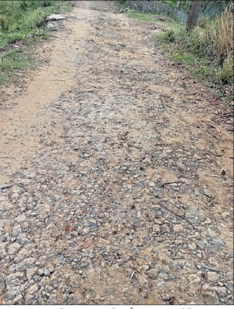
ଗ୍ରାମ୍ୟ ଭଳୟନ ବିଭାଗ ରାସ୍ତା ବିପର୍ଯ୍ୟୟ ହୋଇପଡିଛି ।

ବିଷ୍ଣୁରପୁର ବ୍ଲକ୍ ଅଧୀନ ଫଳପୁର ଆଡ଼ି ରାସ୍ତାଠାରୁ ଅଣ୍ଟାଲୋ ଓ ବକଭଦ୍ରପୁର ପର୍ଯ୍ୟନ୍ତ ଗ୍ରାମ୍ୟ ଭଳୟନ ବିଭାଗ ରାସ୍ତା ମରଣଯନ୍ତ୍ର ପାଲଟିଛି। ଏହି ରାସ୍ତାର ଦୂରବସ୍ତା ଜଣେ ନ ଦେଖିଲେ ବିଶ୍ୱାସ କରିପାରିବେନାହିଁ। ରାସ୍ତା ଏଭଳି ଜରାଜୀର୍ଣ୍ଣ ହୋଇପଡିଛି ଯେ, ଲୋକେ ଚାଲିକି ଗଲେ ବି ଖଣ୍ଡିଆ ଖାବରା ହେଉଛନ୍ତି। ପ୍ରତିଦିନ ଗାଡ଼ିମୋଟର ଦୁର୍ଘଟଣା ହେଉଛି। ଏହା ଏକ ଅଶରଣୀୟ ରାସ୍ତା। ଏବେ ଗାଁକୁ ପାନାୟ ଜଳ ପ୍ରକଳ୍ପ ପାଇଁ ପାଇବୁ ବିଛା ଯାଉଥିବାରୁ କଂକ୍ରିଟ୍ ରାସ୍ତାକୁ ଠିକାଦାର ଭାଙ୍ଗି ନଷ୍ଟ କରିଦେଇଛନ୍ତି। ଫଳରେ ଏହି ଗ୍ରାମରେ ବସବାସ କରୁଥିବା ବୁଲୁ ଶହରୁ ଅଧିକ ପରିବାର ଗମନାଗମନ କ୍ଷେତ୍ରରେ ନାହିଁ ନ ଥିବା ଅସୁବିଧାର ସମ୍ମୁଖୀନ ହେଉଛନ୍ତି। ଛୋଟ ପିଲାମାନେ ବୁର୍ଦ୍ଧାଗଣ ଭୟରେ ସ୍କୁଲକୁ ଯିବା ବନ୍ଦ କରିଦେଇଛନ୍ତି। ଗମନାଗମନ ବିକଳ ରାସ୍ତା ନ ଥିବାରୁ