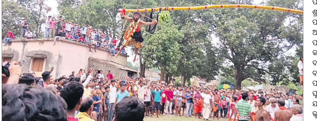
ପାଟଣରା ପର୍ବରେ ପିଠେଇ କଣ୍ଠା ଲଗାଇ ଜଣେ ଦଣ୍ଡୁଆ ଉପରେ ଉଡ଼ୁଛନ୍ତି। ଦେଖିବାକୁ ଲୋକ ଗହଳି।

କୃଷିଲୋ ହରିପୁରୁଷିପାଟଣା ଓ ପାଣ୍ଡୁସାହୁପାଟଣା ତିଆରି ସମ୍ପ୍ରଦାୟର ପାଳିତ ହେଉଥିବା ପାଟଣରା ପର୍ବର ପରମ୍ପରା ନିଆରା। ଚୈତ୍ରମାସରେ ପାଳିତ ହେଉଥିବା ଦଶପାତ୍ରାରେ ଭକ୍ତମାନେ ଅଥବା ମାନସିକଧାରୀମାନେ ବେକରେ ପଇତା ପକାଇ ଆମିଷଠାରୁ ଦୂରରେ ରହୁଥିବା ବେଳେ ମା'ମଙ୍ଗଳାଙ୍କୁ ମଦ ଓ ଅଣ୍ଡା ଭୋଗ ଲାଗି ହୋଇଥାଏ। ଏପରି ଏକ ଭିନ୍ନ ପରମ୍ପରା ଶୁକ୍ରବାର ବିଷୁବ ସଂକ୍ରାନ୍ତି ଉପଲକ୍ଷେ ଖଣ୍ଡପଡ଼ା ବ୍ଲକ୍ ଅନ୍ତର୍ଗତ ଭୋଳମରା, କୁସାରପଡ଼ା, କୃଷିଲୋ ପାଣ୍ଡୁସାହୁପାଟଣା ତିଆରିସାହି ଓ ପାଣ୍ଡୁସାହୁପାଟଣା ପାଟଣରା ଉତ୍ସବରେ ଦେଖିବାକୁ ମିଳିଥିଲା। ହଜାର ହଜାର ଦର୍ଶକ ସମାଗମ ହୋଇ ଏହି ପର୍ବକୁ ଉପଭୋଗ କରିଥିଲେ। ରଡ଼ ନିଆଁରେ ଚାଲିବା, କଣ୍ଠା ଶେଯରେ ଗଡ଼ିବା ଓ ପିଠେଇ କଣ୍ଠା ଫୋଡ଼ି ଅରଚରେ ଓହଳିବା ପରି ସାଧନାକୁ କେହି ଅଧିକ ବିଶ୍ୱାସ ବା କୁତୁହଳ ସାଧନା ବୋଲି କହିପାରନ୍ତି। ମାତ୍ର ଏହି ଦଶକୁ ସିଦ୍ଧି ଚରମ ପଇତା ବୋଲି ବାଛି ନେଇଛନ୍ତି ଦଶକ୍ର ପାଣ୍ଡୁସାହୁପାଟଣା ଅନେକ ଭକ୍ତମାନେ। ବୋଲି ପୂର୍ଣ୍ଣମାଠାରୁ ଆରମ୍ଭ ହୋଇଥାଏ