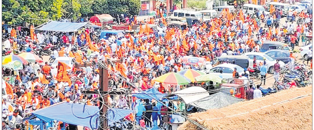
କେନ୍ଦ୍ରାପଡ଼ା ସହରରେ ହିନ୍ଦୁ ଏକତା ସମ୍ମେଳନା ବାହାରିଥିବା ଶୋଭାଯାତ୍ରା ।

ହଜାରରୁ ଉର୍ଦ୍ଧ୍ୱ ହେଉଛନ୍ତି ଗାଧଜମି । କୁମ୍ଭାର ସମୟରେ କୁମ୍ଭାର ଭୟରେ ଅପେକ୍ଷା କରିବାକୁ ପଡ଼େ । କୁମ୍ଭାର ଛାଡ଼ିବା ପରେ ଯାତାୟତ ସ୍ୱଭାବିକ ହୋଇଥାଏ । ଅଜ୍ଞାନ ଦୁନିଆରେ ଯୁବପିଢ଼ି ଗାଧ କାର୍ଯ୍ୟରୁ ଅଧିକ ମହିଳା ଗାଧ କରୁଥିବାରୁ ଗାଧକୁ ଗାଧା ଭରସା କରିଥାନ୍ତି । ମହିଳାମାନଙ୍କ ଇଚ୍ଛା ଶକ୍ତିକୁ ଦେଖି ସରକାରଙ୍କ ପକ୍ଷରୁ ପ୍ରୋତ୍ସାହନ ସ୍ୱରୂପ ଗାଧ କାର୍ଯ୍ୟ ପାଇଁ ସମସ୍ତ ସରକାରୀ ସଂସ୍ଥାକୁ ନିର୍ଦ୍ଦେଶ ଦିଆଯାଇଛି । ହେଲେ ପୋଲି ନ ଥିବାରୁ ଯନ୍ତ୍ରାଂଶୁଗୁଡ଼ିକ ଗାଧଜମି ପର୍ଯ୍ୟନ୍ତ ପହଞ୍ଚି ପାରୁ ନାହିଁ ବୋଲି ମହିଳା