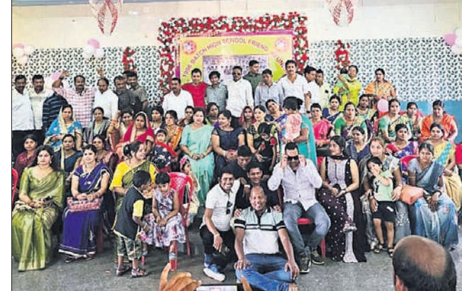
ବନ୍ଧୁନିକନରେ ସାମିଲ ହୋଇଥିବା ପୁରାତନ ଛାତ୍ରାଛାତ୍ରୀ ।