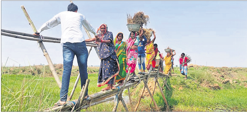
ଚଢ଼େଇଖୁଆ ନାଳ ଉପରେ ଥିବା ବାଉଁଶ ଚାରରେ ଲୋକେ ଜମିକୁ ଯାଉଛନ୍ତି ।

ରାଜକନିକା ବ୍ଲକ୍ ପେଟରପଡ଼ା ପଞ୍ଚାୟତ ବଳିଭଣ୍ଡା ଗାଁ ପାଖ ଗାଧ ଜମିକୁ ଲାଗି ଥିବା ବୈତରଣୀ ନଦୀର ଶାଖା ଚଢ଼େଇଖୁଆ ନାଳ । ଗ୍ରାମବାସୀ ଏହି ନାଳ ପାରି ହୋଇ ଗାଧ କରିବାକୁ କ୍ଷେତକୁ ଯାଇଥାନ୍ତି । ନାଳ ଉପରେ ପ୍ରଶାସନ ପକ୍ଷରୁ କଲକର୍ତ୍ତ କି ପୋଲିଟିଏ କରାଯାଇନାହିଁ । ଗ୍ରାମବାସୀଙ୍କ ସହାୟତାରେ ଏକ ବାଉଁଶ ଚାର ନିର୍ମାଣ କରି ଗାଧ ପାଇଁ ଯାତାୟତ କରିଥାନ୍ତି । ଏ ବାବଦରେ ଅନେକ ଥର ପ୍ରଶାସନକୁ ଗୁହାରି କରାଯାଇଥିଲେ ମଧ୍ୟ ପ୍ରଶାସନ କର୍ତ୍ତୃପାତ କିଛି ନ ଥିବା ଅଭିଯୋଗ ହୋଇଛି । ବଳିଭଣ୍ଡା ଗାଁ ଲୋକଙ୍କ କହିବା ଅନୁସାରେ, ଜମିରେ ଗାଧ କରି ଜାତିକା ନିର୍ବାହ କରୁଛନ୍ତି । ଏହି ଗାଧରୁ ପିଲାଙ୍କ ପାଠପଢ଼ା, ଘର ଖର୍ଚ୍ଚ, ଔଷଧ, ଜାନିଆଡ଼ା, ଭଲମନ୍ଦାଠୁ ଆରମ୍ଭ କରି ସମସ୍ତ ଖର୍ଚ୍ଚ କରିଥାନ୍ତି । ହେଲେ ଏକ ବିଲକୁ ଗାଧ କାର୍ଯ୍ୟ ପାଇଁ ଯିବାକୁ ହେଲେ