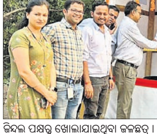
ଜିନ୍ଦଗି ପକ୍ଷରୁ ଖୋଲାଯାଇଥିବା ଜଳଛତ୍ର ।