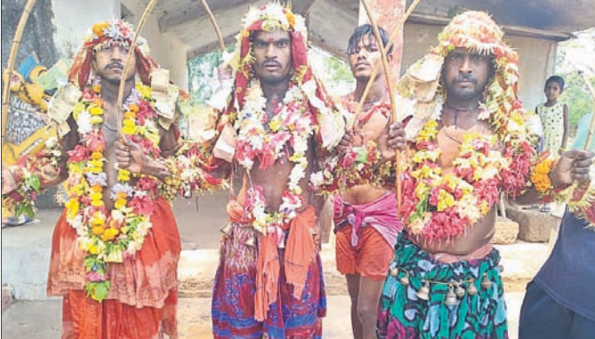
ଚଣ୍ଡେଶ୍ୱରୀ ପାଠରେ ୩ ଭକତା ଦେହରେ ପାଟକଣ୍ଠା ଫୋଡ଼ି ସହର ପରିକ୍ରମା କରୁଛନ୍ତି।

ଓ ମାନସିକ କରିଥିବା କେତେଜଣ ଭକ୍ତଙ୍କ ସହ ଛୋଟ ଛୋଟ ପିଲାମାନେ ଏହି ନିଆଁଗାଡ଼ରେ ଚାଲିଥିଲେ। ଏହି ଗାଡ଼ ୨୧ ହାତରୁ ଆରମ୍ଭ ହୋଇ ୩୧ ହାତ ପର୍ଯ୍ୟନ୍ତ କରାଯାଇଥିଲା। ଏହା ଦେଖିବା ପାଇଁ କାମନା ଘରଗୁଡ଼ିକରେ ହଜାର ହଜାର ଭକ୍ତଙ୍କର ସମାଗମ ହୋଇଥିଲା। ମଧ୍ୟାହ୍ନରେ ରଣପୁର ଚଣ୍ଡେଶ୍ୱରୀ ଠାକୁରଙ୍କ ୩ ଜଣ ଭଗତା ପିଠିରେ ପାଟକଣ୍ଠା ଫୋଡ଼ିହୋଇ ରଣପୁର ସହର ସାହି ପରିକ୍ରମା କରିଥିଲେ। ଏହି ଦୃଶ୍ୟ ଦେଖିବାକୁ ପ୍ରବଳ ଖରା ସତ୍ତ୍ୱେ ନିହାଳନାକୁ ପୁରୁଷ୍କାରେ ରାସ୍ତାରେ ଠିଆହୋଇ ରହିଥିଲେ।