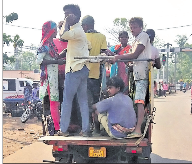
ଶ୍ରମିକମାନଙ୍କୁ ଡାଲା ଅଟୋରେ ନିଆଯାଉଛି ।

ଦିନକୁ ଦିନ କଳିଙ୍ଗନଗର ଶିଳ୍ପାଞ୍ଚଳର ମୁଖଶାଳା ବ୍ୟାସନଗର ଜନଗହଳିବୃଦ୍ଧି ହୋଇଚାଲିଛି। ଆବଶ୍ୟକତାଠାରୁ ଏଠାରେ ଅଧିକ ଲୋକ ବସବାସ କରୁଥିବାବେଳେ ଏହି ଲୋକଙ୍କ ବିଭିନ୍ନ ଆବଶ୍ୟକତା ପୂରଣ କରିବାରେ ବ୍ୟାସନଗର ପୌର ପ୍ରଶାସନ ଏକପ୍ରକାର କାର୍ପଣୀତା ଦେଖାଉଛି। ଯାହାର କୃଳତ୍ୱ ଉଦାହରଣ ହେଉଛି ସହରରେ ପରିବହନ ବ୍ୟବସ୍ଥା। ସହରରେ ହେଉଥିବା ବିଭିନ୍ନ ନିର୍ମାଣ କାର୍ଯ୍ୟସ୍ଥଳ ଓ ଶିଳ୍ପାଞ୍ଚଳକୁ ଶ୍ରମିକମାନଙ୍କୁ ବିପଦମୁକ୍ତ ଭାବେ ମାଲବାହୀ ଗାଡ଼ିରେ ପରିବହନ