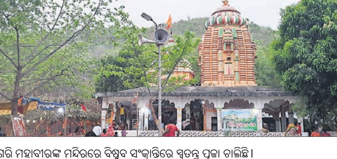
ଗରି ମହାବୀରଙ୍କ ମନ୍ଦିରରେ ବିଷୁବ ସଂକ୍ରାନ୍ତିରେ ସ୍ୱତନ୍ତ୍ର ପୂଜା ଚାଲିଛି।

ପଥରଚକଟା ନୂଆସାହିସ୍ଥିତ ହନୁମାନ ଜାଉଙ୍କ ନୂତନ ବିଗ୍ରହ ପ୍ରତିଷ୍ଠା ଉତ୍ସବ ହୋଇଥିଲା। ମନ୍ଦିର ପରିସରରେ ଦିବସ ଅନୁଷ୍ଠିତ ହୋଇଯାଇଛି। ଗ୍ରାମବାସୀଙ୍କ ସହଯୋଗରେ ଆୟୋଜିତ କାର୍ଯ୍ୟକ୍ରମରେ ଆଖପାଖ ଅଞ୍ଚଳରୁ ବହୁ ବ୍ୟକ୍ତି ଯୋଗ ଦେଇଥିଲେ। ଏ ଅବସରରେ ଗୁରୁବାର କଳସ ଶୋଭାଯାତ୍ରା ଗ୍ରାମ ପରିକ୍ରମା ସହ ଆଖପାଖ ଅଞ୍ଚଳରୁ ଗ୍ରାମ ପରିକ୍ରମା କରି ମା' ମଙ୍ଗଳାଙ୍କ ଯାତ୍ରା ପଡ଼ିଆକୁ କାଳିଶିଙ୍କ ସହ ଆସି ପୂଜାର୍ଚ୍ଚନା ପରେ ୧୨୧ ଫୁଟ ଲମ୍ବର ଏକ ଖମ୍ବ ଗଢ଼ିବ ପ୍ରସ୍ତୁତ ହୋଇଥିବା ନିଆଁ ଗାଡ଼ ଉପରେ ଖାଲି ପାଦରେ ଚାଲିଥିଲେ।