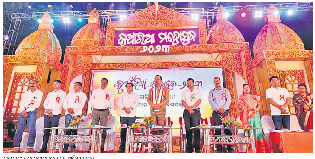
ଉତ୍ସବରେ ଯୋଗଦେଇଥିବା ଅତିଥି ବୃନ୍ଦ।