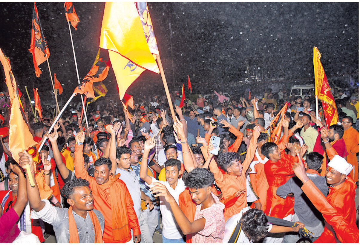
ସମ୍ବଲପୁର ଜିଲ୍ଲା ସ୍ୱଳ ଛକ ଦେଇ ଯାଉଥିବା ହନୁମାନ ଜୟନ୍ତୀ ଶୋଭାଯାତ୍ରା।