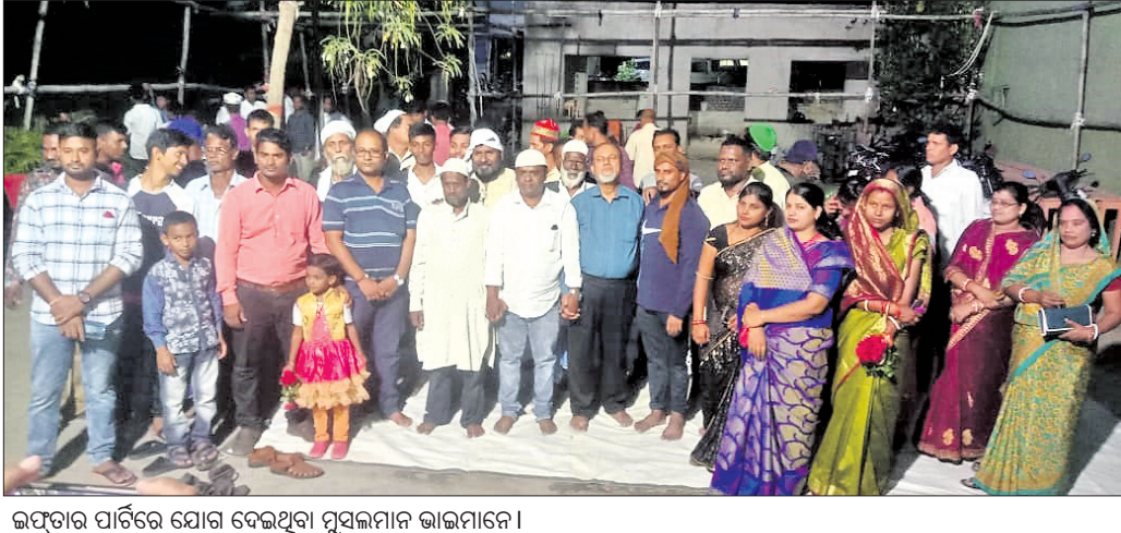
ଇଫତାର ପାର୍ଟିରେ ଯୋଗ ଦେଇଥିବା ମୁସଲମାନ ଭାଇମାନେ ।

କାର୍ଯ୍ୟାଳୟର ଅଧିକାରୀ ଏବଂ ଯାଜପୁର ରୋଡ୍ ପୋଲିସ୍ କେବଳ ବାଲକ ହେଲମେଟ୍ ଚେକ୍ କରି ଫାଇନ ଆଦାୟରେ ବ୍ୟସ୍ତ ରହୁଛନ୍ତି। ହେଲେ ଛୋଟ ଛୋଟ ପରିବହନ ଗାଡ଼ି ଅପୁରୁଷିତ ଭାବେ ଯାତ୍ରୀ ପରିବହନ କରୁଥିଲେ ମଧ୍ୟ ଅଧିକାରୀମାନେ ଏଥିପ୍ରତି ଦୃଷ୍ଟି ଦେଉନାହାନ୍ତି। ଫଳରେ ଏହାକୁ ନେଇ ସାଧାରଣରେ ଅସନ୍ତୋଷ ପ୍ରକାଶ ପାଇଛି। ଏପରିକି ରାତ୍ର ସମୟରେ ଅତ୍ୟନ୍ତ ବେଗରୁଆ ଭାବେ ଯାତ୍ରୀମାନେ ପରିବହନ ଗାଡ଼ିରେ ଯାଉଥିବା ଦେଖିବାକୁ ମିଳିଛି। ପରିବହନ ସମୟରେ କିଛି ଅଘଟଣ ଘଟିଲେ କିଏ ଦାୟୀ ରହିବ ତା'କୁ ନେଇ ବଡ଼ ପ୍ରଶ୍ନ ଛିଡ଼ା ହୋଇଛି। ତେଣୁ ଏ ଦିଗରେ ଯାଜପୁର ଆଞ୍ଚଳିକ ପରିବହନ ଅଧିକାରୀ ଏବଂ ଯାଜପୁର ଆରକ୍ଷା ଅଧୀକାରୀ ଦୃଷ୍ଟି ଦେବାକୁ ସାଧାରଣରେ ଦାବି ହେଉଛି।