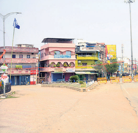
କର୍ମ୍ପ୍ୟ ଯୋଗୁ ଜିଲାସ୍କୁଲ ଛକ ଶୂନ୍ୟରେ ହୋଇପଡ଼ିଛି ।