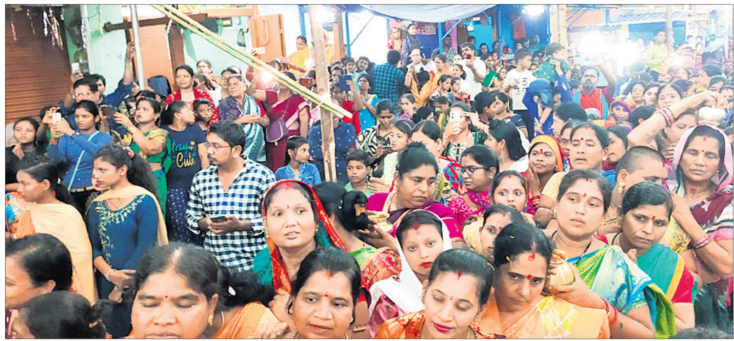
ମା'ଙ୍କୁ ଦର୍ଶନ କରିବା ପାଇଁ ଶ୍ରଦ୍ଧାଳୁଙ୍କ ଭିଡ଼ ।