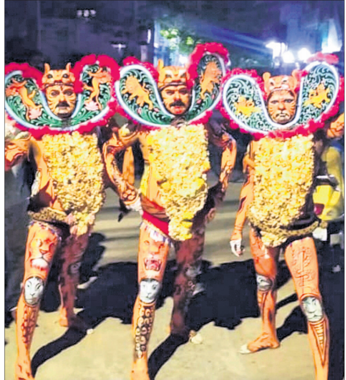
ବାଘ ବେଶରେ ନାଚ ।

ସାହି, ମଲାଶାନୀପେଟା, କାଞ୍ଜିବାରୀ ସାହି ପରିକ୍ରମା କରିଥିଲେ । ପରେ ଆବାମଜା ଲେନ ଦେଇ ବତ ବଜାର, ଚୌଡ଼ସାହି, ନଡ଼ିଆ ବଜାର ହୋଇ ଦେଶୀ ବେଶରେ ସାହି ସ୍ଥିତ ଅପ୍ପାୟା ମଣ୍ଡପରେ ମା'ଙ୍କ ପହଞ୍ଚିଥିଲେ । ଏହାପରେ ବହୁ ଶ୍ରଦ୍ଧାଳୁଙ୍କ ମା'ଙ୍କୁ ଦର୍ଶନ କରିଥିଲେ । ଅନ୍ୟପଟେ ଯାତ୍ରା ୧୨ ଦିନରେ ପହଞ୍ଚିଥିବା ବେଳେ ସ୍ଥାନୀୟ ଏସ୍‌ଏସ୍‌ଭିଟି ପଡ଼ିଆରେ ମାଳା ବଜାର ଆରମ୍ଭ ହୋଇଛି । ଠାକୁରାଣୀଙ୍କ ଦର୍ଶନ ପରେ ଛୋଟ ଶିଶୁଠାରୁ ଆରମ୍ଭ କରି ବୟସ୍କ ଯାଏଁ ସଭିଏଁ ମାଳା ବଜାରରେ ପଡ଼ିଥିବା ବୋଲି, ଖାଦ୍ୟ ସାମଗ୍ରୀ ଓ ଅନ୍ୟାନ୍ୟ ଘର ସାମଗ୍ରୀ କିଣି ଯାତ୍ରା ମଜା ଉଠାଉଛନ୍ତି ।