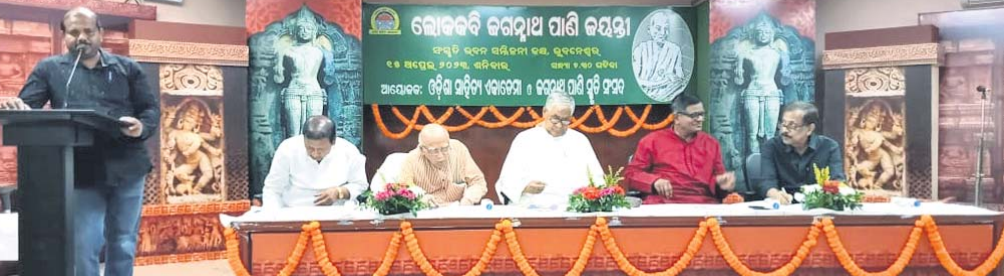
ଭୁବନେଶ୍ୱର, ୧୫୪୪(ଭୁବରୋ) ଲୋକକବିଙ୍କ ରାଜ୍ୟସ୍ୱରାୟ ଜୟନ୍ତୀ