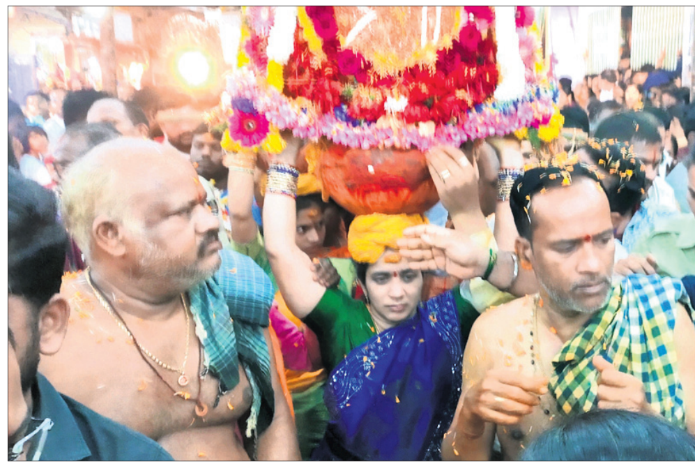
ମା' ବୁଢ଼ୀ ଠାକୁରାଣୀଙ୍କ ଘଟ ପରିକ୍ରମା ।