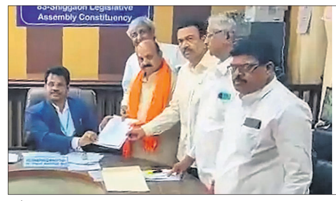
କର୍ନାଟକ ମୁଖ୍ୟମନ୍ତ୍ରୀ ବାସବରାଜ ବୋମାଳ ନାମାକନପତ୍ର ବାଖଲ କରୁଛନ୍ତି।

କର୍ନାଟକ ବିଧାନସଭା ନିର୍ବାଚନ ଲାଗି ଶାସକ ଭାଜପା ପକ୍ଷରୁ ପ୍ରଥମ ପର୍ଯ୍ୟାୟ ପ୍ରାର୍ଥୀ ତାଲିକା ଘୋଷଣା ପରେ ଦଳ ଭିତରେ ଅସନ୍ତୋଷ ବୃଦ୍ଧି ପାଇଛି। ଦଳୀୟ ଚିନ୍ତକଙ୍କୁ ଏହାର କାରଣ ଅନେକ ଆଶା ଖୋଲା ବିଦ୍ରୋହର ଆହ୍ୱାନ ଦେଇଛନ୍ତି। କେତେକ ଚିନ୍ତକ ଆଶା ଖୋଲା ବିରୋଧୀ ଦଳ କଂଗ୍ରେସ୍ ଶିବିରରେ ଯୋଗ ଦେଇଥିବାବେଳେ ଅନ୍ୟ କେତେକ ଭାଜପାକୁ ଧକ୍କା ଦେବାକୁ ପଛଇଁନାହାନ୍ତି। ରାଜ୍ୟରେ ସରକାର ବିରୋଧୀ ହାତ୍ତା ବହୁଥିବାବେଳେ ଶାସକ ଦଳରେ ଅସନ୍ତୋଷ ଏବଂ ଅସନ୍ତୋଷ ଏହାକୁ ମୂଲ୍ୟ ଦେବାକୁ ପଡ଼ିପାରେ ବୋଲି ବିଶେଷଜ୍ଞମାନେ ମତ ଦେଇଛନ୍ତି। ୨୧୨ ଆସନ ବିଶିଷ୍ଟ କର୍ନାଟକ ବିଧାନସଭା ନିର୍ବାଚନରେ ୨୦୦ରୁ ୩୦ ଆସନରେ ଭାଜପାର ବିଦ୍ରୋହୀ ପ୍ରାର୍ଥୀ ପ୍ରତିଦ୍ୱନ୍ଦିତା କରିପାରନ୍ତି। ତେବେ ବିଦ୍ରୋହୀ ପ୍ରାର୍ଥୀ ୭୦୮ ଆସନରେ ସାମିତ ରହିବେ ବୋଲି ଦଳୀୟ ସୂତ୍ରରୁ ଜଣାଯାଇଛି। ହିମାଚଳ ପ୍ରଦେଶରେ ଗତ ନଭେମ୍ବରରେ ହୋଇଥିବା ନିର୍ବାଚନରେ ୨୧ ଆସନରେ ବିଦ୍ରୋହୀ ପ୍ରାର୍ଥୀ ଲଢ଼ିଥିଲେ। କର୍ନାଟକରେ ଭାଜପା ପ୍ରଥମ