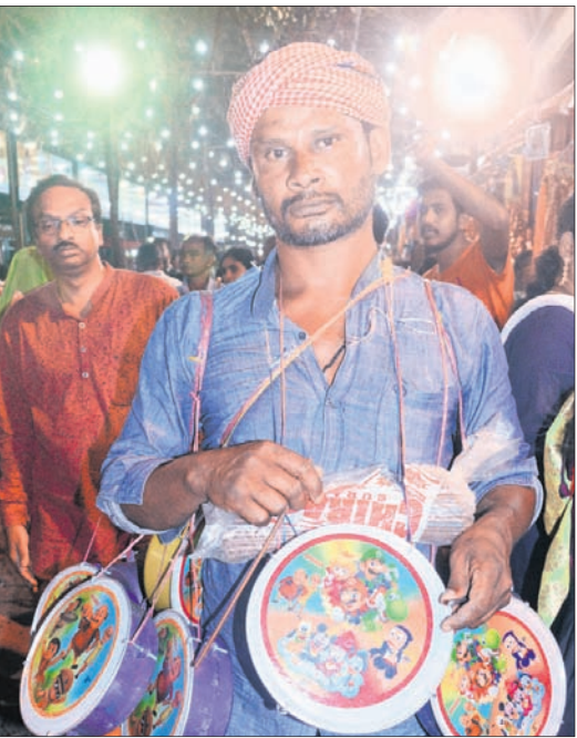
ଯାତ୍ରାରେ ବିକ୍ରି କରୁଥିବା ଷ୍ଟେଲନା ବ୍ୟବସାୟୀ ।