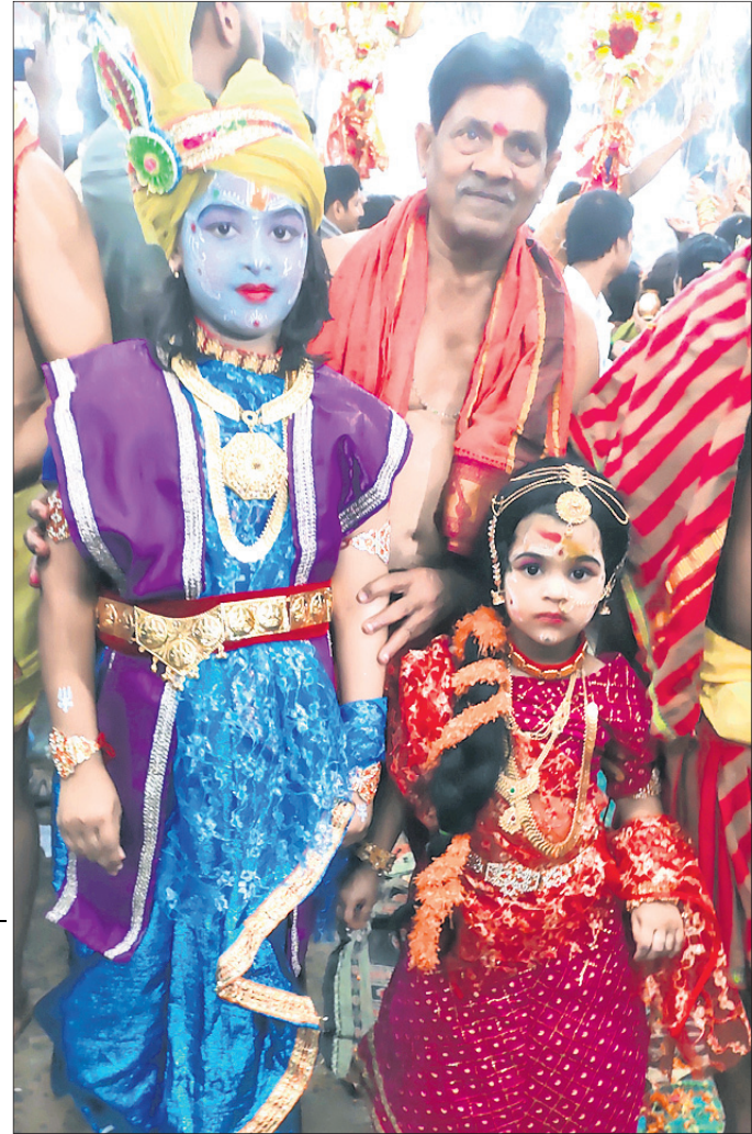
ଛୋଟ ଶିଶୁଙ୍କ କୃଷ୍ଣ ଓ ରାଧା ବେଶ ।