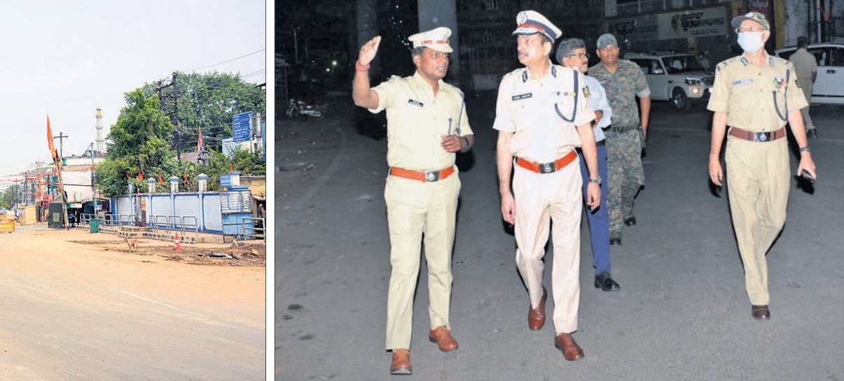
ସମ୍ବଲପୁର ଗୋଳବଦାର ଅଞ୍ଚଳ ଭୁଲି ଘିଡ଼ି ପରଖୁଛନ୍ତି ପୋଲିସ ଡିଭିସନର କର୍ମଚାରୀ ।