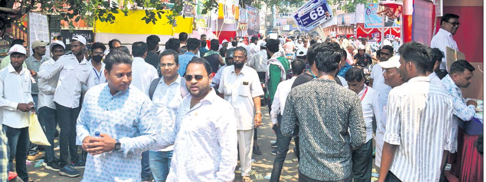
ରାଜ୍ୟ ବାର୍ କାଉନ୍ସିଲ୍ ନିର୍ବାଚନ ପାଇଁ କଟକ କଟକରେ ଗୋଟିଏ ଆଇନଜୀବୀଙ୍କ ସମ୍ମାନ ।