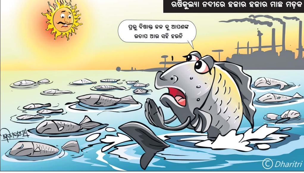
ଉଷିକୃତ୍ୟା ନଦୀରେ ହଜାର ହଜାର ମାଛ ମୃତ୍ୟୁ