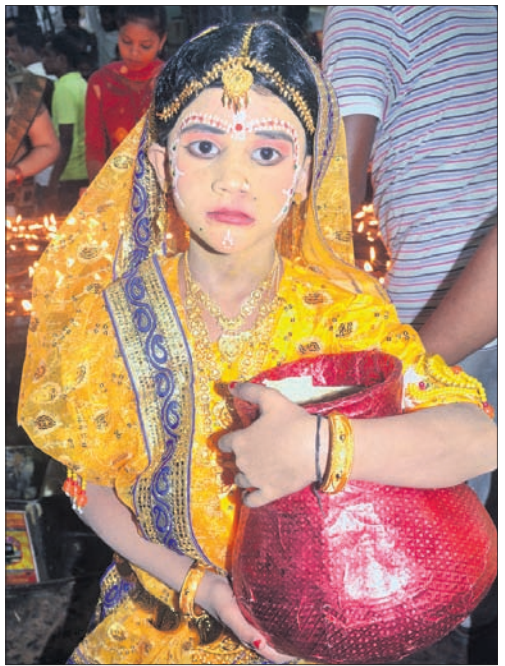
ରାଧା ବେଶରେ ଜଣେ ଶିଶୁ ।