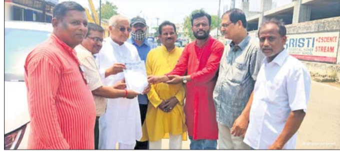
ଏଠି ପକ୍ଷରୁ ଏମ୍ପିଙ୍କୁ ଦାବିପତ୍ର ପ୍ରଦାନ କରାଯାଇଛି।

କୌଶଳରେ କୃଷି କାର୍ଯ୍ୟକ୍ରମ ଲାଗି ସରକାର କରାଯାଇପାରିବ। ଏହି ଜିଲ୍ଲାକୁ ମୁଖ୍ୟମନ୍ତ୍ରୀ ପ୍ରତିନିଧିତ୍ୱ କରୁଛନ୍ତି। ବିଧାନସଭା ବାଚସ୍ପତିକ ସମ୍ମେଳନ ଆଉ ବୁଲ୍‌ଭଗ ମନ୍ତ୍ରୀ ପଦ ପାଇଛନ୍ତି। ଏତଦବ୍ୟତୀତ ଶାସକ ଦଳର ଆଉ ୮ ବିଧାୟିକା ଓ ବିଧାୟକ ଅଛନ୍ତି। ସମସ୍ତେ ଏକାଠି ମୁଖ୍ୟମନ୍ତ୍ରୀଙ୍କୁ ଭେଟି କୃଷି ମହାବିଦ୍ୟାଳୟ ଗଢ଼ାଇବା ପାଇଁ ଗାପ ପକାଇ ନ ଥିବା ବିଭିନ୍ନ ଚାଷୀ ସଂଗଠନ ନେତାମାନେ ସମାଲୋଚନା କରୁଛନ୍ତି। ବିରୋଧୀ ଦଳ ନେତାମାନେ ମଧ୍ୟ ଏହି ପ୍ରସଙ୍ଗରେ ଟୁପ୍ ରହିଛନ୍ତି। ଅପରପକ୍ଷରେ ୨୦୨୧ ସେପ୍ଟେମ୍ବର ୧୫ରେ ଜିଲ୍ଲା ବିକେନ୍ଦ୍ର ପରିବର୍ତ୍ତନ କାର୍ଯ୍ୟକାରୀ ଛାତ୍ରାନ୍ତାପ୍ତ ପାଠ ପଢ଼ିବାର ସୁଯୋଗ ଦାବି ହେଉଛି। ତେବେ କାର୍ଯ୍ୟକାରୀ କରିବାରେ ଅବହେଳା ଅବ୍ୟାହତ ରହିଛି।