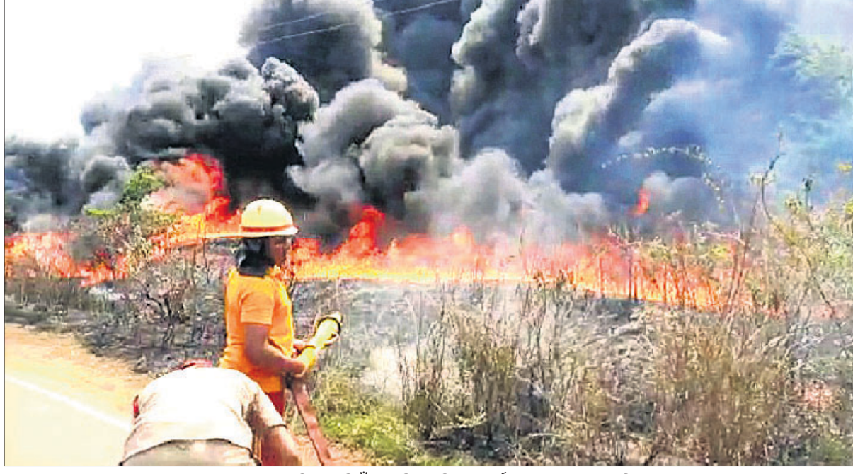
କ୍ୟାମ୍ପରେ ଲାଗିଥିବା ନିଆଁକୁ ଅଗ୍ନିଶମ ବିଭାଗ କର୍ମଚାରୀ ଆୟତ୍ତ କରୁଛନ୍ତି ।

ସଇଁତଳା, ୧୫୪୪ (ଡି.ଏନ.ଏ.) ସମ୍ବଲପୁର-ଚିଟିଲାଗଡ଼ ରେଳଲାନ୍ଦନ ଦୋହରାକରଣ କାର୍ଯ୍ୟ ନେଇଥିବା ଏଲିଆଣ୍ଟର କମ୍ପାନୀର ସଇଁତଳା ରେଳଷ୍ଟେଶନ ନିକଟ କ୍ୟାମ୍ପରେ ଶନିବାର ସକାଳେ ଅଗ୍ନିକାଣ୍ଡ ଘଟି ଲକ୍ଷ୍ୟାଧିକ ଟଙ୍କାର ପ୍ଲାଷ୍ଟିକ ସାମଗ୍ରୀ ଜଳିଯାଇଛି । ନିଆଁ ଅଧିକ ବ୍ୟାପିବା ପୂର୍ବରୁ ସଇଁତଳା ଓ ଦେଓଗାଁ ଅଗ୍ନିଶମ ବିଭାଗ ଘଟଣାସ୍ଥଳରେ ପହଞ୍ଚି ନିଆଁକୁ ଆୟତ୍ତ କରିଥିଲେ । ଅଗ୍ନିକାଣ୍ଡର କାରଣ ଜଣାପଡ଼ିନାହିଁ । ତେବେ ନିଆଁ ଲାଗିଥିବା ସମୟରେ ଟ୍ରେନ ଚଳାଚଳ ଦୀର୍ଘ ସମୟ ଧରି ବ୍ୟାହତ ହୋଇଥିଲା । ଅଗ୍ନିକାଣ୍ଡର ଫାଟୁଗ୍ରାଫି ଦେଖି କାମପଦର ଓ ସଇଁତଳାକୁ ସଂଯୋଗ କାମ ଏଲିଆଣ୍ଟର କମ୍ପାନୀ ତରଫରୁ ଚାଲିଥିଲା । ଏହି ସମୟରେ ସଇଁତଳା ରେଳଷ୍ଟେଶନ ନିକଟ ସିଲେଟପଡ଼ା ପାଖରେ କମ୍ପାନୀ ତାର ଏକ କ୍ୟାମ୍ପ କରି ସେଠାରେ ପ୍ଲାଷ୍ଟିକ କେନ୍ଦ୍ର ପାଇଁ, ବିସ୍କୁଇଁ ଚାର, ଲାଇଟ ଖମ୍ବ ସହ ବିଭିନ୍ନ ପ୍ରକାରର ପ୍ଲାଷ୍ଟିକ ସାମଗ୍ରୀ ରଖିଥିଲା । ରେଳଲାନ୍ଦନ ଦୋହରାକରଣ କାମ ସମାପ୍ତ ହୋଇଯାଇଥିବାବେଳେ ବଳି ଯାଇଥିବା ପ୍ଲାଷ୍ଟିକ ସାମଗ୍ରୀ କ୍ୟାମ୍ପରେ ହିଁ ପଡ଼ି ରହିଥିଲା । ଶନିବାର ସକାଳୁ କୋଣସି କାରଣରୁ ନିଆଁ ଲାଗି କ୍ୟାମ୍ପ ଜଳିବାକୁ ଲାଗିଥିଲା । ପଖରେ ଥିବା ସିଲେଟପଡ଼ା ଗ୍ରାମବାସୀ ତୁରନ୍ତ ସଇଁତଳା ଅଗ୍ନିଶମ ବିଭାଗକୁ ଖବର ଦେଇଥିଲେ ।