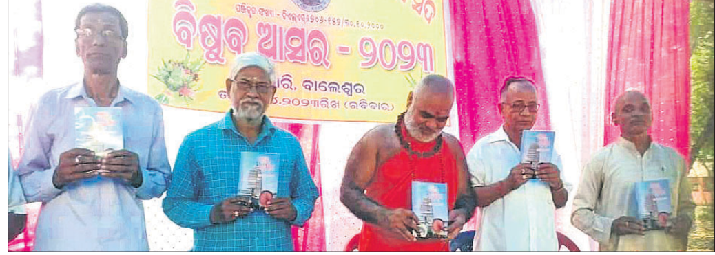
ସୁସ୍ୱଳ ପ୍ରକୃତ ରୁରୁ ମହିମା ସାମାଜିକ ଅଭିଯାନରେ ଉଦ୍ଘୋଷଣା କରୁଛନ୍ତି।