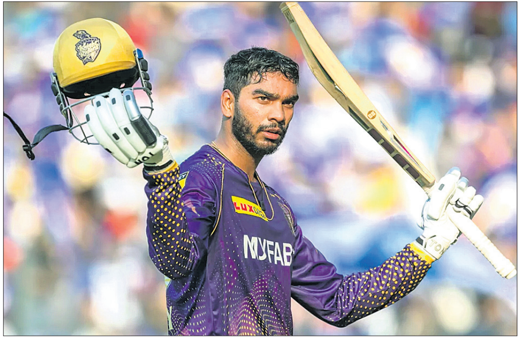
ଶତକ ହାସଲପରେ ଭେଙ୍ଗଟେଣ୍ଟ୍ ଆୟାତ୍।

ଭେଙ୍ଗଟେଣ୍ଟ୍ ଆୟାତ୍ କ୍ରୀଡ଼ା ଶତକ ସତ୍ତ୍ୱେ କୋଲକାତା ନାଟକ ରାଜତ୍ୱ ଉପରେ ଅନୁଷ୍ଠିତ ଇତିହାସ ପ୍ରତିଯୋଗିତା (ଆଇପିଏଲ) ମ୍ୟାଚରେ ପୁସ୍ତକ ଇତିହାସ ନିକଟରୁ ହାରି ଯାଇଛି। ନାଟକ ରାଜତ୍ୱ ୨୦ ଓକ୍ଟୋବରରେ ୬ ଉଲକେଟ ହରାଇ ୧୮୫ ରନ କରିଥିବାବେଳେ ପୁସ୍ତକ ୧୭.୪ ଓକ୍ଟୋବରରେ ୫ ଉଲକେଟ ହରାଇ ବିକିୟ ଲକ୍ଷ୍ୟ ସ୍ପର୍ଶ କରିଥିଲା। କୋଲକାତା ପରାସ୍ତ ହୋଇଥିଲେ ହେଁ ଶତକୀୟ ଇତିହାସ ପାଇଁ ଭେଙ୍ଗଟେଣ୍ଟ୍ ପୁସ୍ତକ ଅପ୍ ଦି ମ୍ୟାଚ ବିବେଚିତ କରାଯାଇଥିଲା। ଚଳିତ ଆଇପିଏଲରେ ପୁସ୍ତକର ଏହା ବିଭିନ୍ନ ଦିଗରେ ହୋଇଥିବାବେଳେ କୋଲକାତାର କୃତୀୟ ପରାସ୍ତ।