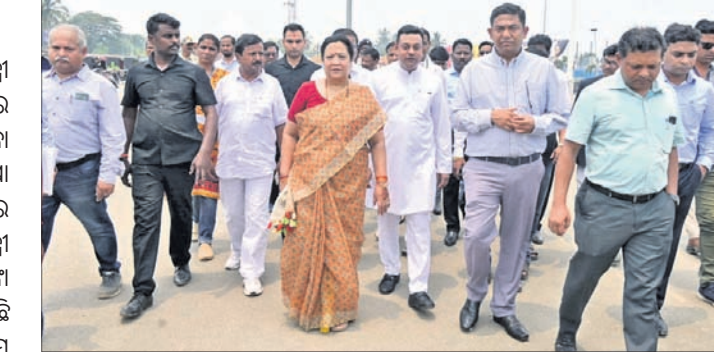
କେନ୍ଦ୍ର ରେଳ ଓ ବୟନ ଶିଳ୍ପ ରାଷ୍ଟ୍ରମନ୍ତ୍ରୀ ଦର୍ଶନା ଜର୍ଦେଶ୍ୱରୀ ପୁରୀ ରେଳଷ୍ଟେଶନ ନିରୀକ୍ଷଣ ଅବସରରେ ପ୍ରକଳ୍ପର ମତେଲ ଏବଂ ଫଟୋ ଦେଖୁଛନ୍ତି।

କେନ୍ଦ୍ର ରେଳ ଓ ବୟନ ଶିଳ୍ପ ରାଷ୍ଟ୍ରମନ୍ତ୍ରୀ ଦର୍ଶନା ଜର୍ଦେଶ୍ୱରୀ ପୁରୀ ଗସ୍ତରେ ଆସି ରେଳଷ୍ଟେଶନ ନିରୀକ୍ଷଣ କରିବା ସହିତ ପୁନର୍ବିକାଶ କାର୍ଯ୍ୟର ସମୀକ୍ଷା କରିଛନ୍ତି। ପୁରୀ ରେଳଷ୍ଟେଶନରେ ଶ୍ରୀମନ୍ଦିର ଛାପ ରହି ବୋଲି ମନ୍ତ୍ରୀ ପୂର୍ତ୍ତନା ଦେଖିଛନ୍ତି। ୧୬୧ କୋଟି ଟଙ୍କା ବ୍ୟୟରେ ଏହି ପୁନର୍ବିକାଶ କାର୍ଯ୍ୟ ହେଉଛି ଏବଂ ଆଗାମୀ ୧୭ ମାସ ମଧ୍ୟରେ କାମ ଶେଷ ହେବ ବୋଲି ଜର୍ଦେଶ୍ୱରୀ କହିଛନ୍ତି। ମନ୍ତ୍ରୀ ଜର୍ଦେଶ୍ୱରୀ ପୁରୀ ରେଳଷ୍ଟେଶନ ନିରୀକ୍ଷଣ ସମୟରେ ଯାତ୍ରୀଙ୍କ ମୌଳିକ ସୁବିଧା ତଥା ଆବଶ୍ୟକତା ଉପରେ ଗୁରୁତ୍ୱାରୋପ କରିଥିଲେ। ମୌଳିକ ସୁବିଧାକୁ ନେଇ ପ୍ରତିବର୍ଷ ବର୍ଷର ଯାତ୍ରୀ, ବିଶେଷତାରେ ଚାପିଯାତ୍ରୀ ଓ ପର୍ଯ୍ୟଟକଙ୍କୁ ସହାୟକ ହୋଇପାରିବ, ସେଥିପ୍ରତି ଧ୍ୟାନ