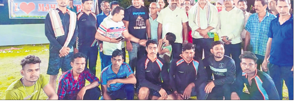
ଅତିଥିଙ୍କ ଗହଣରେ ଖେଳାଳି ଓ ଅନ୍ୟମାନେ।