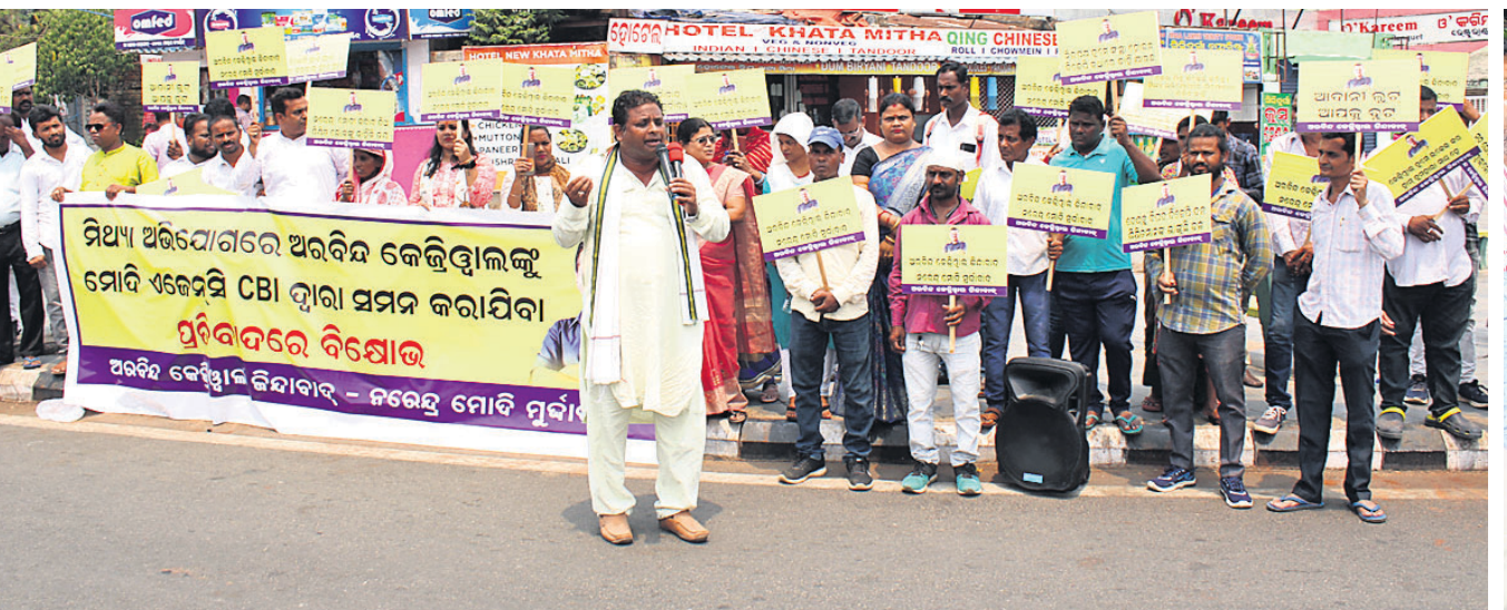
ଦିଲ୍ଲୀ ମୁଖ୍ୟମନ୍ତ୍ରୀ ଅରବିନ୍ଦ କେଜ୍ରିୱାଲଙ୍କୁ ମିଥ୍ୟା ମାମଲାରେ ସିବିଆଇ ସମନ ଘଟଣାକୁ ବିରୋଧ କରି ରବିବାର ଆଫ୍ କର୍ମକର୍ମୀମାନେ ଭୁବନେଶ୍ୱର ମାୟାକ୍ୟାଣ୍ଡିନ୍ ଛକରେ ବିକ୍ଷୋଭ ପ୍ରଦର୍ଶନ କରୁଛନ୍ତି।