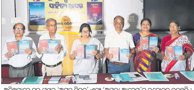
ଅତିଥିମାନେ ଦୁଇ ପୁସ୍ତକ 'ଅମୃତ ଚିନ୍ତନ' ଏବଂ 'ଅସରା ଆବେଗ'କୁ ଉନ୍ମୋଚନ କରୁଛନ୍ତି ।