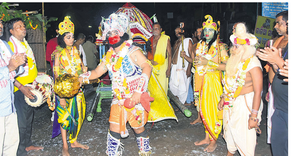
ପୁରୀ ସାହିଯାତ୍ରରେ ଶେଷ ପର୍ବରେ ଶନିବାର ରାତିରେ ଗୋଟିଏଟା ସାହି ପକ୍ଷରୁ ରାମାଭିଷେକ ନୀତି ଅବସରରେ ଭରତ ଓ ଶତ୍ରୁଘ୍ନ ମହାପ୍ରଭୁଙ୍କ କଠର ନେଇ ମାର୍କେଟ୍‌ସ୍ଟାଣ୍ଡ ଛାଡ଼ି ଯାଇଛନ୍ତି।