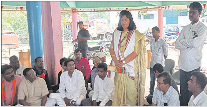
ବୈଠକରେ ଏମ୍ପି ଅପରାଜିତା ଷଡ଼ଙ୍ଗୀ ଉଦ୍‌ବୋଧନ ଦେଉଛନ୍ତି ।

ଓଡ଼ିଶାକୁ ବଡ଼ ଭୂମିକା ରହିଛି ବୋଲି ସେ କହିଥିଲେ । ଆଗାମୀ ଦିନରେ ଜୟଦେବ ନିର୍ବାଚନପଦ୍ଧତିରେ ଭାଗ୍ୟରେ ସଙ୍ଗଠନ ସୁଦୃଢ଼ ହେବ । ଆଗାମୀ ୨୦୨୭ ଚାନ୍ଦ୍ରରେ ଆସି ବଳୀୟ କର୍ମୀଙ୍କୁ ରୁପରୁ ବେଲକ୍ଷିତ ଭାବେ ଗ୍ରାମ ମା' ଉତ୍ତରପୁଖାଳ ପାଠ ସଭାରେ ଆୟୋଜିତ ପଞ୍ଚାୟତରାଜରୁ ରୁପ କମିଟି ବୈଠକରେ ସେ ଯୋଗ ଦେଇଥିଲେ । ଏହି ଅବସରରେ ସେ ରୁପ ସମସ୍ତ ଭୋଗରୁ ଯୋଗାଯୋଗ କରି ସେମାନଙ୍କୁ ସଶକ୍ତ କରିବା ଉପରେ ଦେଖିବାକୁ ପଡ଼ିଥିଲା । ଆଗାମୀ ଦିନରେ ରୁପରୁ ଯିବାପାଇଁ ନିର୍ବାଚନର ଯୁକ୍ତ ଆରମ୍ଭ ହେବ । ଏ ଦିନରେ ରୁପ କମିଟି