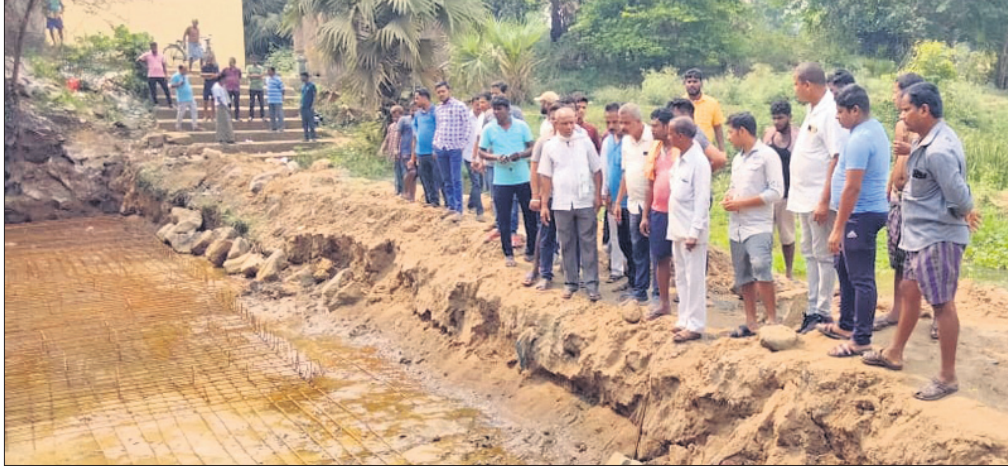
ସାଲେପୁର କଲଥା ପଞ୍ଚାୟତ, ଯାକପୁର ଜିଲ୍ଲା ବଡ଼ତଣା ବ୍ଲକ୍ରେ ଚେକ୍ ତ୍ୟାମ୍ ନିର୍ମାଣକୁ ବିରୋଧ କରୁଛନ୍ତି।

ଈତିଆ-ସାଲେପୁର ପୂର୍ବରାସ୍ତାର କଲଥା-ଚମ୍ପାପୁର ରେଳୁଟି ନଦୀ ପୋଲ ନିକଟରେ ଚେକ୍ ତ୍ୟାମ୍ ନିର୍ମାଣ କାର୍ଯ୍ୟକୁ ବିରୋଧ କରି ରବିବାର ଲୋକେ କାମ ବନ୍ଦ କରିଦେଇଛନ୍ତି। ମାହାଙ୍ଗା ବ୍ଲକ୍ କଲଥା ପଞ୍ଚାୟତ ଅନ୍ତର୍ଗତ ଆନନ୍ଦବଜାରଠାରେ ରେଳୁଟି ନଦୀର ପୋଲ ନିକଟରେ ବଡ଼ତଣା ପୂର୍ବ ବିଭାଗ ପକ୍ଷରୁ ୭୦ ଲକ୍ଷ ଟଙ୍କା ବ୍ୟୟବରାଦରେ ଚେକ୍ ତ୍ୟାମ୍ ନିର୍ମାଣ ହେଉଛି। ଏହାକୁ ପୋଲ ନିକଟରୁ ତଳୁଆ ଅଞ୍ଚଳରେ ବସାବ କରୁଥିବା କଲଥା ପଞ୍ଚାୟତ ଏବଂ ଯାକପୁର ଜିଲ୍ଲା ବଡ଼ତଣା ବ୍ଲକ୍ ଲୋକେ ପାଣି ପାଇଁ ନାନା ଅସୁବିଧାର ସମ୍ମୁଖୀନ ହେବେ। ଖରାଦିନେ ଗାଧୁଆ ଠାରୁ ଆରମ୍ଭ କରି ଚାଷ ନିମନ୍ତେ ଜଳସେଚନ ପାଇଁ ଅସୁବିଧାର ସମ୍ମୁଖୀନ ହେବେ। ତେଣୁ କଲଥା ଓ ବଡ଼ତଣା ଅଞ୍ଚଳରେ ଲୋକେ