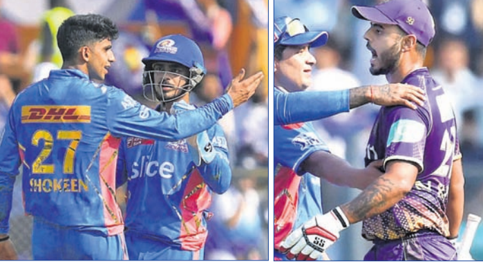
ହିତ୍ତ ଶୋକେନ ନାଟକୀୟ ରାଣା

ପୁସ୍ତକ, ୧୬୪୪ (ପି.ଟି.): ଭାରତୀୟ ଯୁବକ ଶତକରେ ପୁଲ୍ ଖେଳାଳିଙ୍କ ମଧ୍ୟରେ ରହିଥିବା ଶତକ ଆଇପିଏଲ୍ ଷ୍ଟେଜ୍ରେ ଦେଖିବାକୁ ମିଳିଛି। କ୍ରୀଡ଼ାରେ ବସ୍ତ୍ର ହେଲେ କୋଲକାତା ନାଟକ ରାଜତ୍ୱ ଅଧିନାୟକ ନାଟକୀୟ ରାଣା ଓ ପୁସ୍ତକ ଇତିହାସର ହିତ୍ତ ଶୋକେନ। ଏହି ଯୁବକ ଖେଳାଳିଙ୍କ ମଧ୍ୟରେ ସେମାନଙ୍କ ମ୍ୟାଚର ୯ମ ଓକ୍ଟୋବରରେ ଘଟିଥିଲା। ପୁସ୍ତକ ଇତିହାସ ବୋଲର କେକେଆର ଅଧିନାୟକଙ୍କୁ ଆଉଟ କରିବା ପରେ ତାକୁ ଆକ୍ରମଣ କରି ଛିଡ଼ା କରିଥିଲେ। ତାହା ଶୁଣି ପ୍ୟାକିସ୍ତାନର ଅଧିନାୟକ ରାଣା ଗ୍ରୀକ୍ସରେ ଅଧିକ ଯାଇଥିଲେ ଏବଂ କୁଲିପଡ଼ି କୋଲକାତା ଲକ୍ଷ୍ୟ କରି ଛିଡ଼ା କରିବା ପରେ ପୁସ୍ତକ ଇତିହାସର କ୍ୟାପଟାନ ଅଧିନାୟକ ସୂର୍ଯ୍ୟକୂମାର ଯାଦବ ଏବଂ ରୋମର ସୁପ୍ରୀୟା ସିଂହ