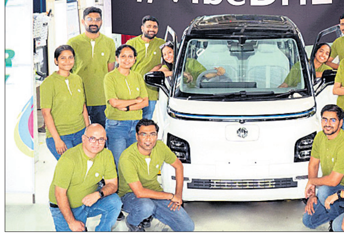
ଏମ୍‌ଜି କମ୍ପୋଟର ଉତ୍ପାଦନ ସମ୍ପର୍କରେ ବିସ୍ତୃତ ସୂଚନା ଦିଆଯାଇଛି। ଏପରିକି ବିଶ୍ୱପ୍ରସିଦ୍ଧ ପ୍ରଶଂସିତ ଜିଏସ ଇଉ ପ୍ଲାନେଟ୍ ଉପରେ ଆଧାରିତ ଏମ୍‌ଜି କମ୍ପୋଟ ଏକ ନବୋଦ୍ଦେଶ୍ୟ ଏବଂ ଭବିଷ୍ୟତର ଡିଜାଇନ ପରିଭାଷାକୁ ଯୋଗାଇ ଦେଇଛି। ବିଶେଷ କରି କମ୍ପାନୀର ଗୁଣାତ୍ମକତା ହାଲୋଲ ବୋଲି କମ୍ପାନୀ ପକ୍ଷରୁ କୁହାଯାଇଛି।

ସହ ଚାର୍ ସ୍ମାର୍ଟ ଇଉ-କମ୍ପୋଟ ଉତ୍ପାଦନ ସମ୍ପର୍କରେ ବିସ୍ତୃତ ସୂଚନା ଦିଆଯାଇଛି। ଏପରିକି ବିଶ୍ୱପ୍ରସିଦ୍ଧ ପ୍ରଶଂସିତ ଜିଏସ ଇଉ ପ୍ଲାନେଟ୍ ଉପରେ ଆଧାରିତ ଏମ୍‌ଜି କମ୍ପୋଟ ଏକ ନବୋଦ୍ଦେଶ୍ୟ ଏବଂ ଭବିଷ୍ୟତର ଡିଜାଇନ ପରିଭାଷାକୁ ଯୋଗାଇ ଦେଇଛି। ବିଶେଷ କରି କମ୍ପାନୀର ଗୁଣାତ୍ମକତା ହାଲୋଲ ବୋଲି କମ୍ପାନୀ ପକ୍ଷରୁ କୁହାଯାଇଛି।