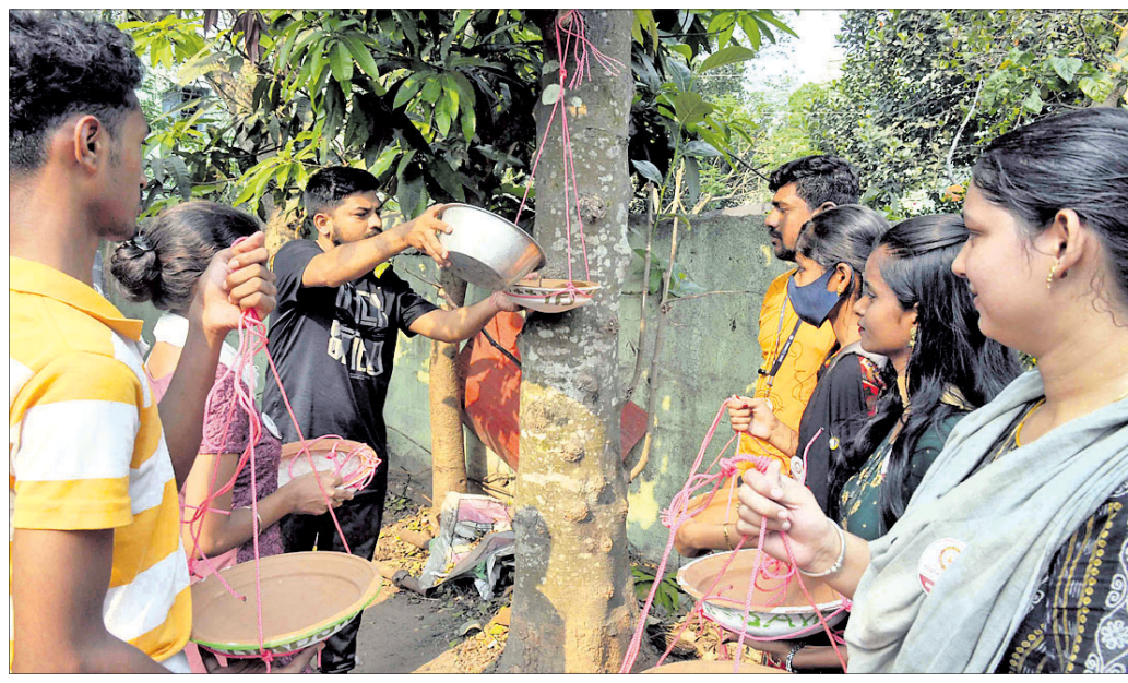
ଭୁବନେଶ୍ୱର ମୁନି-୨ ଅଞ୍ଚଳରେ ପକ୍ଷୀ ପାଳି ପାଇଁ ଫର ସେବା ପକ୍ଷରୁ ଗଛରେ ମାଟିପାତ୍ର ଗାଳି ପାଣି ରଖାଯାଇଛି।

ଦ୍ୱାରା ପ୍ରଦତ୍ତ ଅର୍ଥରାଶିର କିଛି ବିନିଯୋଗ କରାଯିବ ବୋଲି ସଙ୍ଗଠନ ପକ୍ଷରୁ ପ୍ରଶ୍ନ କରାଯାଇଛି। ଏନେଇ ୧୭ରୁ ଅଧିକ ପୁରାତନ ନୂତନ କୁଳପତିଙ୍କୁ ଭେଟି ପାଠ୍ୟକ୍ରମ ବନ୍ଦ କରିବା ପାଇଁ ସ୍ମାରକପତ୍ର ପ୍ରଦାନ କରିଛନ୍ତି। ୨ ବର୍ଷ ଅବଧିର ଏହି ପାଠ୍ୟକ୍ରମ ପରିବର୍ତ୍ତେ ୪ବର୍ଷ ଅବଧିର ଏକ ନୂତନ ବିଦେଶୀ ପାଠ୍ୟକ୍ରମ ଖୋଲାଯିବ ବୋଲି କହି କୁଳପତି ସେମାନଙ୍କ ଦାବିକୁ ଏଡ଼ାଇଯାଇଛନ୍ତି ବୋଲି ସଂଗଠନ ପକ୍ଷରୁ କୁହାଯାଇଛି। ଅନ୍ୟପକ୍ଷେ ୨ବର୍ଷରେ ଛାତ୍ରଛାତ୍ରୀ ସମାନ ଶିକ୍ଷାଲାଭ କରୁଥିବାବେଳେ ଅଧିକ ଅର୍ଥ ଉପାର୍ଜନ ଉଦ୍ଦେଶ୍ୟରେ ଏମ୍.ସି.ଏ ପାଠ୍ୟକ୍ରମକୁ ବନ୍ଦ କରି ୪ବର୍ଷର ଅବଧିର ପାଠ୍ୟକ୍ରମ ଆରମ୍ଭ କରାଯାଉଥିବା ଅଭିଯୋଗ ହୋଇଛି।