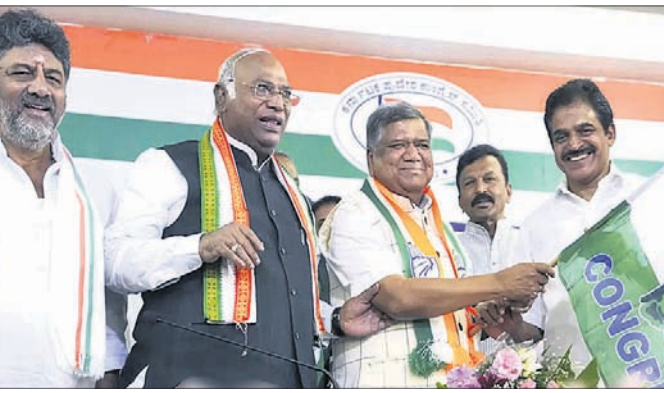
କର୍ନାଟକ ପୂର୍ବତନ ଭାଜପା ମୁଖ୍ୟମନ୍ତ୍ରୀ ଜଗଦୀଶ ଶେଖାର କଂଗ୍ରେସ ଅଧ୍ୟକ୍ଷ ମଲ୍ଲିକାର୍ଜୁନ ଖାର୍ଗେଙ୍କ ଉପସ୍ଥିତିରେ ସୋପାବାର ସର୍ତ୍ତ ପୂରାତନ ଦଳରେ ଯୋଗ ଦେଇଛନ୍ତି ।

କେତେକ ସର୍ତ୍ତ ରଖିଥିଲେ । ତାଙ୍କୁ ହୁବାଲି-ଧରାଘାଟ କେନ୍ଦ୍ରୀୟ ଆସନକୁ କଂଗ୍ରେସ ଟିକେଟ ମିଳିପାରେ ବୋଲି କୁହାଯାଇଛି । ୬ ଅର ବିଧାୟକ ଭାବେ ନିର୍ବାଚିତ ହୋଇଥିବା ସେକାର କର୍ନାଟକ ମୁଖ୍ୟମନ୍ତ୍ରୀ ହେବା ସହ ଭାଜପା ରାଜ୍ୟ ସଭାପତି ଭାବେ କାର୍ଯ୍ୟ କରିଥିଲେ । ଚଳିତ ବିଧାନସଭା ନିର୍ବାଚନ ଲାଗି ଭାଜପା ତାଙ୍କୁ ଟିକେଟ ନ ଦେବାକୁ ରବିବାର ସେ ଭାଜପାକୁ ଇସ୍ତଫା ଦେଇଥିଲେ । ଦଳ ବିରୋଧରେ ବିଦ୍ରୋହ ଯୋଷଣା କରିଥିବା ଜଗଦୀଶଙ୍କୁ ଅଟକାଇବାକୁ ଉଦ୍ୟମ କରି ଭାଜପା ଶୀର୍ଷ ନେତାମାନେ ବିଫଳ ହୋଇଥିଲେ ।