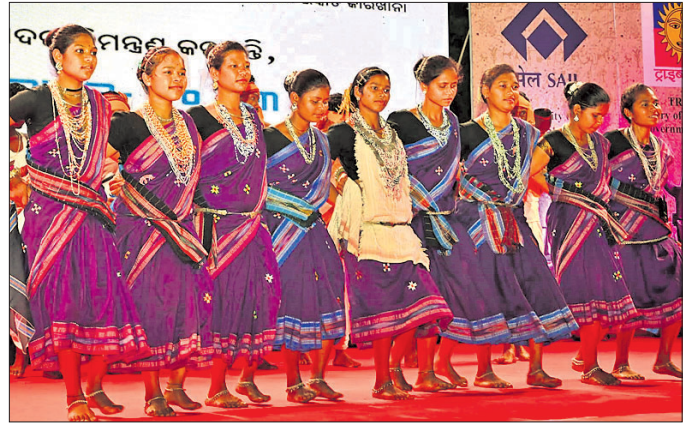
ଆଦିବାସୀ କଳାକାରମାନେ ନୃତ୍ୟ ପରିବେଷଣ କରୁଛନ୍ତି।