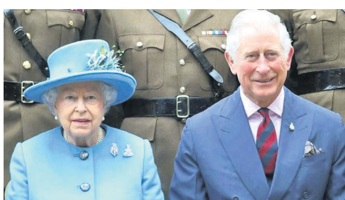
ମହାରାଣୀ ଏଲିଜାବେଥ୍ ଏବଂ ରାଜା ଚାର୍ଲ୍ସ୍