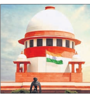
ନୁଆଦିଲ୍ଲା, ୧୭୧୪ (ପି.ଟି.)

ଜାତୀୟ ଖାଦ୍ୟ ସୁରକ୍ଷା ଆଇନ (ଏନ୍ଏସ୍ଏସ୍ଏ) ଅନୁଯାୟୀ ଜନସଂଖ୍ୟା ଅନୁପାତ ଉପଯୁକ୍ତ ଭାବେ ଉଲ୍ଲେଖ ନ ଥିବା ଦର୍ଶାଇ ପ୍ରବାସୀ ଶ୍ରମିକମାନଙ୍କୁ କେନ୍ଦ୍ର ଏବଂ ରାଜ୍ୟ ସରକାର ରାଶନ କାର୍ଡରୁ ବଞ୍ଚିତ କରିପାରିବେ ନାହିଁ ବୋଲି ସୁପ୍ରିମକୋର୍ଟ ସୋମବାର କହିଛନ୍ତି। କଲ୍ୟାଣକାରୀ ଯୋଜନାରୁ ପ୍ରତ୍ୟେକ ନାଗରିକ ଉପକୃତ ହେବା ଆବଶ୍ୟକ ବୋଲି ଜଷ୍ଟିସ୍ ଏମ୍.ଆର୍. ଶାହା ଏବଂ ଅଧ୍ୟାୟିକ ଅମରୁଲ୍ଲାକ ଖଣ୍ଡପାଠ ତିପ୍ପଣୀ ଦେଇଛନ୍ତି। ଏକ କଲ୍ୟାଣକାରୀ ରାଷ୍ଟ୍ର ଭାବେ ଲୋକଙ୍କ ପାଖରେ ପହଞ୍ଚିବା ସରକାରଙ୍କ କର୍ତ୍ତବ୍ୟ। ତେବେ ସରକାର କର୍ତ୍ତବ୍ୟରେ ଅବହେଳା କରିଛନ୍ତି ବୋଲି ଆମେ କହୁନାହିଁ। ତଥାପି କେତେଜଣ କେନ୍ଦ୍ରୀୟ ଓ ରାଜ୍ୟ ସରକାରଙ୍କ ସୁବିଧା ପାଇବାକୁ ବାଦ୍ ପଡ଼ିଛନ୍ତି। ସେମାନେ ଯେପରି ରାଶନ କାର୍ଡ ପାଇବେ, ତାହା ସରକାର ଦେଖିବା ଆବଶ୍ୟକ ବୋଲି ଖଣ୍ଡପାଠ କହିଛନ୍ତି।