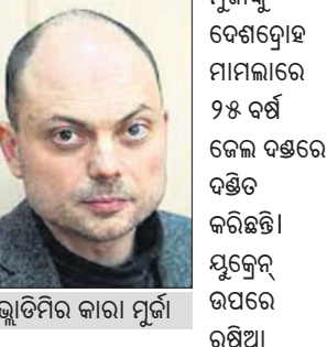
ଭ୍ରାତିମିର କାରା ମୁର୍ଦ୍ଦା

ମସ୍କୋ, ୧୭୧୪: ମସ୍କୋର ଏକ କୋର୍ଟ ସୋମବାର ରୁଷିଆ ରାଷ୍ଟ୍ରପତି ଭ୍ରାତିମିର ପୁଟିନଙ୍କ ସମାଲୋଚକ ଭ୍ରାତିମିର କାରା ମୁର୍ଦ୍ଦାଙ୍କୁ ଦେଶଦ୍ରୋହ ମାମଲାରେ 98 ବର୍ଷ ଜେଲ ଦଣ୍ଡରେ ଦଣ୍ଡିତ କରିଛନ୍ତି। ସୁକ୍ରେ ଉପରେ ରୁଷିଆ ଆକ୍ରମଣକୁ ନିନ୍ଦା କରିବା ସହ ରୁଷିଆ ସୈନ୍ୟ ସମ୍ପର୍କରେ ମିଶ୍ର ଖବର ପ୍ରସ୍ତୁତ କରିବା ନେଇ ମୁର୍ଦ୍ଦାଙ୍କ ବିରୋଧରେ ଅଭିଯୋଗ ହୋଇଥିଲା। ତେବେ ଏହି ରୁଷିଆ-ଡୁବିତ ପୂର୍ବତନ ଖବରଦାତା ଏବଂ ରାଜନେତାଙ୍କୁ ଗିରଫ କରାଯାଇଛି। ତାଙ୍କ ବିରୋଧରେ ହୋଇଥିବା ସମସ୍ତ ଅଭିଯୋଗକୁ ସେ ଖଣ୍ଡନ କରିଛନ୍ତି।