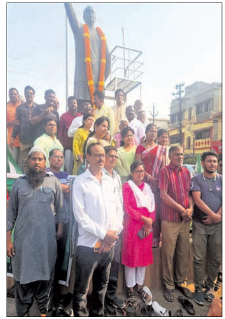
ବିଜୁବାବୁଙ୍କ ପ୍ରତିମୂର୍ତ୍ତିରେ ପୁଷ୍ପମାଳ୍ୟ ଅର୍ପଣ କରାଯାଇଛି ।