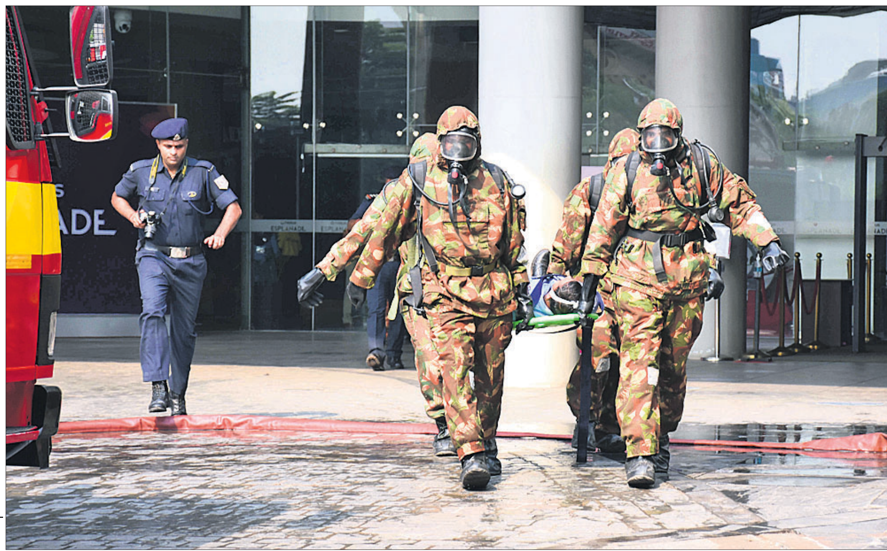
ଫାୟାର ସର୍ଭିସ୍‌ସ୍, ଏନ୍‌ଡିଆରଏଫ୍ ଓ ସିଲିକ୍ ଡିପେଟ୍‌ସ୍ ପକ୍ଷରୁ ସୋମବାର ଭୁବନେଶ୍ୱରସ୍ଥିତ ଏସ୍‌ପ୍ଲାନେଡ୍ ମଲ୍‌ରେ ଅଗ୍ନିକାଣ୍ଡ ମନୁଥିଲେ ଜଣଙ୍କୁ ଉଦ୍ଧାର କରାଯାଇଛି।