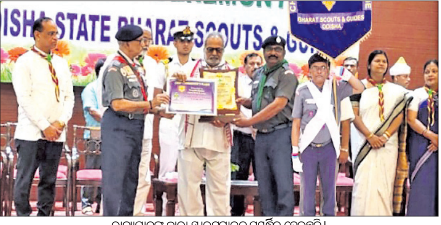
ରାଜ୍ୟପାଳଙ୍କ ଦ୍ୱାରା ସ୍ୱାଭିମୁକ୍ତ ଗାନ୍ଧି ସମର୍ଥକ ହେଉଛନ୍ତି ।