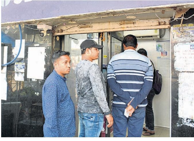
ସମ୍ବଲପୁର ସହରର ଏକ ଏଟିଏମ୍‌ରେ ଗ୍ରାହକଙ୍କ ଭିଡ଼ ।

ସମ୍ବଲପୁରରେ ସାମ୍ପ୍ରଦାୟିକ ହିଂସା ଘଟଣା ■ କର୍ମ୍ମ୍ୟ କୋହଳ, ସମାଧାନ ପାଇଁ ବୈଠକ: ଜିଲ୍ଲାପାଳ ■ ଗିରଫ ସଂଖ୍ୟା ୮୫କୁ ବୃଦ୍ଧି, ସ୍ଥିତି ନିୟନ୍ତ୍ରଣାଧୀନ: ଏସ୍‌ପି ସମ୍ବଲପୁର, ୧୭/୪ (ବୁଧବେଳା) ସମ୍ବଲପୁରରେ ହନୁମାନ ଜୟନ୍ତୀ ବାଲକ୍ ଶୋଭାଯାତ୍ରା ସମୟରେ ଘଟିଥିବା ସାମ୍ପ୍ରଦାୟିକ ହିଂସା ଘଟଣାକୁ ନେଇ ଜିଲ୍ଲାରେ ୫ଦିନ ହେଲା ଇତ୍ତହାସ୍ତ ସେବା ବନ୍ଦ କରିଦିଆଯାଇଛି। ଏହାସହ କର୍ମ୍ମ୍ୟ ମଧ୍ୟ ଲାଗାଯାଇଛି। ଏଥିଯୋଗୁ ସାଧାରଣ ଜନଜୀବନ ଅସ୍ତବ୍ୟସ୍ତ ହୋଇପଡ଼ିଛି। ବିଶେଷ କରି ନେର୍ ସେବା ବନ୍ଦ ଯୋଗୁ ଏହାର ପ୍ରଭାବ ବ୍ୟାପ୍ତ ହୋଇପଡ଼ିଛି। ଲୋକେ ଅନୁଲୋଚନରେ ଟଙ୍କା ନେଣଦେଣ କରୁଥିଲେ। ଏପରି କି ଦୋକାନ ବଜାରରେ ମଧ୍ୟ ଅନୁଲୋଚନରେ