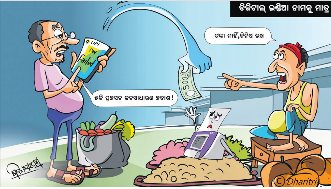
ଡିଜିଟାଲ୍ ଭଣ୍ଡିଆ ନାମକୁ ମାତ୍ର