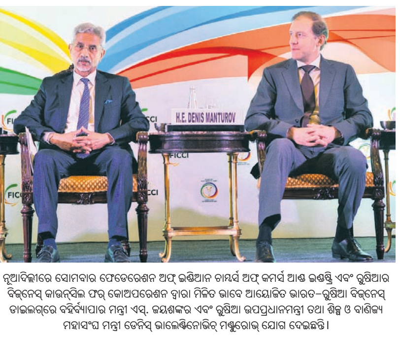
ନୁଆଦିଲ୍ଲାରେ ସୋମବାର ଫେଡେରେଶନ ଅଫ୍ ଇଣ୍ଡିଆନ ଚାମର୍ସ ଅଫ୍ କର୍ମର୍ସ ଆଣ୍ଡ ଇଣ୍ଡଷ୍ଟ୍ରି ଏବଂ ରୁଷିଆର ବିଜ୍ଞାନେୟ କାଉନ୍ସିଲ ଫର୍ କୋଅପରେଶନ ଦ୍ୱାରା ମିଳିତ ଭାବେ ଆୟୋଜିତ ଭାରତ-ରୁଷିଆ ବିଜ୍ଞାନେୟ ତାଲିକାରେ ବହୁବିଧା ପରାମର୍ଶ ଏବଂ ଉପପ୍ରଧାନମନ୍ତ୍ରୀ ତଥା ଶିଳ୍ପ ଓ ବାଣିଜ୍ୟ ମହାସଂଘ ମନ୍ତ୍ରୀ ତେନିସ୍ କାଲେଷ୍ଟିନୋଭିଚ୍ ମଖୁରୋଭ୍ ସୋମ ଦେଖିଛନ୍ତି।