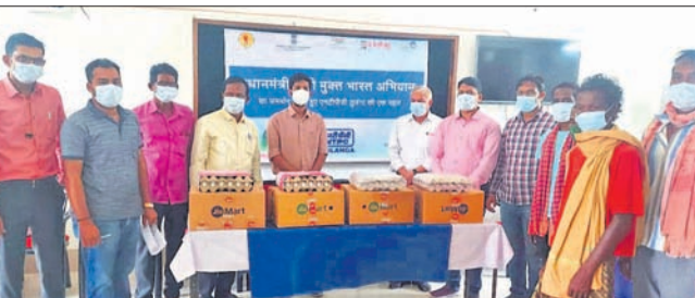
କ୍ୟାମ୍ପରେ ଉପସ୍ଥିତ ଡାକ୍ତର ଓ ଅନ୍ୟମାନେ।

ରୋଗୀଙ୍କୁ ପୁଷ୍ଟିକର ସହାୟତା ପ୍ରଦାନ କରିବା ସମାପ୍ତ ହେବା ପାଇଁ ସ୍ୱାସ୍ଥ୍ୟ ପ୍ରତିଷ୍ଠାନର ସମସ୍ତଙ୍କୁ ପାଇଁ ସ୍ୱାସ୍ଥ୍ୟ ପଦକ୍ଷେପ ଆରମ୍ଭ ହୋଇଛି। ଟିପିଆ ପଦକ୍ଷେପ ଏହି ଅଭିଯାନରୁ ୧୦୦ରୁ ଅଧିକ ପରିବାର ଉପକୃତ ହୋଇଛନ୍ତି। ଗ୍ରାମବାସୀ ତଥା ଜିଲ୍ଲା ପ୍ରଶାସନ ସାମାଜିକ ବିକାଶ ଦିଗରେ ଏନ୍‌ଟିପିସି ବର୍ଷ ପାଇଁ ଲେପ୍‌ଟିସା କୁକର ଯଶ୍ୱା ବୁଲ୍‌ଜାଙ୍କର ଉଦ୍ୟମକୁ ପ୍ରଶଂସା କରିଛି।