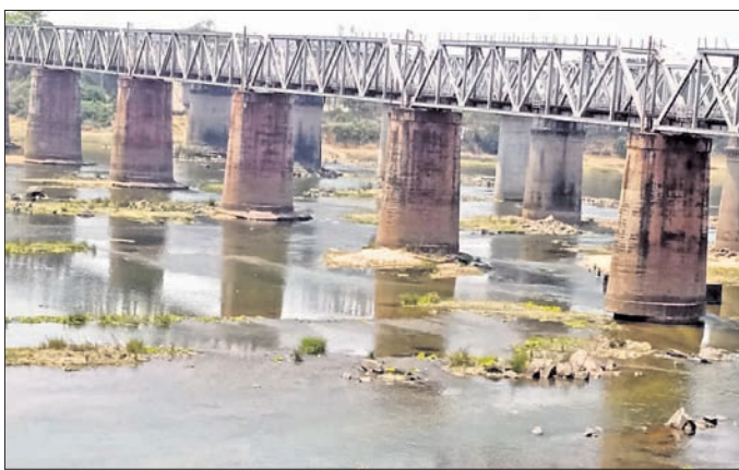
ବ୍ରାହ୍ମଣୀ ନଦୀ କଳପୁର ହ୍ରାସ ପାଇ ବାଲିଖୟା ବେଞ୍ଚାଯାଉଛି।

ସାରା ରାଜ୍ୟରେ ବର୍ତ୍ତମାନ ପ୍ରବଳ ଗ୍ରୀଷ୍ମ ପ୍ରବାହ ସହିତ ତାପମାତ୍ରା ହ୍ରାସ ହୋଇ ବୃଦ୍ଧି ପାଇଛି। ରାଉରକେଲାରେ ମଧ୍ୟ ୪୦ଡିଗ୍ରୀ ପାରା ଅତିକ୍ରମ କରିସାରିଛି। ଫଳରେ ସକାଳ ୯ଟା ପରେ ଲୋକେ ଆଉ ଘରୁ ପଦାକୁ ବାହାରିବା ମୁସ୍କିଲ ହୋଇପଡ଼ୁଛି। ଅନ୍ୟପକ୍ଷେ ପ୍ରଶାସନ ପକ୍ଷରୁ ସହରବାସୀଙ୍କୁ ଅଶୁଭାତରୁ ବର୍ତ୍ତନା ପାଇଁ ସଚେତନ କରାଯାଉଛି। ଶ୍ରମିକମାନଙ୍କୁ ସକାଳ ୧୧ଟା ପରେ କାମରୁ ନିବୃତ୍ତ ରହିବା ପାଇଁ ସଚର୍କ ସୂଚନା ଜାରି ହୋଇଛି। ତଥାପି କିଛି ଅମାନିଆ ସଚର୍କ ସୂଚନାକୁ ଉଲ୍ଲଙ୍ଘନ କରି ପ୍ରବଳ ଗ୍ରୀଷ୍ମରେ ଶ୍ରମିକମାନଙ୍କୁ କାମ କରାଉଥିବା ଦେଖିବାକୁ ମିଳୁଛି।