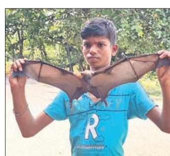
ମରି ପଡ଼ିଥିବା ଏକ ବାବୁଡ଼ିକୁ ଜଣେ ବାଳକ ଦେଖାଉଛନ୍ତି।

ପୌରାଣିକ ଅନ୍ତର୍ଗତ ଦଳରେ ରହୁଥିବା ବାବୁଡ଼ିମାନଙ୍କ ଏବେ ଆଉ ଦେଖା ମିଳୁନାହିଁ। ଗତ ବାଟୋରେ ବାବୁଡ଼ି ରହୁଥିବା ତେଜୁଳି ଗଛକୁ ଭାଙ୍ଗି ଯିବାକୁ ଜେନାପୁର ଅଞ୍ଚଳକୁ ଚାଲିଯାଇଥିବା ଗ୍ରାମବାସୀ ପ୍ରକାଶ କରିଛନ୍ତି। ଯାକପୁର ଜିଲ୍ଲାର ବାବୁଡ଼ିଙ୍କ ପୁରୁଣା ଦେବୀରେ ଜିଲ୍ଲାବାସୀ ସାରା ଦେଶରେ ଭିନ୍ନ ଭାବରେ ପୂଜା କରାଯାଇ ବାବୁଡ଼ିଙ୍କ ପ୍ରତି କବାଟବନ୍ଧ ଗ୍ରାମବାସୀଙ୍କ ଅନାଦିକ ପ୍ରେମ, ସ୍ନେହ ଓ ସୁରକ୍ଷା ଆଗରେ ସମସ୍ତ ପ୍ରକାର ଘଟିଥିବା ଗ୍ରାମବାସୀ କହିଛନ୍ତି। ସେଠାରେ ବର, ଭାଦ, ଅଶ୍ୱିନ ଋତୁରେ ଦୀର୍ଘ ବର୍ଷ ହେଲା ବାସ କରୁଥିବା ୫ ହଜାରରୁ ଊର୍ଦ୍ଧ୍ୱ ବାବୁଡ଼ି ଏବେ ଅପୁରୁଷିତ ହୋଇ ପଡ଼ିଛନ୍ତି। ବନ ବିଭାଗ କର୍ତ୍ତୃପକ୍ଷ ନାମକୁ ମାତ୍ର ପାଣି ସିଞ୍ଚନ କରି ନିଜର ଦାୟିତ୍ୱ ସମ୍ପାଦନ କରିଛନ୍ତି ବୋଲି ଗ୍ରାମବାସୀ ଅଭିଯୋଗ କରିଛନ୍ତି। ଅନ୍ୟପକ୍ଷେ ଗତ ପ୍ରାୟ ୩୦୦ ବର୍ଷ ହେବ ବ୍ୟାସନଗର