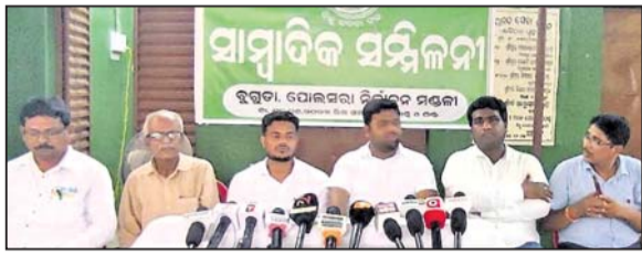
ବିଜେଡିର ଖବରଦାତା ସମ୍ମିଳନୀ।