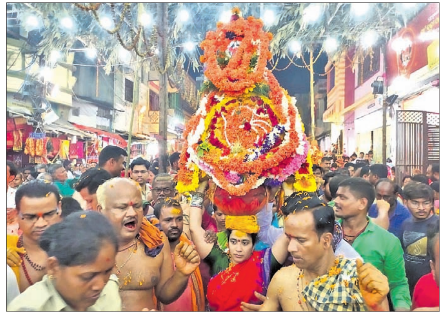
ମା'ଙ୍କ ଘଟ ପରିକ୍ରମା କରାଯାଉଛି।