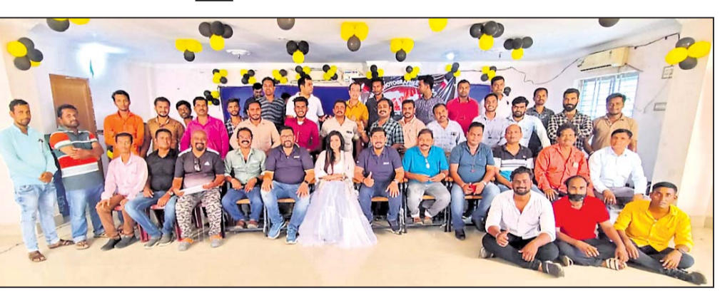
ତାଲିମ ଶିବିରରେ ଉପସ୍ଥିତ କର୍ମଚାରୀ।