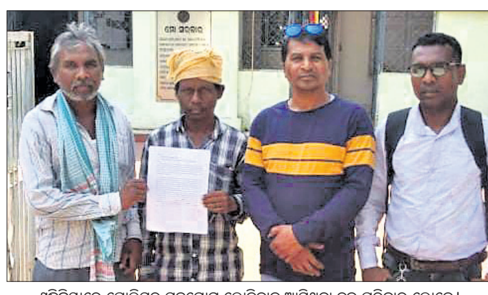
ଶୁଣିକ୍ରିୟାରେ ପୋଲିସର ସହଯୋଗ ଲୋଡ଼ିବାକୁ ଆସିଥିବା ଦୁଇ ପରିବାର ଲୋକେ।

ଏବେବି ଆଦିବାସୀଙ୍କ ମନରେ ବ୍ୟାପାରିକ ଅର୍ଥନୀତିରୁ କଞ୍ଚା କାଠ କୋର୍ଟରେ ନିର୍ଯାତନା ସହିବାକୁ ପଡ଼ିଛି। ସାମାଜିକ ଭାବେ ଯୋଗୁ ଗାଁ ଗୁଡ଼ିଆଙ୍କ ଦ୍ୱାରା ଦୋଷୀ ସାବ୍ୟସ୍ତ ହୋଇ ଆଣ୍ଡିକ ଦଣ୍ଡରେ ଦଣ୍ଡିତ ହେଉଛନ୍ତି। ଏଭଳି କଞ୍ଚା କୋର୍ଟରେ ଦଣ୍ଡିତ ହେବା ପରେ ଜରିମାନା ଦେଇ ନ ପାରିବାକୁ ମୟୂରଭଞ୍ଜ ଜିଲ୍ଲା ସଦର ମହକୁମାଠାରୁ ୨୦କି.ମି. ଦୂର ଖାରପୋଖରିଆ ଆନା ଅଧୀନ ପୋଖରିତହା ପଞ୍ଚାୟତର ଚୁଟୁକୁ(ମହେଶ୍ୱରପୁର) ଗ୍ରାମରେ ଦୁଇ ପରିବାର ୧୪ ବର୍ଷ ହେଲା ସାମାଜିକ ବାସନ୍ଦ ହୋଇ ରହିଛନ୍ତି। ଏପରିକି ୩ ବର୍ଷ ହେଲା ମୃତ ବ୍ୟକ୍ତିଙ୍କ ଶୁଣି କ୍ରିୟା ମଧ୍ୟ କରିପାରୁନାହାନ୍ତି। ଭୟଭୀତ ଅବସ୍ଥାରେ ଦୁଇ ପରିବାର ଲୋକେ ମଙ୍ଗଳକାରୀ ପୋଲିସ୍ ଓ ଜିଲ୍ଲା ପ୍ରଶାସନର ସହାୟତା ଲୋଡ଼ିଛନ୍ତି। ଏହି ଘଟଣା ଲୋକଲୋଚନକୁ ଆସିବା ପରେ ଆଦିବାସୀ ସେଠାରେ ଅଭିଯାନର