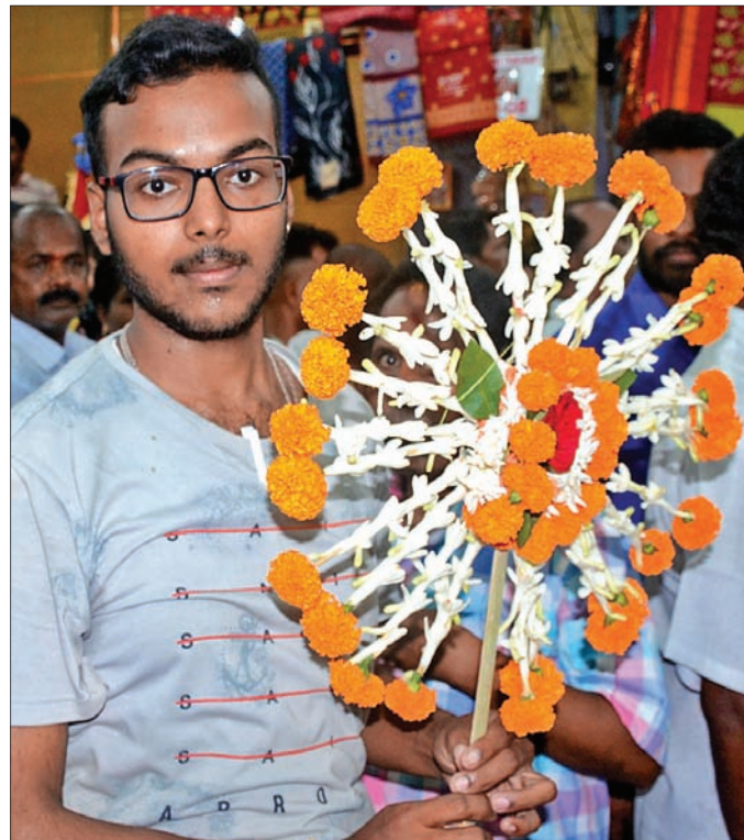
ମା'ଙ୍କ ପୂଜା ନିମନ୍ତେ ଫୁଲ ଗାଢ଼ିଆ।

୧୫ ଦିନରେ ବୁଢ଼ୀ ଠାକୁରାଣୀ ଦ୍ୱିବାସିକ ଯାତ୍ରା