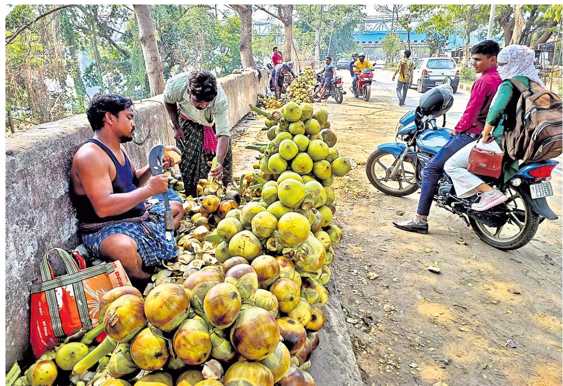
ଖରାରେ ତାଳସଜର ମଜା: କଟକ ଖାନୁନଗର ରିଂରୋଡ୍ ରାସ୍ତାକଡ଼ରେ ତାଳସଜ ବିକ୍ରି କରାଯାଉଛି ।

ନିକଟରେ ଆୟୋଜିତ ହୋଇଥିବା ପିକ୍‌ଉପ୍ ଖୁଲାଇ ଆଇକନ୍‌ସ୍ ଏଡିଟିଙ୍ଗ-୨ରେ ବଲିଉଡ୍ ଅଭିନେତ୍ରୀ ଅନନ୍ୟା ପାଣ୍ଡେ ସବୁଠୁ ଗୁମାମରସ୍ ଆଇକନ୍ ହୋଇଛନ୍ତି।