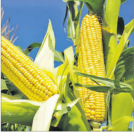
ପଟାସ୍ ସାର ମଧ୍ୟୁ ଶାଗରୁ ଭାଗେ ଯବକ୍ଷାରଜାନ, ସବୁଜ ଫସ୍‌ଫରସ୍ ଓ ପଟାସ୍ ସାର ପ୍ରୟୋଗ କରନ୍ତୁ।

ଜଳସେଚନର ସୁବିଧା ଥିଲେ ଏବେ କଞ୍ଚା ଖାଇବା ପାଇଁ ମକା ଫସଲ ଲଗାଯାଇପାରିବ। ଏହାର ଅଧିକ ଅମଳକ୍ଷମ ବିହନ କିମ୍ବଦନ୍ତୀ ମଧ୍ୟରେ ରହିଛି ନଭେମ୍ବର-ଡିସେମ୍ବର-୧୦୧୯ ଓ ୧୦୧୯-୧୦୨୦। ନିକଟରେ ଥିବା କୃଷି ବିଭାଗରେ ବିହନ ବିକ୍ରୟ କେନ୍ଦ୍ରକୁ ମକା ବିହନ ସଂଗ୍ରହ କରନ୍ତୁ। ଏକ ଏକର ଜମିରେ ୬ କି.ଗ୍ରା. ବିହନ ଆବଶ୍ୟକ ହୋଇଥାଏ। ଶେଷ ଓଡ଼ିଆ ବେଳେ ଏକର ପ୍ରତି ଅନୁମୋଦିତ ସାର ୩୨ କି.ଗ୍ରା. ଯବକ୍ଷାରଜାନ, ୧୬ କି.ଗ୍ରା. ଫସ୍‌ଫରସ୍ ଓ ୧୬ କି.ଗ୍ରା.