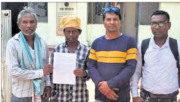
ଶୁକ୍ତିକ୍ରୟରେ ପୋଲିସର ସହଯୋଗ ଲୋଡ଼ିବାକୁ ଆସିଥିବା ଦୁଇ ପରିବାର ଲୋକେ।

ଯବାନମାନେ ମଧ୍ୟ ଏହାର ଉପଯୁକ୍ତ ଜବାବ ଦେଉଥିଲେ। ଉଭୟପକ୍ଷ ମଧ୍ୟରେ ଦୀର୍ଘ ସମୟ ଧରି ଗୁଳି ବିନିମୟ ଜାରି ରହିଥିଲା। ଶେଷରେ ଯବାନଙ୍କ ସାମ୍ନା କରି ନ ପାରି ମାଉସୀବାଦକ ଛତୁତଙ୍ଗ ଦେଇ ଜଙ୍ଗଲ ଭିତରକୁ ପଳାଇଥିଲେ। ସେମାନଙ୍କ ମଧ୍ୟରୁ ଜଣେ ଚଳାଇ ଦେଇ ଜଣେ ପୁରୁଷ ମାଉସୀବାଦକ ମୃତଦେହ ମିଳିଥିଲା। ସେହିପରି ଛୁଟି ରହିଥିବା ଦୁଇ ଜଣ ମାଉସୀବାଦକ ମଧ୍ୟ ଯବାନମାନେ ଧରିଥିଲେ। ଉଭୟକୁ ଗିରଫ କରାଯାଇଛି। ସେମାନଙ୍କ ମଧ୍ୟରୁ ଜଣେ ଆହତ ହୋଇଥିବାରୁ ତାଙ୍କୁ ସେଠାରୁ ଆଣି ଚିକିତ୍ସା କରାଯାଇଛି। ବର୍ତ୍ତମାନ ସୁଦ୍ଧା କାଟଲାଖାରି ଅଞ୍ଚଳରେ କୋର୍ଟି ଅପରେଶନ ଜାରି ରହିଥିବା ପୋଲିସ ଅଧୀକାରୀ ଅଧିକାରୀ ଉଦ୍ଦେଶ୍ୟକ କହିଛନ୍ତି।