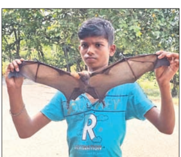
ମରି ପଡ଼ିଥିବା ଏକ ବାବୁଡ଼ିକୁ ଜଣେ ବାଳକ ଦେଖାଉଛନ୍ତି।