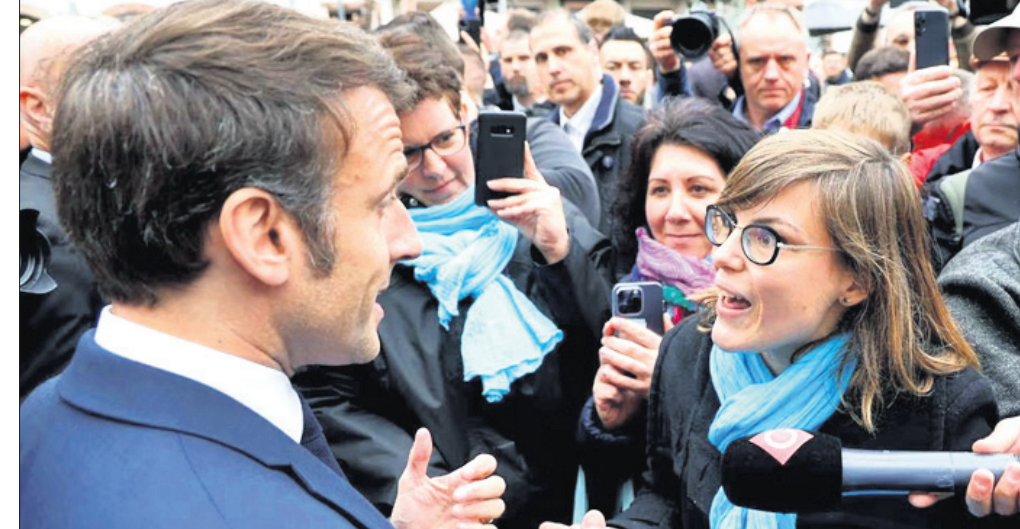
ସେଲେଷ୍ଟାଲ୍‌ଗୁରେ ଫ୍ରାନ୍ସ ରାଷ୍ଟ୍ରପତି ଇମାନ୍ୟୁଏଲ୍ ମାକ୍‌ରଙ୍କ ସହ ସୁକ୍ରି କରୁଛନ୍ତି ବିରୋଧକାରୀ।

ଶୁକ୍ରବାର କନ୍‌ଷ୍ଟିଚ୍ୟୁସନାଲ କାଉନସିଲ୍ ପେନ୍‌ସନ ସଂସ୍କାରକୁ ଅନୁମୋଦନ କରିଥିଲା। ଏହାର ପ୍ରତିବାଦରେ ମେ' ୧ରେ ଗଣଶ୍ରମ ବିଦସ ବିରୋଧ କରିବାକୁ ଯୁକ୍ତିଯୁକ୍ତ ଭେଦାବେଦ ଦେଇଛନ୍ତି। ମାକ୍‌ର ଏହାକୁ ଭୁଲେଇ ନ କରି ରୁଧିର ପୂର୍ବ ଫ୍ରାନ୍ସର ଏଲ୍‌ସାଏଫ୍ ଅଞ୍ଚଳର ସେଲେଷ୍ଟାଲ୍‌ଗୁ ପ୍ରସ୍ତୁତ କରିଥିଲେ। ସେଠାରେ ତାଙ୍କୁ ଟାକ୍ସ ବିରୋଧ କରାଯାଇଛି। ତାଙ୍କ ଗସ୍ତ ପ୍ରତିବାଦରେ ପୋଷ୍ଟର ବ୍ୟାନର ଛାଇ ହୋଇଯାଇଥିଲା। ଏପରି କି