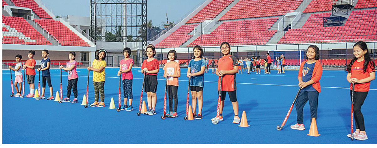
କଳିଙ୍ଗ ଷ୍ଟାଡ଼ିୟମରେ ଅନୁଷ୍ଠିତ ହେଉଥିବା ସମର କ୍ୟାମ୍ପରେ ଭାଗ ନେଇଥିବା ପିଲାମାନେ।

ରାଜ୍ୟ ସରକାରଙ୍କ କ୍ରୀଡ଼ା ବିଭାଗ ପକ୍ଷରୁ କଳିଙ୍ଗ ଷ୍ଟାଡ଼ିୟମରେ ବିଭିନ୍ନ କ୍ରୀଡ଼ାପାଇଁ ସମର କ୍ୟାମ୍ପ ଆୟୋଜନ କରାଯାଇଛି। ଫଳରେ ଖେଳରେ ରୁଚି ରଖୁଥିବା ପିଲାମାନଙ୍କ ପାଇଁ ଗ୍ରୀଷ୍ମାବକାଶ ସମୟରେ ସେମାନଙ୍କ ପସନ୍ଦର ଗେମ୍ ସମ୍ପର୍କରେ ବିସ୍ତୃତ ଜ୍ଞାନ ଆହରଣର ସୁଯୋଗ ସୃଷ୍ଟି କରାଯାଇଛି। ଗେ' ୧୭ କଳିଙ୍ଗରେ ଏକାଧିକ କ୍ରୀଡ଼ାର ସମର କ୍ୟାମ୍ପ ଆୟୋଜନ ହେବାକୁ ଯାଉଛି। ଏଥିରେ ଆଥଲେଟିକ୍ସ, ଭାରୋଭୋଲନ, ପୁଟ୍‌ବଲ, ବାସ୍କେଟବଲ, କବାଡି, ଜୁଡୋ, ଜିମ୍ନାଷ୍ଟିକ୍ସ ଓ ଭଲିବଲ ଆଦି ଖେଳର କ୍ୟାମ୍ପ ହେବ।