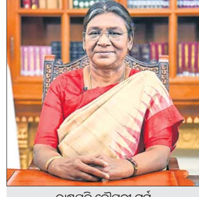
ରାଷ୍ଟ୍ରପତି ଦ୍ରୌପଦୀ ମୁର୍ମୁ

ଏମ୍‌ଏସ୍‌ସି ବିଶ୍ୱବିଦ୍ୟାଳୟ ସମାବେଶର ଉଦ୍‌ଘାଟନ କରି ଯୋଗଦେବେ