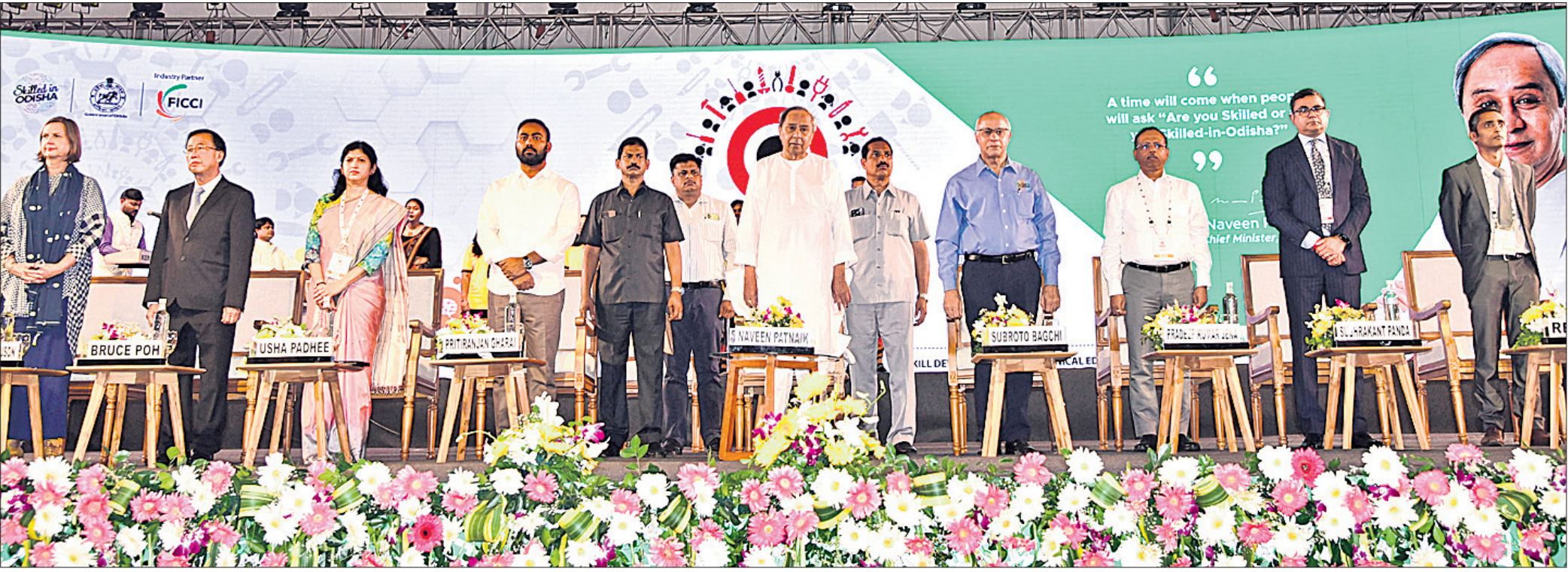
ଓଡ଼ିଶା ସ୍କିଲ୍ କନକ୍ଟେଭ୍-୨୦୨୩'କୁ ଗୁରୁବାର ମୁଖ୍ୟମନ୍ତ୍ରୀ ନବୀନ ପଟ୍ଟନାୟକ ଉଦ୍ଘାଟନ କରିଛନ୍ତି । ନିକଟରେ ଅଛନ୍ତି ଦକ୍ଷତା ବିକାଶ ଓ ବୈଷୟିକ ଶିକ୍ଷା ମନ୍ତ୍ରୀ ପ୍ରତିରଞ୍ଜନ ଘଡ଼େଇ, ବିଭାଗୀୟ ପ୍ରମୁଖ ସଚିବ ଉଷା ପାଢ଼ୀ, ମୁଖ୍ୟ ଶାସନ ସଚିବ ପ୍ରଦୀପ ଜେନା, ଓଡ଼ିଶା ଦକ୍ଷତା ବିକାଶ କର୍ତ୍ତୃପକ୍ଷ ଅଧ୍ୟକ୍ଷ ସୁବ୍ରତୋ ବାଗ୍ଡା ଓ ଅନ୍ୟମାନେ ।