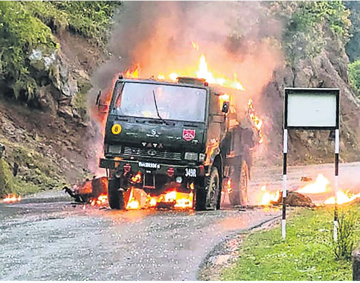
କମ୍ପ୍ୟୁ-କମ୍ପ୍ୟୁର ପୁଅର ମେଘାର ଅଞ୍ଚଳରେ ଗୁରୁବାର ଆତଙ୍କବାଦୀଙ୍କ ଆକ୍ରମଣରେ ଜଳିଯାଇଥିବା ଯବାନଙ୍କ ଗାଡ଼ି।