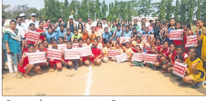
ଅତିଥିକ ସହ ଚୁନାମେଣ୍ଟରେ ଭାଗ ନେଇଥିବା ବାଳିକା ଓ ଅନ୍ୟମାନେ।