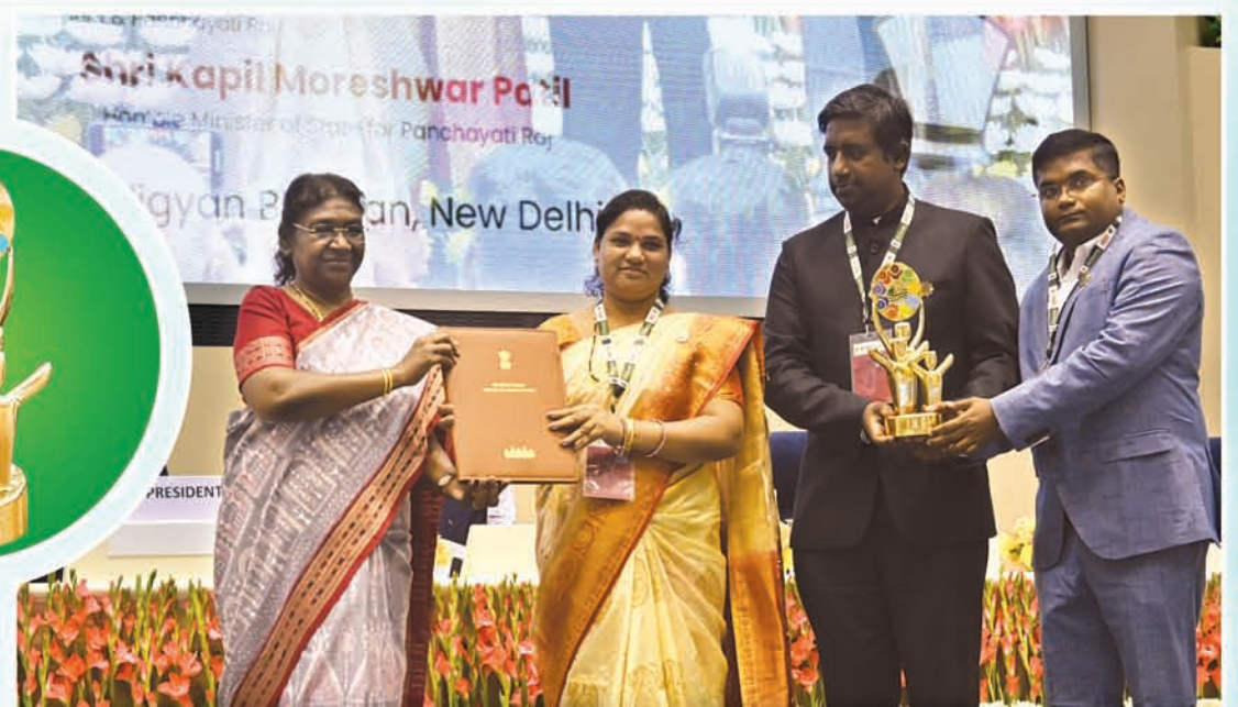
‘ହିଞ୍ଜିଳିକାରୁ’ ଦେଶର ଶ୍ରେଷ୍ଠ ପଞ୍ଚାୟତ ସମିତି