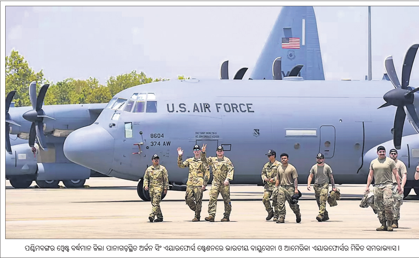
ପଶ୍ଚିମବଙ୍ଗର ଫ୍ରେଣ୍ଡ୍ସ ବର୍ଷମାନ ଜିଲ୍ଲା ପାଦାରଚ୍ଚତ୍ତ ଅର୍ଜନ ସିଂ ଏୟାରଫୋର୍ସ ସ୍ପେଶନରେ ଭାରତୀୟ ବାୟୁସେନା ଓ ଆମେରିକା ଏୟାରଫୋର୍ସର ମିଳିତ ସମବାକାୟ।