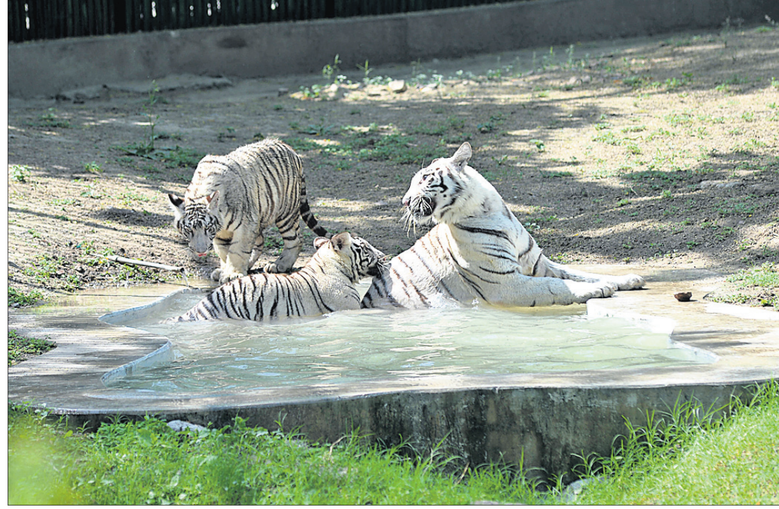
ସୁଆଦିଲ୍ଲାସ୍ଥିତ ଏକ ପ୍ରାଣୀ ଉଦ୍ୟାନରେ ଗୁରୁବାର କେନ୍ଦ୍ର ପରିବେଶ ଏବଂ ଜଳବାୟୁ ପରିବର୍ତ୍ତନ ମନ୍ତ୍ରଣାଳୟ ମନ୍ତ୍ରୀ ଭୂପିନ୍ଦର ଯାଦବ ଦର୍ଶକଙ୍କ ଉଦ୍ଦେଶ୍ୟରେ ସ୍ୱତନ୍ତ୍ର ଏନକ୍ଲୋଚରରେ ୨ଧଳା ବାଘ ଛୁଆକୁ ଛାଡ଼ିବାପରେ ମା' ବାଘ ସହ ଖେଳୁଛନ୍ତି ।