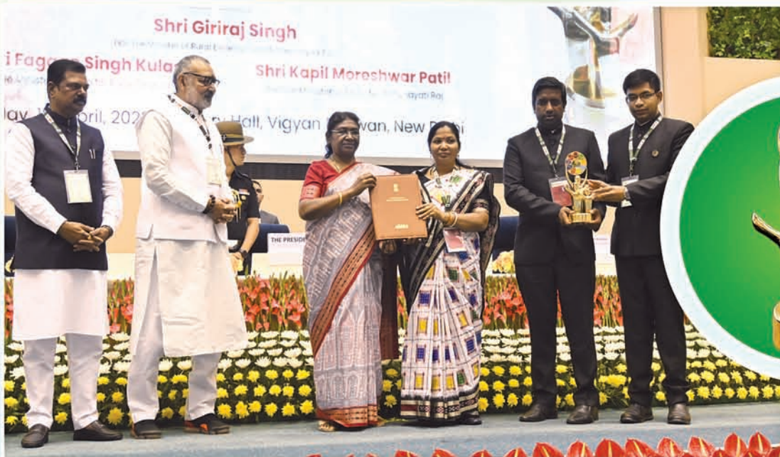
‘ଗଞ୍ଜାମ’ ଜିଲ୍ଲା ଦେଶର ଶ୍ରେଷ୍ଠ ଜିଲ୍ଲା ପରିଷଦ