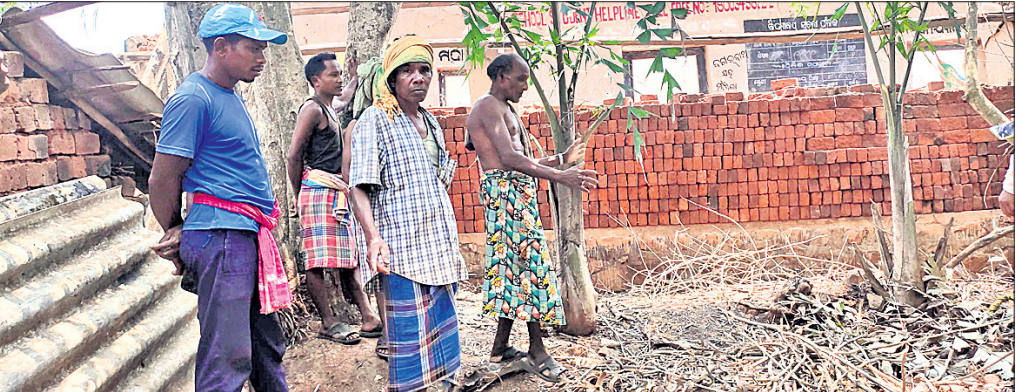
ଅଭିଯୋଗ କରିବାକୁ ଆସିଥିବା ଗ୍ରାମବାସୀ।

ସମ୍ପର୍କରେ ସେମାନଙ୍କୁ ପରାମର୍ଶ ଦେଲେ ଧର୍ମକର୍ମକ, ଉତ୍ତେଜନା ସେହି ଗ୍ରାମରେ ଏକ ନୂତନ କୋଠା ନିର୍ମାଣ କରାଯାଇ ସେଠାକୁ ବିଦ୍ୟାଳୟ ସ୍ଥାନାନ୍ତର ହୋଇଥିଲା। ତେବେ ଦୀର୍ଘ ୫ ବର୍ଷ ହେବ ପୁରାତନ ବିଦ୍ୟାଳୟଟି ବନ୍ଦ ରହିଥିଲା। ଏହାର ସୁଯୋଗ ନେଇ ଗ୍ରାମର ସ୍କୁଲ ପରିଚାଳନା କମିଟିର କେତେ ଜଣ ସଦସ୍ୟ ପୁରାତନ ବିଦ୍ୟାଳୟର ସାମଗ୍ରୀ ଆକ୍ସେସ୍, ଝରକା ଏବଂ ଇଟାଗୁଡ଼ିକୁ ଗ୍ରାମବାସୀଙ୍କ ଅକାର୍ଯ୍ୟକରେ ଭାଙ୍ଗି ନିଜ ଘରକୁ ନେଇ ଯାଉଥିଲେ। ଏହା ଜାଣିବା ପରେ ଗ୍ରାମର ଚଳଣି କମିଟି ପୁନଃ ଆବେଦନ କରିବାକୁ ଆସିଥିବା ଗ୍ରାମବାସୀ