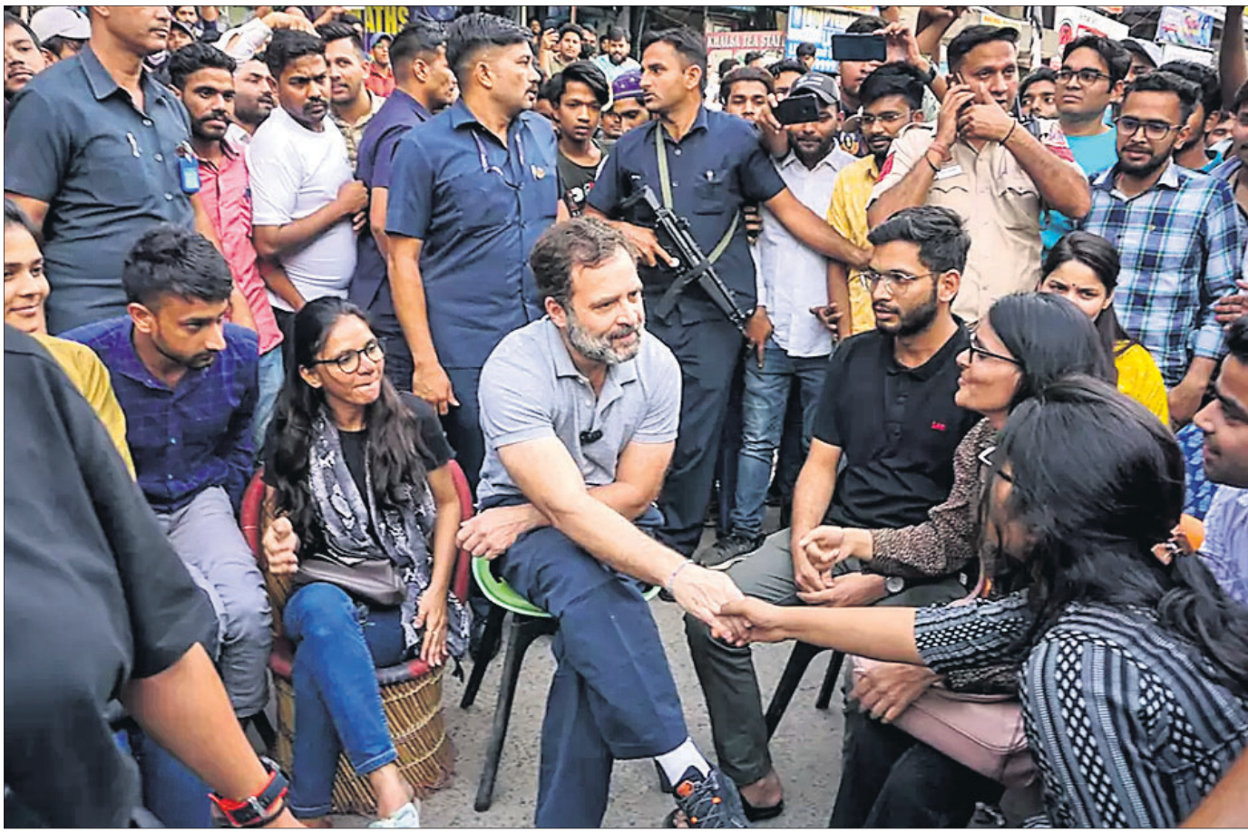
ଦିଲ୍ଲୀ ବିଶ୍ୱବିଦ୍ୟାଳୟର ନର୍ଥ କ୍ୟାମ୍ପସ୍ରେ ଛାତ୍ରଛାତ୍ରୀଙ୍କ ସହ ଭାବ ବିନିମୟ କରୁଛନ୍ତି କଂଗ୍ରେସ ନେତା ରାହୁଲ ଗାନ୍ଧୀ।