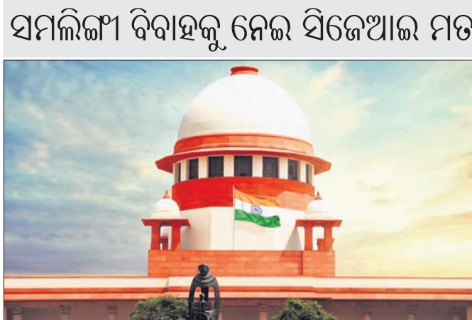
ସମଲିଙ୍ଗୀ ବିବାହକୁ ନେଇ ସିଜେଆଇ ମତ ସ୍ୱୀକୃତି ଦେବାକୁ ହେଲେ ବିବାହ ସହ ସମ୍ପୂର୍ଣ୍ଣ ଧାରଣାର ପୁନଃ ସଂଖ୍ୟା ନିରୂପଣ କରିବାକୁ ହେବ। କାରଣ ପ୍ରଚଳିତ ନିୟମ ଅନୁଯାୟୀ ବିବାହ ପାଇଁ ଦୁଇ ଦୁଇ ଜଣଙ୍କର ସମ୍ମତ ଆବଶ୍ୟକ ହେବାକୁ ପଡ଼ିବ। ୧୯୫୪ରେ ସ୍ୱତନ୍ତ୍ର ବିବାହ ଆଇନ କାର୍ଯ୍ୟକାରୀ ହେବା ପରଠାରୁ ଗତ ୬୯ ବର୍ଷ ମଧ୍ୟରେ ଆଇନରେ ଉଲ୍ଲେଖନୀୟ ପରିବର୍ତ୍ତନ ହୋଇଛି।

ନୂଆଦିଲ୍ଲୀ, ୨୦୧୪: ସମଲିଙ୍ଗୀ ବିବାହକୁ ନେଇ ସିଜେଆଇ ମତ ସ୍ୱୀକୃତି ଦେବାକୁ ହେଲେ ବିବାହ ସହ ସମ୍ପୂର୍ଣ୍ଣ ଧାରଣାର ପୁନଃ ସଂଖ୍ୟା ନିରୂପଣ କରିବାକୁ ହେବ। କାରଣ ପ୍ରଚଳିତ ନିୟମ ଅନୁଯାୟୀ ବିବାହ ପାଇଁ ଦୁଇ ଦୁଇ ଜଣଙ୍କର ସମ୍ମତ ଆବଶ୍ୟକ ହେବାକୁ ପଡ଼ିବ। ୧୯୫୪ରେ ସ୍ୱତନ୍ତ୍ର ବିବାହ ଆଇନ କାର୍ଯ୍ୟକାରୀ ହେବା ପରଠାରୁ ଗତ ୬୯ ବର୍ଷ ମଧ୍ୟରେ ଆଇନରେ ଉଲ୍ଲେଖନୀୟ ପରିବର୍ତ୍ତନ ହୋଇଛି। ଯେଉଁମାନେ ପର୍ଯ୍ୟାୟ ଲ'କୁ ଅନୁପାଳନ କରିବାକୁ ଚାହୁଁନାହାନ୍ତି, ସେମାନଙ୍କର ସ୍ୱଳ୍ପ ବିବାହ କରାଯାଇଛି। ସମଲିଙ୍ଗୀ ସମ୍ପର୍କକୁ ଅପରାଧପୂର୍ଣ୍ଣ କରାଯିବା ଦ୍ୱାରା କେବଳ ଦୁଇ ସମଲିଙ୍ଗୀଙ୍କ ମଧ୍ୟରେ ସହମତରେ ସମ୍ପର୍କ ସ୍ଥାପନକୁ ସ୍ୱୀକୃତି ଦିଆଯାଇ ନାହିଁ, ଏଥିସହିତ ସମଲିଙ୍ଗୀ ସମ୍ପର୍କର ଥିବା ଲୋକଙ୍କ ମଧ୍ୟରେ ଏହାକୁ ସ୍ଥାୟୀ ସମ୍ପର୍କ ଭାବେ ସ୍ୱୀକୃତି ମିଳିଛି ବୋଲି ୨୦୧୮ର ଐତିହାସିକ ରାୟର ଅବତାରଣା କରି ସିଜେଆଇ କହିଥିଲେ। ଟ୍ରୋଲ୍ ହେବାର ଆଶଙ୍କା ଥିଲେ ମଧ୍ୟ ଏହାକୁ ଅନ୍ୟ ସହଜୁଳା କରାଯାଇପାରିବ ନାହିଁ ବୋଲି ଜଷ୍ଟିସ୍ ଚନ୍ଦ୍ରଚୂଡ଼ କହିଥିଲେ।