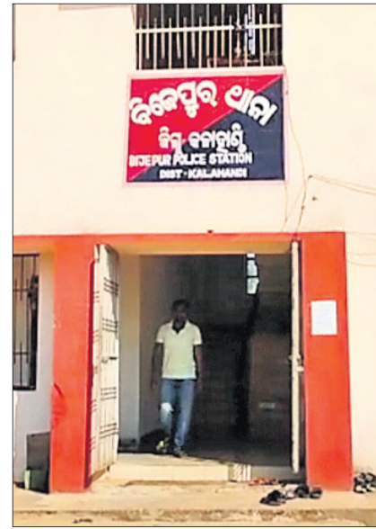
ଅଞ୍ଚଳର ୫ଜଣ ମୁବକ ସେମାନଙ୍କୁ ଅଟକାଇଥିଲେ । ୨ ନାବାଳିକା ଓ ମୁବତ୍ତାଙ୍କୁ ସେମାନେ ପାଖ ଜଙ୍ଗଲକୁ

ଅଭିଯୋଗ ଅନୁଯାୟୀ, ବିଜେପୁର ଥାନା ଅଞ୍ଚଳର ସମ୍ପୃକ୍ତ ୨ ନାବାଳିକା ଏବଂ ଜଣେ ମୁବତ୍ତା ନିକଟସ୍ଥ ଏକ ଗ୍ରାମକୁ ଶନିବାର ମା' ତାରିଣୀ ଯାତ୍ରା ଦେଖିବାକୁ ଯାଇଥିଲେ । ନାଟକ ଦେଖି ରବିବାର ଭୋର ସମୟରେ ଘରକୁ ଫେରୁଥିବା ବେଳେ ବାଟରେ ପହୁଥିବା ଏକ ପୋଲ ନିକଟରେ ଉକ୍ତ