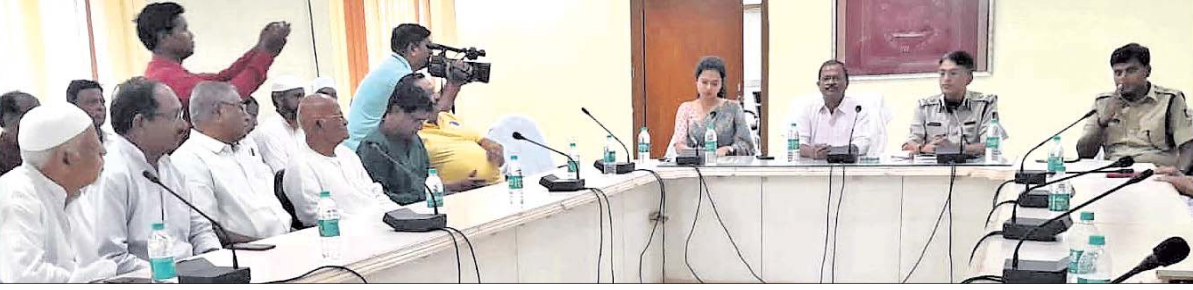
ବୈଠକରେ ପ୍ରଶାସନିକ ଅଧିକାରୀଙ୍କ ସହ ବିଜେ ବର୍ଗର ବ୍ୟକ୍ତିବିଶେଷ ।

ସଂଯୁକ୍ତପୁର, ୨୦୧୪(ସ୍ୱୟଂବା) ■ ଆରକ୍ଷିତ ଅଫିସରେ ଶାନ୍ତି ବୈଠକ ■ ହିଂସା ଘଟଣା: ଗିରଫ ସଂଖ୍ୟା ୯୯ ■ ହନୁମାନ ଜୟନ୍ତୀ ସମ୍ବନ୍ଧୀୟ ସମିତି ସମ୍ପାଦକ ଗିରଫ