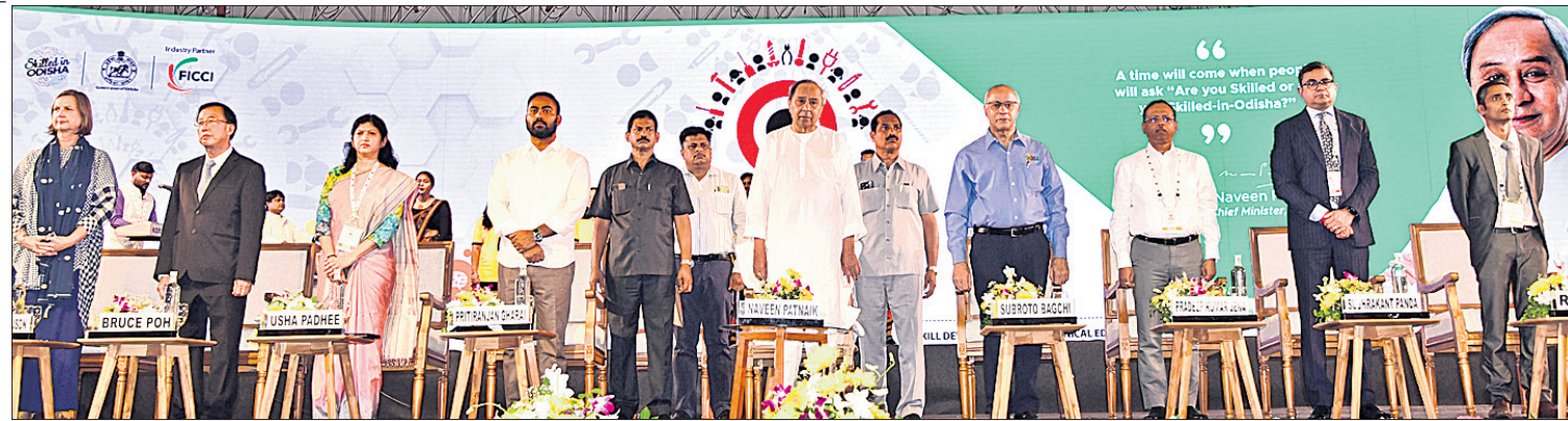
‘ଓଡ଼ିଶା ସିଲ୍ କନକ୍ଲେଭ୍-୨୦୨୩’କୁ ଗୁରୁବାର ମୁଖ୍ୟମନ୍ତ୍ରୀ ନବୀନ ପଟ୍ଟନାୟକ ଉଦଘାଟନ କରିଛନ୍ତି। ନିକଟରେ ଅଛନ୍ତି ଦକ୍ଷତା ବିକାଶ ଓ ବୈଷୟିକ ଶିକ୍ଷା ମନ୍ତ୍ରୀ ପ୍ରତିରଞ୍ଜନ ଘଡ଼େଇ, ବିଭାଗୀୟ ପ୍ରମୁଖ ସଚିବ ଉଷା ପାଢ଼ୀ, ମୁଖ୍ୟ ଶାସନ ସଚିବ ପ୍ରଦୀପ ଜେନା, ଓଡ଼ିଶା ଦକ୍ଷତା ବିକାଶ କର୍ତ୍ତୃପକ୍ଷ ଅଧ୍ୟକ୍ଷ ସୁବ୍ରତା ବାଗ୍ଚୀ ଓ ଅନ୍ୟମାନେ ।