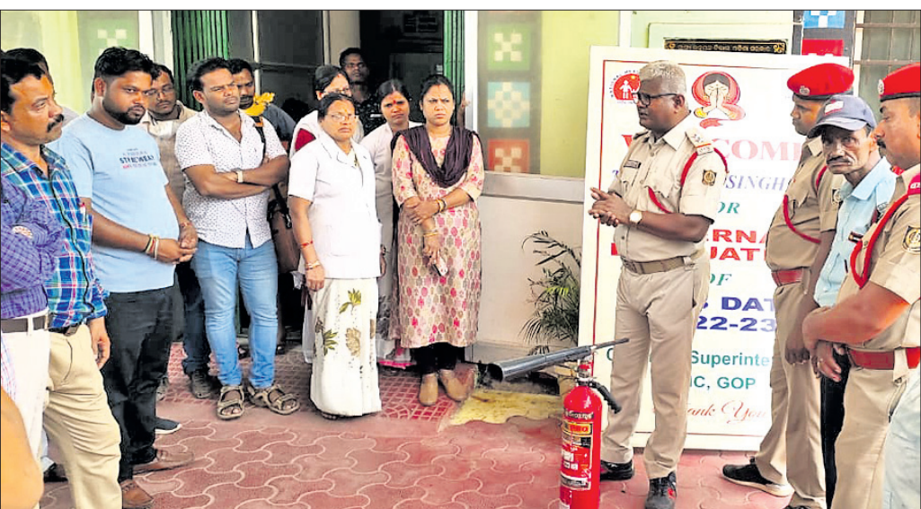
ଗୋପ ଅଗ୍ନିଶମ ବିଭାଗ ପକ୍ଷରୁ ଗୋପ ଗୋଷ୍ଠୀ ସ୍ୱାସ୍ଥ୍ୟକେନ୍ଦ୍ରରେ ଗୁରୁବାର ଅଗ୍ନି ସଚେତନତା କରାଯାଇଛି।

ବାଡ଼, ଚାପର ବିଭିନ୍ନ ଅଂଶ, ଚକଡ଼ାରେ ବିଭିନ୍ନ ସ୍ଥାନରେ ଦେବଦେବୀଙ୍କ ପ୍ରତିଛବି ଆଦି ରଙ୍ଗ କାର୍ଯ୍ୟ ଚିତ୍ରକାର ସେବାୟତଙ୍କ ପକ୍ଷରୁ କରାଯାଉଛି। ଅନ୍ୟପକ୍ଷେ ଚନ୍ଦନ ଯାତ୍ରା ନିମନ୍ତେ ଦର୍ଜା ସେବାୟତଙ୍କ ନେତୃତ୍ୱରେ ୧୭ଜଣ ସେବକ ଠାକୁରଙ୍କ କାର୍ଯ୍ୟରେ ନିଯୋଜିତ ଅଛନ୍ତି। ଚନ୍ଦନ ଯାତ୍ରାରେ ଠାକୁରଙ୍କ ପାଇଁ ୧୭ଟି ଶେଯ, ୨୧ଟି ମାଣ୍ଡି, ୨ଟି ମୁଦଙ୍ଗ ମାଣ୍ଡି ସହ ନନ୍ଦା ଭଦ୍ରାତଳା ବ୍ରହ୍ମ ପାଇଁ ଧଳା ଓ ନାଲି ଚାପମଣ୍ଡଳ ତିଆରି ଚାଲିଛି। ୨ଟି ଚଳା ପାଇଁ ୮ଟି ବାଙ୍କ ତିଆରି ହେଉଛି। ଚାପର କାଠ ଭଳି ବାଙ୍କ ଲାଗିବ। ୨ଟି କାର୍ଯ୍ୟରେ ନିଯୋଜିତ ରହିଛନ୍ତି। ସେହିଭଳି ନରେନ୍ଦ୍ର ଚକଡ଼ାରେ ଚାଳି ନିର୍ମାଣ କରିଛନ୍ତି। ରାସ୍ତାରେ ପଡ଼ି ଛାପୁଥିବା ମାନ ନିର୍ମାଣ କରାଯାଇଛି ବୋଲି ଭୋଜ ସର୍ବାଦ ରବି ଭୋଜ କହିଛନ୍ତି। ସେହିପରି ନରେନ୍ଦ୍ର ଚକଡ଼ାରେ ଚଳା ରଙ୍ଗ କାର୍ଯ୍ୟ ପୁଷ୍କରିଣୀ ଆସି ନନ୍ଦା ଏବଂ ଭଦ୍ରା ନାମକ ଚାପ ଚଳାରେ ବସି ଚାପ ଖେଳିଥାନ୍ତି। ଚଳନ୍ତି ପ୍ରତିମା ଭୁବେଦୀ, ଶ୍ରୀବଳଭଦ୍ରଙ୍କ ଚେତେ ଅକ୍ଷୟ ତୃତୀୟା