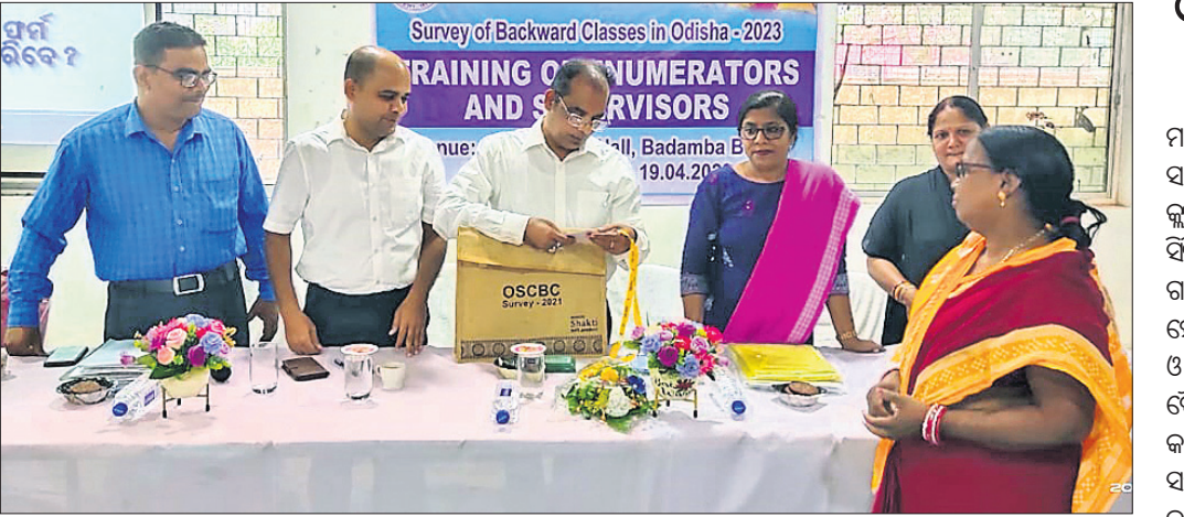
ବିପର୍ଯ୍ୟୟ ପ୍ରଶମନ ବିଭାଗ ଅତିରିକ୍ତ ସଚିବ ଅମିୟ କୁମାର ସାହୁ ଓ ଅନ୍ୟ ଅଧିକାରୀମାନେ ଅଙ୍ଗନୱାଡି କର୍ମୀଙ୍କ ସହ ଆଲୋଚନା କରୁଛନ୍ତି।