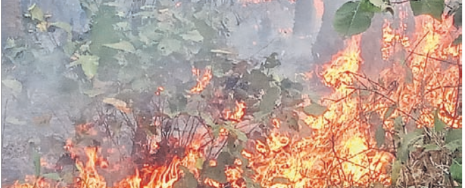
ଖୁଣ୍ଟଣା, ୨୦୧୪ (ଡି.ଏ.ଏ.)

ଆଠଗଡ଼ ବନାଞ୍ଚଳ ଅଧୀନ ଗରଡ଼ଝରି ଉପଖଣ୍ଡରୁ ଆଠଗଡ଼ ସୁବାସୀ ସଂରକ୍ଷିତ ଜଙ୍ଗଲରେ ଗୁରୁବାର ଅପରାହ୍ନରେ ଅଗ୍ନିକାଣ୍ଡ ଘଟିଛି। ଏଥିରେ ବହୁ ସଂଖ୍ୟକ ଗଛ ପୋଡି ଯାଇଥିବା ଜଣାପଡିଛି। ଅପରାହ୍ନ ପ୍ରାୟ ୨ଟାରେ ହଠାତ୍ ଜଙ୍ଗଲରେ ନିଆଁ ଲାଗିଥିବା ଅଗ୍ନିବାଣ୍ଟର କାରଣ ଅସ୍ପଷ୍ଟ ଥିବାବେଳେ ରିପୋର୍ଟ ଲେଖାଯିବା ବେଳକୁ ବିଭାଗକୁ ଜଣାଇଥିଲେ। ଖବରପାଇ