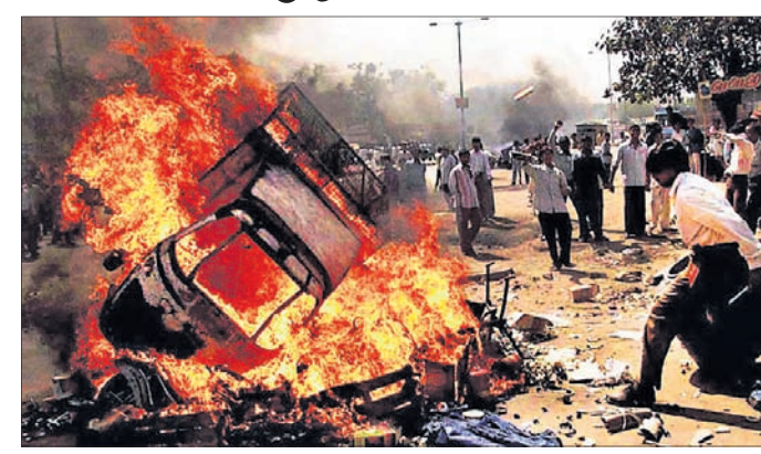
ନରୋଦା ଗାମ୍‌ରେ ଦଙ୍ଗା ବେଳର ଦୃଶ୍ୟ।

୨୦୧୦ରେ ଷ୍ଟେଶନ କୋର୍ଟରେ ଶୁଣାଣି ଆରମ୍ଭ ହୋଇଥିଲା। ୧୩ ବର୍ଷ ମଧ୍ୟରେ ୨ ବିଚାରପତି ବଦଳିଥିଲେ। ଏହି ମାମଲାରେ ୮୬ ଅଭିଯୁକ୍ତ ଥିଲେ, ଯାହାଙ୍କ ମଧ୍ୟରୁ ୧୮ ଜଣଙ୍କ ମୃତ୍ୟୁ ବିଚାର ସମୟ ଭିତରେ ହୋଇଥିଲା। ଅଭିଯୋଗନକାରୀ ଏବଂ ପ୍ରତିବାଦୀ ପକ୍ଷ ଓକିଲ ଯଥାକ୍ରମେ ୧୮୭ ଓ ୫୭ ସାକ୍ଷୀଙ୍କୁ ଜେରା କରିଥିଲେ। ଅନ୍ୟତମ। ସୁପ୍ରିମକୋର୍ଟ ଦ୍ୱାରା ନିମ୍ନରୁ ସ୍ୱତନ୍ତ୍ର ଦେଖିବା ଦଳ (ଏସ୍‌ଆଇଟି) ଏହାର ତତ୍ତ୍ୱ କରିଥିବାବେଳେ