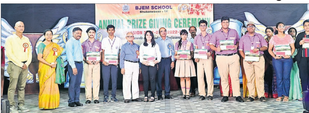
ପୁରସ୍କାର ବିତରଣ ଉତ୍ସବରେ ଅତିଥିକ ଗହଣରେ ପୁରସ୍କୃତ କୃତ ପ୍ରତିଯୋଗୀ ଓ ଅନ୍ୟମାନେ।

ଭୁବନେଶ୍ୱର, ୨୦୧୪ (ଭୁବନେ) ବକ୍ସି ଜଗବନ୍ଧୁ ଇଂରାଜୀ ମାଧ୍ୟମ ବିଦ୍ୟାଳୟର ଯୁବଶ୍ରୀ ଲକ୍ଷ୍ମଣ ବର୍ଷର ବାର୍ଷିକ ପୁରସ୍କାର ବିତରଣ ଉତ୍ସବ ଗୁରୁବାର ଉଦ୍ଘାଟିତ ହୋଇଯାଇଛି। ୨ଦିନ ଧରି ଆୟୋଜିତ ଏହି ଉତ୍ସବର ଉଦ୍ଘାଟନୀ ସନ୍ଧ୍ୟାରେ ପୁଖ୍ୟ