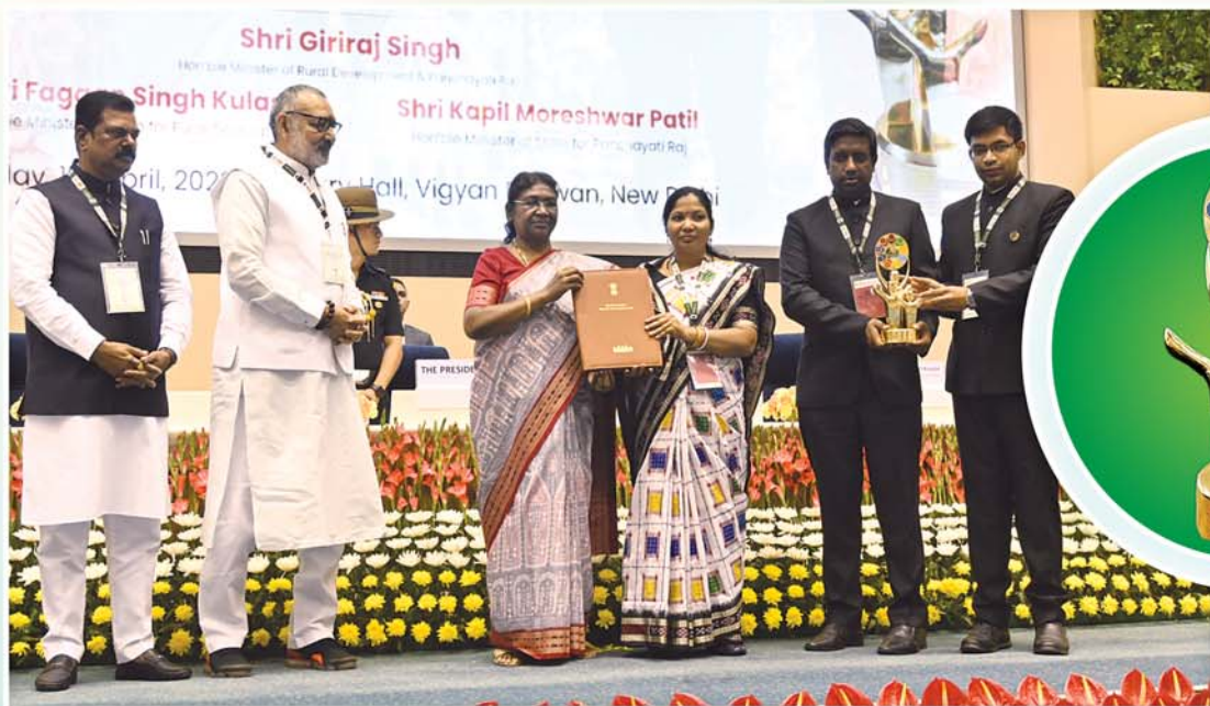
‘ଗିରୀଜା’ ଜିଲ୍ଲା ଦେଶର ଶ୍ରେଷ୍ଠ ଜିଲ୍ଲା ପରିଷଦ