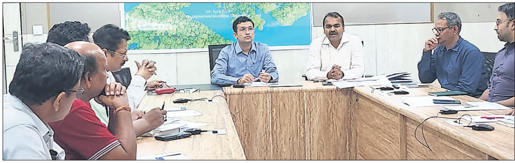
କାର୍ଯ୍ୟକ୍ରମରେ ଉପସ୍ଥିତ ଅଧିକାରୀ ଏବଂ ଅନ୍ୟମାନେ।