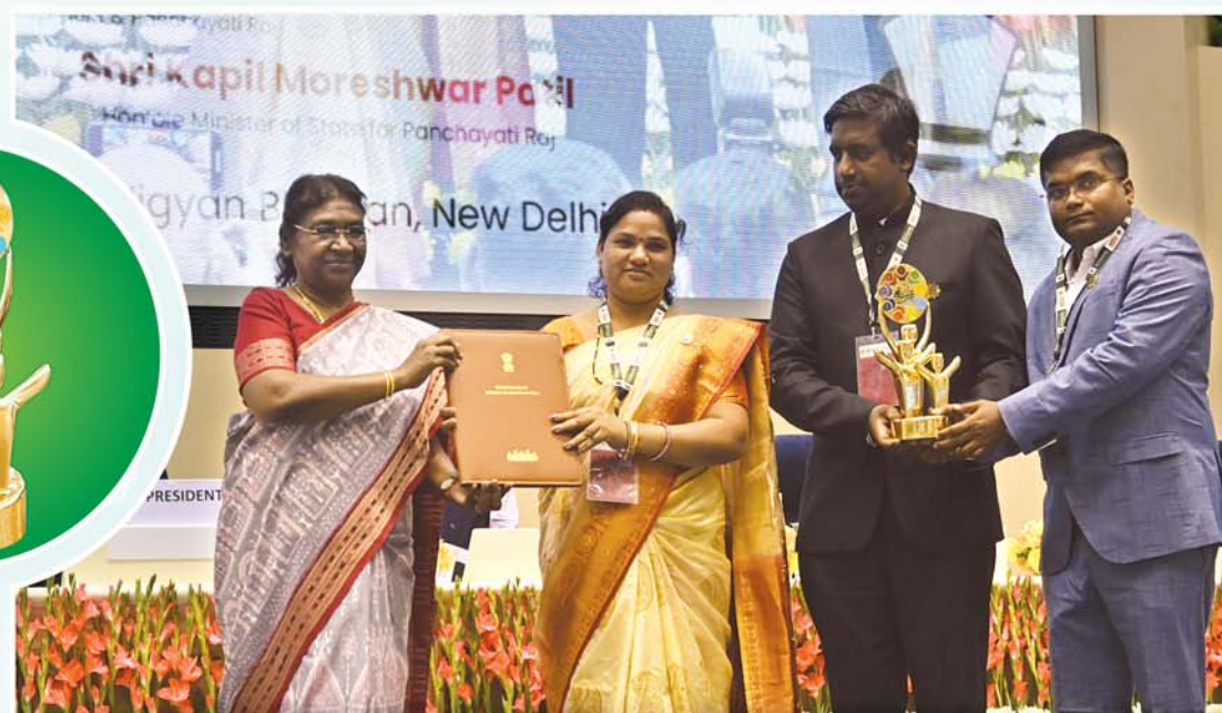
‘ହିଞ୍ଜିଳିକାଟୁ’ ଦେଶର ଶ୍ରେଷ୍ଠ ପଞ୍ଚାୟତ ସମିତି