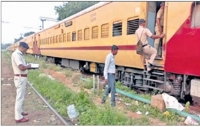
ଘଟଣାସ୍ଥଳରେ ଜିଆର୍ପି ପକ୍ଷରୁ ତଦନ୍ତ କରାଯାଇଛି।

ହତ୍ୟା ସନ୍ଦେହ, ରହସ୍ୟ ଖୋଜୁଛି ଜିଆର୍ପି ■ ମୃତ୍ୟୁର କାରଣ ଅସ୍ପଷ୍ଟ, ବ୍ୟବହୃତ ରିପୋର୍ଟକୁ ଅପେକ୍ଷା ■ ଟ୍ୟାଲେଟରେ ମୃତଦେହ ପଡ଼ିଥିବା ସଫୋଲ କର୍ମଚାରୀ ଦେଖିଥିଲେ