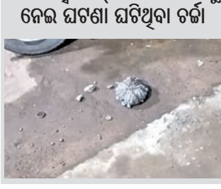
କବଚ ହୋଇଥିବା ବୋମା।

ତ୍ୟାଡ଼ି ବାଉଁଶରେ ପୂର୍ବରୁ ଘଟିଥିବା ବୋମା ପାଇଁ ଏହି ବୋମାମାଡ଼ ହୋଇଥିବା ସ୍ଥାନୀୟ ଲୋକେ କହିଛନ୍ତି। ଏପରିକି ଭିନ୍ନ ଭିନ୍ନ ରାତିରେ ଉକ୍ତ ହୋଟେଲର ତ୍ୟାଡ଼ି ବାଉଁଶରେ ଗଣ୍ଡଗୋଲ ଘଟିଥିବା ନିଜେ ରହିଛି। ତେଣୁ ବୋମାମାଡ଼ର ପ୍ରକୃତ କାରଣ ଜାଣିବା ପାଇଁ ପୋଲିସ୍ ତଦନ୍ତ ଚଳାଇଛି।