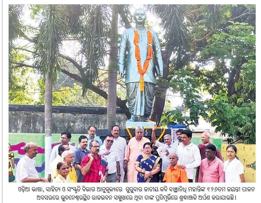
ଓଡ଼ିଆ ଭାଷା, ସାହିତ୍ୟ ଓ ସଂସ୍କୃତି ବିଭାଗ ଆନୁକୁଲ୍ୟରେ ଗୁରୁବାର ଜାତୀୟ କବି ବାସ୍ତାନିଧି ମହାଦିନି ୧୨୭ତମ ଜୟନ୍ତୀ ପାଳନ ଅବସରରେ ଭୁବନେଶ୍ୱରରୁ ଗାଜପତି ସମ୍ମୁଖରେ ଥିବା ତାଙ୍କ ପ୍ରତିମୂର୍ତ୍ତିରେ ଶ୍ରଦ୍ଧାଞ୍ଜଳି ଅର୍ପଣ କରାଯାଇଛି।