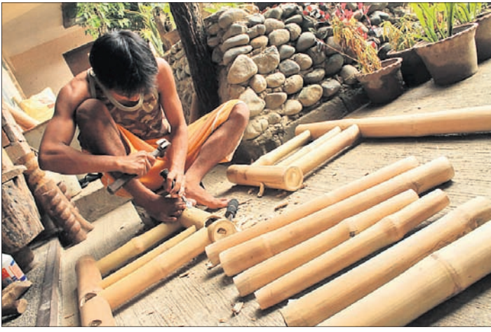
ଜଣେ କାରିଗର ବାଉଁଶ ସାମଗ୍ରୀ ତିଆରି କରୁଛନ୍ତି।

ହସ୍ତଶିଳ୍ପର ଆଦର ସବୁବେଳେ ରହିଛି। ତା'ର ଚାହିଦା ଆଗ ଅପେକ୍ଷା ବଢ଼ିବାରେ ଲାଗିଛି। ହସ୍ତଶିଳ୍ପ କଥା ହେଉ କି ହସ୍ତତନ୍ତ ସବୁଥିରେ ନୂଆ କୌଶଳର ପ୍ରୟୋଗ ଫଳରେ ଏହାକୁ ଲୋକେ ଅଧିକ ପସନ୍ଦ କରୁଛନ୍ତି। କାରିଗରଙ୍କ କଳାର ଯାବତ ଅବକାଶ କିଛି ବି ସୁନ୍ଦର ଓ ଆକର୍ଷଣୀୟ ସାମଗ୍ରୀରେ ପରିଣତ ହୋଇଥାଏ। ନିକଟରେ ଆୟୋଜିତ ବିଭିନ୍ନ ପ୍ରଦର୍ଶନୀରେ ବାଉଁଶକୁ ତିଆରି ଅନେକ ପ୍ରକାରର ସାମଗ୍ରୀ ବିକ୍ରି ହେଉଥିବା ଦେଖିବାକୁ ମିଳୁଥିଲା। ବାଉଁଶ କଥା କହିଲେ ମନକୁ ସଙ୍ଗେ ସଙ୍ଗେ ଆସିଯାଏ ଯଦିକରଣୀ ସାମଗ୍ରୀ, ଯେମିତିକି ଚୁଡ଼ି, ପାଞ୍ଜିଆ, ଡାଲି, କୁଲା, ମେଜ ଆଦି। କିନ୍ତୁ ଏବେ ବାଉଁଶରେ ବିଭିନ୍ନ ପ୍ରକାର ଡିଜାଇନ୍ ଆକାଶର ଆଦର ପ୍ରକାଶ ହୋଇଛି। ଆଦିବାସୀ କାରିଗରଙ୍କ ପାଇଁ ଏକ ଭିନ୍ନ ଅନୁଭବ ଆଣିଦେବା ସହ ଲୋକଙ୍କୁ ଚିତାଚରିତ କରିବାକୁ ନୂଆ ଭେଦ ଦେଉଛି। ଏହା ବ୍ୟତୀତ ବାଉଁଶ ଶିଳ୍ପ ହାଲୁକା, ଉଚ୍ଚ ପ୍ରସାରଣ, ଦୀର୍ଘସ୍ଥାୟୀ ଓ ପରିବେଶ ଅନୁକୂଳ। ପ୍ରାଚୀନ ସମୟରୁ ବାଉଁଶ ଆମ ବ୍ୟବହାରିକ ଜୀବନରେ ଏକ ଗୁରୁତ୍ୱପୂର୍ଣ୍ଣ ସ୍ଥାନ ନେଇଛି। ଏବେ ଏହା ରୋଜଗାରର ବାଟ ଫିଟାଉଛି। ଆଦିବାସୀ ବଜାରରୁ ଆରମ୍ଭ ହୋଇଥିବା ବାଉଁଶ ଶିଳ୍ପର ଚାହିଦା ବୃଦ୍ଧି ହେବା ସହ ନୂଆ ଉତ୍ପାଦ ସୃଷ୍ଟି ହେଉଛି। ହସ୍ତଶିଳ୍ପ ନିର୍ଦ୍ଦେଶକଙ୍କର ଥିବା ହସ୍ତତନ୍ତ, ହସ୍ତକଳା, ବୟନ ଶିଳ୍ପ ପକ୍ଷରୁ ବାଉଁଶ ଶିଳ୍ପର ପ୍ରଚାର ପ୍ରସାର ଏବଂ କାରିଗରମାନଙ୍କୁ ପ୍ରଶିକ୍ଷଣ ଦିଆଯିବା ସହ ଶ୍ରମିକ ସୁରକ୍ଷା ପ୍ରଦାନ କରାଯାଇଛି। ଏଥିପାଇଁ ଓଡ଼ିଶା ବାଉଁଶ ଉତ୍ପାଦନ ସଂଘ (ଓଡିଏସ) ଏବଂ ଓଡ଼ିଶା ମିନେରାଲ ଡିଭିଜନ୍ ଏରିଆଲ୍ ଡେଭଲପମେଣ୍ଟ କର୍ପୋରେସନ