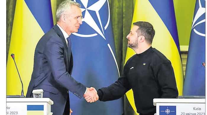
ନାଟୋ ମହାସଚିବ ଜେନ୍ସ୍ ଷ୍ଟୋଲଟେନ୍‌ବର୍ଗ ୟୁକ୍ରେନ୍ ଗସ୍ତ କରି ରାଷ୍ଟ୍ରପତି ଭୋଲୋଡିମିର ଜେଲେନ୍ସ୍କିଙ୍କୁ ଭେଟିଛନ୍ତି।

ନର୍ଥ ଆଟଲାଣ୍ଟିକ୍ ଟ୍ରିଟି ଅର୍ଗାନାଇଜେସନ୍ (ନାଟୋ) ମହାସଚିବ ଜେନ୍ସ୍ ଷ୍ଟୋଲଟେନ୍‌ବର୍ଗ ଗୁରୁତାର ମୁଖ୍ୟ ପ୍ରଭାବିତ ୟୁକ୍ରେନ୍ ଗସ୍ତ କରି ରାଷ୍ଟ୍ରପତି ଭୋଲୋଡିମିର ଜେଲେନ୍ସ୍କିଙ୍କୁ ଭେଟିଛନ୍ତି। ୨୦୨୨ ଫେବୃୟାରୀ ୨୪ରେ ରୁଷିଆର ୟୁକ୍ରେନ୍ ଆକ୍ରମଣ ପରେ ଏହା ହେଉଛି ନାଟୋ ମୁଖ୍ୟଙ୍କ ପ୍ରଥମ କିଭ୍ ଗସ୍ତ। ଏହି ଅବସରରେ ସେ ୟୁକ୍ରେନ୍ ପ୍ରତି ସାମରିକ ମେଣ୍ଟର ସମର୍ଥନକୁ ଦୋହରାଇଛନ୍ତି। ୟୁକ୍ରେନ୍ ପ୍ରାଣ ହରାଇଥିବା ୟୁକ୍ରେନ୍‌ର ସୈନ୍ୟଙ୍କ ସମାଧିସ୍ଥଳରେ ଷ୍ଟୋଲଟେନ୍‌ବର୍ଗ ଶ୍ରଦ୍ଧାଞ୍ଜଳି ଦେଇଛନ୍ତି। ଏଥିସହ କିଭ୍‌ର ମାଇକେଲ୍ ଷ୍ଟୋଲଟେନ୍‌ବର୍ଗ ରଖାଯାଇଥିବା ରୁଷିଆ ସେନା ଯାନଗୁଡ଼ିକୁ ଦେଖିଛନ୍ତି। ତେବେ ସେ ନିଜ ଗସ୍ତ ସମ୍ପର୍କିତ ଲକ୍ଷ୍ୟ ନେଇ ତତ୍କାଳ କୌଣସି ଘୋଷଣା କରିନାହାନ୍ତି।