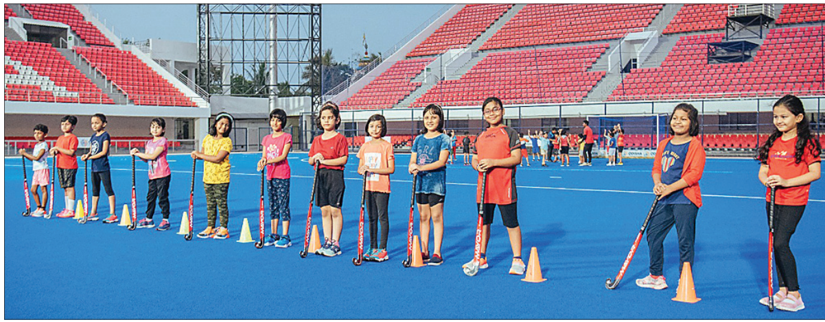
କଳିଙ୍ଗ ଷ୍ଟାଡ଼ିୟମରେ ଅନୁଷ୍ଠିତ ହେଉଥିବା ସମର କ୍ୟାମ୍ପରେ ଭାଗ ନେଇଥିବା ପିଲାମାନେ।

ରାଜ୍ୟ ସରକାରଙ୍କ କ୍ରୀଡ଼ା ବିଭାଗ ପକ୍ଷରୁ କଳିଙ୍ଗ ଷ୍ଟାଡ଼ିୟମରେ ବିଭିନ୍ନ କ୍ରୀଡ଼ାପାଇଁ ସମର କ୍ୟାମ୍ପ ଆୟୋଜନ କରାଯାଇଛି। ଫଳରେ ଖେଳରେ ରୁଚି ରଖୁଥିବା ପିଲାମାନଙ୍କ ପାଇଁ ଗ୍ରୀଷ୍ମାବକାଶ ସମୟରେ ସେମାନଙ୍କ ପସନ୍ଦର ଗେମ୍ ସମ୍ପର୍କରେ ବିସ୍ତୃତ ଜ୍ଞାନ ଆହରଣର ସୁଯୋଗ ସୃଷ୍ଟି କରାଯାଇଛି। ନେ' ୧୭ ବର୍ଷରୁ ଆଧିକାରୀ କ୍ରୀଡ଼ାର ସମର କ୍ୟାମ୍ପ ଆୟୋଜନ ହେବାକୁ ଯାଉଛି। ଏଥିରେ ଆଧିକାରୀ, ଭାରୋତୋଳନ, ପୁଟ୍‌ବଲ, ବାସ୍କେଟବଲ, କବାଡି, ଜୁଡୋ, ଜିମ୍ନାଷ୍ଟିକ୍ସ ଓ ଭଲିବଲ ଆଦି ଖେଳର କ୍ୟାମ୍ପ ହେବ।