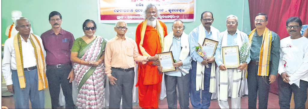
ଅତିଥିକ ଗହଣରେ ସମ୍ବର୍ଦ୍ଧିତ ବ୍ୟକ୍ତିତ୍ୱ ଏବଂ ଅନ୍ୟମାନେ।

ଭୁବନେଶ୍ୱର(ସ୍ୱ.ବୋ.) / ସୁରକ୍ଷା ଭୁବନେଶ୍ୱର, ୨୦।୪(ଡି.ଏନ୍.ଏ.)