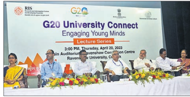
କାର୍ଯ୍ୟକ୍ରମରେ ମଞ୍ଚାସୀନ ଅତିଥିବୃନ୍ଦ।