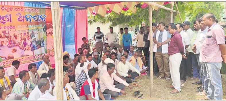
କେନ୍ଦ୍ରାପଡ଼ା ଜିଲ୍ଲା ରାଜକନିକା ତହସିଲ ସମ୍ମୁଖରେ ଚାଷୀମାନେ ଚିକିତ୍ସା ଘେରି ଉଲ୍ଲେଖ ଦାବି ଆମରଣ ଅନଶନରେ ବସିଛନ୍ତି ।

ଚିକିତ୍ସା ଗଣ ହେବା ଦ୍ୱାରା ଯନ୍ତ୍ରଗ୍ରସ୍ତ ହେଉଛି ଚାଷୀ । ଉତୁଡ଼ିଯାଇ ଶାରଦ, ଡାକ୍ତରୀ ଧାନ, ମୁଗ, ବିରି, ସୂର୍ଯ୍ୟମୁଖୀ, ଆଳୁ, ପନିପତଳା, ବାଦାମ ଏବଂ ଆହୁରି ଅନେକ ଫସଲ । ଚାଷକରି ଜୀବିକା ନିର୍ବାହ କରି ପରିବାର ପ୍ରତିପୋଷଣ କରୁଥିବା ଚାଷୀ ଆଜି ବାରଦୁଆର ଶୁଖିପିଆ ହେଉଛି । ଚିକିତ୍ସା ଚାଷୀ ମାଲମାଲ ହେଉଛନ୍ତି । ପ୍ରଶାସନ ସବୁ ଜାଣି ନ ଜାଣିଲା ପରି ନିଦାବିଷ୍ଣୁ ସାଜିଛି । ଚିକିତ୍ସାଗଣ ପାଇଁ ବ୍ୟବହୃତ ରାସାୟନିକ ପଦାର୍ଥ ମିଶ୍ରଣ ଜଳ ନଦୀ ଓ ନାଳକୁ ଛାଡ଼ି ମଧୁର ଜଳକୁ ପ୍ରଦୂଷିତ କରି ଦେଉଥିବା ଶତାଧିକ ଚାଷୀ ଅଭିଯୋଗ କରିଛନ୍ତି । ଚିକିତ୍ସା ଘେରିଗୁଡ଼ିକୁ ଉଲ୍ଲେଖ ଦାବିରେ ଚାଷୀମାନେ ଗୁରୁବାର ରାଜକନିକା ତହସିଲ କାର୍ଯ୍ୟାଳୟ ସମ୍ମୁଖରେ ଆମରଣ ଅନଶନ କରିଥିବା ଦେଖାଯାଉ ନିଳିଛି ।