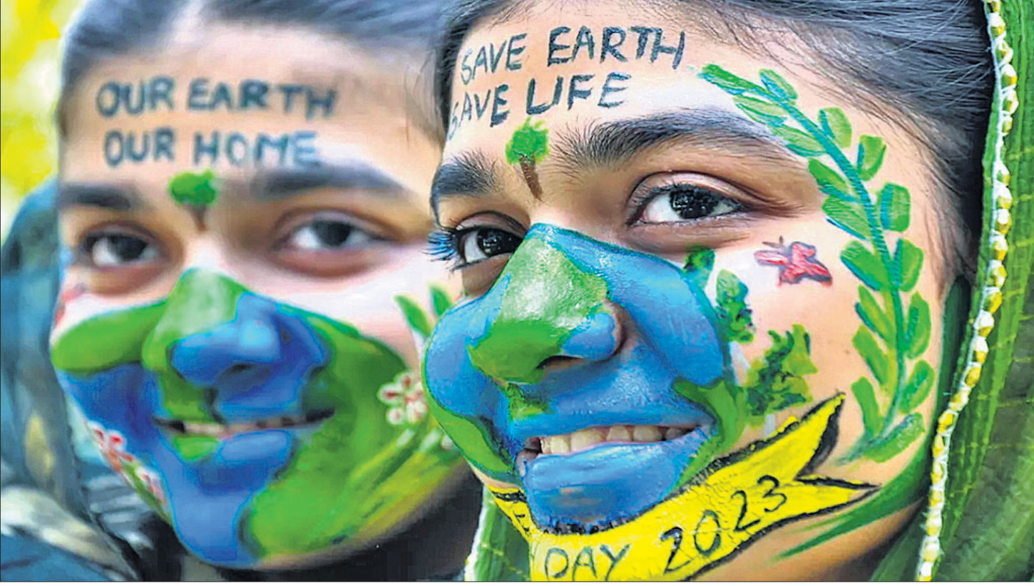
'ଧରତ୍ରି ଦିବସ'ର ଅବ୍ୟବହୃତ ପୂର୍ବରୁ ଶୁକ୍ରବାର ଉତ୍ତରପ୍ରଦେଶର ମୋରାଦାବାଦରେ ଯୁବକମାନେ ପୃଥିବୀ ବଞ୍ଚାଇବାର ବାର୍ତ୍ତାକୁ ପୁଅରେ ଚିତ୍ରଣ କରି ସଚେତନତା ସୃଷ୍ଟି କରୁଛନ୍ତି।

ଭୁବନେଶ୍ୱର, ୨୧୧୪(ଭୁବନେ) ଓଡ଼ିଶା ମେଡିକାଲ ଆଣ୍ଡ ହେଲ୍ଥ ସର୍ଭିସ (ଓଏସଏସଏସ)ରେ କାର୍ଯ୍ୟରତ ଡାକ୍ତରଙ୍କୁ ଏଣିକି କ୍ୟାରିୟର ମଧ୍ୟରେ ୪ଥର ପ୍ରମୋଶନ ମିଳିବ। ପୂର୍ବରୁ ସେମାନଙ୍କୁ ତାଲମାନିକ୍ ଆସ୍ପିରାନ୍ସ କ୍ୟାରିୟର ପ୍ରୋଗ୍ରେସନ (ଡିଏସିପି) ଯୋଜନାରେ ୩ଥର ପ୍ରମୋଶନ ମିଳୁଥିଲା। ମାତ୍ର ଏବେ ୨୪ବର୍ଷର କ୍ୟାରିୟର ମଧ୍ୟରେ ସେମାନଙ୍କୁ ୪ଥର ପ୍ରମୋଶନ ମିଳିବ। ଏନେଇ ଶୁକ୍ରବାର ସ୍ୱାସ୍ଥ୍ୟ ଓ ପରିବାର କଲ୍ୟାଣ ବିଭାଗ ପକ୍ଷରୁ ଶୁକ୍ରବାର ବିଜ୍ଞପ୍ତି ପ୍ରକାଶ ପାଇଛି। ଓପିଏସଏସ କର୍ମୀମାନେ ନିୟୁତ୍ତି ପରଠାରୁ ଏହି ସୁବିଧା ପାଇପାରିବେ। ପୂର୍ବରୁ ତାଲମାନେ କ୍ୟାରିୟରର ୭, ୧୪ ଓ ୨୧ବର୍ଷରେ ପଦୋତ୍ତୀ ପାଇଥିଲେ। ଅର୍ଥାତ୍ ୨୧ବର୍ଷରେ ଥରେ ପ୍ରମୋଶନ ହେଉଥିଲା। ମାତ୍ର ଏବେ ପ୍ରତି ୬ ବର୍ଷରେ ଅର୍ଥାତ୍ ଚାକିରିର ୬, ୧୨, ୧୮ ଓ ୨୪ବର୍ଷରେ ସେମାନଙ୍କୁ ପଦୋତ୍ତୀ ମିଳିବ। ଡିଏସିପି ନିୟମ ଲାଗୁ ହେବା ପରେ ଡାକ୍ତରମାନେ ଅଧିକ ପାରିଦର୍ଶିତା ବେଶ୍ୟାରେ ସେହିପରି ନୂଆ ଡିଏସିପିରେ କ୍ୟାରିୟର ସହ ଅଧିକ ସୁବିଧା ମଧ୍ୟ ପାଇପାରିବେ। ୬ବର୍ଷ ନିୟମିତ ଚାକିରି ପରେ ଲେଭଲ-୧୨ରୁ ୧୩କୁ ପ୍ରମୋଶନ ଚଳୁଛି।