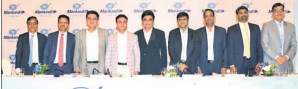
ଏମ୍ପିଏଲ୍ ଆଇପିଓ ଘୋଷଣା ଅବସରରେ କମ୍ପାନୀର ବରିଷ୍ଠ ପଦାଧିକାରୀମାନେ ଉପସ୍ଥିତ ଅଛନ୍ତି।