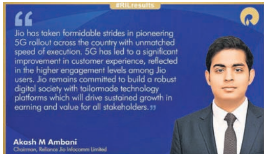
Akash M Ambani Chairman, Reliance Jio Infocomm Limited