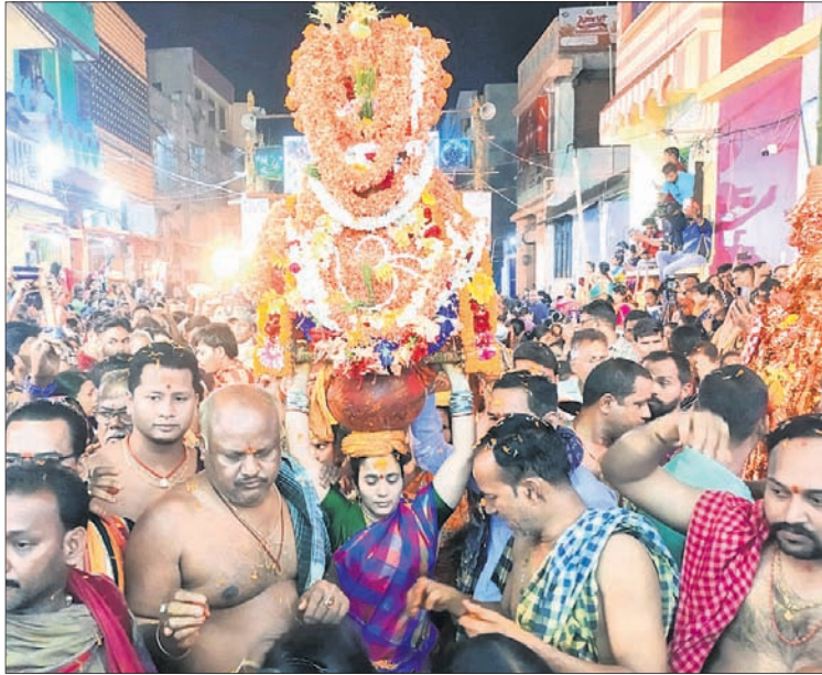
ମା'ଙ୍କ ଘଟକୁ ସାହି ପରିକ୍ରମା କରାଯାଇଛି।