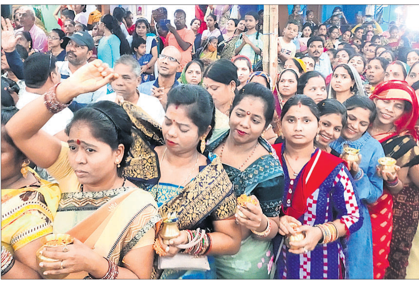
ମା'ଙ୍କ ଦର୍ଶନ କରିବାକୁ ଆସିଥିବା ଶ୍ରଦ୍ଧାଳୁ।