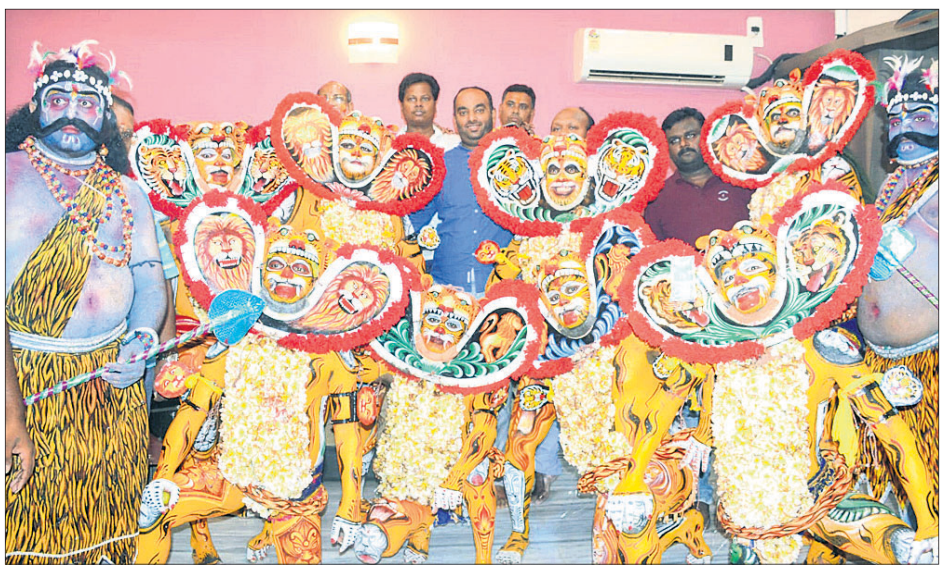
ବାଘ ଓ ଶବର ବେଶ।

ବ୍ରହ୍ମପୁର ଅଫିସ, ୨୧୪: ମହାରାଜା କୃଷ୍ଣଚନ୍ଦ୍ର ଗଜପତି(ଏମ୍ବେସିଜି) ମେଡିକାଲ ହସ୍ପିଟାଲରେ ଶୁକ୍ରବାର ଅଗ୍ନିକାଣ୍ଡ ଘଟିଛି। କୁକର ଘିଅ ବିଭାଗ ପଛପଟେ ଥିବା ଏସି ମେଶିନ ଜଳି ଯାଇଛି। ଅଗ୍ନିଶମ କର୍ମଚାରୀ ପହଞ୍ଚି ନିଆଁକୁ ଆୟତ୍ତ କରିଥିଲେ। ମଧ୍ୟାହ୍ନରେ ହଠାତ୍ କୁକ ବାହାର ପଟେ ଲାଗିଥିବା ଏସି ମେଶିନରୁ ଧୂଆଁ ବାହାରିଥିବା ଦେଖିବାକୁ ମିଳିଥିଲା। ଏହା ଦେଖି ସୁରକ୍ଷା କର୍ମୀ ସେଠାରେ ପହଞ୍ଚି ବିଦ୍ୟୁତ୍ ସଂଯୋଗ ବିଚ୍ଛିନ୍ନ କରିଥିଲେ। ଫଳରେ ନିଆଁ ଭିତରକୁ ବ୍ୟାପି ନ ଥିଲା। ମାତ୍ରାଧିକ ଲୋଡ଼ ଯୋଗୁ ଶରଣାର୍ଥୀଙ୍କୁ ଏଭଳି ଅଗ୍ନିକାଣ୍ଡ ଘଟିଥିବା ଅନୁମାନ କରାଯାଇଛି।