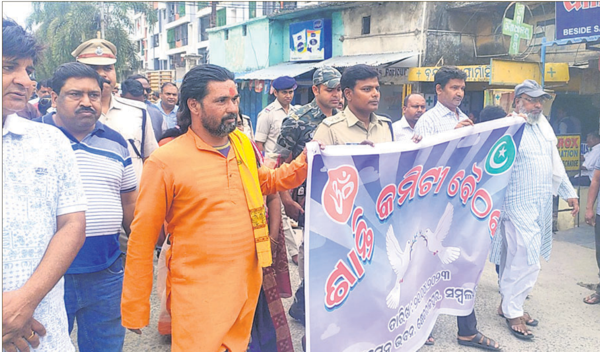
ସମଲପୁର ବଡ଼ବଜାରରେ ଶାନ୍ତି ଶୋଭାଯାତ୍ରା।