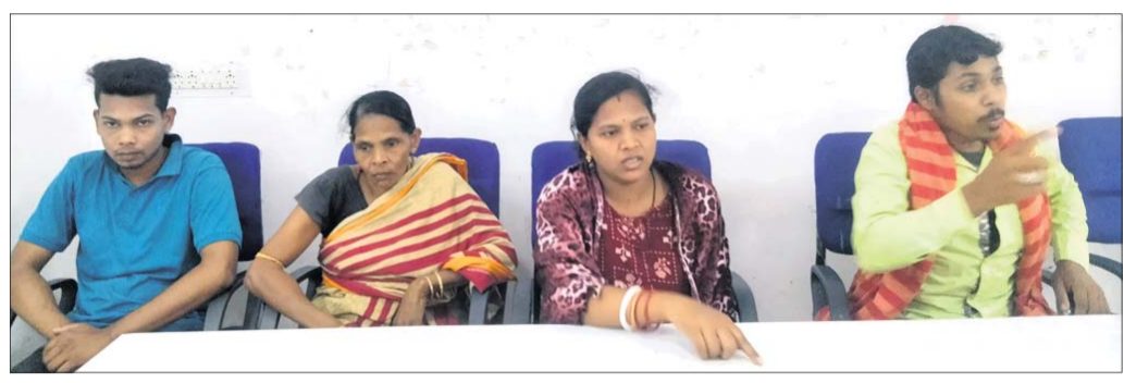
ଖବରଦାତା ସମ୍ମିଳନୀରେ ଲିପକଙ୍କ ପରିବାର ।