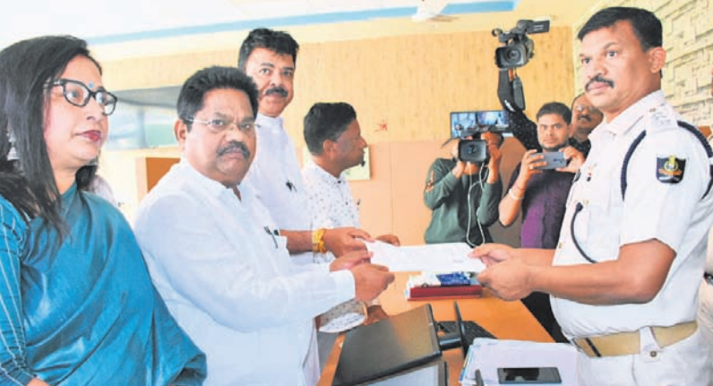
କ୍ୟାପିଟାଲ ଆନାୟକାରୀଙ୍କୁ ଶୁକ୍ରବାର ଏତଲା ପ୍ରଦାନ କରୁଛନ୍ତି ଭାଜପା ପ୍ରତିନିଧି ଦଳ।