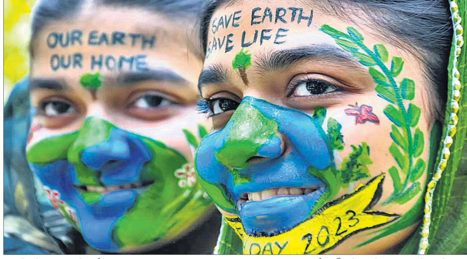
'ଧାରତ୍ରୀ ଦିବସ'ର ଅବ୍ୟବହୃତ ପୂର୍ବରୁ ଶୁକ୍ରବାର ଉତ୍ତରପ୍ରଦେଶର ମୋରାଦବାଦରେ ସୁବର୍ଣ୍ଣାମାଳେ ପୃଥ୍ୱୀ ବ୍ୟାକାସର ବାର୍ତ୍ତାକୁ ପୁଅରେ ରିପ୍ରେଜେଣ୍ଟ କରି ସଚେତନତା ସୃଷ୍ଟି କରୁଛନ୍ତି।

ସଲମାନ୍ ଶାନ୍ ଦିବ୍ୟାଙ୍କା ପିଲାଙ୍କ ପାଇଁ ଫିଲ୍ମ 'କିସି କା ଭାଲ କିସି କି କାନ୍'ର ସେବାନ୍ ସ୍ତ୍ରୀନ୍ତ ବ୍ୟବସ୍ଥା କରି ତାଙ୍କୁ ସରପ୍ରାଇଜ୍ ଦେଇଛନ୍ତି।