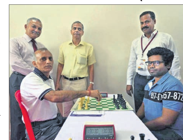
ଅତିଥି ଓ ଟପ୍ ପିଲ୍ଡ ଖେଳାଳି ଗୋଟି ଚଳାଇ ଟୁର୍ନାମେଣ୍ଟ ଉଦଘାଟନ କରୁଛନ୍ତି ।

ଅଲ୍ ଓଡ଼ିଶା ଟେବ୍ଲିଆରମ୍ ଆୟୋଜିତ ଓ ସର୍ବଭାରତୀୟ ଟେବ୍ଲିଆରମ୍ ଫେଡରେଶନ ସହଯୋଗରେ ଆଇଆଇଇ ଷ୍ଟୋର୍ଟ୍ସ ଏକାଡେମୀ ଆନୁକୂଲ୍ୟରେ ପ୍ରଥମ କେଟି ଗ୍ଲୋବାଲ ସର୍ବଭାରତୀୟ ଓପନ ଫିଡେ ରେଟିଂ ଟେବ୍ଲିଆରମ୍ ଷ୍ଟୁଡିଓ ଆରମ୍ଭ ହୋଇଛି।