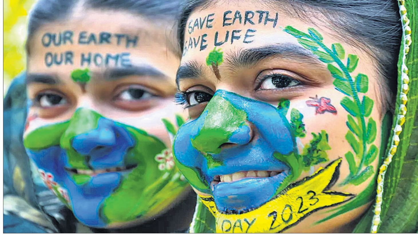
'ଧରତ୍ରି ଦିବସ'ର ଅବ୍ୟବହୃତ ପୂର୍ବରୁ ଶୁକ୍ରବାର ଉତ୍ତରପ୍ରଦେଶର ମୋରାବାଦୀରେ ଯୁବମାନେ ପୃଥିବୀ ବଞ୍ଚାଇବାର ବାର୍ତ୍ତାକୁ ପୁଅରେ ଚିତ୍ରଣ କରି ସଚେତନତା ସୃଷ୍ଟି କରୁଛନ୍ତି।

ଭୁବନେଶ୍ୱର, ୨୧।୪ (ବୁଧବୋ) ଓଡ଼ିଶା ମେଡିକାଲ ଆଣ୍ଡ ହେଲ୍ଥ ସର୍ଭିସ (ଓଏସଏସଏସ)ରେ କାର୍ଯ୍ୟରତ ଡାକ୍ତରଙ୍କୁ ଏଣିକି କ୍ୟାରିୟର ମଧ୍ୟରେ ୪ଥର ପ୍ରମୋଶନ ମିଳିବ। ପୂର୍ବରୁ ସେମାନଙ୍କୁ ତାଲମାନିକ୍ ଆସ୍ପିରାଣ୍ଟ କ୍ୟାରିୟର ପ୍ରୋଗ୍ରେସନ (ଡିଏସିପି) ଯୋଜନାରେ ୩ଥର ପ୍ରମୋଶନ ମିଳୁଥିଲା। ମାତ୍ର ଏବେ ୨୪ବର୍ଷର କ୍ୟାରିୟର ମଧ୍ୟରେ ସେମାନଙ୍କୁ ୪ଥର ପ୍ରମୋଶନ ମିଳିବ। ଏନେଇ ଶୁକ୍ରବାର ସ୍ୱାସ୍ଥ୍ୟ ଓ ପରିବାର କଲ୍ୟାଣ ବିଭାଗ ପକ୍ଷରୁ ଶୁକ୍ରବାର ବିଜ୍ଞପ୍ତି ପ୍ରକାଶ ପାଇଛି। ଓପିଏସଏସ କର୍ମୀଙ୍କୁ ନିମ୍ନ ଡିଏସିପି ପଦବୀରେ ପଦୋତ୍ତରଣ ପରଠାରୁ ଏହି ସୁବିଧା ପାଇପାରିବେ। ପୂର୍ବରୁ ତାଲମାନିକ୍ କ୍ୟାରିୟରର ୭, ୧୪ ଓ ୨୧ବର୍ଷରେ ପଦୋତ୍ତରଣ ପାଇଥିଲେ। ଅର୍ଥାତ୍ ୨୧ବର୍ଷରେ ଥରେ ପ୍ରମୋଶନ ହେଉଥିଲା। ମାତ୍ର ଏବେ ପ୍ରତି ୭ ବର୍ଷରେ ଅର୍ଥାତ୍ ଚାକିରିର ୭, ୧୨, ୧୮ ଓ ୨୪ବର୍ଷରେ ସେମାନଙ୍କୁ ପଦୋତ୍ତରଣ ମିଳିବ। ଡିଏସିପି ନିୟମ ଲାଗୁ ହେବା ପରେ ଡାକ୍ତରମାନେ ଅଧିକ ପାରିଦର୍ଶିତା ଦେଖାଇବେ। ସେହିପରି ନୂଆ ଡିଏସିପିରେ କ୍ୟାରିୟର ସହ ଅଧିକ ସୁବିଧା ମଧ୍ୟ ପାଇପାରିବେ। ୬ବର୍ଷ ନିୟମିତ ଚାକିରି ପରେ ଲେଭଲ-୧୨ରୁ ୧୩କୁ ପ୍ରମୋଶନ ଚଳୁଛି।