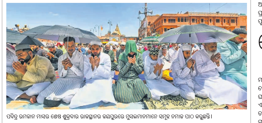
ପବିତ୍ର ରମଜାନ ମାସର ଶେଷ ଶୁକ୍ରବାର ରାଜସ୍ଥାନର ଜୟପୁରରେ ମୁସଲମାନମାନେ ସମୂହ ନମାଜ ପାଠ କରୁଛନ୍ତି।

କପି ତାଉନି ଷ୍ଟିଭ ଜାରି କରିଛନ୍ତି। ୨୦୧୯-୨୦୨୧ ମଧ୍ୟରେ ରାଏ ବ୍ରିଟେନର ବହିର୍ଦ୍ଦେଶୀୟ ମନ୍ତ୍ରୀ ଥିବାବେଳେ ନିଜ କର୍ମଚାରୀମାନଙ୍କ ସହ ଅତି ଅଶୋଭନୀୟ ବ୍ୟବହାର କରିଥିବା ଏଥିରେ କୁହାଯାଇଛି। ରାଏଙ୍କ ଇସ୍ତଫାପତ୍ରକୁ ଗ୍ରହଣ କରିବା ପରେ ସୁନକ ଦୃଶ୍ୟ ପ୍ରକାଶ କରିଛନ୍ତି। ୬ ମାସ ମଧ୍ୟରେ ସୁନକ କ୍ୟାବିନେଟରୁ ଏହା ଦୂଷ୍ଟ ସମ୍ପର୍କିତ ଅଭିଯୋଗପତ୍ରର ଏକ