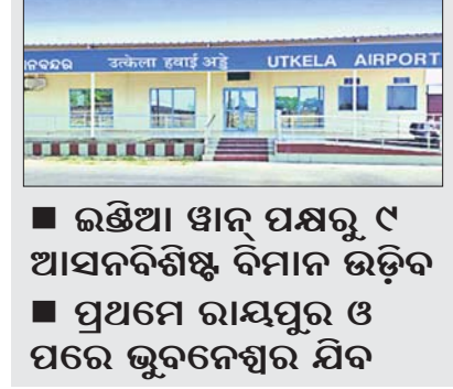
ଭବାନୀପାଟଣା, ୨୧/୪ (ସ.ପ୍ର.)

ଘାଟିରୁ ଅଟୋ ଓଲଟି ୩ ମୁତ, ୧୦ ଆହତ ହେବାର ସମ୍ଭାବନା ଉଚ୍ଚ। ଘାଟିରୁ ଅଟୋ ଓଲଟି ୩ ମୁତ, ୧୦ ଆହତ ହେବାର ସମ୍ଭାବନା ଉଚ୍ଚ। ଘାଟିରୁ ଅଟୋ ଓଲଟି ୩ ମୁତ, ୧୦ ଆହତ ହେବାର ସମ୍ଭାବନା ଉଚ୍ଚ।