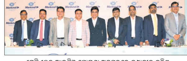
ଏମ୍ପିଏଲ୍ ଆଇପିଓ ଘୋଷଣା ଅବସରରେ କମ୍ପାନୀର ବରିଷ୍ଠ ପଦାଧିକାରୀମାନେ ଉପସ୍ଥିତ ଅଛନ୍ତି।