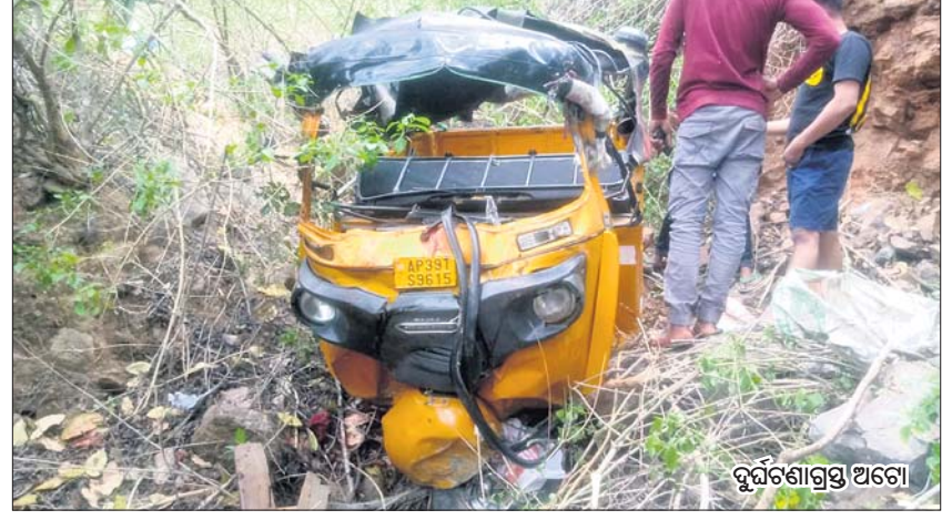
ଘାଟିରୁ ଅଟୋ ଓଲଟି ୩ ମୁତ, ୧୦ ଆହତ