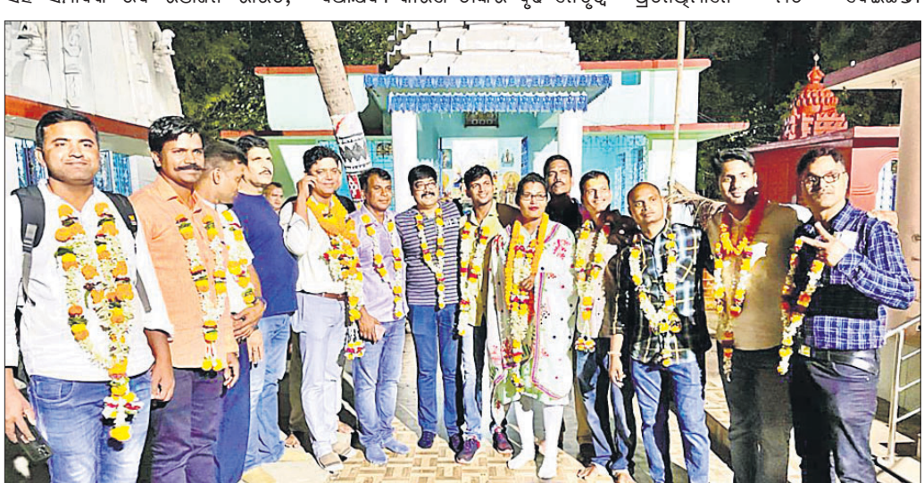
ଭୁବନେଶ୍ୱର ସହରାଞ୍ଚଳ ପୋଲିସ୍ ଲିମା କନ୍ଦୁସ ସଭାପତି ଓ ହାବିଲଦାର ସଂଘର ନବନିର୍ବାଚିତ କର୍ମକର୍ତ୍ତାମାନେ।

ସାରିଥିଲେ ବି ସମସ୍ୟା ଯେପରି ଥିଲା ସେହିପରି ଥିଲା। ଅପରପକ୍ଷେ ବିଏମ୍‌ସି ଅଫିସ୍ ଗଲେ ସେଠାରେ କମିଶନରଙ୍କ ଦେଖା ମିଳୁନା।