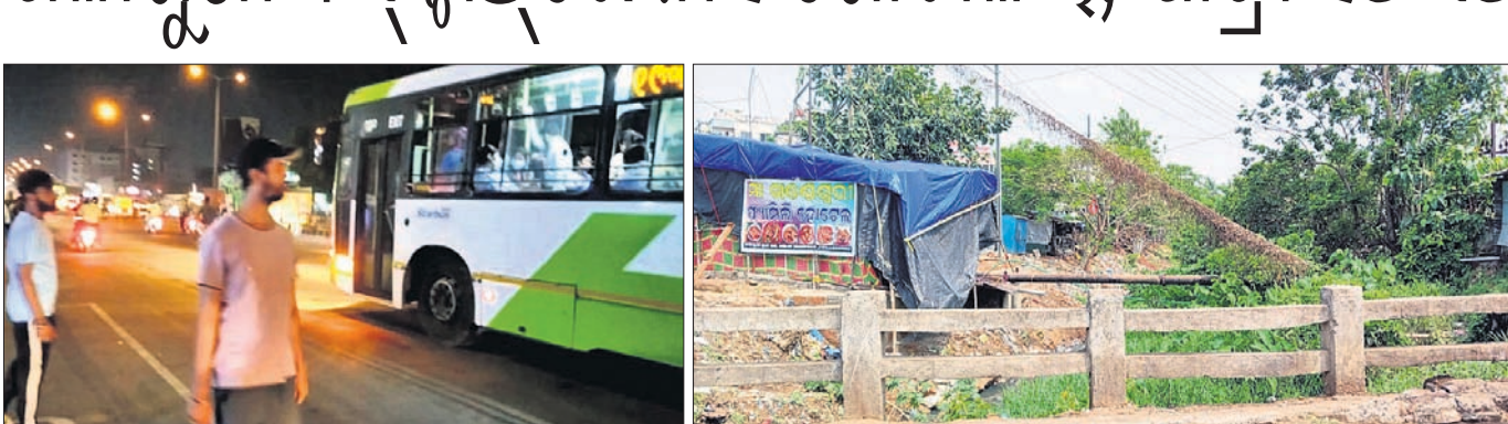
କାଗାଢ଼ି ରାଜପଥର ପଲ୍ଲୀଗୁଣୀ ଛକରେ ବସ୍ ଷ୍ଟାଣ୍ଡରୁ କିଛି ଯାତ୍ରୀ ବିଗ୍ରାମାଗାର ନ ଥିବାରୁ ଲୋକେ ରାସ୍ତା ଉପରେ ଅପେକ୍ଷା କରିଛନ୍ତି।