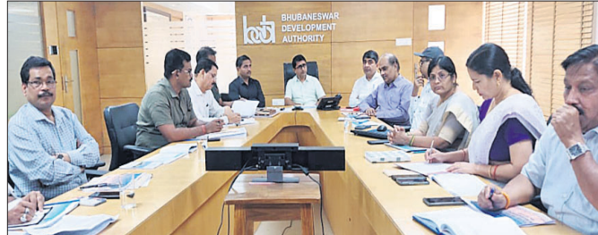
ଭୁବନେଶ୍ୱର, ୨୪୪ (ଭୁବନେଶ୍ୱର)