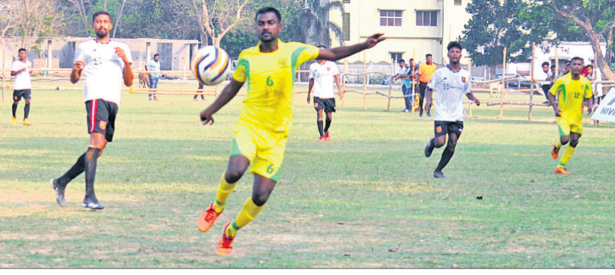
ସାହାଣୀ କପ୍ ଫୁଟବଲ: ବିଦ୍ୱାନାସୀ ଗ୍ରାମଭିତ୍ତରେ ଯୋଗଦାନ ବରଗଡ଼ ଓ ଗଞ୍ଜାମ ମଧ୍ୟରେ ଅନୁଷ୍ଠିତ ମ୍ୟାଚ।