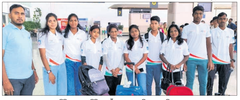
ଶ୍ରେଣୀ ଅଲିମ୍ପିକ୍ ଜାତୀୟ ଶିବିରପାଇଁ ନମୋନୀତ ଓଡ଼ିଶା ଖେଳାଳି ଓ ଅଧ୍ୟକ୍ଷମାନେ ।