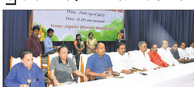
'ପ୍ରତିକାର'ର ସ୍ୱନକ୍ଷତ୍ର ଉତ୍ସବ ଏବଂ ଓଡ଼ିଶା ପ୍ରତିଭା ସମ୍ମାନ ସମାରୋହରେ ଉପସ୍ଥିତ ଅତିଥି

କର୍ମକ୍ରମ ସାମ୍ବନ୍ଧରେ ସମସ୍ତଙ୍କୁ ସମ୍ବୋଧନ କରି ସମାରୋହରେ ଉପସ୍ଥିତ ଅତିଥିଙ୍କୁ ଆଶ୍ୱାନ ଦେଇଥିଲେ।