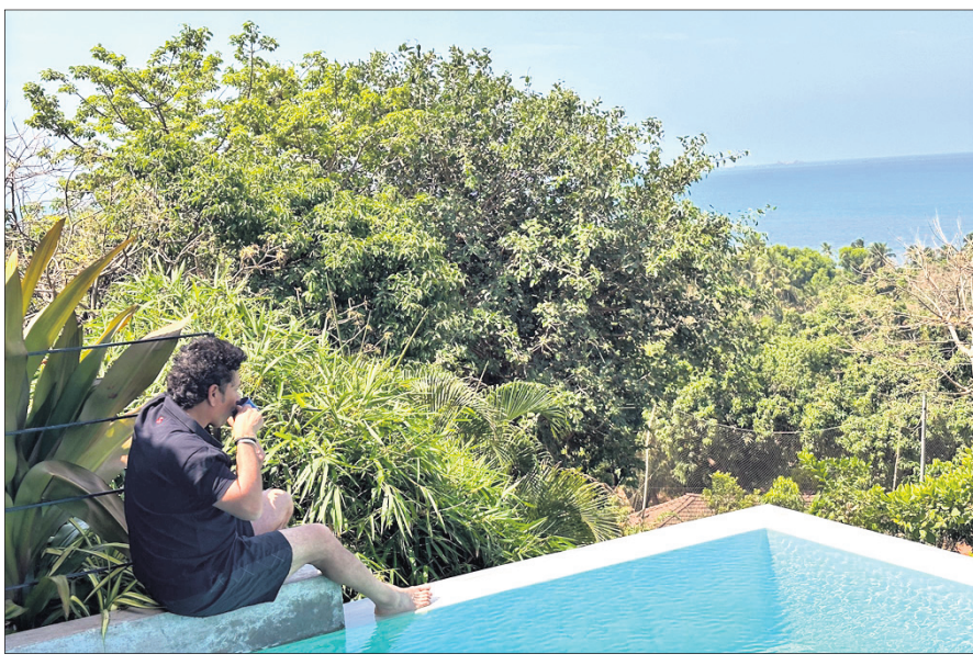
ପୂର୍ଣ୍ଣ ଟ୍ରିପ୍ଲ ଉପାଦାନ ଶିକ୍ଷା ବିରୋଧରେ ଆପିଲ୍‌ରେ ଯୋଗ ଦେଇଛନ୍ତି ସଚିନ ଟେଣ୍ଡୁଲକର।

କ୍ରିକେଟରେ ରେକର୍ଡର ମହତ୍ତ୍ୱପୂର୍ଣ୍ଣ କରିଥିବା ତଥା ଭାରତରେ କ୍ରିକେଟକୁ ଏକ ଧର୍ମରେ ପରିଣତ କରିଥିବା କ୍ରିକେଟର କିମ୍ବଦନ୍ତୀ ସଚିନ ଟେଣ୍ଡୁଲକର ନିଜ ଜନ୍ମଦିନ ସମ୍ପୂର୍ଣ୍ଣ ଏକାନ୍ତରେ ପାଳନ କରିଛନ୍ତି। ୨୪ ଏପ୍ରିଲରେ ନିଜର ୫୦ ତମ ଜନ୍ମଦିନ ପାଳନ କରିଥିଲେ ସଚିନ। ତେବେ ଆତ୍ମନିୟମ ପରିବେଶର କୋଳାହଳକୁ ଦୂରରେ ରଖି ନିଜର ଜନ୍ମଦିନ ପାଳନ କରିଛନ୍ତି। କେଉଁ ସ୍ଥାନରେ ସେ ଜନ୍ମଦିନ ପାଳନ କରିଛନ୍ତି ତାହା ସ୍ପଷ୍ଟ ହୋଇ ନ ଥିଲେ ମଧ୍ୟ ନିଜ ବାସଭବନର ପୂର୍ବ ଯାତ୍ରାରେ ସେ ଚା'ର ମଜା ରେସଲରେ ଓ ବର୍ତ୍ତମାନ ଭାଙ୍ଗିବା ବନ୍ଦ ସହିତ ସଂଶ୍ଳିଷ୍ଟ ବୃତ୍ତାନ୍ତରେ ଆତ୍ମନିୟମରେ ରେସଲର ଏବଂ ସରକାରଙ୍କ ମଧ୍ୟରେ ମଧ୍ୟସ୍ଥା କରିଥିଲେ। ମାତ୍ର ସେଥିରେ କିଛି ସୁଫଳ ମିଳି ନାହିଁ। ବୃତ୍ତାନ୍ତ ନିଜେ ଡିଏମ୍‌ଏସ୍‌ଆଇ ପୂର୍ଣ୍ଣ ଟ୍ରିପ୍ଲ ଉପାଦାନ ଶିକ୍ଷା ବିରୋଧରେ ଆପିଲ୍‌ରେ ଯୋଗ ଦେଇଛନ୍ତି। ବର୍ତ୍ତମାନ ସୁଦ୍ଧା ତାଙ୍କର ରେସଲର ରାଜନୀତି ପ୍ରତି ଅଧିକ ମୋହ ରହିଛି।