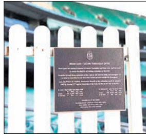
ସିଡିଏନ ଗେଟ୍ ଉନ୍ନୋତିତ ହୋଇଛି ।

ସିଦ୍ଧାନ୍ତ କ୍ରିକେଟ ଗ୍ରୀଷ୍ମକାଳୀନ ଶିବିରରେ ସିଡିଏନ ଗେଟ୍ ଉନ୍ନୋତିତ ହୋଇଛି ।