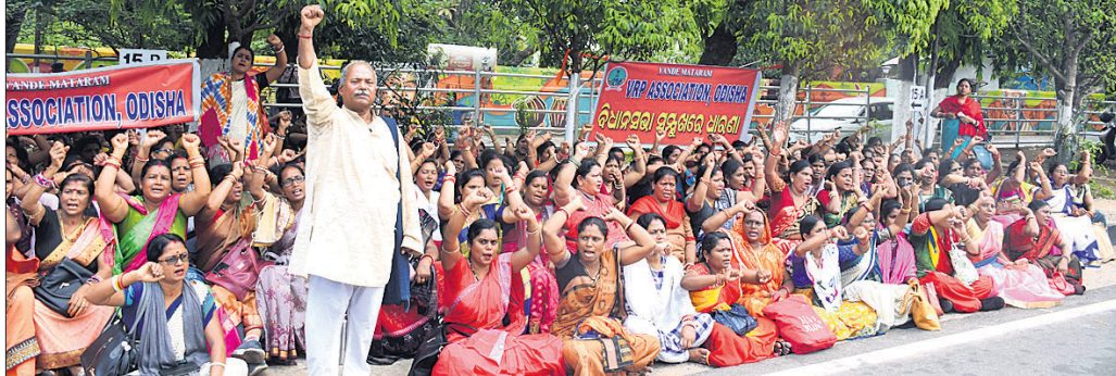
ଭୁବନେଶ୍ୱର, ୨୪୪ (ଭୁବନେଶ୍ୱର)

୬ ଦମ୍ପା ଦାସି ନେଇ ଭିକାରୀ ରିପୋର୍ଟ ପର୍ଯ୍ୟନ୍ତ (ଭିଆର୍‌ପି) ଆସୋସିଏଶନ ପକ୍ଷରୁ ଲୋକମାନଙ୍କୁ ଯୋଗାଣ କରାଯାଇଛି।