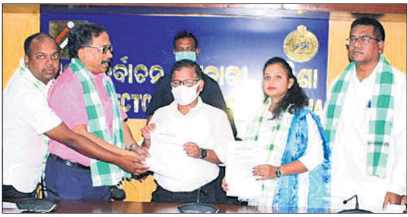
ସିଇଓଙ୍କୁ ଦାବିପତ୍ର ଦେଉଛନ୍ତି ବିଜେଡି ପ୍ରତିନିଧି ଦଳ ।