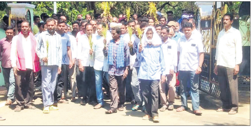
ଗାନ୍ଧୀମାନେ କ୍ଷତିଗ୍ରସ୍ତ ଧାନକେଶୀ ଧରି ଜିଲାପାଳଙ୍କ ଅଫିସରେ ପହଞ୍ଚିଲେ।

ବରଗଡ଼ ଅଫିସ, ୨୪୪୪ କାଳବୈଶାଖୀ ପ୍ରଭାବରେ ବରଗଡ଼ ଜିଲ୍ଲାରେ ବ୍ୟାପକ ଫସଲ କ୍ଷତି ହୋଇଛି। ଶନିବାର ସନ୍ଧ୍ୟାରେ କୁଆପଥର ସହ ବର୍ଷାହେବା ଯୋଗୁଁ ଧାନ ଫସଲ ଉତ୍ପାଦିତ ହୋଇଛି। ଅମଳକ୍ଷମ ଅବସ୍ଥାରେ ଥିବା ଧାନ ନଷ୍ଟ ହୋଇଯାଇଛି। ପରିବା ଫସଲ ମଧ୍ୟ ଏଥିରୁ ବାଦ୍ ପଡ଼ିନାହିଁ। ପୋଟେ, ବାଇଗଣ, ଚମାଚୋ ଆଦି ବିଶେଷ ପ୍ରଭାବିତ ହୋଇଛି। ଜିଲାର ଅତୀତ, ବରଗଡ଼, ବରପାଲି, ବିଜେପୁର କୁଳ ଏଥିରେ ଅଧିକ ପ୍ରଭାବିତ ହୋଇଛି। ଅନ୍ୟପକ୍ଷେ ଜିଲ୍ଲାରେ ଧାନ ସଂଗ୍ରହ ପ୍ରକ୍ରିୟାକୁ ଆଉ ମାତ୍ର ୨ ସପ୍ତାହ ବାକି ଥିବାବେଳେ ଫସଲ କ୍ଷତି ଗଣ୍ୟ ଥିବାରୁ ମେଡ଼ିକାଲ ଡିପାର୍ଟମେଣ୍ଟରୁ ଉତ୍ପାଦିତ ଧାନକୁ କ୍ଷତିଗ୍ରସ୍ତ ଗାନ୍ଧୀଙ୍କୁ ଉତ୍ତମ ଶ୍ରଦ୍ଧାପୂର୍ବକ ପ୍ରଦାନ କରି ଦେବାକୁ ପଡ଼ିବ। କ୍ଷତିଗ୍ରସ୍ତ ଗାନ୍ଧୀଙ୍କୁ ଉତ୍ତମ ଶ୍ରଦ୍ଧାପୂର୍ବକ ପ୍ରଦାନ କରିବା ନିମନ୍ତେ ଉପଯୁକ୍ତ ଉପାୟ ଗ୍ରହଣ କରିବାକୁ ଜିଲ୍ଲାପାଳଙ୍କୁ ଅନୁରୋଧ କରାଯାଇଛି।