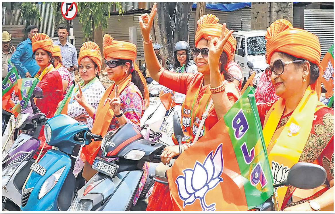
କର୍ମଚାରୀ ଚଳାଚଳରେ ନିର୍ବାଚନ ପ୍ରଚାର ଅବସରରେ ଭାଇପା ପକ୍ଷରୁ ଆୟୋଜିତ ରାଲି ।