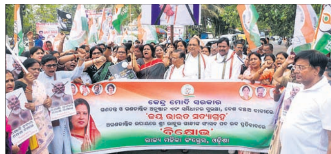
କେନ୍ଦ୍ର ମୋଦି ବିପତ୍ତିରେ ଗଣତନ୍ତ୍ରକୁ ବିପଦ ମୁହଁକୁ ଠେଲିଦେଉଛନ୍ତି ମୋଦି: କଂଗ୍ରେସ

ମାଷ୍ଟରକ୍ୟାଣ୍ଡିନ ଠାରେ କେନ୍ଦ୍ର ସରକାରକୁ ବିରୋଧ କରି ମହିଳା କଂଗ୍ରେସ ପକ୍ଷରୁ ବିରୋଧ । ଭୁବନେଶ୍ୱର, ୨୫୪(ବୁଧବେ) କଂଗ୍ରେସ କେବଳ ବିରୋଧୀଙ୍କୁ ଚୁପ୍ ଦେଖି ଗଣତନ୍ତ୍ର ଏବଂ ଗଣତାନ୍ତ୍ରିକ ଅନୁଷ୍ଠାନ ଏବେ ବିପଦମୁଖ୍ୟ ନରନ୍ଦ୍ର ମୋଦି ସରକାର ଏହି ୯ ବର୍ଷରେ ଭାରତ ବର୍ଷର ଗଣତାନ୍ତ୍ରିକ ବ୍ୟବସ୍ଥାକୁ ଧୁସ୍ତ ବିଧୁସ୍ତ କରିସାରିଲେଣି । ସମିଧାନ ଓ ସାଧ୍ୟାଧିକ ଅନୁଷ୍ଠାନଗୁଡ଼ିକ ନିଜ କର୍ତ୍ତାରେ ରଖିବା ପାଇଁ ଏନଡିଏ ନେତୃତ୍ୱାଧୀନ ଭାଜପା ସରକାର ସତରଞ୍ଜିତ । ଏପରିକି ଯେଉଁ ନିରପେକ୍ଷ ସଂସ୍ଥାଗୁଡ଼ିକ ଭାରତ ବର୍ଷର ଆଇନ କାନ୍ଦୁନି ସର୍ବାଙ୍ଗେ ରହି କାର୍ଯ୍ୟ କରୁଥିଲେ ଆଜି ସେସବୁ ବ୍ୟସ୍ତା ଯଥା ଇ.ଡି., ସି.ପି.ଆଇ. ଏବଂ ଇନକମ୍