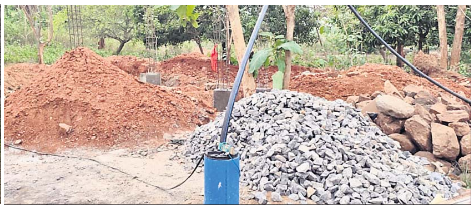
ପାନୀୟ କଳପ୍ରକଳ୍ପ ନିର୍ମାଣ କାମ ଚାଲିଛି ।