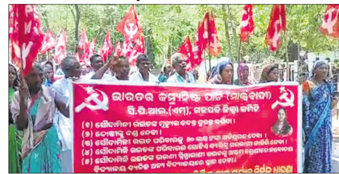
ଜ୍ୱାଳମତୀ ଅନ୍ତର୍ଦ୍ଧ୍ୟ ଦାବିରେ ବିରୋଧ ।