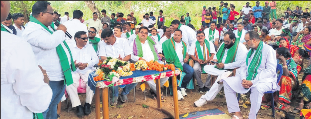
ରାସ୍ତା ସଂପ୍ରସାରଣ ପାଇଁ ଭିଡିପ୍ରସ୍ତର କାର୍ଯ୍ୟକ୍ରମରେ ଯୋଗଦେଇଥିବା ଅତିଥିବୃନ୍ଦ ।