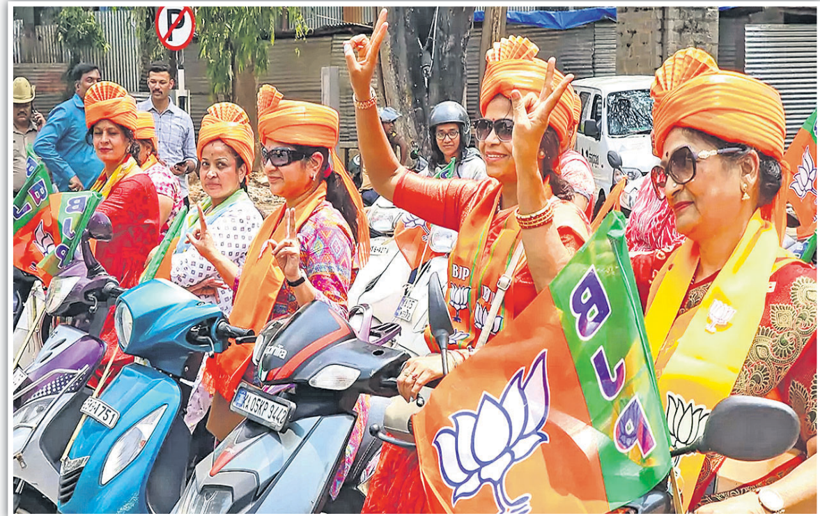
କର୍ମଚର ଚଳପେଟରେ ନିର୍ବାଚନ ପ୍ରଚାର ଅବସରରେ ଭାଜପା ପକ୍ଷରୁ ଆୟୋଜିତ ରାଲି ।