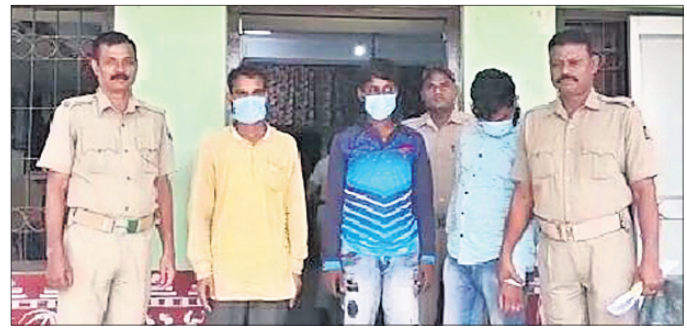
ବିରପ ୩ ଅଭିଯୁକ୍ତ ।

ନାଉଗାଁ, ୨୫୪ (ସ.ପ୍ର.) ନାଉଗାଁ ଥାନା ପକ୍ଷରୁ ସୋମବାର ରାତିରେ ବିଲିପତା ଛକ ନିକଟରେ ଚଢ଼ାଇ କରାଯାଇ ୨୦ ଗ୍ରାମ୍ ବ୍ରାଉନିଂସୁଗାର ଜବତ କରାଯାଇଛି । ଏହାର ଆନୁମାନିକ ମୂଲ୍ୟ ୨ ଲକ୍ଷରୁ ଊର୍ଦ୍ଧ୍ୱ ହେବ ବୋଲି ପୋଲିସ୍ କହିଛି । ବ୍ରାଉନିଂସୁଗାର ରଖିବା ଅଭିଯୋଗରେ ପୋଲିସ୍ ୩ ଜଣଙ୍କୁ ଗିରଫ କରି କୋର୍ଟ ଚାଳାକା କରିଛି । ସେମାନେ ହେଲେ