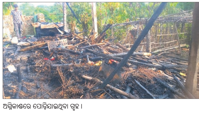
ଅଗ୍ନିକାଣ୍ଡରେ ପୋଡ଼ିଯାଇଥିବା ଗୃହ ।

ଯାଜପୁର ଗାଈ, ୨୫୪ (ଡି.ଏନ.ଏ.): ବରୁଣା ଅଗ୍ନିଶମ ବାହିନୀ ପହଞ୍ଚି ନିଆଁକୁ ଯାକପୁର ବୁକ୍ ଅନ୍ତର୍ଗତ ଜମିଧର ପାଖରେ ରେକାବି ବଜାର ଗ୍ରାମର ପ୍ରାୟ ୨ ବଖରା ଘର ପୋଡ଼ି ପାଉଁଶ ହୋଇଯାଇଛି । ଏଥିସହିତ ଏକ ଗାଈ ଓ ବାଛୁରି ଅର୍ଦ୍ଧଦଣ୍ଡ ହୋଇଛନ୍ତି । ଘରେ ଥିବା ପରବାରକୁ ପାଲ ଓ ଆଠିକ ସହାୟତା ଚାଉଳ, ଅଟା, ଖାଦ୍ୟପଦାର୍ଥ ସହ ସମସ୍ତ ସେବାକରିଛନ୍ତି । ତୁରନ୍ତ ଉକ୍ତ ପରିବାରକୁ ସୁରକ୍ଷା ଦେବା ପାଇଁ ଯୋଗାଯୋଗ କରାଯାଇଛି । ଘରପୋଡ଼ିର କାରଣ ଜଣାପଡ଼ିନାହିଁ ।