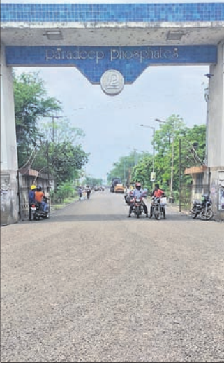
ପାରାଦୀପ, ୨୫୪ (ସ.ପ୍ର.)