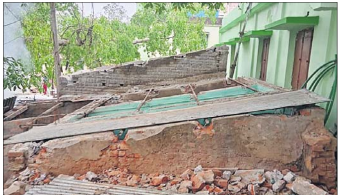
ଉଚ୍ଛେଦ ହୋଇଥିବା ଘର ।

ଖଣ୍ଡପଡ଼ା, ୨୫:୪(ସ.ପ୍ର.) ସମ୍ପ୍ରତି କର୍ତ୍ତୃତ୍ୱ ଶ୍ରୀ ନୀଳମାଧବ ପାଠକ ପୋଖରୀ ନବାକରଣ କାମ ଚାଲୁ ରହିଥିବା ବେଳେ ଏହାର ଚତୁର୍ଥପାର୍ଶ୍ୱରେ ଜବରଦଖଲ ଉଚ୍ଛେଦ ପ୍ରକ୍ରିୟା ପାଇଁ ପ୍ରଶ୍ନାସନ ପକ୍ଷରୁ ଘାୟା ଓ ଅଘାୟା ୨୫ ତାରିଖ ପୂର୍ଣ୍ଣା ଘର ଖାଲି କରିବା ପାଇଁ ପରାମର୍ଶ ଦିଆଯାଇଥିଲା । ପ୍ରଶ୍ନାସନର ପରାମର୍ଶ କ୍ରମେ ମଙ୍ଗଳବାର ସମ୍ପୂର୍ଣ୍ଣ ପରିବାର ନିଜ ଘର ଖାଲି କରିଛନ୍ତି । ସେମାନଙ୍କୁ ଅନ୍ୟତ୍ର ଥଇଥାନ ବ୍ୟବସ୍ଥା କରିବା ସହିତ ସହାୟତା ରାଶି ପ୍ରଦାନ ପାଇଁ ଦାବି କରିଛନ୍ତି । ସୂଚନାଯୋଗ୍ୟ, ଚନ୍ଦନ ପୁଷ୍ପାରିଶାର ଚତୁର୍ଥପାର୍ଶ୍ୱରେ ରାସ୍ତା ନିର୍ମାଣ କରାଯିବ । ଏଥିସହିତ ସେଠାରେ ପର୍ଯ୍ୟଟନମାନଙ୍କ ପାଇଁ ସାମୟିକ ବିଶ୍ରାମଗାର ନିର୍ମାଣ ହେବାର କାର୍ଯ୍ୟକ୍ରମ ରହିଛି । ସେଥିପାଇଁ