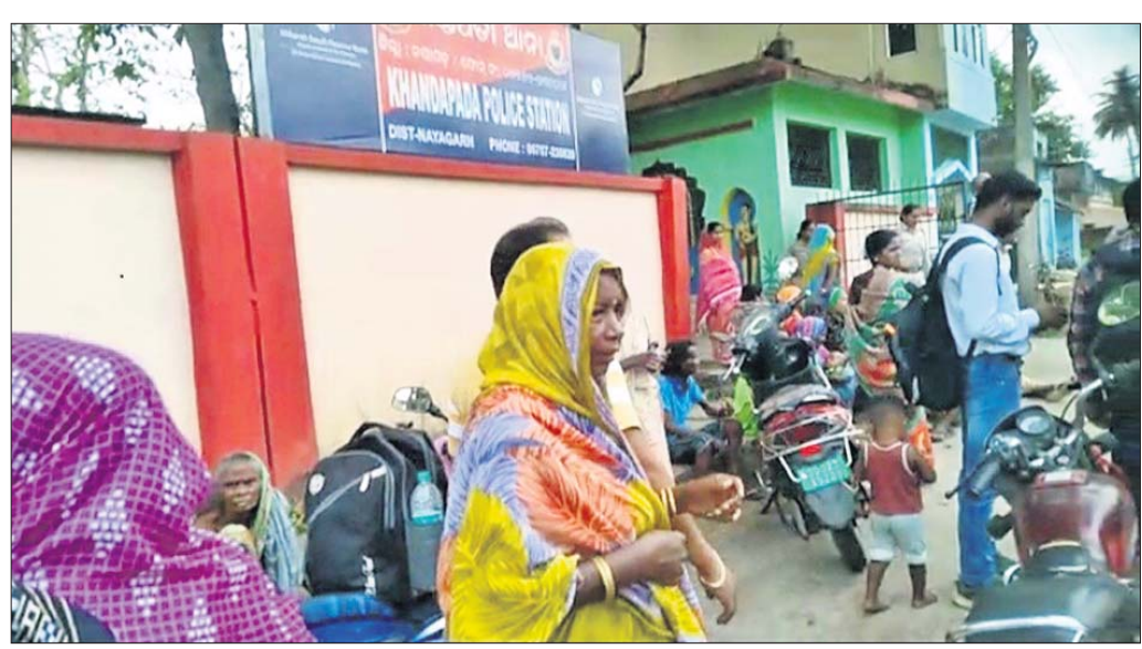
ମହିଳାମାନେ ଥାନା ଭେରାଇ କରିଛନ୍ତି ।

ଖଣ୍ଡପଡ଼ା, ୨୫:୪(ସ.ପ୍ର.) ଖଣ୍ଡପଡ଼ା ଏନଏସି ୯ନଂ. ଖାର୍ଡର ଶତାଧିକ ମହିଳା ମଙ୍ଗଳବାର ମଦ କାରବାରକୁ ବିରୋଧ କରିବା ସହ ଥାନା ସମ୍ମୁଖରେ ବିକ୍ଷୋଭ ପ୍ରଦର୍ଶନ କରିଥିଲେ । ୯ନଂ.ଖାର୍ଡ କାରବାରକୁ ବିରୁଦ୍ଧ କରିବାକୁ ଅଭିଯୋଗ କ୍ରମେ ସୋମବାର ଅପରାହ୍ନରେ ଜେଲରାସ୍ତା ନିକଟରେ ଜଣେ ବ୍ୟକ୍ତିଙ୍କ ଘରେ