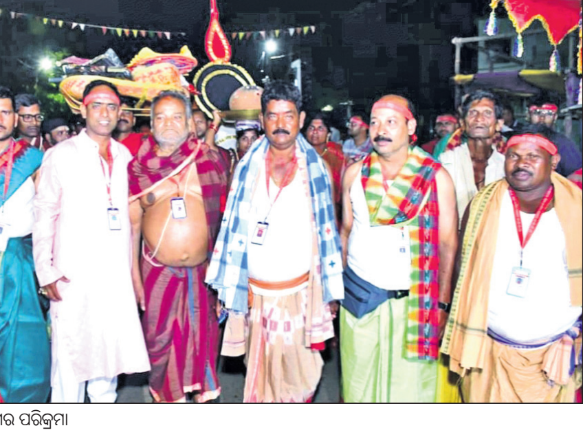
ମା' ଠାକୁରାଣୀଙ୍କ ନଗର ପରିକ୍ରମା