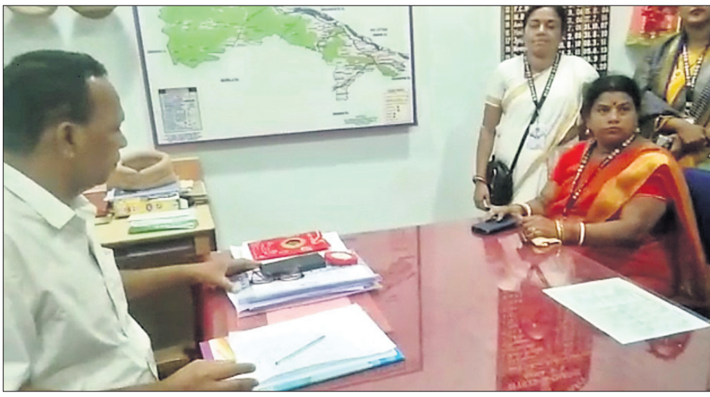
ତହସିଲଦାରଙ୍କ ବିରୋଧରେ ଗଣିଆ ଥାନାରେ ଏତଲା ଦିଆଯାଇଛି ।

ଅପରପକ୍ଷେ ତହସିଲଦାର ଛାତିଆଣ ଆକ୍ଷେପ ସହ ଅଶ୍ୱାକ ଗାଳିଗୁଲକ କରିବା ନେଇ ବିକାସିନୀ ଗଣିଆ ଥାନାରେ ଏତଲା ଦେଇଛନ୍ତି । ସେହିପରି ଆରଏସ୍‌ପି ପକ୍ଷରୁ ପୁଣି ନୟାଗଡ଼ ଜିଲ୍ଲାପାଳ ଓ ଏସ୍‌ପିଙ୍କୁ ଭେଟି ବାସହାନ ପରିବାର ଉପରେ ଗଣିଆ ତହସିଲଦାରଙ୍କ ନିର୍ଯାତନା ଓ ଲୁଚା ନେଇ ଫେରାଦ୍ ହୋଇଛନ୍ତି । ବାସହାନ ଦଳିତ ପରିବାରକୁ ନ୍ୟାୟ