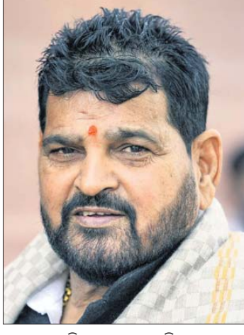
ବ୍ରିଜଭୂଷଣ ଶରଣ ସିଂ

ନୂଆଦିଲ୍ଲୀ, ୨୫/୪ ଭାରତୀୟ କ୍ରିକେଟ୍ ମହାସଂଘ (ଡିଏସ୍‌ଏଆଇ) ଅଧିକାରୀ ତଥା ଭାରତୀୟ ଏମ୍‌ପି ବ୍ରିଜଭୂଷଣ ଶରଣ ସିଂଙ୍କ ବିରୋଧରେ ମହିଳା କ୍ରିକେଟ୍‌ରେ ମାନବ ଆଘାତ ଯୋଗୁଁ ଉପାଦାନ ମାମଲାରେ ଦିଲ୍ଲୀ ପୋଲିସର ଚୁକ୍ତିନା ସମେତ ଘେରରେ। ଏହି ପ୍ରସଙ୍ଗରେ କନଟପୁସ୍ ଆନାରେ ଅଭିଯୋଗ ■ ମହିଳା କ୍ରିକେଟ୍‌ରେ ଯୌନ ଉପାଦାନ ଅଭିଯୋଗ ■ ଦିଲ୍ଲୀ ସରକାରଙ୍କୁ ସୁପ୍ରିମକୋର୍ଟ ନୋଟିସ ସବୁଠାରୁ ପୋଲିସ୍ ମାମଲା ରୁକ୍ତ କରୁ ନ ଥିବା ଦର୍ଶାଇ ୭ ମହିଳା ବେଦନାରେ ସୁପ୍ରିମକୋର୍ଟଙ୍କ ଦ୍ୱାରା ହୋଇଛି। ସର୍ବୋଚ୍ଚ ଅଦାଲତ ମଙ୍ଗଳବାର ଦିଲ୍ଲୀ ସରକାରଙ୍କୁ ନୋଟିସ କରିଛନ୍ତି। ଏଥିସହ ବ୍ରିଜଭୂଷଣଙ୍କ ନାମରେ ମାମଲା ରୁକ୍ତ କରିବାକୁ ଦିଲ୍ଲୀ ପୋଲିସକୁ ନିର୍ଦ୍ଦେଶ ଦେଇଛନ୍ତି। ଭିନେଶ ଯୋଗର୍, ସାକ୍ଷୀ ମଲିକଙ୍କ ସମେତ