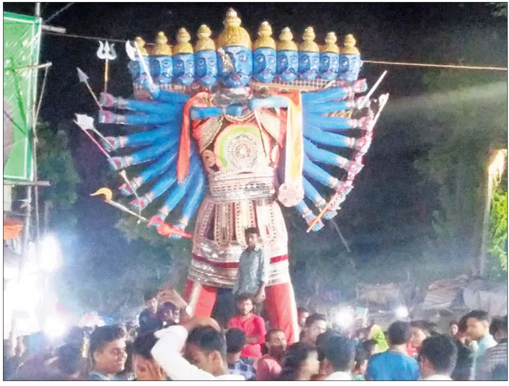
ଲଙ୍କାପୋଡ଼ି ଉତ୍ସବ ଅବସରରେ ନିର୍ମାଣ କରାଯାଇଥିବା ବିରାଟକାୟ ରାବଣମୂର୍ତ୍ତି ।

ଗଣିଆ ଶ୍ରୀ ରଘୁନାଥଜୀଉଙ୍କ ପୀଠରେ ଗତ ୩୦ତାରିଖ ଶ୍ରୀରାମନବମୀଠାକୁ ଆରମ୍ଭ ହୋଇଥିବା ଲଙ୍କାପୋଡ଼ି ଯାତ୍ରାର ୫୧ତମ ମହୋତ୍ସବ ଶେଷ ପର୍ଯ୍ୟାୟରେ ପହଞ୍ଚିଛି । ମଙ୍ଗଳବାର ରାତିରେ ମଞ୍ଚସ୍ଥ ରାମ ରାବଣ ଲଢ଼େଇ ପରେ ରାମଙ୍କ ବ୍ରହ୍ମାସ୍ତ୍ରରେ ରାବଣ ନିହତ ହୋଇଛନ୍ତି । ଠାକୁରଙ୍କ ଯଥାରୀତି ପୂଜାର୍ଚ୍ଚନା ପରେ ସେହି ରାତିରେ ଲଙ୍କାପୋଡ଼ି ଯାତ୍ରା ଅନୁଷ୍ଠିତ ହୋଇଥିଲା ।