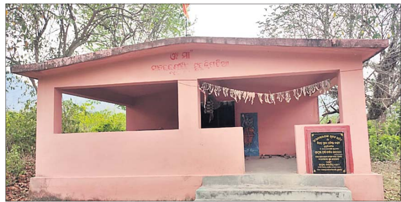
ଗାଁରେ ନିର୍ମାଣ କରାଯାଇଥିବା ନୂତନ ମନ୍ଦିର ।