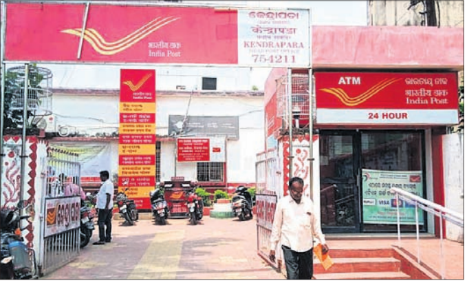
କେନ୍ଦ୍ରାପଡ଼ା ପୋଷ୍ଟ ଅଫିସ୍ ।