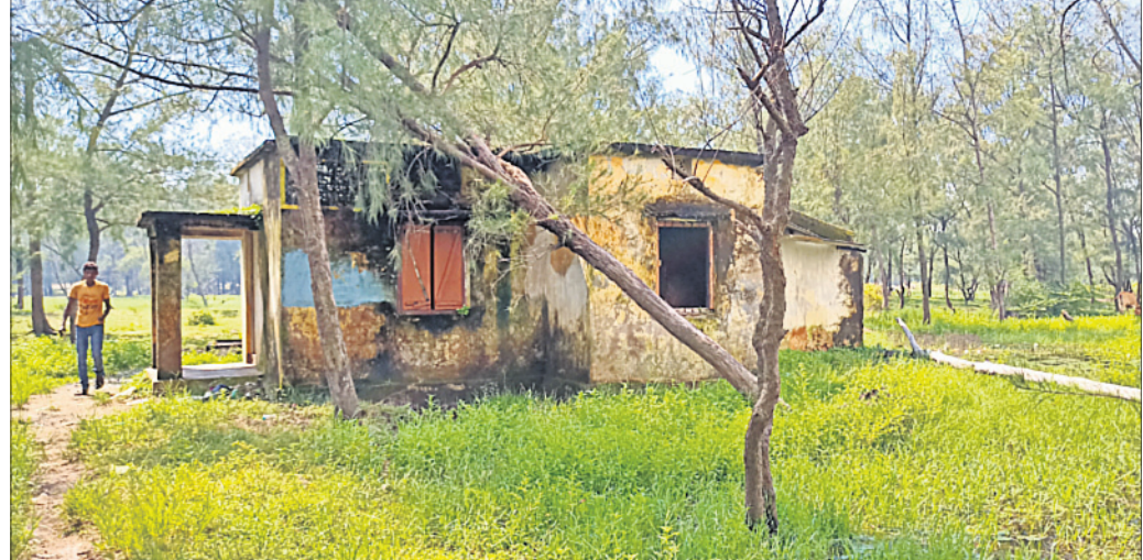
ଜଗଦିଂହପୁର ଜିଲ୍ଲା ପାରାଦୀପ ଖଣ୍ଡକୁଦ ଉପାନ୍ତରେ ଥିବା ଜଙ୍ଗଲ ଓ ପରିବେଶ ବିଭାଗର ଫରେଷ୍ଟି ବିନ୍ ହାଉସ ।

ଜଗଦିଂହପୁର ଜିଲ୍ଲା ପାରାଦୀପ ଖଣ୍ଡକୁଦ ଉପାନ୍ତରେ ଜଙ୍ଗଲ ଓ ପରିବେଶ ବିଭାଗର ଫରେଷ୍ଟି ବିନ୍ ହାଉସ ରହିଛି । ସମ୍ପ୍ରତି ଏହା ଭାଙ୍ଗିଦିଆଯାଇଛି । ସେଠାରେ ଏବେ କେହି ରହୁନାହାନ୍ତି । ସମ୍ପୂର୍ଣ୍ଣ ବେଳାଭୂମି ରାସ୍ତାରେ ଗଲେ ତାହା ଦୂରରୁ ଭୂତକୋଠି ପରି ଦୃଶ୍ୟମାନ ହେଉଛି । ଏହି ବିନ୍ ହାଉସ ନିକଟରେ ଏକ ପୋଖରୀ ରହିଛି । ଏହାକୁ ଜଙ୍ଗଲ ବିଭାଗ ପକ୍ଷରୁ ଖନନ କରାଯାଇଛି । ସେଠାରେ ଏକ ଫକଳ ମଧ୍ୟ ରହିଛି । ସେଥିରେ ଦର୍ଶାଯାଇଛି ଏହି ପୋଖରୀରେ ବନ୍ୟଜୀବମାନେ ପାଣି ପିଇବେ । ତେବେ ଉକ୍ତ ଅଞ୍ଚଳରେ କୌଣସି ବନ୍ୟଜୀବକୁ ଦେଖିବାକୁ ମିଳି ନାହିଁ । ବିଶ୍ୱସ୍ତରାୟ ସଙ୍ଘଠନ କାମ୍ପା ଅର୍ଥରେ ଏହି ପୋଖରୀ କରାଯାଇଥିଲେ ମଧ୍ୟ କାହା କାମରେ ଲାଗି ପାରୁନାହିଁ । ଉକ୍ତ ବିନ୍ ହାଉସ ଉତ୍ତର ପାର୍ଶ୍ୱ ଖଣ୍ଡକୁଦ ଏବଂ ଦକ୍ଷିଣ ପାର୍ଶ୍ୱ ଜଗାଧାରମୁହାଣ ପର୍ଯ୍ୟନ୍ତ ଝାଉଁ ଜଙ୍ଗଲ ଅଛି । ପ୍ରତିବର୍ଷ ଏଠାରେ ଝାଉଁ ଚାରାଚୋପଣ କରାଯାଉଛି । କିନ୍ତୁ ପରିତାପର ବିଷୟ ସେହି ଝାଉଁ ଗଛଗୁଡ଼ିକୁ ଅବାଧରେ କଟାଯାଉଛି । ଅଞ୍ଚଳର କେତେଜଣ କାଠ