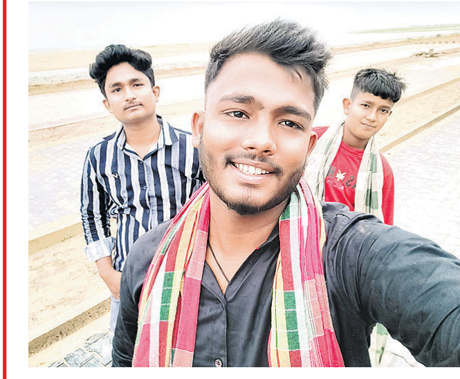
@ ଏସକେ ଇନ୍‌ସି

ସେଲ୍‌ଫି ପଠାଇବା ସମୟରେ ନିଜ ନାମ ଏବଂ ମୋବାଇଲ ନମ୍ବର ଦେବାକୁ ଭୁଲନ୍ତୁ ନାହିଁ। ଯୋଗ୍ୟ ବିବେଚିତ ଫଟୋ ପ୍ରକାଶ ପାଇବ।