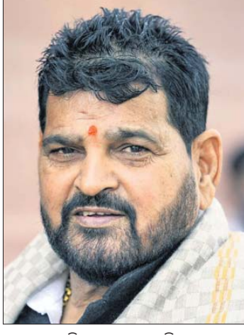
ବ୍ରିଜଭୂଷଣ ଶରଣ ସିଂହ

ନୂଆଦିଲ୍ଲୀ, ୨୫/୪ ଭାରତୀୟ କୁସ୍ତି ମହାସଂଘ (ଡି.ସି.ଏ.ଆଇ.) ଅଧ୍ୟକ୍ଷ ତଥା ଭାରତୀୟ ଏସିଏ ବ୍ରିଜଭୂଷଣ ଶରଣ ସିଂହଙ୍କ ବିରୋଧରେ ମହିଳା କୁସ୍ତିଯୋଦ୍ଧାମାନେ ଆଣିଥିବା ଯୌନ ଉତ୍ପୀଡ଼ନ ମାମଲାରେ ଦିଲ୍ଲୀ ପୋଲିସର ଭୂମିକା ସନ୍ଦେହ ଯେତେବେଳେ ଏହି ପ୍ରସଙ୍ଗରେ କରତପ୍ରେୟ ଆନାରେ ■ ଦିଲ୍ଲୀ ପୋଲିସକୁ ସୁପ୍ରିମକୋର୍ଟଙ୍କ ପ୍ରଶ୍ନ, ସରକାରଙ୍କୁ ନୋଟିସ ■ ମହିଳା କୁସ୍ତିଯୋଦ୍ଧାଙ୍କୁ ଯୌନ ଉତ୍ପୀଡ଼ନ ଅଭିଯୋଗ ଅଭିଯୋଗ ସତ୍ତ୍ୱେ ପୋଲିସ ମାମଲା ରୁଜୁ କରୁ ନ ଥିବା ଦର୍ଶାଇ ୬ ମହିଳା ବେଦ୍ଦଲର ସୁପ୍ରିମକୋର୍ଟଙ୍କ ଦ୍ୱାରା ହୋଇଛନ୍ତି। ସର୍ବୋଚ୍ଚ ଅଦାଲତ ମଙ୍ଗଳବାର ଦିଲ୍ଲୀ ସରକାରଙ୍କୁ ନୋଟିସ କରିଛନ୍ତି। ଭିନ୍ନଶ ଯୋଗତ, ସାକ୍ଷୀ ମଲିକଙ୍କ ସମେତ ଅନ୍ତର୍ଜାତୀୟ ମହିଳା କୁସ୍ତିଯୋଦ୍ଧା ଓ ଅଲିମ୍ପିଆନ୍ମାନେ ଗତ ଡିସେମ୍ବରରେ ବ୍ରିଜଭୂଷଣଙ୍କୁ ପୃଷ୍ଠା-୪