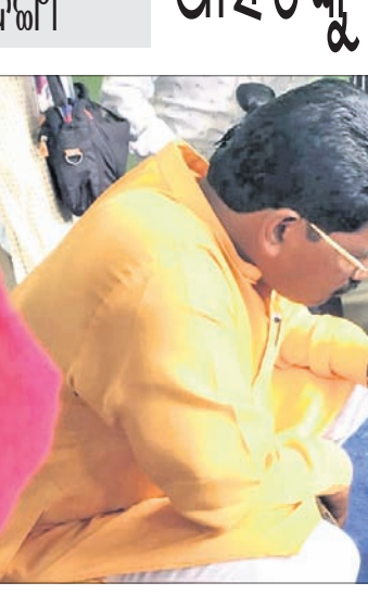
ଆହତ କାଳିଆଙ୍କୁ ଭେଟି ଘଟଣା ସମ୍ପର୍କରେ ପଚାରୁଛନ୍ତି ଏହି କମିଶନ ସଦସ୍ୟ।