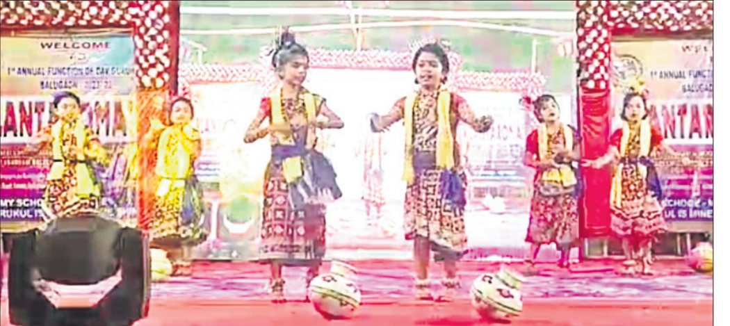
ବାଲୁଗାଁ: ଡିଏଭି ଗୁରୁକୂଳ ବିଦ୍ୟାଳୟର ପ୍ରଥମ ବାର୍ଷିକ ଉତ୍ସବ ଅବସରରେ ପିଲାମାନଙ୍କ ଦ୍ୱାରା ପରିବେଷିତ ସାଂସ୍କୃତିକ କାର୍ଯ୍ୟକ୍ରମ।