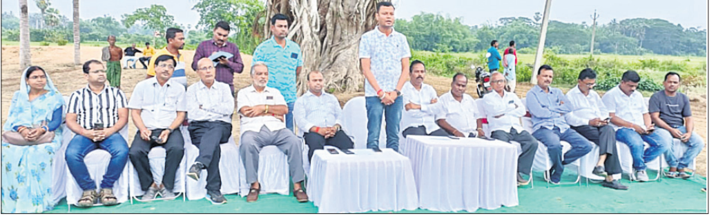
ବୈଠକରେ ଯୋଗଦେଇଥିବା କମିଟି ସଦସ୍ୟ ଓ ଅନ୍ୟମାନେ।