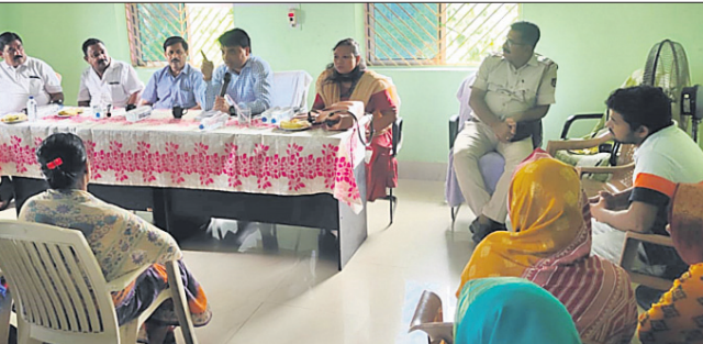
କଟକସ୍ଥିତ ଶିବିରରେ ଉପସ୍ଥିତ ଅଧିକାରୀ ଏବଂ ସ୍ଥାନୀୟ ଗ୍ରାମବାସୀ।