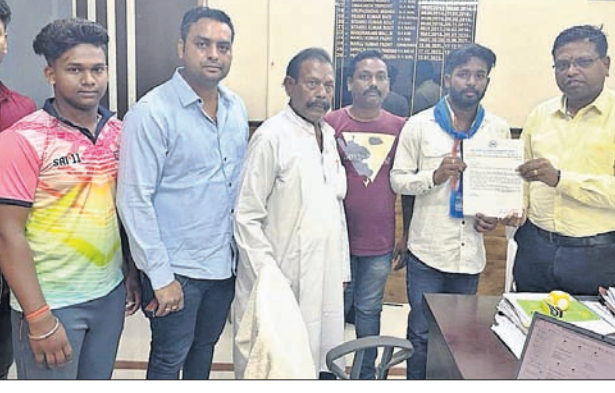
ପୁଞ୍ଜିମନ୍ତ୍ରୀଙ୍କ ଉଦ୍ଦେଶ୍ୟରେ ଛାତ୍ର କଂଗ୍ରେସ ପକ୍ଷରୁ ବାବିପତ୍ର ପ୍ରଦାନ କରାଯାଇଛି।