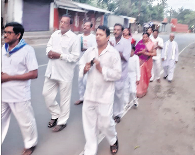
ଭକ୍ତମାନେ ସତ୍ୟସାଧନାବାଦ ସଂକାର୍ଯ୍ୟ ଶୋଭାଯାତ୍ରାରେ ଯାଉଛନ୍ତି।