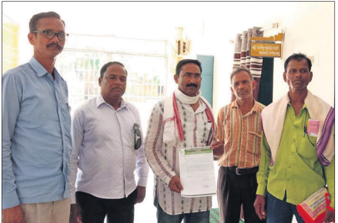
ଦାବିପତ୍ର ଦେବାକୁ ଆସିଥିବା କୃଷକ ସଂଗଠନ ସଦସ୍ୟ।