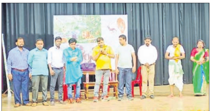
ଭୁବନେଶ୍ୱର ରବୀନ୍ଦ୍ର ମଞ୍ଚରେ ମଞ୍ଚସ୍ଥ ନାଟକ ଅରଣ୍ୟ ଫସଲର କଳାକାର ଓ ନିର୍ଦ୍ଦେଶକ। ଦେଖାହୋଇଛନ୍ତି ଏକ ତାଳକଳାରେ। ପରେ ସେ ସ୍ଥାନରେ ପହଞ୍ଚିଛନ୍ତି ଆଉ ଜଣେ ବାଲ୍ୟବାହୀନ ବିବାହ ପୂର୍ଣ୍ଣ ବିବାହ ପରେ ଜଣ ସ୍ୱାମୀଙ୍କ ସହ ଏକ ସୌହାର୍ଦ୍ଦପୂର୍ଣ୍ଣ ବାତାବରଣରେ

ଭୁବନେଶ୍ୱର ରବୀନ୍ଦ୍ର ମଞ୍ଚରେ ବଲାଙ୍ଗୀରର ଅଗ୍ରଣୀ ନାଟ୍ୟସଂସ୍ଥା ଅନୁଷ୍ଠାନର ଚର୍ଚ୍ଚିତ ନାଟକ ଅରଣ୍ୟ ଫସଲ ମଞ୍ଚସ୍ଥ ହୋଇଛି। ନାଟକକୁ ବର୍ଗକମାନେ ପ୍ରଶଂସା କରିବା ସହ ଏହାର କଥାବସ୍ତୁ ମନୋରଞ୍ଜନଧର୍ମୀ ହୋଇଛି ବୋଲି କହିଛନ୍ତି। ଓଡ଼ିଆ ଭାଷା, ସାହିତ୍ୟ ଓ ସଂସ୍କୃତି ବିଭାଗ ଏବଂ ଓଡ଼ିଶା ସମ୍ମାନ ନାଟକ ଏକାଡେମୀ ଆନୁକୁଲ୍ୟରେ ଓଡ଼ିଶା ନାଟ୍ୟ ସଂଘର ନିୟମିତ ନାଟକ ପରିକ୍ରମାର ଅଂଶ ଭାବରେ ଏହି ନାଟକ ଭୁବନେଶ୍ୱର ରବୀନ୍ଦ୍ର ମଞ୍ଚରେ ମଞ୍ଚସ୍ଥ କରାଯାଇଥିଲା। ବୁଲ୍‌ଲିଶ ବାଲ୍ୟବାହୀନ ବିବାହ ପରେ ଜଣ ସ୍ୱାମୀଙ୍କ ସହ ଏକ ସୌହାର୍ଦ୍ଦପୂର୍ଣ୍ଣ ବାତାବରଣରେ