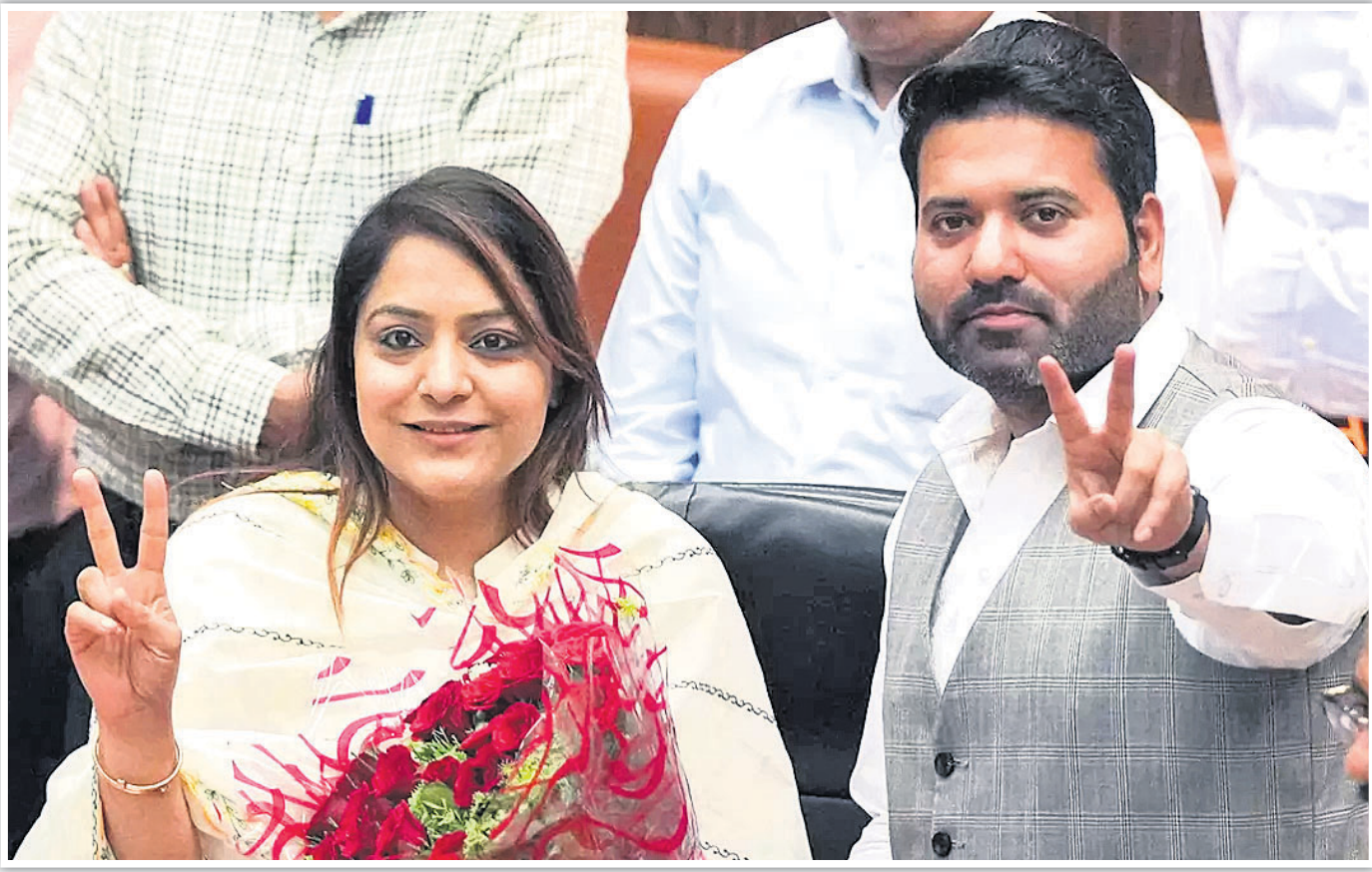
ଦିଲ୍ଲୀ ମେୟର ଶେଳି ଓବରୟ ଓ ତେଜସ୍ୱୀ ମେୟର ଆଲୋୟ ମହାନନ୍ଦ ଲଙ୍କାଲ ଜିତିବା ପରେ ବିଜୟ ସଙ୍କେତ ଦେଖାଉଛନ୍ତି ।