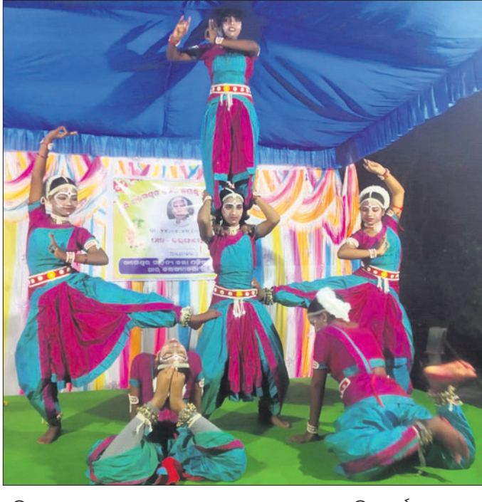
କବି ଖଗେଶ୍ୱର ଶେଠିଙ୍କ ଜୟନ୍ତୀ ସମାରୋହରେ ଛାତ୍ରୀଙ୍କୁ ସାଂସ୍କୃତିକ କାର୍ଯ୍ୟକ୍ରମ ଦେଖିବାକୁ ଦିଆଯାଇଛି।

ବୌଦ୍ଧ ପୋଲିସ୍ ୧୨ କିଲୋ ଗଞ୍ଜେଇ ଜବତ କରିବା ପାଇଁ ଗିରଫ କରୁଛନ୍ତି। ଅଧିକ ସହାୟତା ପ୍ରଦାନ କରିବା ପାଇଁ ଆବେଦନ କରାଯାଇଛି।