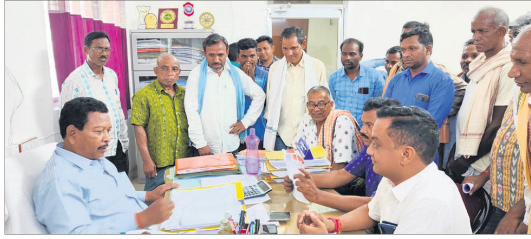
ବିତିଏଠଙ୍କୁ ଯୁବମୋର୍ଚ୍ଚା ଦାବିପତ୍ର ପ୍ରଦାନ କରୁଛନ୍ତି।

ଅଧିକ ଧାନ ଉତ୍ପାଦନ ଯୋଗୁ ବରଗଡ଼ ଜିଲ୍ଲାକୁ ରାଜ୍ୟର ଭାଗ୍ୟହୀନ କୁହାଯାଏ। ମାତ୍ର ଜିଲ୍ଲାରେ ଚାଷ, ଚାଷୀ ସମସ୍ୟା ଅସମାପ୍ତ ହୋଇପାରି ନାହିଁ। କେତେବେଳେ ଅନାବୃଷ୍ଟି କିମ୍ବା ସମସ୍ୟା ଦ୍ୱାରା ମୁହଁ ଖସି ଯାଇ କେବେ ଫସଲରେ ରୋଗପୋକ ଉପଦ୍ରବ ଯୋଗୁ ଚାଷୀଙ୍କୁ ବହୁ କ୍ଷତି ସହିବାକୁ ପଡ଼ିଛି। ଗତ ୪ ଦିନ ମଧ୍ୟରେ ୨୯ ଦିନ ଜିଲ୍ଲାରେ କରାମାତ୍ୱ ଚାଷୀଙ୍କ ଆର୍ଥିକ ମେଳାପତ୍ତକୁ ଘୋଷଣା କରାଯାଇଛି। କରାମାତ୍ୱ ପ୍ରଭାବକୁ ଅନୁଭବ କରିବା ପାଇଁ ଚାଷୀଙ୍କୁ ଅଧିକ ସହାୟତା ପ୍ରଦାନ କରିବା ପାଇଁ ଗୋଷ୍ଠୀଗତୀୟ ସମାବେଶ ଆୟୋଜନ କରାଯାଇଛି। ଏହାକୁ ନେଇ ଜିଲ୍ଲାର ଚାଷୀମାନେ ଚିନ୍ତିତ ହୋଇ ପଡ଼ିଥିବାବେଳେ ଯୁବମୋର୍ଚ୍ଚା ସହାୟତା ଦାବି କରିଛନ୍ତି। ଏହି ଦାବି ନେଇ ରାଜ୍ୟ ସରକାରରୁ କରାମାତ୍ୱ ପ୍ରଦାନ କରିବା ପାଇଁ ନିର୍ଦ୍ଦେଶ ଦେଇଛନ୍ତି। ଚାଷୀଙ୍କୁ ଅଧିକ ସହାୟତା ପ୍ରଦାନ କରିବା ପାଇଁ ଅନୁରୋଧ କରାଯାଇଛି।