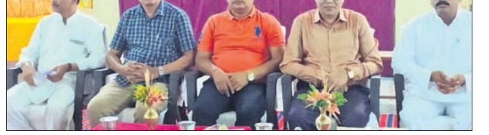
ସାମୂହିକ ଆଚାର୍ଯ୍ୟ କର୍ମଶାଳାରେ ମଞ୍ଚାସୀନ ଅତିଥିଙ୍କର।