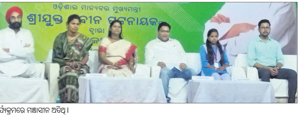
କାର୍ଯ୍ୟକ୍ରମରେ ମଞ୍ଚାସୀନ ଅତିଥି।

ଆକାର୍ଷଣରେ ନ ଦେଇ ନିଜ ଗ୍ରାମରେ ପ୍ରଦାନ, ୫୫୫୫୫୫ ଉର୍ଦ୍ଧ୍ୱ ସମସ୍ତ କ୍ଷେତ୍ର ପ୍ରଦାନ, କଳ୍ପା କମି ଅଧିକାରୀ ଆଇନ ଭାଗ ପ୍ରଦାନ ଅନ୍ତର୍ଭୁକ୍ତ। ଏହାପରେ ଦଳୀୟ କର୍ମକର୍ତ୍ତା ତହସିଲ ଅଫିସ ଆଇନ ଭାଗ ପ୍ରଦାନ ଅନୁପସ୍ଥିତିରେ ମନ୍ତ୍ରୀ ୨୦୦ ଟଙ୍କାକୁ ବୁକ୍ସ, ବାର୍ଷିକ୍ୟ, ଭିକ୍ଷଣ ଓ ବିଧବା ଭାଗ ଟଙ୍କା ବ୍ୟାଙ୍କ