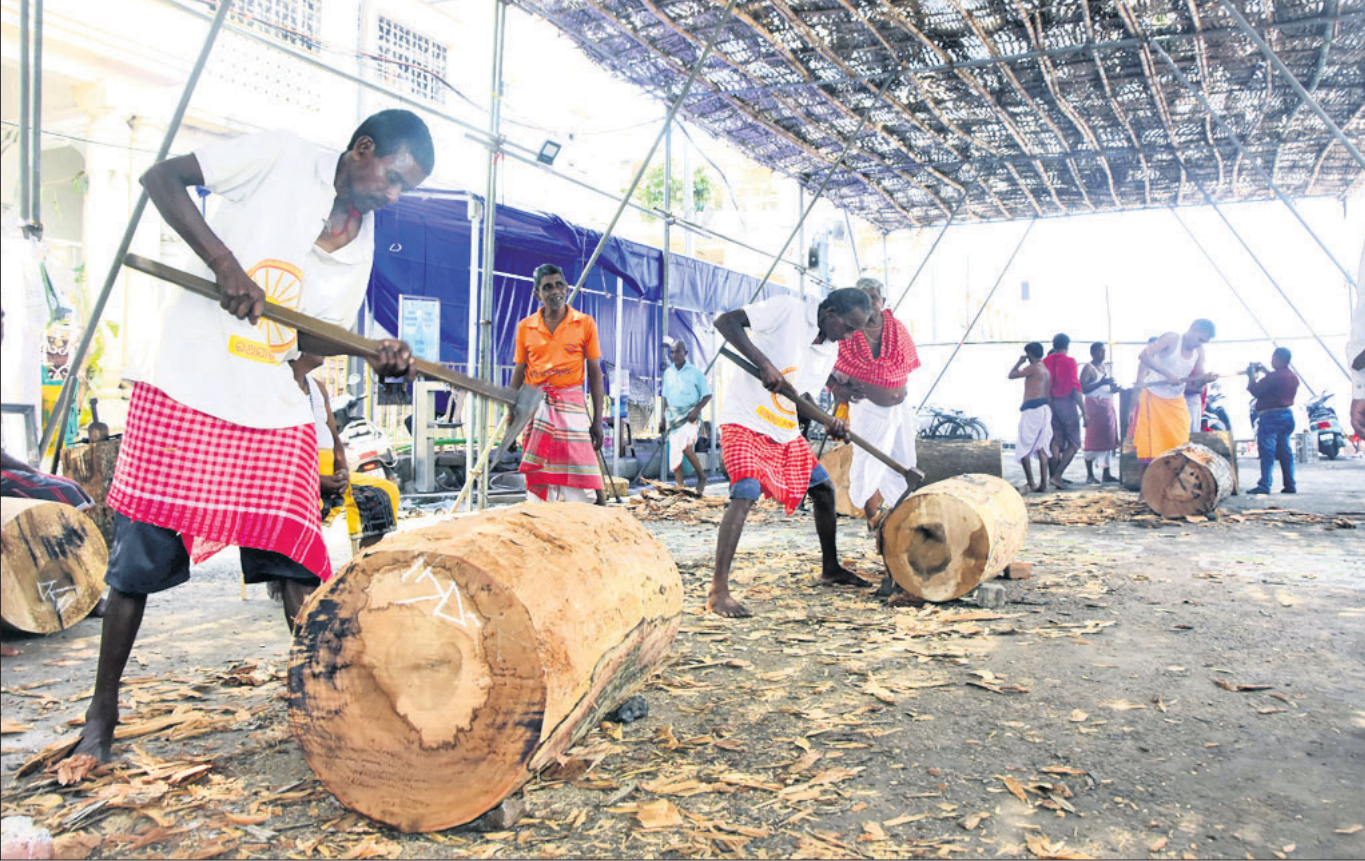
ପୁରୀ ରଥଖଳାରେ ମହାରଣା ସେବକମାନେ ବୁଧବାର ବୃକ୍ଷ ପ୍ରସ୍ତୁତ କରୁଛନ୍ତି।

ବଲିଉଡ ଅଭିନେତା ଆମିର ଖାନ ନିଜର ପ୍ରଧାନମନ୍ତ୍ରୀ ନରେନ୍ଦ୍ର ମୋଦିଙ୍କ କାର୍ଯ୍ୟକ୍ରମ 'ମନ୍ କି ବାତ୍'କୁ ଖୁବ୍ ପ୍ରଶଂସା କରି ବର୍ତ୍ତମାନ ଆସିଛନ୍ତି।