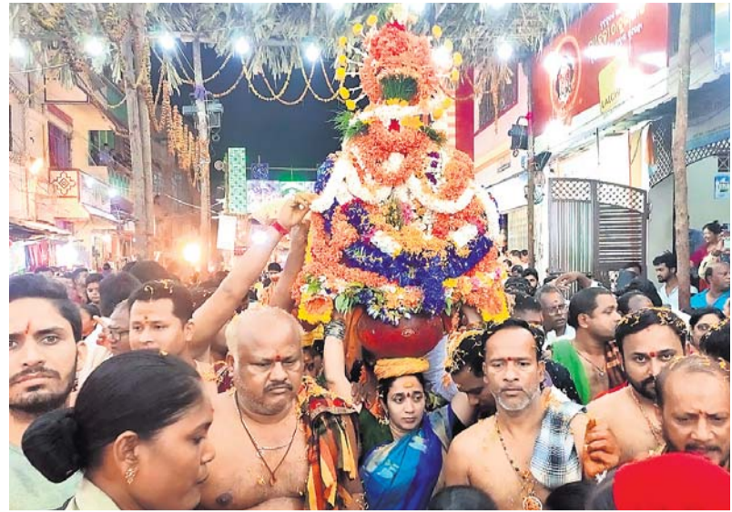
ମା'ଙ୍କ ଘଟ ପରିକ୍ରମା କରାଯାଇଛି।