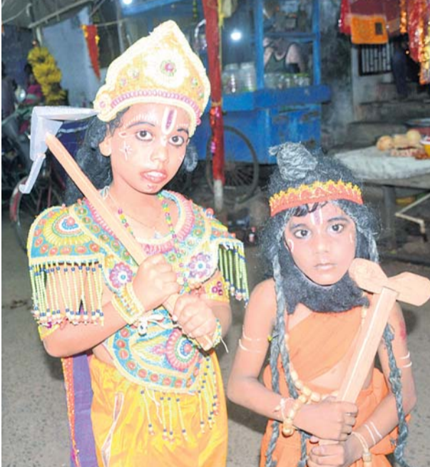
ବନ୍ଦରାମ ଓ ବାବାଜୀ ବେଶ।