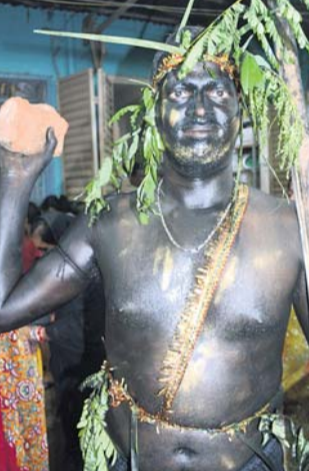
ସୋଡ଼ ଗାଢ଼ିଆ ବେଶ।

ବ୍ରହ୍ମପୁର ଅଧିକ, ୨୬୪ ବ୍ରହ୍ମପୁର ଅଧିକାରୀ ଦେବୀ ମା' ବୁଢ଼ୀ ଠାକୁରାଣୀଙ୍କ ଯାତ୍ରା ରୁଧିରୀ ୨୩ ଦିନରେ ପହଞ୍ଚିଛି । ଯାତ୍ରାର ୨୩ ଦିନ ବୁଢ଼ୀ ମା' ଠାକୁରାଣୀଙ୍କ ଦ୍ୱାରା ୨୦ ରଥ ଉନ୍ମୋଚିତ ହୋଇଛି । ଠାକୁରାଣୀ ଯାତ୍ରା ସମୟ ଅବଧି ସରି ଆସୁଥିବା ବେଳେ ଭକ୍ତଙ୍କ ଗହଳି ବହଳ ମଧ୍ୟ ବୃଦ୍ଧି ପାଇଛି । ବର୍ତ୍ତମାନ ବହୁ ସଂଖ୍ୟକ ବାଘ ବେଶ ମାନସିକଧାରୀ ଅଗ୍ରାୟା ମଣ୍ଡପ ସମେତ ସମଗ୍ର ସହରରେ ବାଘ ନାଚ ଦେଖିବାକୁ ମିଳୁଛି । ସମଗ୍ର ସହର ଏବେ ଚାନ୍ଦି ବାଦ୍ୟରେ କମ୍ପି ରହିଛି । ବାଘ ବେଶଧାରୀମାନେ ନାଚ ନାଚି ଅଗ୍ରାୟା ମଣ୍ଡପରେ ମାଙ୍କୁ