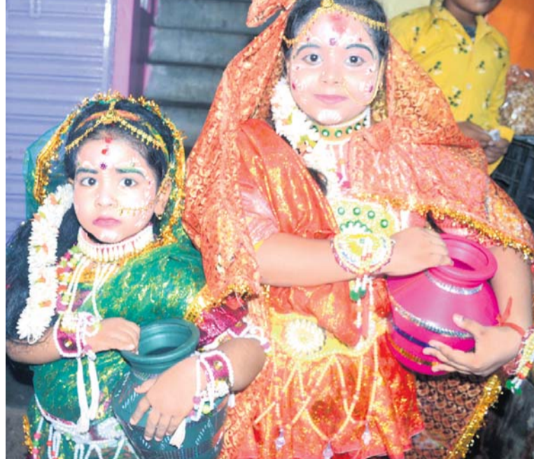
ଶିଶୁଙ୍କ ରାଧା ବେଶ।

ସାହିରେ ଶ୍ରୀରାମ ରଥ, ଚନ୍ଦ୍ର ଶେଖର ମନ୍ଦିର ସାହିରେ ବୀର ହନୁମାନ ରଥ, ଶଙ୍ଖାରୀ ସାହିରେ ଲକ୍ଷ୍ମଣ ରଥ, ଜେମାଦେଇ ପେଣ୍ଠ ସାହିରେ ଜଗନ୍ନାଥ ରଥ ଓ ପୁରୁଣା ବ୍ରହ୍ମପୁର ସାହିରେ ମହାବୀର କର୍ଣ୍ଣ ଏହି ୬ ରଥକୁ ଉନ୍ମୋଚନ କରିଥିଲେ । ଏଥିସହ ମା' ରଥକୁ ଉନ୍ମୋଚନ ନିମନ୍ତେ ଆସିବା ସମୟରେ ପ୍ରତି ସାହିରେ ମହିଳାମାନେ ହଳଦୀ ପାଣିରେ ପାଦ ଧୋଇଥିଲେ । ଶେଷରେ ମା' ଖାଣ୍ଡା ସାହି ହୋଇ ବଡ଼ ବଜାର ଦେଇ ନଡ଼ିଆ ବଜାର ହୋଇ ଦେଶା ବେହେରା ସାହି ଅଗ୍ରାୟା ମଣ୍ଡପରେ ପହଞ୍ଚିଥିଲେ । ଅଗ୍ରାୟା ମଣ୍ଡପରେ ମା'ଙ୍କୁ ଆଳତି ସହ ବାଜଭୋଗ କରାଯାଇଥିଲା ।