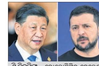
ଶି ଜିନ୍‌ପିଙ୍ଗ୍ ଭୋଲୋଡିମିର ଜେଲେନ୍‌ସ୍କି

ଆକ୍ରମଣକୁ ଚାଇନା ସମାଲୋଚନା କରିବା ପରିବର୍ତ୍ତେ ନିରାପେକ୍ଷ ରହିବାକୁ ଉଚିତ ମଣିଥିଲା। ନିକଟରେ ଜିନ୍‌ପିଙ୍ଗ୍ ମଧ୍ୟେ ଗପୁକରି ଉଠିଥିବା ରାଷ୍ଟ୍ରପତି ଭାବରେ ପୂର୍ବଦକ୍ଷ ସହ ଆଲୋଚନା କରିଥିଲେ। ଗତ ଫେବୃଆରୀରେ ଚାଇନା ଅଧିକାରୀ ଓ ଶାନ୍ତି ଆଲୋଚନା ପାଇଁ ପ୍ରସ୍ତାବ ଦେଇଥିଲା।