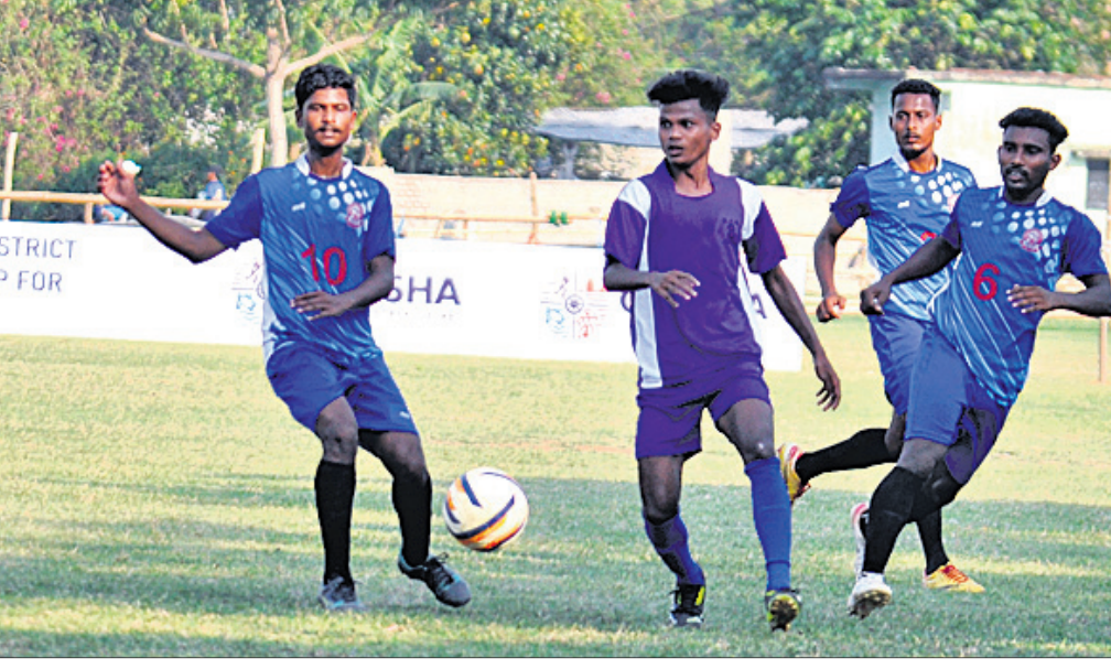
ପାରାଦୀପ ଓ ଝାରସୁଗୁଡ଼ା ମଧ୍ୟରେ ଅନୁଷ୍ଠିତ ମ୍ୟାଚ।