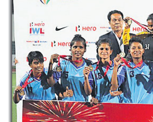
୨୦୧୭-୧୮ ବିଜନ ଚାମ୍ପିୟନ ରାଇଜିଂ ଷ୍ଟୁଡେଣ୍ଟ୍ସ କ୍ଲବ୍ ଦଳ

ମଦୁରାଇର ଦଳ ସେଥି ଚାମ୍ପିୟନ ହୋଇଥିବା ବେଳେ ବିଗତ ଦୁଇ ବର୍ଷ ଧରି ଗୋକୁଳମ୍ କେରଳ ଚାଲଚଳ ବଜାୟ ରଖିଛି ।