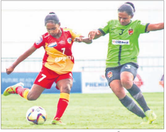
ଇଣ୍ଡିଆନ ଓମେନ୍ସ ଲିଗ୍ରେ ଗୋକୁଳମ୍ କେରଳ ମଧ୍ୟରେ ଅନୁଷ୍ଠିତ ମ୍ୟାଚ୍ ।

ଇଣ୍ଡିଆ ଗାଲ୍ ଅର୍ଥାତ୍ ୯+୫ ମିନିଟ୍‌ରେ ଅଣ୍ଟି ଏକ ଗୋଲ ଦେଇ ଷୋର୍ଟ୍ସ ଓଡ଼ିଶାକୁ ବିଜୟୀ କରିଥିଲେ । ଷୋର୍ଟ୍ସ ଓଡ଼ିଶା ଏହାର ପରବର୍ତ୍ତୀ ମ୍ୟାଚ୍ ଗୋକୁଳମ୍ କେରଳ ଏସ୍ ଏଫ୍ ସହିତ ଖେଳିବ । ପ୍ରଥମ ଦିବସରେ ଅନୁଷ୍ଠିତ ଅନ୍ୟ ମ୍ୟାଚ୍ ଗୁଡ଼ିକ ମଧ୍ୟରେ ଗ୍ରାସ୍‌ସୁଡିଆରେ ଗୋକୁଳମ୍ କେରଳ ୮-୨ ଗୋଲରେ ଇଣ୍ଡିଆନ ଓମେନ୍ସ ଏସ୍ ଏଫ୍ ନିୟାକା ପୁଲାଇଟେଟ୍ ଏସ୍ ଏଫ୍ ୨-୦ରେ ମାତା ଗୁଣ୍ଡା ଫୁଟବଲ କ୍ଲବ୍‌କୁ ପରାସ୍ତ କରିଛି । ସେହିପରି ଶାହିବାଗ୍ ପୋଲିସ୍ ଷ୍ଟାଡ଼ିୟମରେ ଅନୁଷ୍ଠିତ ଅନ୍ୟ ଏକ ମ୍ୟାଚ୍‌ରେ ମୁମ୍ବାଇ ନାଗର୍ସ୍ ଏସ୍ ଏଫ୍ ୧-୦ ଗୋଲରେ କାହାଣୀ ଫୁଟବଲ କ୍ଲବ୍‌କୁ ହରାଇ ଦେଇଛି ।