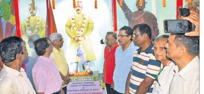
ଆଇଡିଆଇରେ ଉନ୍ମୋଚିତ ହୋଇଥିବା କୃଷ୍ଣଚନ୍ଦ୍ର ଗଜପତିଙ୍କ ସ୍ତ୍ରୀ ପ୍ରତିମୂର୍ତ୍ତି।