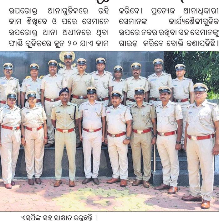
ଏସ୍ପିଙ୍କ ସହ ସାକ୍ଷାତ କରୁଛନ୍ତି ।