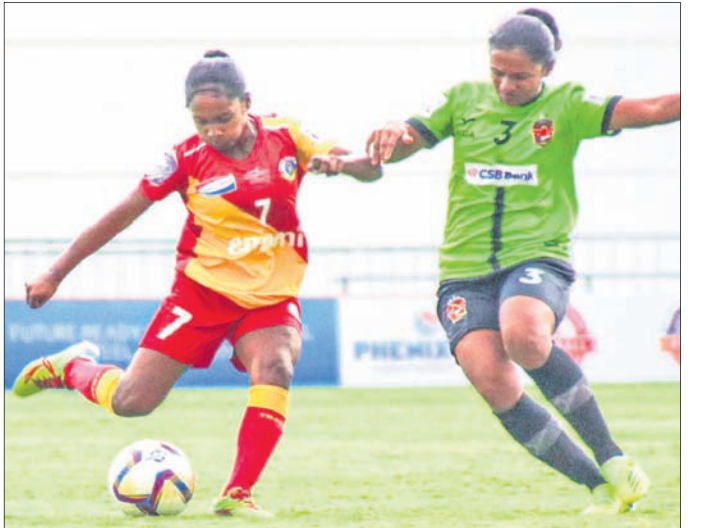
ଲକ୍ଷ୍ମବେଙ୍ଗାଲ୍ ଓ ଗୋକୁଳମ୍ କେରଳ ମଧ୍ୟରେ ଅନୁଷ୍ଠିତ ମ୍ୟାଚ୍ ।

ଲକ୍ଷ୍ମି ଗାଙ୍ଗୁ ଅର୍ଥାତ୍ ୯୦+୫ ମିନିଟ୍‌ରେ ଅଷ୍ଟି ଏକ ଗୋଲ ଦେଇ ଷ୍ଟୋର୍ଟ୍ସ ଓଡ଼ିଶାକୁ ବିଜୟୀ କରିଥିଲେ । ଷ୍ଟୋର୍ଟ୍ସ ଓଡ଼ିଶା ଏହାର ପରବର୍ତ୍ତୀ ମ୍ୟାଚ୍ ଗୋକୁଳମ୍ କେରଳ ଏପସି ସହିତ ଖେଳିବ । ପ୍ରଥମ ଦିବସରେ ଅନୁଷ୍ଠିତ ଅନ୍ୟ ମ୍ୟାଚ୍ ଗୁଡ଼ିକ ମଧ୍ୟରେ ଗ୍ରାସ୍‌ସ୍‌ଡିଆରେ ଗୋକୁଳମ୍ କେରଳ ୮-୨ ଗୋଲରେ ଲକ୍ଷ୍ମବେଙ୍ଗାଲ୍ ଏପସିକୁ ଏବଂ ମିସାକା ପୁଲାଇଟେଟ୍ ଏପସି ୨-୦ରେ ମାତା ରୁକ୍ମିଣୀ ଫୁଟବଲ କ୍ଲବ୍‌କୁ ପରାସ୍ତ କରିଛି । ସେହିପରି ଶାହିବାଗ୍ ପୋଲିସ୍ ଷ୍ଟାଡ଼ିୟମରେ ଅନୁଷ୍ଠିତ ଅନ୍ୟ ଏକ ମ୍ୟାଚ୍‌ରେ ମୁମ୍ବାଇ ନାଗର୍ସ୍ ଏପସି ୧-୦ ଗୋଲରେ କାହାଣୀ ଫୁଟବଲ କ୍ଲବ୍‌କୁ ହରାଇ ଦେଇଛି ।