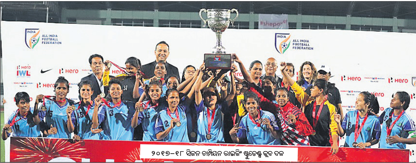
୨୦୧୭-୧୮ ବିଜନ ଚାମ୍ପିୟନ ରାଇଜିଂ ଷ୍ଟୁଡେଣ୍ଟ୍ସ କ୍ଲବ୍ ଦଳ

ରେକର୍ଡ ଟୁର୍ନାମେଣ୍ଟର ସଫଳତମ ଦଳ ଭାବରେ ଗୋକୁଳମ୍ କେରଳ ଦୁଇଥର ଚାମ୍ପିୟନ ଆଖ୍ୟା ଅର୍ଜନ କରିଛି । ଅନ୍ୟପକ୍ଷରେ ଇଣ୍ଡିଆନ ଷ୍ଟୋର୍ଟ୍ସ କ୍ଲବ୍, ରାଇଜିଂ ଷ୍ଟୁଡେଣ୍ଟ୍ସ କ୍ଲବ୍ ଓ ସେଥି ଅରେ ଲେଖାଏ ଚାମ୍ପିୟନ ଓ ରନର ଅପ୍ ରହିଛନ୍ତି । ଏହି ଟୁର୍ନାମେଣ୍ଟରେ ସର୍ବାଧିକ