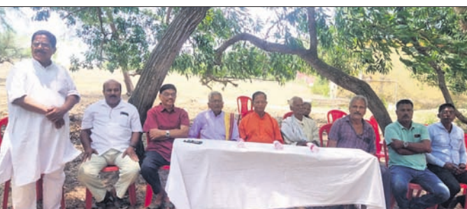
ଖବରଦାତା ସମିତିର ପୁରାତନ ଛାତ୍ର ସଂଘ ପକ୍ଷରୁ ଅଭିଯୋଗ କରାଯାଇଛି।

କୋଣାର୍କ ବସ୍ତୁଶୁଦ୍ଧି ନିକଟ ରାଜକପାଟଣାସ୍ଥିତ ବର୍ତ୍ତମାନ ପରିଚାଳନା ପ୍ରକଳ୍ପ ବେଆଇନ ନିର୍ମାଣ ଉପରେ ସିଦ୍ଧି ଲାଭ (ସିଦ୍ଧି ଲାଭ ଡିଭିଜନ) ନିମାପତ୍ର ଉପରେ କାର୍ଯ୍ୟ ଜାରି କରିଛନ୍ତି। ଫଳରେ ଏହି ପ୍ରକଳ୍ପ ଅନୁଷ୍ଠିତ ଭିତରକୁ ଚାଲିଯାଇଛି। ଘରଣା ଅନୁଯାୟୀ, ଜନଗଣସୂଚୀ ସ୍ଥାନରେ ଏହି ବର୍ତ୍ତମାନ ପରିଚାଳନା ପ୍ରକଳ୍ପ ନ କରିବାକୁ ବହୁଦିନ ବିଚାର କରି ଅଧିକାରୀ ଏହି ଜମି ଉପରେ ଦେଖି ନିମାପତ୍ର ବିଚାର ଶେଷ ପର୍ଯ୍ୟନ୍ତ ସ୍ଥିତାବସ୍ଥା ରଖାଯିବା ପାଇଁ ପକ୍ଷମାନଙ୍କୁ ଗତ ୧୭ ତାରିଖରେ ନିର୍ଦ୍ଦେଶ ଦେଇଥିବା ଜଣାପଡ଼ିଛି। ଫଳରେ ବେଆଇନ ସ୍ଥାନୀୟ ଲୋକଙ୍କ ମଧ୍ୟରେ ଆଶ୍ୱସ୍ତି ଖେଳିଯାଇଛି।