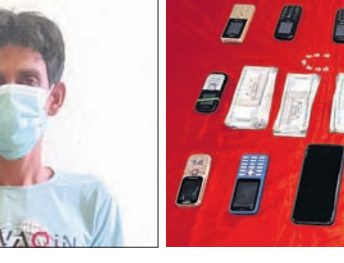
ଜବତ ଟଙ୍କା ଏବଂ ସାମଗ୍ରୀ।

ନେଇ ସାଇବର ଥାନାରେ ଏକ କେସ୍ (ନଂ.୮/୨୦୨୩) ରୁକ୍ତକରାଯାଇଥିଲା। ନୁପତ୍ ଭିଡିଓ କଲ୍ କରିଆରେ ତାଙ୍କୁ ମୁକ୍ତକେଲି କରାଯାଇଥିଲା। ଏହାକୁ ପ୍ରଫୁଲ୍ଲ କରିବାର ଭୟ ଦେଖାଇ ତାଙ୍କଠାରୁ ବିଭିନ୍ନ ସମୟରେ ୮ ଲକ୍ଷ ୫୮ ହଜାର ୭୫୨ ଟଙ୍କା ଲୁଚି ନିଆଯାଇଥିବା ସେ ଅଭିଯୋଗ କରିଥିଲେ। ଅଭିଯୋଗ ଅନୁସାରେ, ଗତ ମାର୍ଚ୍ଚ