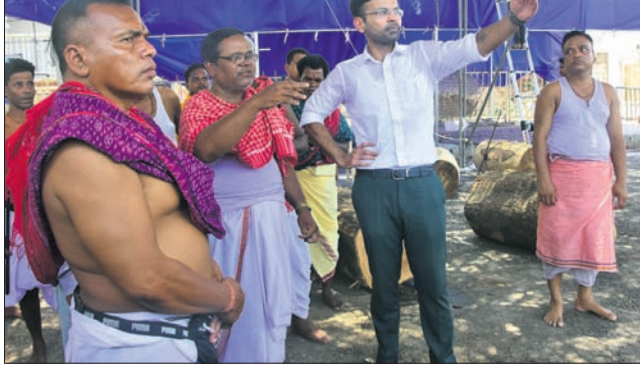
ମହାରଣା ସେବକମାନଙ୍କ ସହ ଜିଲାପାଳ ସମର୍ଥନ ଦର୍ଶାଇ ଆଲୋଚନା କରୁଛନ୍ତି।