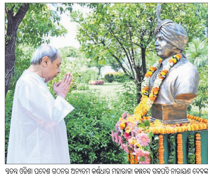
ସ୍ୱତନ୍ତ୍ର ଓଡ଼ିଶା ପ୍ରଦେଶ ଗଠନ ଅନ୍ୟତମ କର୍ମଧାରୀ ମହାରାଜା କୃଷ୍ଣଚନ୍ଦ୍ର ଗଜପତି ନାରାୟଣ ଦେବଙ୍କ ଜନ୍ମଦିନରେ ତାଙ୍କ ପ୍ରତିମୂର୍ତ୍ତିରେ ପୁଷ୍ପମାଲ୍ୟ ଅର୍ପଣ କରୁଛନ୍ତି ମୁଖ୍ୟମନ୍ତ୍ରୀ ନବୀନ ପଟ୍ଟନାୟକ।