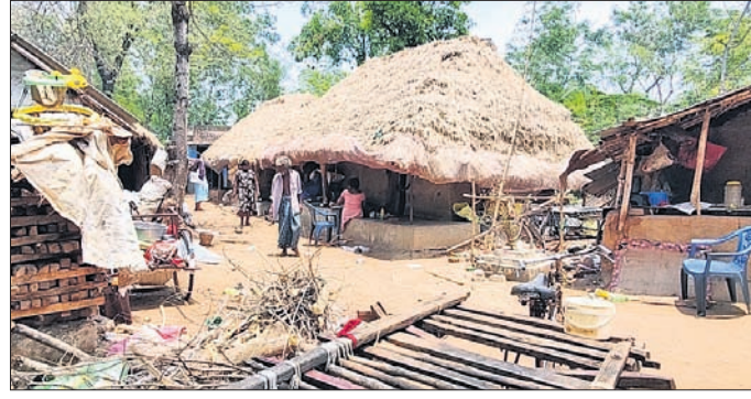
ବ୍ୟାସନଗର ଗାଆଁ କୃଷ୍ଣ କଲୋନି।

ଅଭିଧାନ ଏବଂ ଉପଯୁକ୍ତ ଚିକିତ୍ସା ଅଭାବ କୃଷ୍ଣରୋଗୀଙ୍କ ଜୀବନକୁ ଦୁର୍ଭିକ୍ଷ କରିଛି। ସମାଜରୁ ଏକ ପ୍ରକାର ବାସନ୍ଦହୋଇ ସେମାନେ ଅନାବାଦୀ, ଜଙ୍ଗଲ ଜମି, ରେଳଲାଇନ କଡ଼ରେ ଅକର୍ମଣ୍ୟ ଅବସ୍ଥାରେ ଜୀବନ ବିତାଉଛନ୍ତି। ଗତ ପ୍ରାୟ ୫ ବର୍ଷ ହେବ କୃଷ୍ଣରୋଗୀମାନଙ୍କୁ ସ୍ୱତନ୍ତ୍ର ସ୍ଥାନରେ ବସତି ବ୍ୟବସ୍ଥା କରିବାକୁ ସରକାର ପ୍ରତିଶ୍ରୁତି ଦେଇଆସୁଛନ୍ତି। କିନ୍ତୁ ବସତି ତ ଦୂରର କଥା ସେମାନଙ୍କ କର୍ତ୍ତବ୍ୟତା ହାତ, ଗୋଡ଼, ଆଙ୍ଗୁଠି ଆଦି ଅଙ୍ଗପ୍ରାପ୍ତଙ୍କର ରିକନଷ୍ଟ୍ରକ୍ଚର୍ ସର୍ଜରି(ଆରସିଏସ୍) ବ୍ୟବସ୍ଥା ନୈରାଶ୍ୟଜନକ ହୋଇଛି।