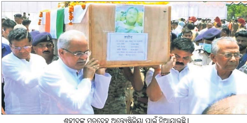
ଶହୀଦଙ୍କ ମୃତଦେହ ଅନ୍ତ୍ୟେଷ୍ଟିକ୍ରିୟା ପାଇଁ ନିଆଯାଇଛି।

ଛତିଶଗଡ଼ର ଅରଣ୍ୟପୁର ଥାନା ଅଞ୍ଚଳରେ ରୁଧିରା ମାଓବାଦୀଙ୍କ ବୋମା ବିସ୍ଫୋରଣରେ ୧୦ ଜଣ ଯବାନଙ୍କ ସହ ଜଣେ ଡ୍ରାଲଭର ଶହୀଦ ହୋଇଥିଲେ। ରୁଧିରା ଶହୀଦ ମାନଙ୍କୁ ଶ୍ରଦ୍ଧାଞ୍ଜଳି ପ୍ରଦାନ ସହ ସମାଧି ଦିଆଯାଇଛି। ଛତିଶଗଡ଼ ମୁଖ୍ୟମନ୍ତ୍ରୀ ଭୂତପଣ ବଦେଲଙ୍କ ସହ ବହୁ ମନ୍ତ୍ରୀ, ଜନ ପ୍ରତିନିଧି ଶହୀଦଙ୍କୁ ଶ୍ରଦ୍ଧାଞ୍ଜଳି ଜଣାଇ ଶୋକବ୍ୟକ୍ତ କରିଛନ୍ତି। ତେବେ ଶହୀଦ ଯବାନଙ୍କ ଏହି ବଳିଦାନକୁ ବୃଥା ହେବାକୁ ଦିଆଯିବ ନାହିଁ। ଆଗାମୀ ଦିନରେ ଏହାର କଡ଼ା ଜବାବ ଦେବା ସହ ମାଓବାଦୀ ଦମନ ଅଭିଯାନକୁ ଆହୁରି ଜୋରଦାର କରାଯିବ ବୋଲି ବଦେଲ କହିଛନ୍ତି। ଏହି ଘଟଣାକୁ ନେଇ ଓଡ଼ିଶା ମୁଖ୍ୟମନ୍ତ୍ରୀ ନବୀନ ପଟ୍ଟନାୟକ ମଧ୍ୟ ଶୋକବ୍ୟକ୍ତ କରିଛନ୍ତି। ସେ ଶହୀଦଙ୍କ ପରିବାରକୁ ସମବେଦନା ଜଣାଇଛନ୍ତି। ଅନ୍ୟପକ୍ଷରେ ଶହୀଦମାନଙ୍କ ମୃତଦେହ ସେମାନଙ୍କ