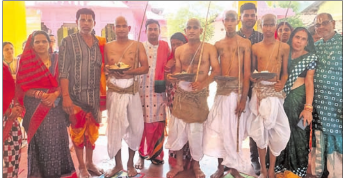
ସାମୂହିକ ବ୍ରତୋପନୟନ କାର୍ଯ୍ୟକ୍ରମ ।