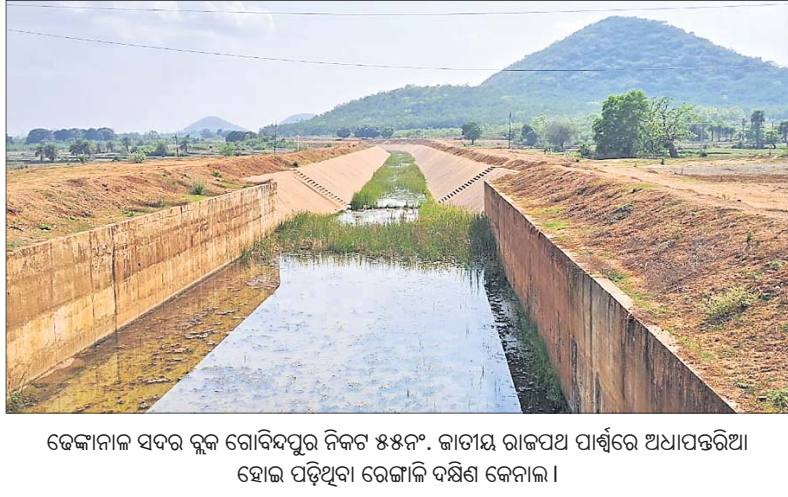
ଢେଙ୍କାନାଳ ସଦର ବ୍ଲକ ଗୋବିନ୍ଦପୁର ନିକଟ ୫୫୮୯. କାମାୟ ରାଜପଥ ପାର୍ଶ୍ୱରେ ଅଧାପଡ଼ିଆ ହୋଇ ପଡ଼ିଥିବା ରେଙ୍ଗାଳି ଦକ୍ଷିଣ କେନାଲ।

ଅନୁଗୋଳ, ଢେଙ୍କାନାଳ, ଯାଜପୁର ଓ କଟକ ଜିଲାର ଚାଷୀଙ୍କ ଭାଗ୍ୟ ବଦଳିବ। କମିରେ ପହଞ୍ଚିବ ଜଳ। ପଡ଼ିଆ ପଡୁଥିବା କ୍ଷେତରେ ବର୍ଷସାରା ଫଳିବ ସୁନାର ଫସଲ। ଏଭଳି ମହତ୍ତ୍ୱ ଲକ୍ଷ୍ୟ ରଖି ୨୮ ବର୍ଷ ତଳେ ଆରମ୍ଭ ହୋଇଥିଲା ରେଙ୍ଗାଳି ଦକ୍ଷିଣ କେନାଲ ବୃହତ୍ ଜଳସେଚନ ପ୍ରକଳ୍ପ। ପାଖାପାଖି ତିନି ଦଶନ୍ଧି ମଧ୍ୟରେ ଏହି ସ୍ୱପ୍ନର ପ୍ରୋଜେକ୍ଟକୁ ପୂର୍ଣ୍ଣାଙ୍ଗ ରୂପ ଦେବାରେ ବ୍ୟୟ ଅଟକଳ ୭୩୮୭ ୨୯୫୨ କୋଟିରେ ପହଞ୍ଚିଲାଣି। ହେଲେ ଦୁର୍ନୀତି, ଦୂରଦୃଷ୍ଟି ଅଭାବ ଏବଂ ନିମ୍ନମାନର କାମ ପାଇଁ ୪ କିଲୋବାଟା ବହୁ ପ୍ରତୀକ୍ଷିତ ଏହି ସ୍ୱପ୍ନର ପ୍ରକଳ୍ପ ଏବେ ବି ଅଧୁରା ରହିଛି।