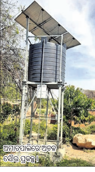
ଅନାପପାଲିରେ ଅଟଳ ସୌର ପ୍ରକଳ୍ପ।

ପୁରସ୍ତୁର ଜିଲ୍ଲା ବୀରମହାରାଜପୁର ଜିଲ୍ଲା ଅନ୍ତର୍ଗତ କେନଡ଼ିଆପାଲି ପଞ୍ଚାୟତର ଅନାପପାଲି ଗ୍ରାମରେ ଦୀର୍ଘ ୧୫ଦିନ ହେଲା ସୋଲାର ଜଳ ପ୍ରକଳ୍ପ ଅଟଳ ହୋଇ ପଡ଼ିଛି। ଫଳରେ ଗ୍ରାମରେ ଦେଖାଦେଇଛି ପାନୀୟ ଜଳ ସଙ୍କଟ। ଅନାପପାଲି ଗ୍ରାମ ପଞ୍ଚାୟତର ଗୋଟିଏ ଖାର୍ଡି ବିଶିଷ୍ଟ ଗ୍ରାମ। ଗ୍ରାମରେ ୬୦-୮୦ ପରିବାର ବସବାସ କରନ୍ତି। ଗ୍ରାମର ଲୋକେ ଗ୍ରାମରେ ଥିବା ପୋଖରୀ ଓ ନଳକୂପଗୁଡ଼ିକ ଉପରେ ନିର୍ଭର କରନ୍ତି। ସଂପ୍ରତି ଗ୍ରୀଷ୍ମ ପ୍ରବାହ ଯୋଗୁ ଗ୍ରାମର ଜଳାଶୟ ଓ ପୋଖରୀଗୁଡ଼ିକ ଶୁଖି ଯାଇଛି। ଏପରି କି ଗ୍ରାମରେ ଥିବା ନଳକୂପଗୁଡ଼ିକ ମଧ୍ୟରୁ କେତେକ ନଳକୂପ ଆବଶ୍ୟକ ଠାରୁ