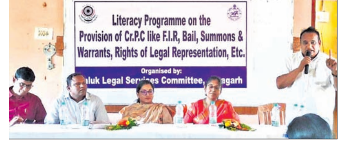
ବନ୍ଧାକୂତ୍ରା କର୍ତ୍ତବ୍ୟରେ ଅନୁଷ୍ଠିତ ଆଇନ ସଚେତନତା ଶିବିର ।