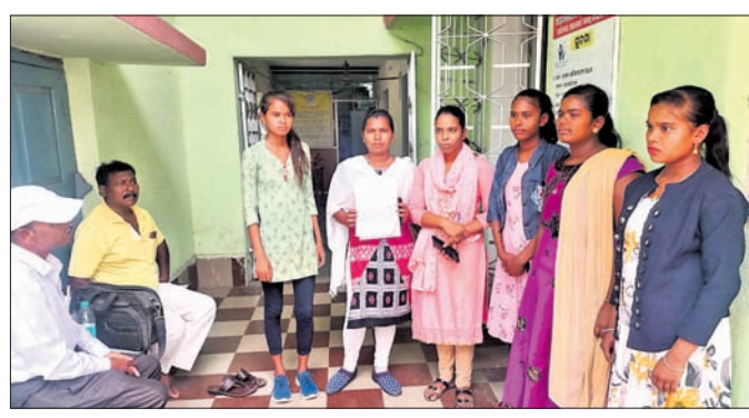
କରଜାକତା ଜିଲ୍ଲା ସମାଜ ମଙ୍ଗଳ କାର୍ଯ୍ୟକ୍ରମରେ କିଶୋରୀମାନେ ଅଦ୍ୱିକା କାର୍ଯ୍ୟକ୍ରମ କାର୍ଯ୍ୟକାରୀ ହେଉ ନ ଥିବା ନେଇ ଅଭିଯୋଗ କରୁଛନ୍ତି ।

୧୦ରୁ ୧୯ ବର୍ଷ ବୟସ କିଶୋରୀମାନଙ୍କ ସମ୍ପର୍କରେ ଲକ୍ଷ୍ୟ ନେଇ ରାଜ୍ୟ ସରକାର ସ୍ୱତନ୍ତ୍ର ଅଦ୍ୱିକା କାର୍ଯ୍ୟକ୍ରମ କାର୍ଯ୍ୟକାରୀ କରିଛନ୍ତି ।