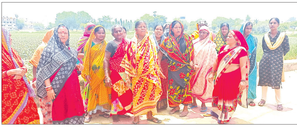
କରଜାକତା ହିତରେ ମହିଳାମାନେ ବିକ୍ଷୋଭ ପ୍ରଦର୍ଶନ କରୁଛନ୍ତି ।