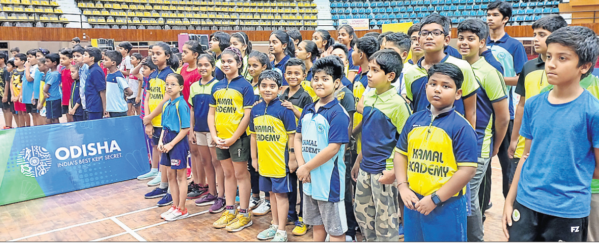
କଟକସ୍ଥିତ କବାହରଲାଲ ନେହେରୁ ଇନ୍ଡୋର ଷ୍ଟାଡିୟମରେ ଏପ୍ରିଲ ୨୭ରେ ଓଡ଼ିଶା ଗୋଲ୍ଡେନ୍ ଷ୍ଟାର୍ସ ମିନି ଓ ସବ୍-ଜୁନିୟର ରାଜ୍ୟ ରାଜ୍ୟକିଙ୍ଗ୍ ବ୍ୟାଡମିଣ୍ଟନ ଚାମ୍ପିୟନଶିପ୍ ଉଦ୍‌ଘାଟନା ବିବେଚନାରେ ଅଂଶଗ୍ରହଣକାରୀ ପ୍ରତିଯୋଗୀମାନେ।