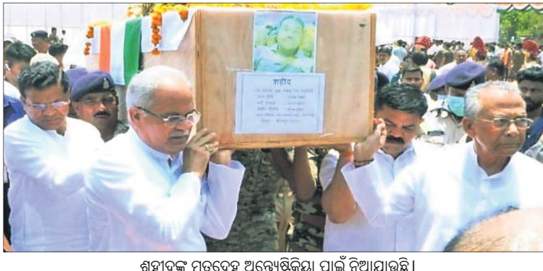
ଶହୀଦଙ୍କ ମୃତଦେହ ଅନ୍ତ୍ୟେଷ୍ଟିକ୍ରିୟା ପାଇଁ ନିଆଯାଇଛି । ଶୋଭାଯାତ୍ରାରେ ଛତିଶଗଡ଼ ମୁଖ୍ୟମନ୍ତ୍ରୀ ଭୂତପଣ ବଦେଲ ସାମିଲ ହୋଇଛନ୍ତି ।

ଛତିଶଗଡ଼ର ଅରଣପୁର ଥାନା ଅଞ୍ଚଳରେ ରୁସୁବାର ମାଓବାଦୀଙ୍କ ବୋମା ବିସ୍ଫୋରଣରେ ୧୦ ଜଣ ଯବାନଙ୍କ ସହ ଜଣେ ଡ୍ରାଇଭର ଶହୀଦ ହୋଇଥିଲେ । ରୁରୁବାର ଶହୀଦ ମାନଙ୍କୁ ଶ୍ରଦ୍ଧାଞ୍ଜଳି ପ୍ରଦାନ ସହ ସମାଧି ଦିଆଯାଇଛି । ଛତିଶଗଡ଼ ମୁଖ୍ୟମନ୍ତ୍ରୀ ଭୂତପଣ ବଦେଲଙ୍କ ସହ ବହୁ ମନ୍ତ୍ରୀ, ଜନ ପ୍ରତିନିଧି ଶହୀଦଙ୍କୁ ଶ୍ରଦ୍ଧାଞ୍ଜଳି ଜଣାଇ ଶୋକବ୍ୟକ୍ତ କରିଛନ୍ତି । ତେବେ ଶହୀଦ ଯବାନଙ୍କୁ ଏହି ବଳିଦାନକୁ ବୁଝା ହେବାକୁ ଦିଆଯିବ ନାହିଁ । ଆଗାମୀ ଦିନରେ ଏହାର କଡ଼ା ଜବାବ ଦେବା ସହ ମାଓବାଦୀ ଦମନ ଅଭିଯାନକୁ ଆହୁରି ଜୋରଦାର କରାଯିବ ବୋଲି ବୟୋଲ କହିଛନ୍ତି । ଏହି ଘଟଣାକୁ ନେଇ ଓଡ଼ିଶା ମୁଖ୍ୟମନ୍ତ୍ରୀ ନବୀନ ପଟ୍ଟନାୟକ ମଧ୍ୟ ଶୋକବ୍ୟକ୍ତ କରିଛନ୍ତି । ସେ ଶହୀଦଙ୍କ ପରିବାରକୁ ସମବେଦନା ଜଣାଇଛନ୍ତି । ଅନ୍ୟପକ୍ଷରେ ଶହୀଦମାନଙ୍କ ମୃତଦେହ ସେମାନଙ୍କ