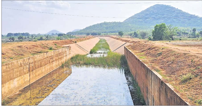
ଡେଙ୍କାନାଳ ସଦର ବ୍ଲକ ଗୋବିନ୍ଦପୁର ନିକଟ ୫୫୮୦. କାଟମାୟ ରାଜପଥ ପାର୍ଶ୍ୱରେ ଅଧାପଡ଼ିଆ ହୋଇ ପଡ଼ୁଥିବା ରେଙ୍ଗାଳି ଦକ୍ଷିଣ କେନାଲ ।

ଅନୁଗୋଳ, ଡେଙ୍କାନାଳ, ଯାଜପୁର ଓ କଟକ ଜିଲାର ଚାଷୀଙ୍କ ଭାଗ୍ୟ ବଦଳିବ। କମିରେ ପହଞ୍ଚିବ ଜଳ। ପଡ଼ିଆ ପଡ଼ୁଥିବା କ୍ଷେତରେ ବର୍ଷସାରା ଫଳିବ ସୁନାର ଫସଲ। ଏଭଳି ମହତ୍ତ୍ୱ ଲକ୍ଷ୍ୟ ରଖି ୨୮ ବର୍ଷ ତଳେ ଆରମ୍ଭ ହୋଇଥିଲା ରେଙ୍ଗାଳି ଦକ୍ଷିଣ କେନାଲ ବୃହତ୍ ଜଳସେଚନ ପ୍ରକଳ୍ପ। ପାଖାପାଖି ତିନି ଦଶନ୍ଧି ମଧ୍ୟରେ ଏହି ସ୍ୱପ୍ନର ପ୍ରୋଜେକ୍ଟକୁ ପୂର୍ଣ୍ଣାଙ୍ଗ ରୂପ ଦେବାରେ ବ୍ୟୟ ଅଟକଳ ୭୩୮୭ ୨୯୫୨ କୋଟିରେ ପହଞ୍ଚିଲାଣି। ହେଲେ ଦୁର୍ନୀତି, ଦୂରଦୃଷ୍ଟି ଅଭାବ ଏବଂ ନିମ୍ନମାନର କାମ ପାଇଁ ୪ କିଲୋବାଟାଙ୍କ ବହୁ ପ୍ରତୀକ୍ଷିତ ଏହି ସ୍ୱପ୍ନର ପ୍ରକଳ୍ପ ଏବେ ବି ଅଧୁରା ରହିଛି ।