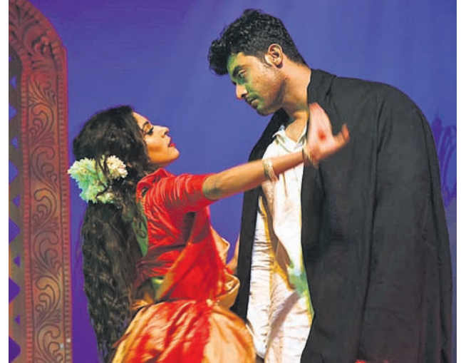
ସଙ୍ଗୀତଭିତ୍ତିକ ନାଟକ 'ଦେବଦାସ'ର ଏକ ଦୃଶ୍ୟ।

ପ୍ରଥମରେ ଅଭିନୟ ଗାଥା ପୂର୍ଣ୍ଣନା ସହ କଳାକାରଙ୍କ ଅଭିନୟ ପାଇଁ ପ୍ରତିଭା ଶ୍ରୀ ପାଠୋତ୍ସବ ଆୟୋଜିତ ହୋଇଥିଲା।