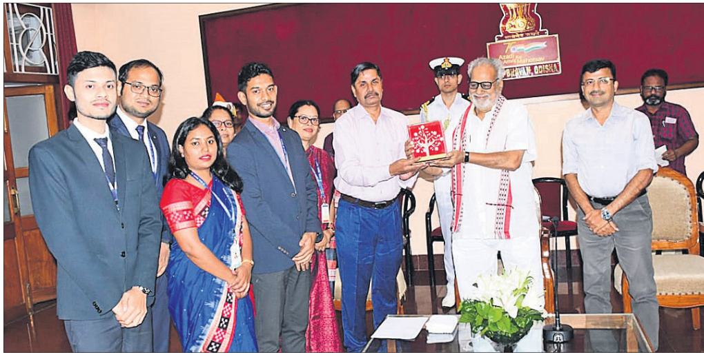
ଗୋପବନ୍ଧୁ ପ୍ରଶାସନିକ ଏକାଡେମୀରେ ପ୍ରଶିକ୍ଷଣ ନେଉଥିବା ପ୍ରଶାସନିକ ସେବା ଅଧିକାରୀମାନେ ଭାଗ୍ୟପାଳ ପ୍ରଦେଶର ଗଣେଶୀ ଲାଲକୁ ଭାଜଭବନରେ ସାକ୍ଷାତ କରୁଛନ୍ତି।

ଡାକୋଟା ବିମାନରେ ଯାଇ ସେମାନଙ୍କୁ ସ୍ୱାଗତ କରିବା ପାଇଁ ଭୁବନେଶ୍ୱର ରାଷ୍ଟ୍ରଦୂତ ଭାବେ ନିର୍ଦ୍ଧାରଣ କରାଯାଇଛି।