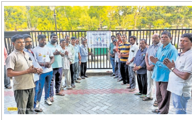
ଗୋପବନ୍ଧୁ ପ୍ରଶାସନିକ ଏକାଡେମୀରେ ପ୍ରଶିକ୍ଷଣ ନେଉଥିବା ପ୍ରଶାସନିକ ସେବା ଅଧିକାରୀମାନେ ରାଜ୍ୟପାଳଙ୍କୁ ଭେଟିବା ପାଇଁ ଭୁବନେଶ୍ୱରକୁ ଆସିଥିଲେ।

ରାଜ୍ୟପାଳଙ୍କୁ ଭେଟିବା ପାଇଁ ଭୁବନେଶ୍ୱରକୁ ଆସିଥିବା ଅଧିକାରୀମାନେ ଗୋପବନ୍ଧୁ ପ୍ରଶାସନିକ ଏକାଡେମୀରେ ପ୍ରଶିକ୍ଷଣ ନେଉଥିବା ସମ୍ବନ୍ଧରେ ସୂଚନା ଦେଇଥିଲେ।